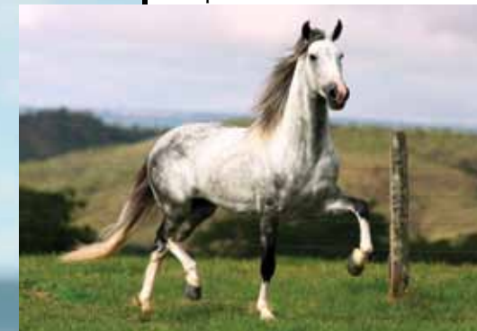
VERSAILLES DO LUMIAR