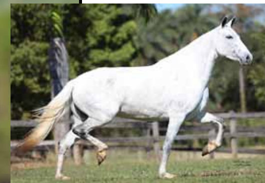
HISTÓRIA DO LUMIAR