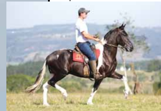
TRIUNFO DO PORTO PALMEIRA