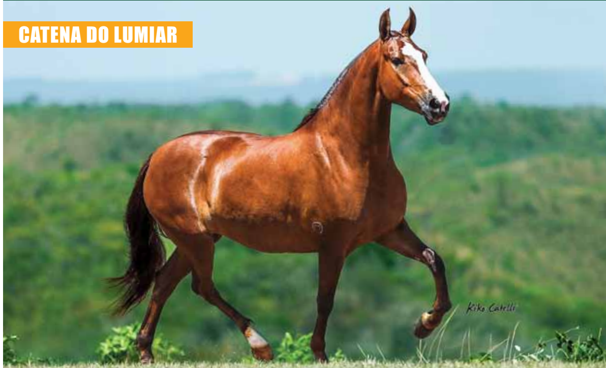
CATENA DO LUMIAR