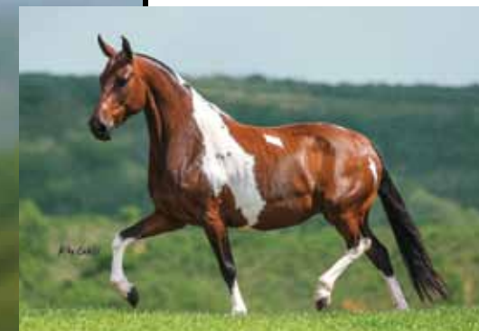
RAJADA DO YURI