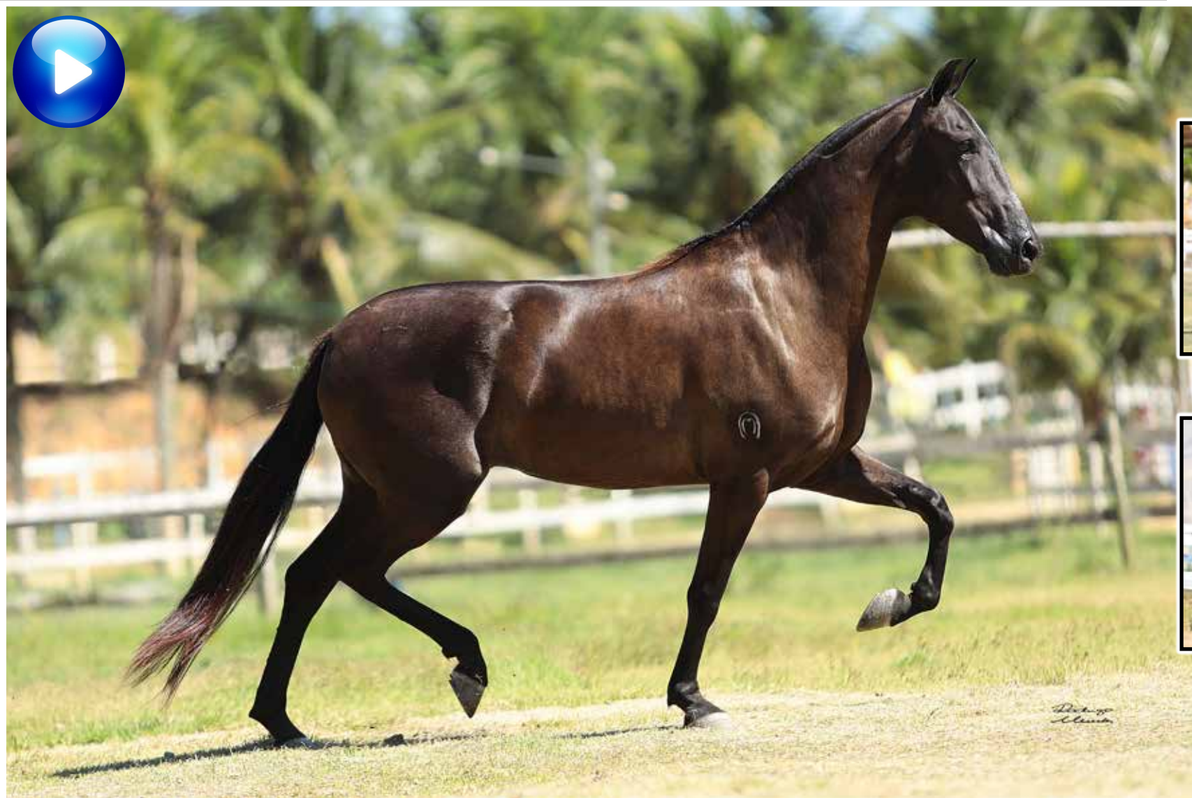
Pai, Vapor JEA