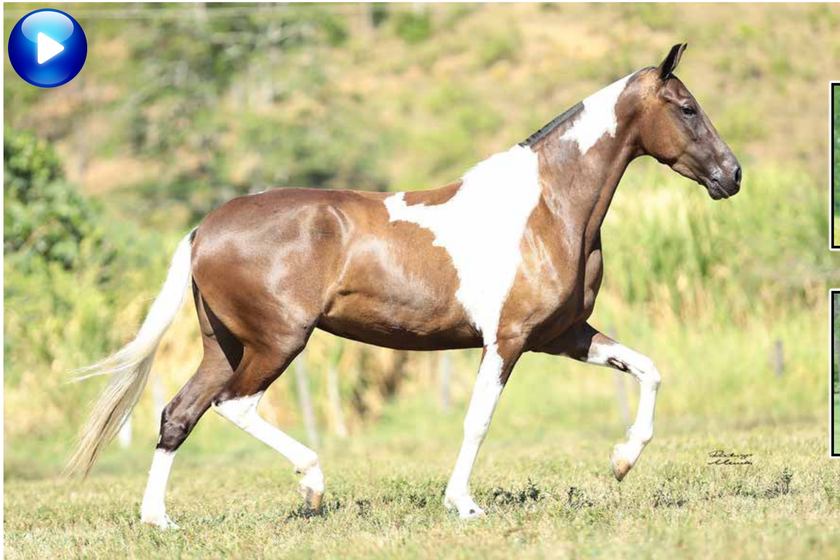
Pai, Sublime da Ogar