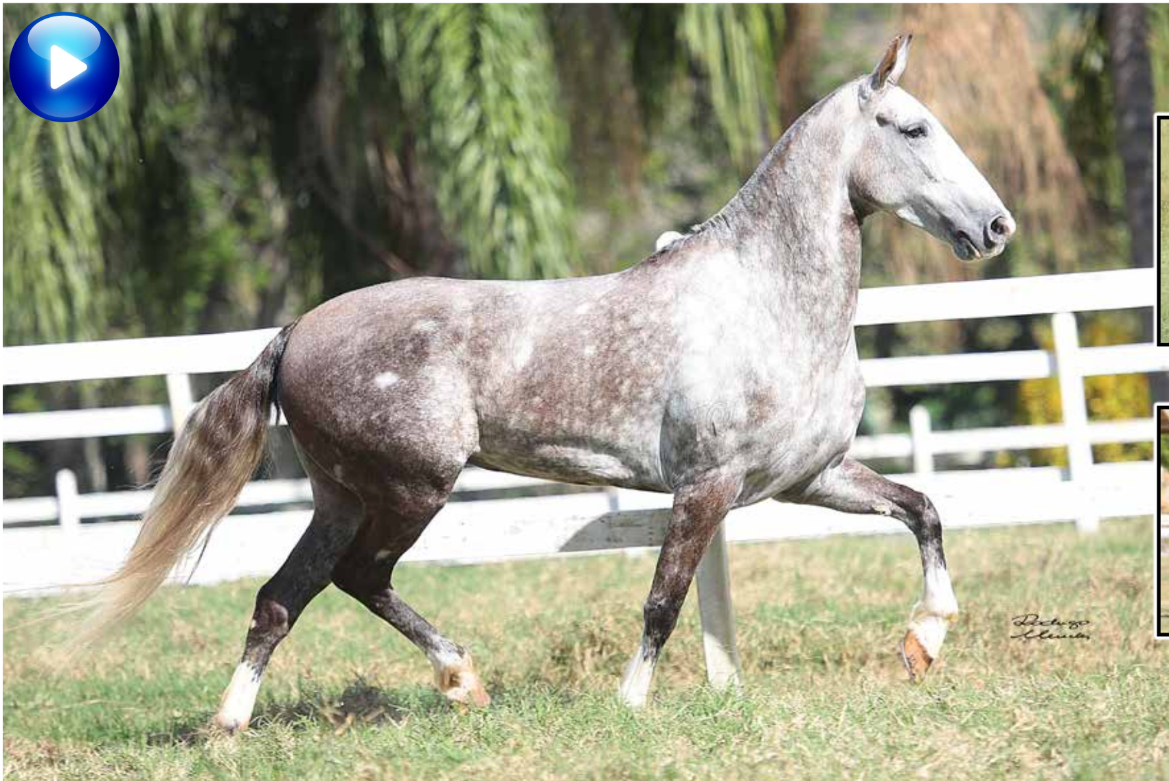
Embrião por Palhaço Bavária