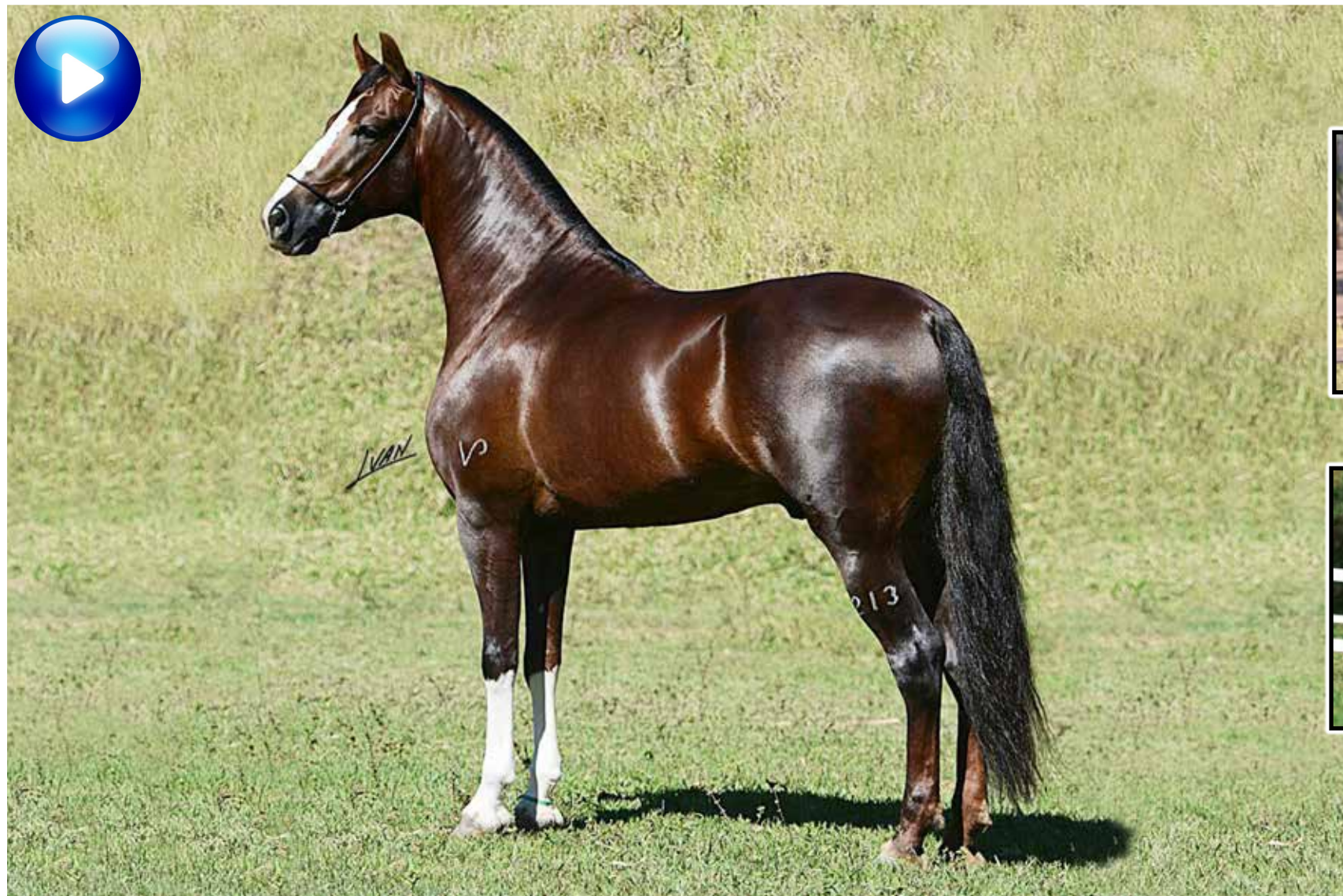
Pai, Galante do Expoente