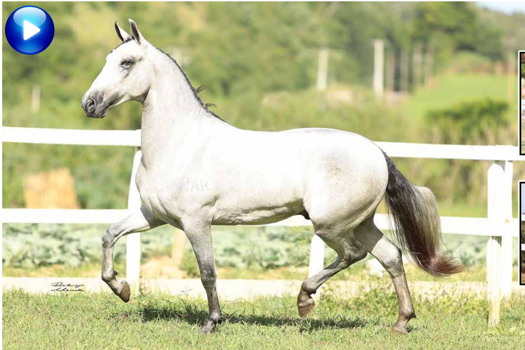
Pai, Vapor JEA