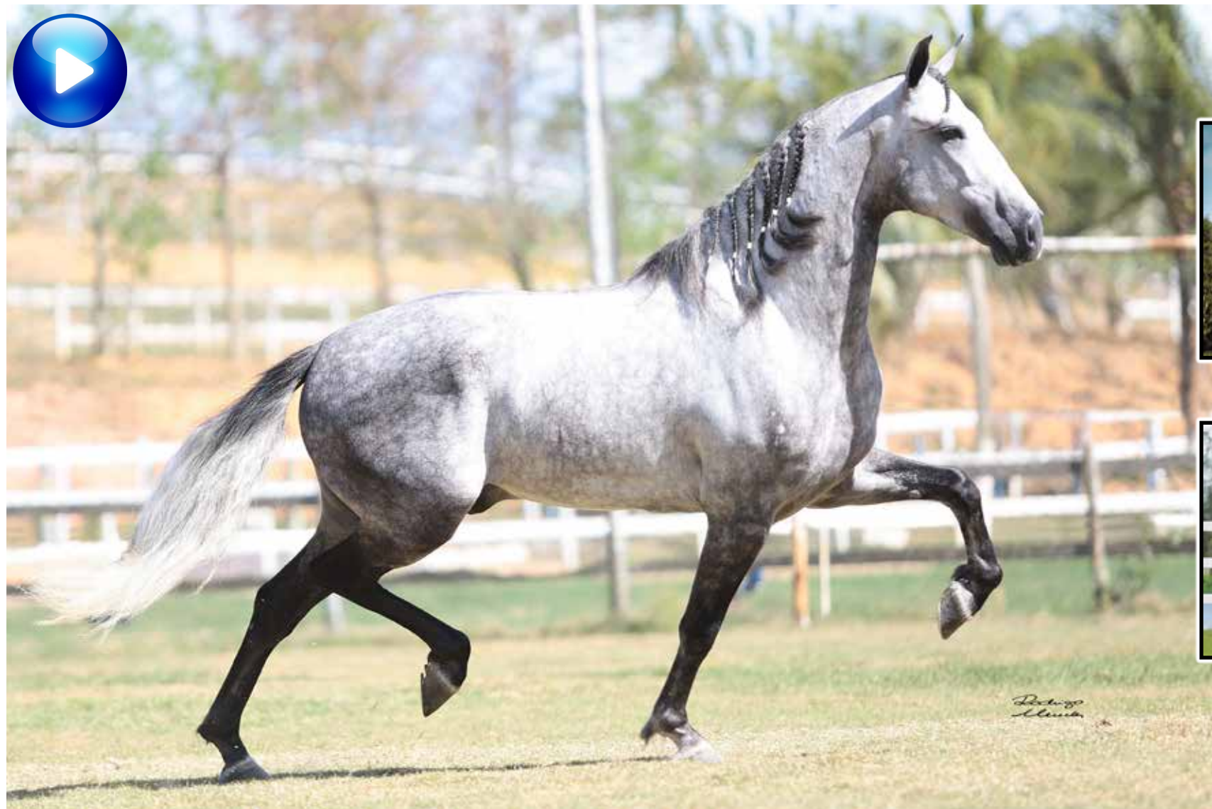
Pai, Lótus da Catimba