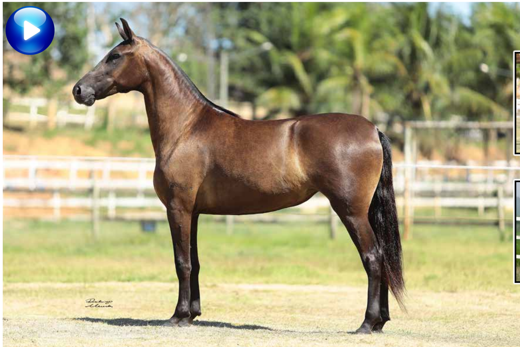
Pai, Vapor JEA