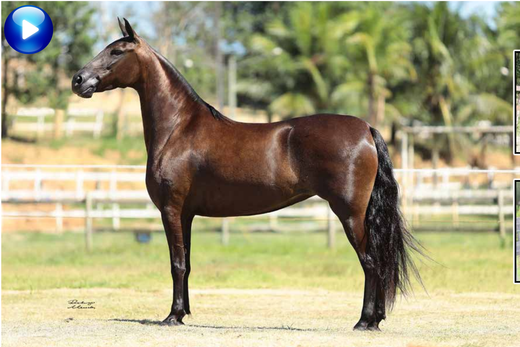
Pai, Jabuti da Mandassaia