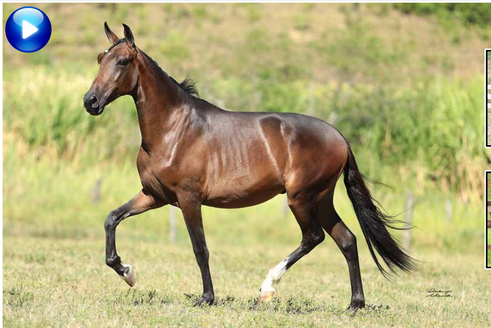
Pai, Guarítá da Seara Dourada