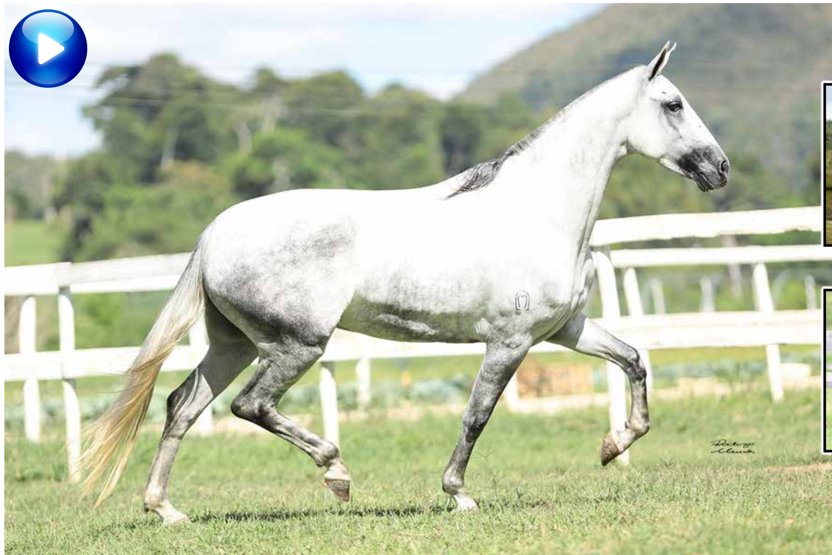
Pai, Predador M.Z.Z.