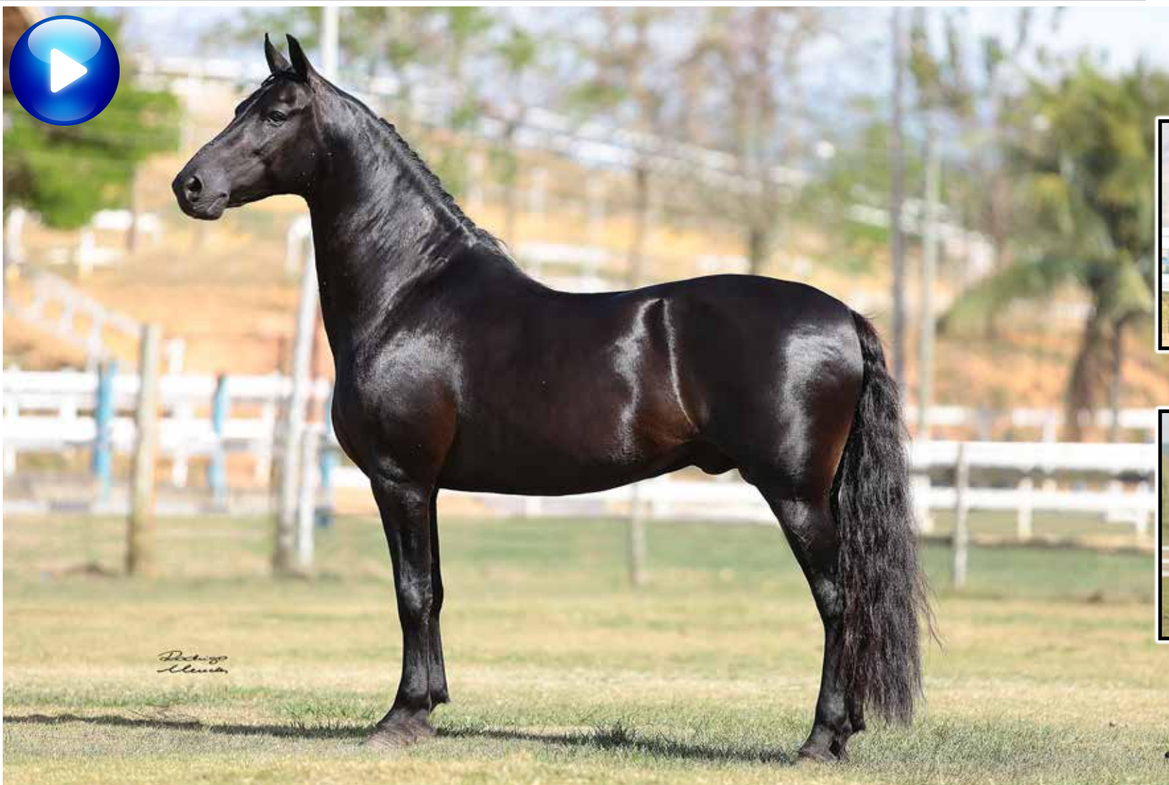
Pai, Tigrão Kafé