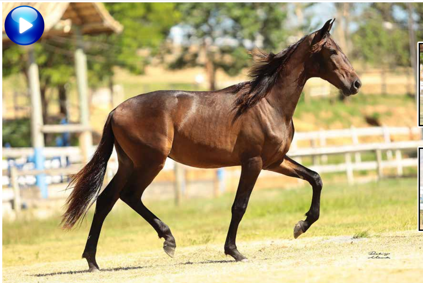
Pai, Vapor JEA