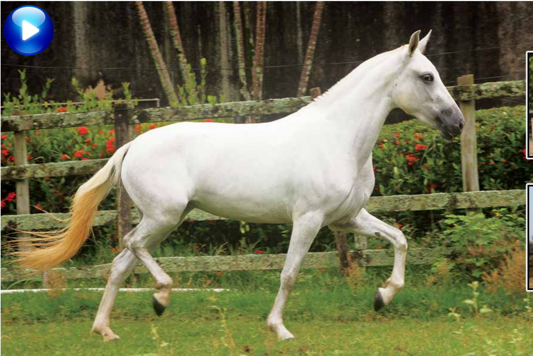
Pai, Sino do Yuri