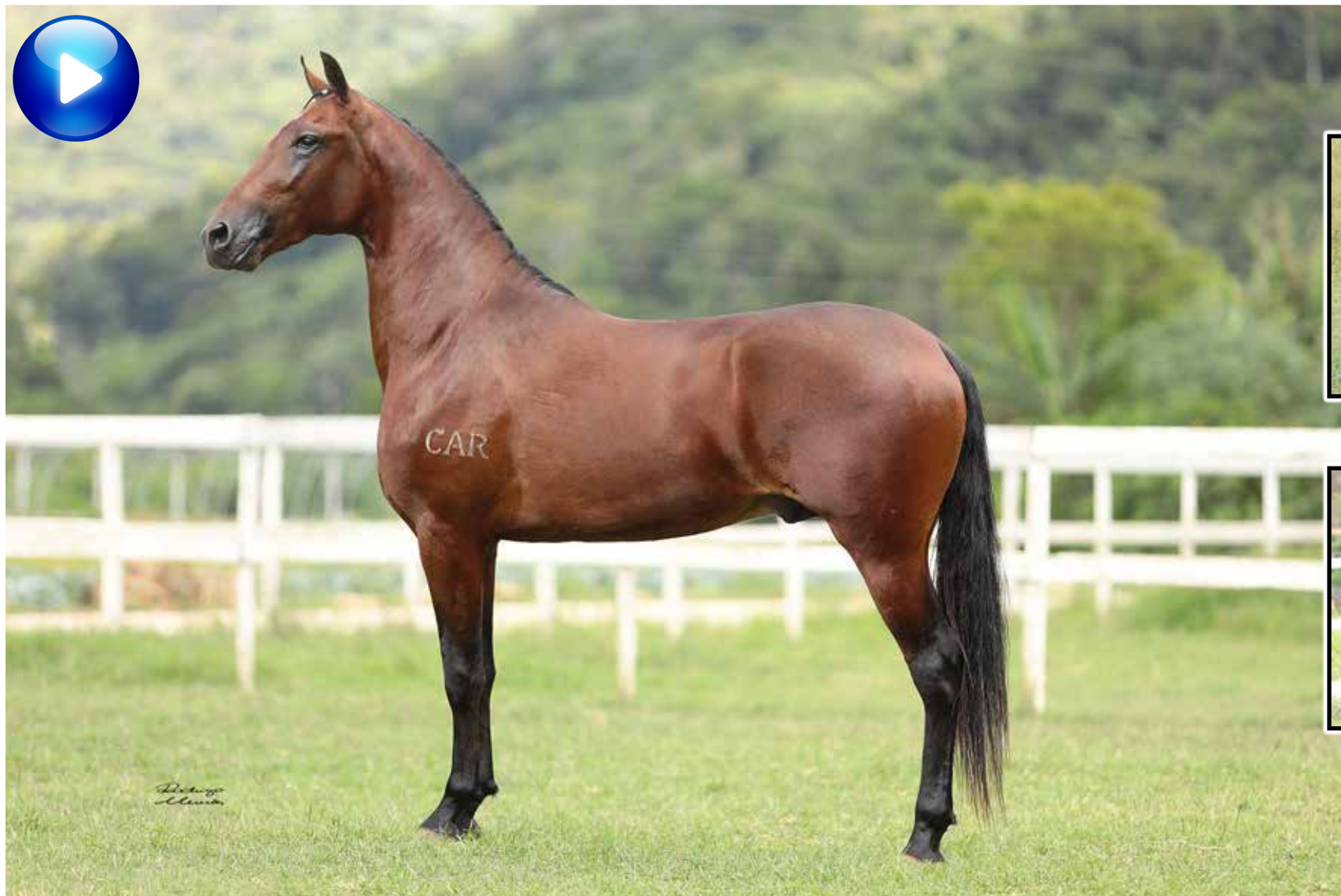
Pai, Palhaço Bavária