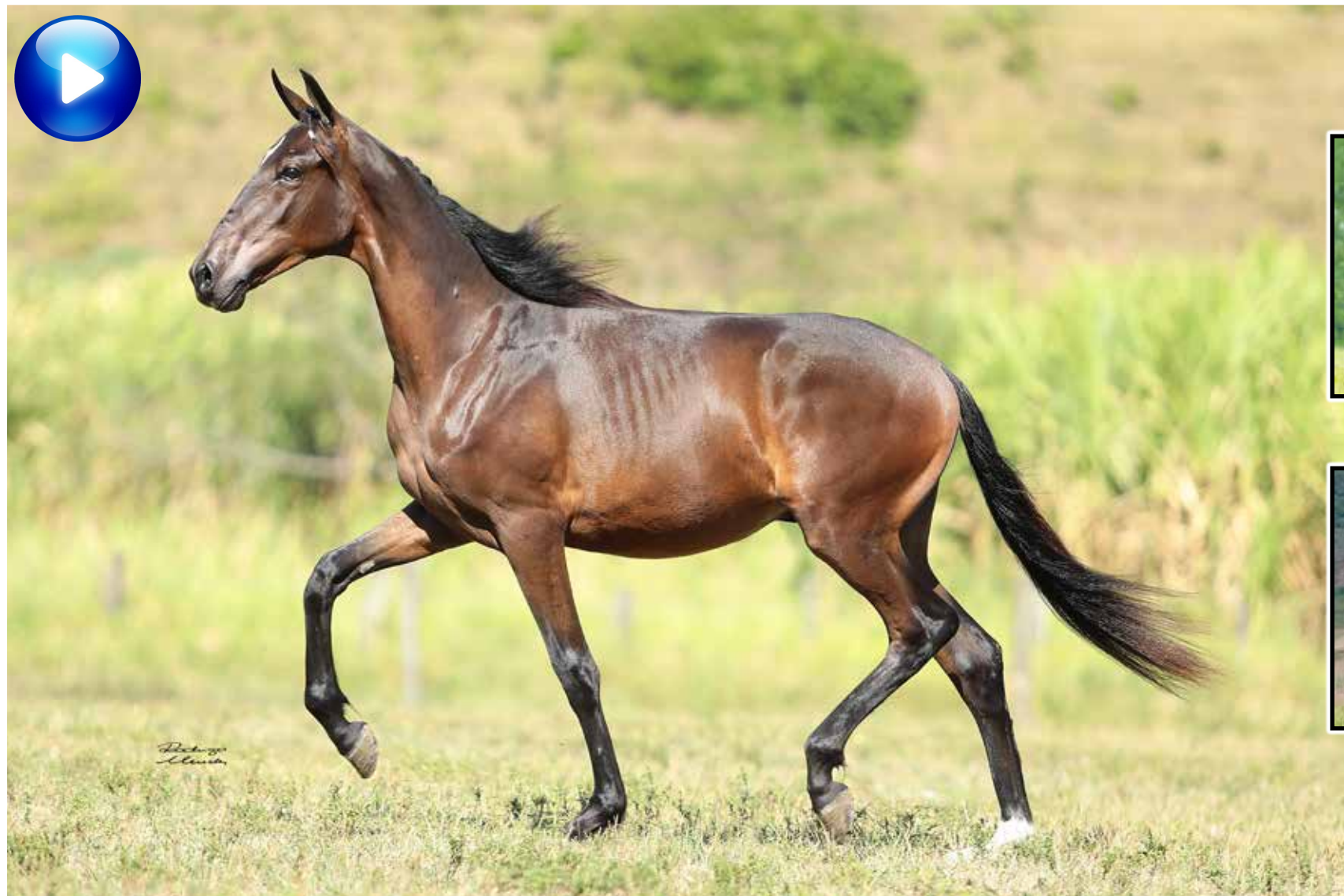
Pai, Sublime da Ogar