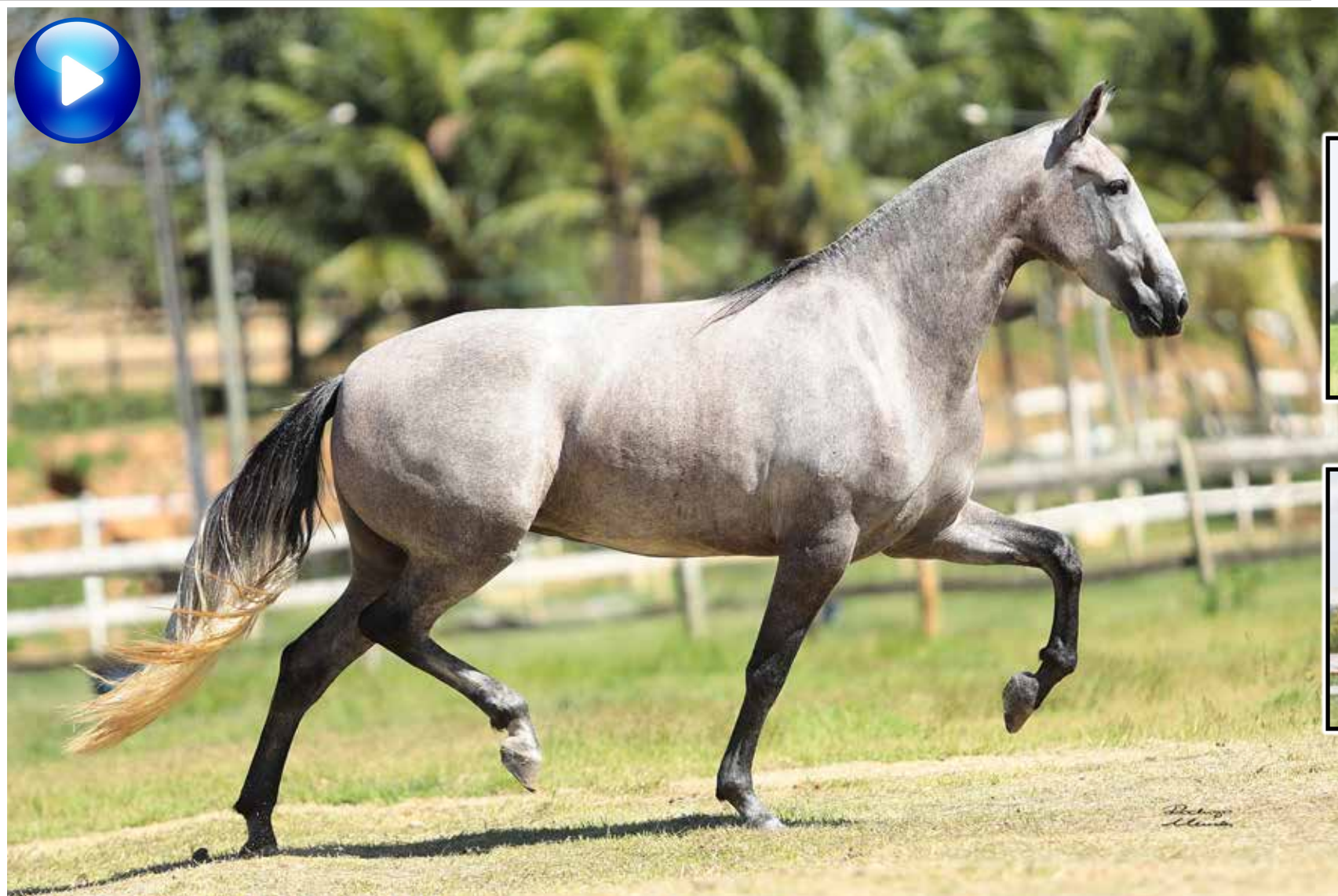
Pai, Mirante OH General