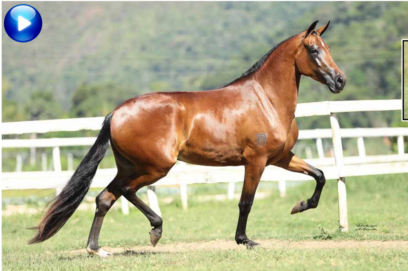
Embrião por Palhaço Bavária