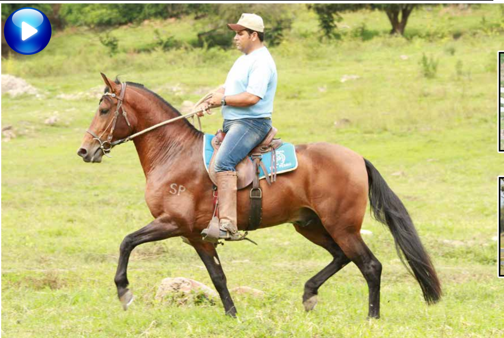
Pai, Guarítá Seara Dourada