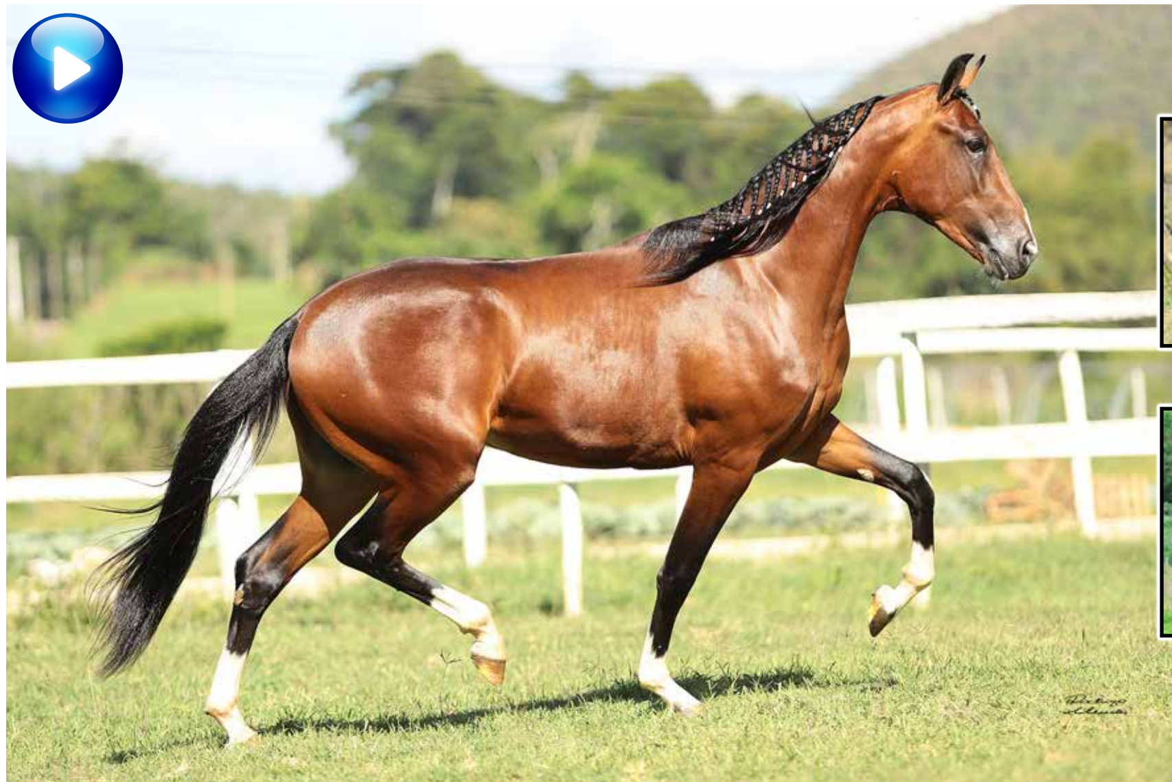
Pai, Requinte do Tucunaré