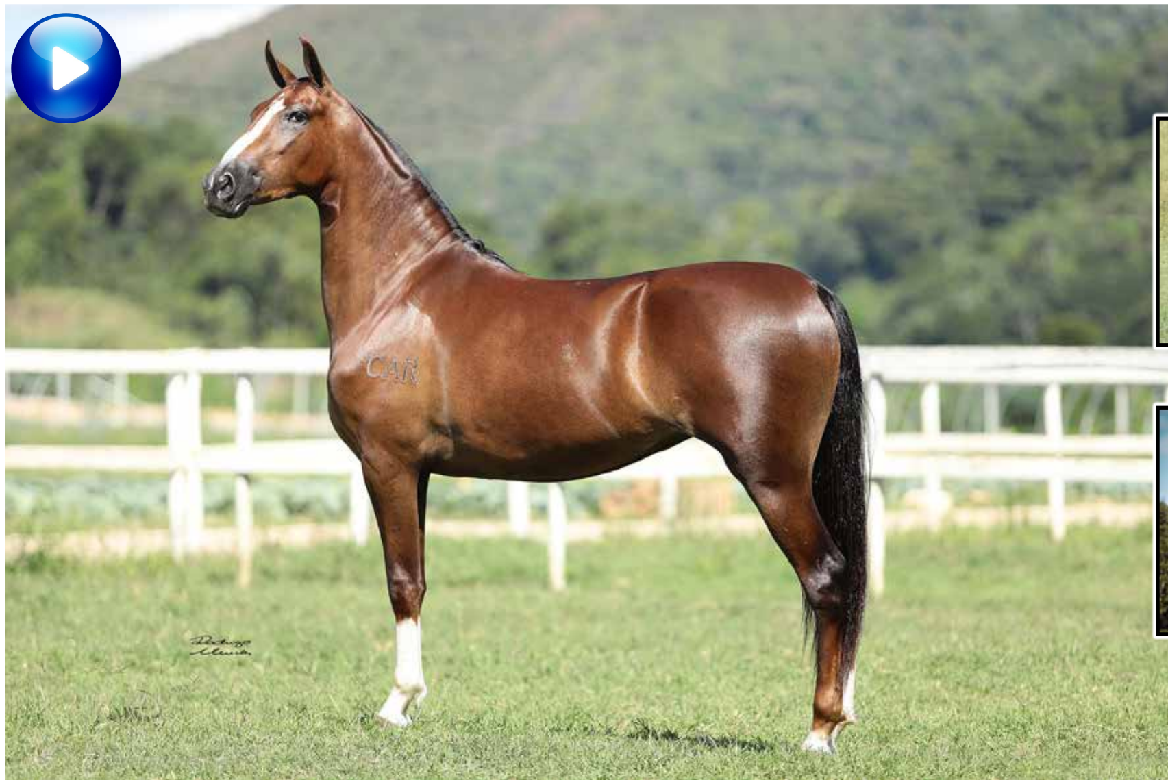
Pai, Palhaço Bavária