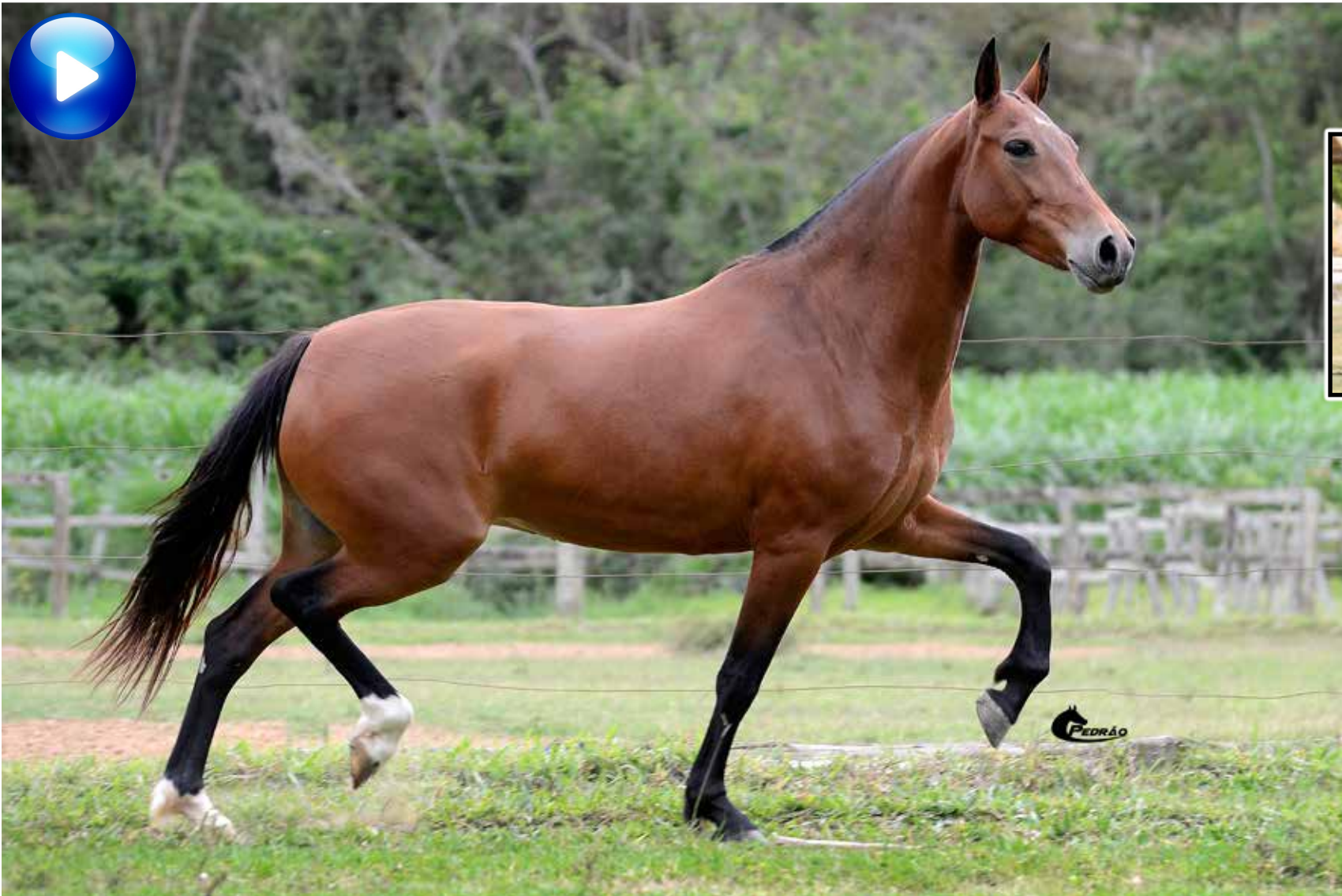
Embrião por Vapor JEA