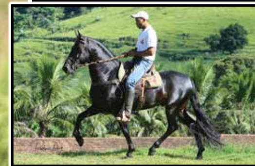
Avô paterno, Nobre de Santa Lúcia