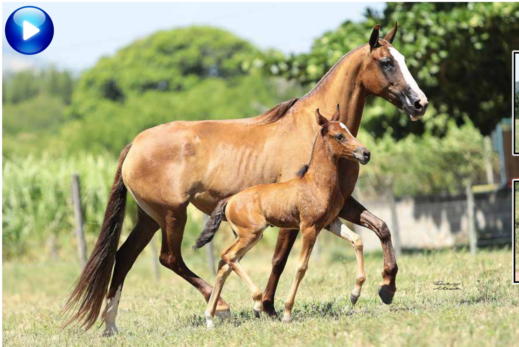
Pai, Elo Kafé da Nova