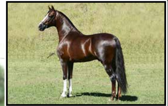
Avô paterno, Galante do Expoente