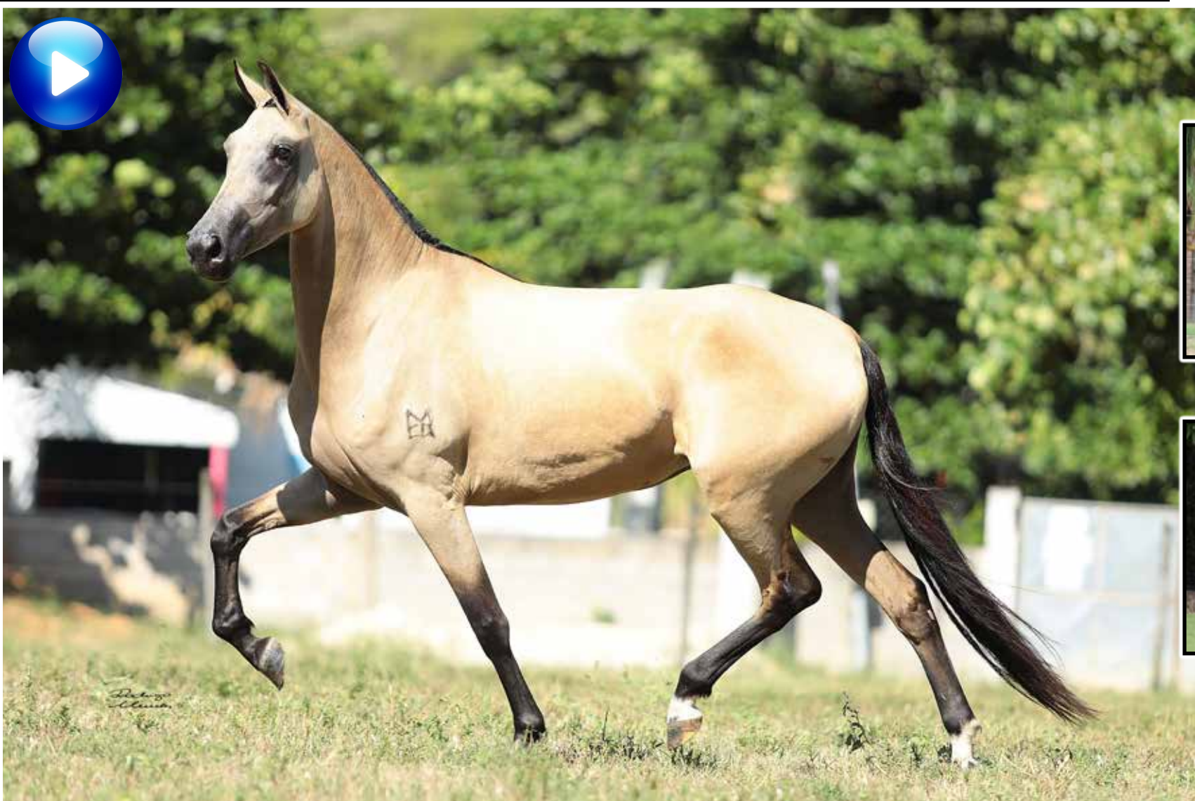
Avô paterno, Cobalto Macadu