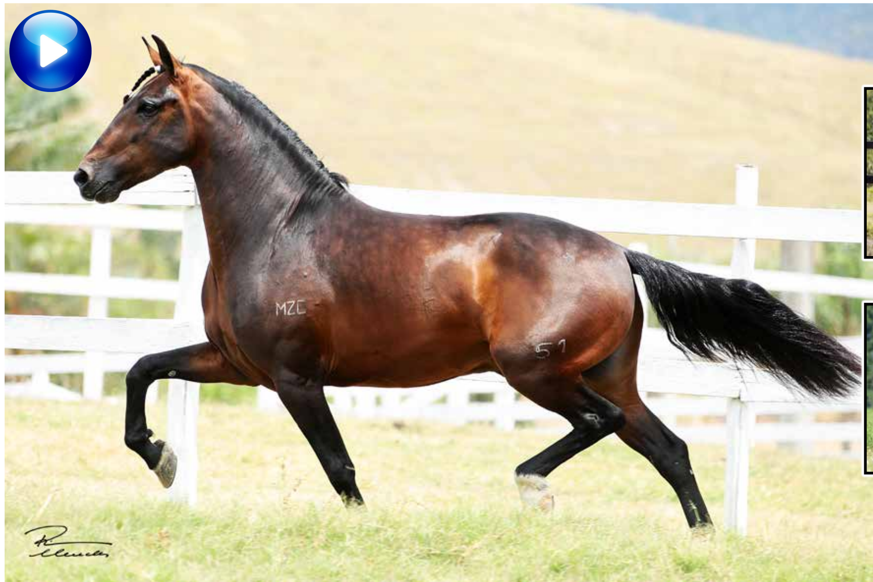
Pai, Favacho Diamante