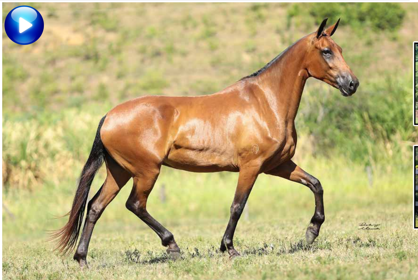
Pai, Baião São Pedro