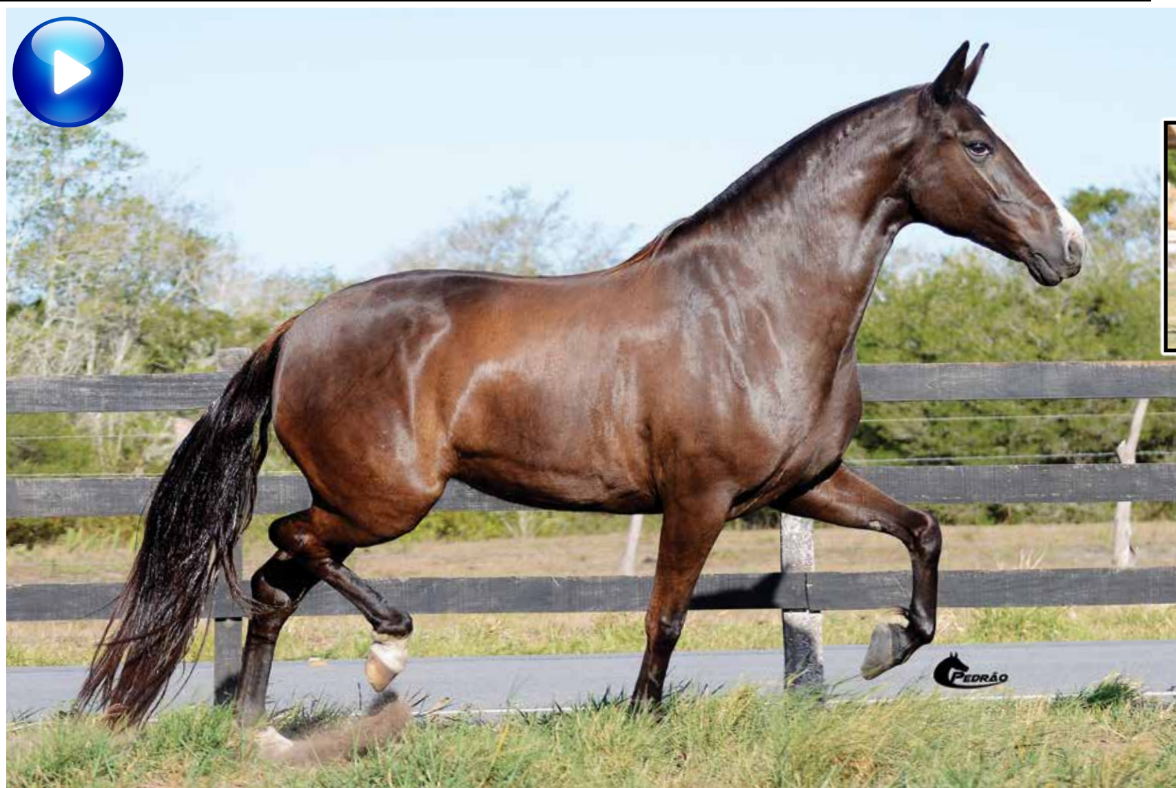
Embrião por Vapor JEA