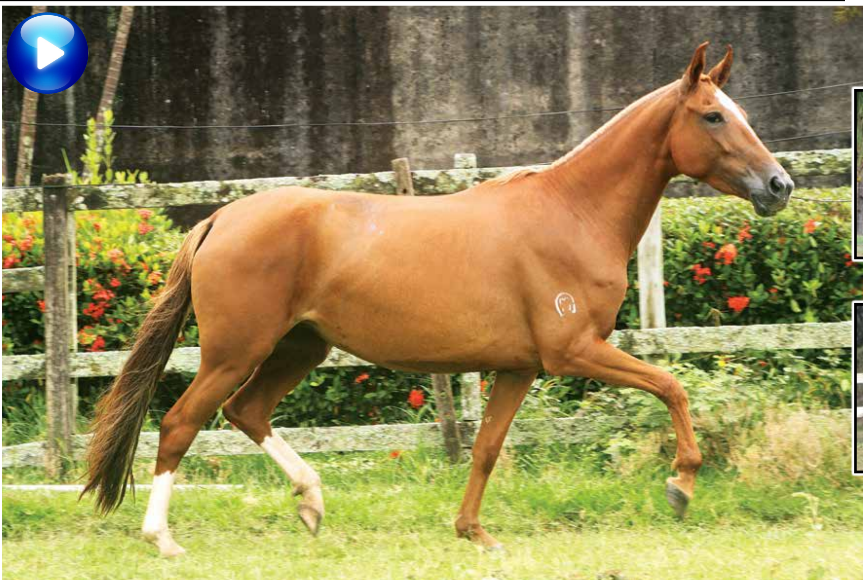
Prenhez por Cobalto Macadu