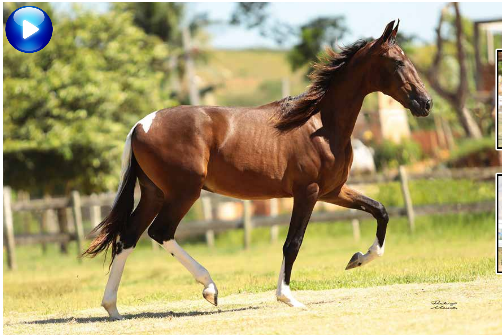
Pai, Vapor JEA