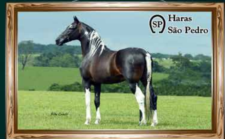
Sublime da Ogar