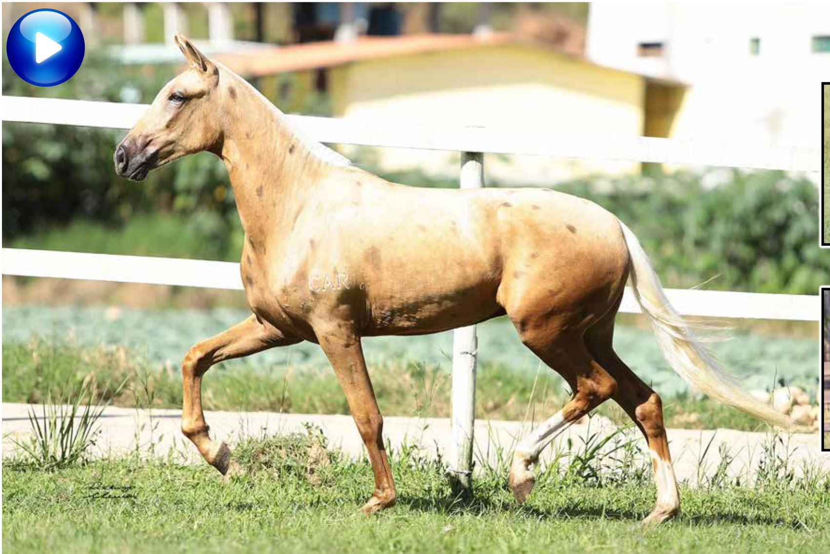
Pai, Palhaço Bavária