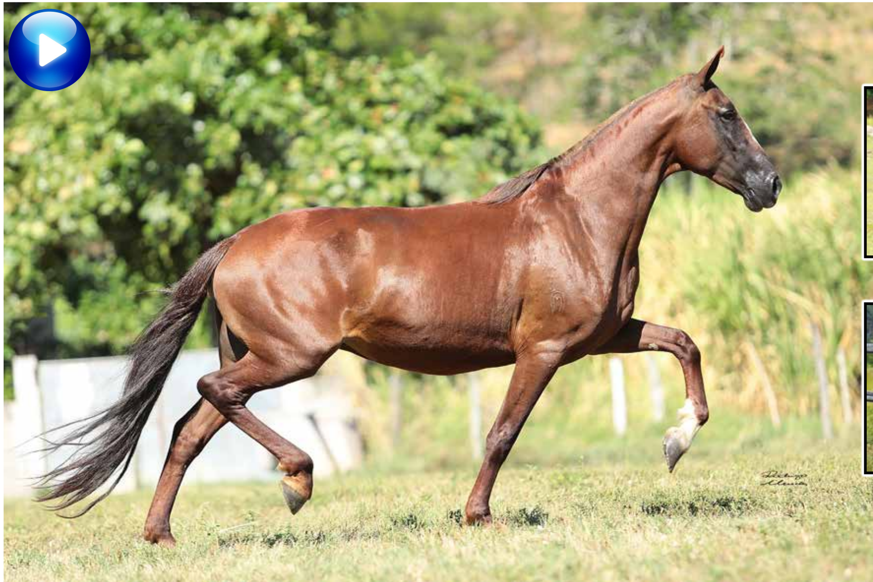
Coberta por Fado São Pedro