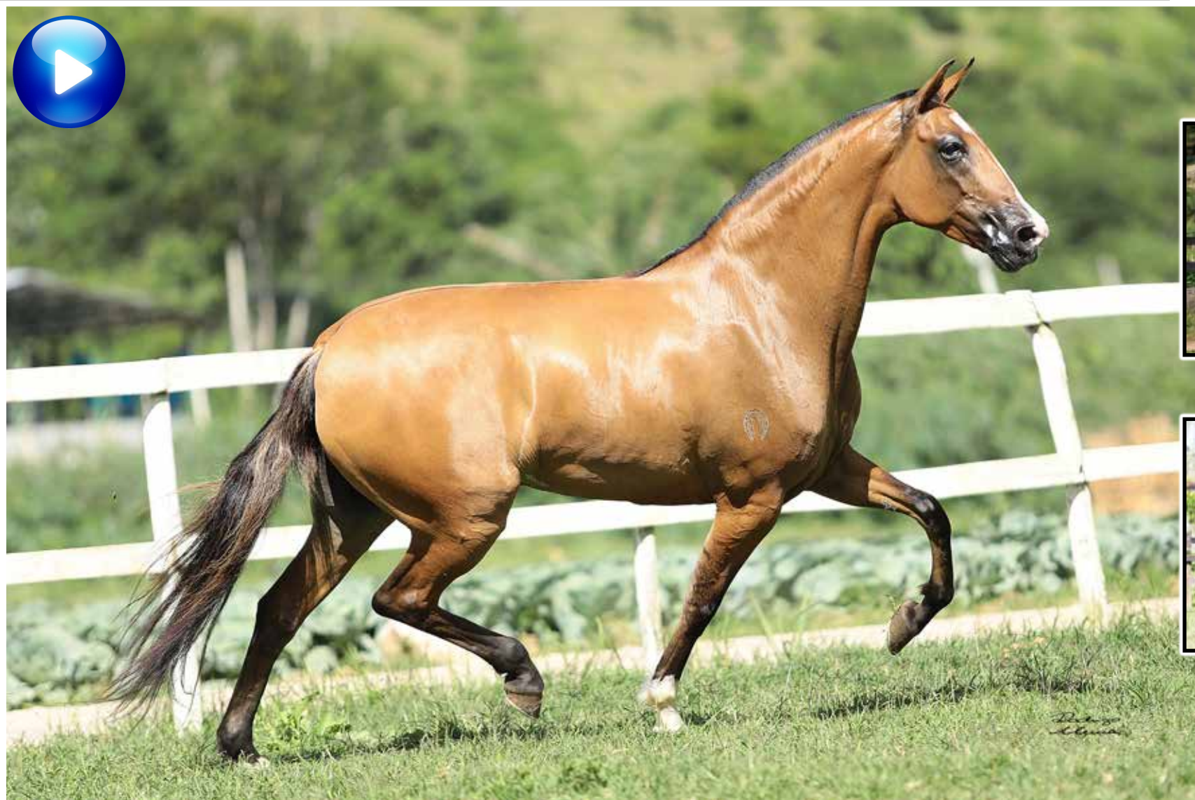
Pai, Demolidor Tandy