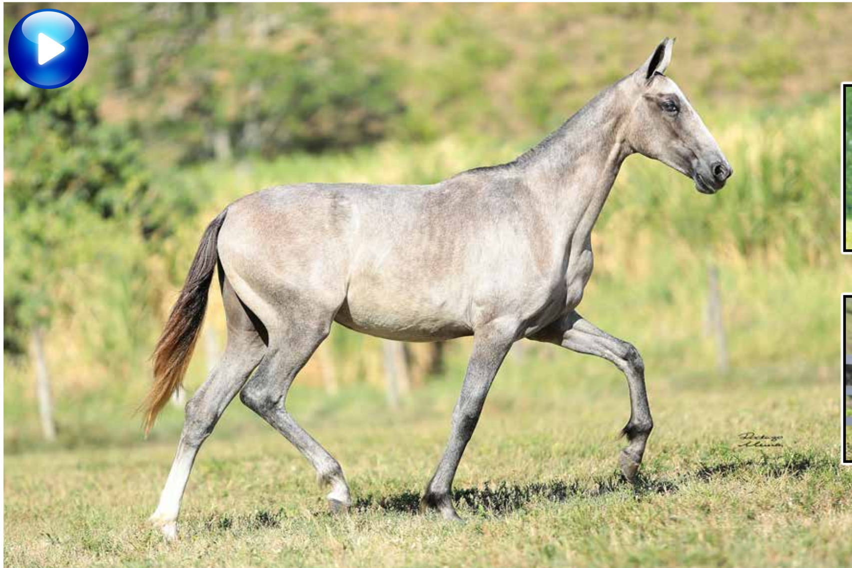
Pai, Sublime da Ogar