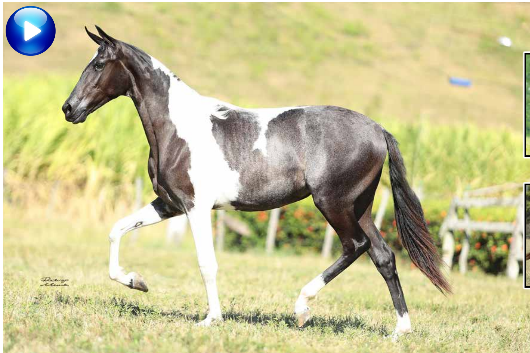
Pai, Sublime da Ogar