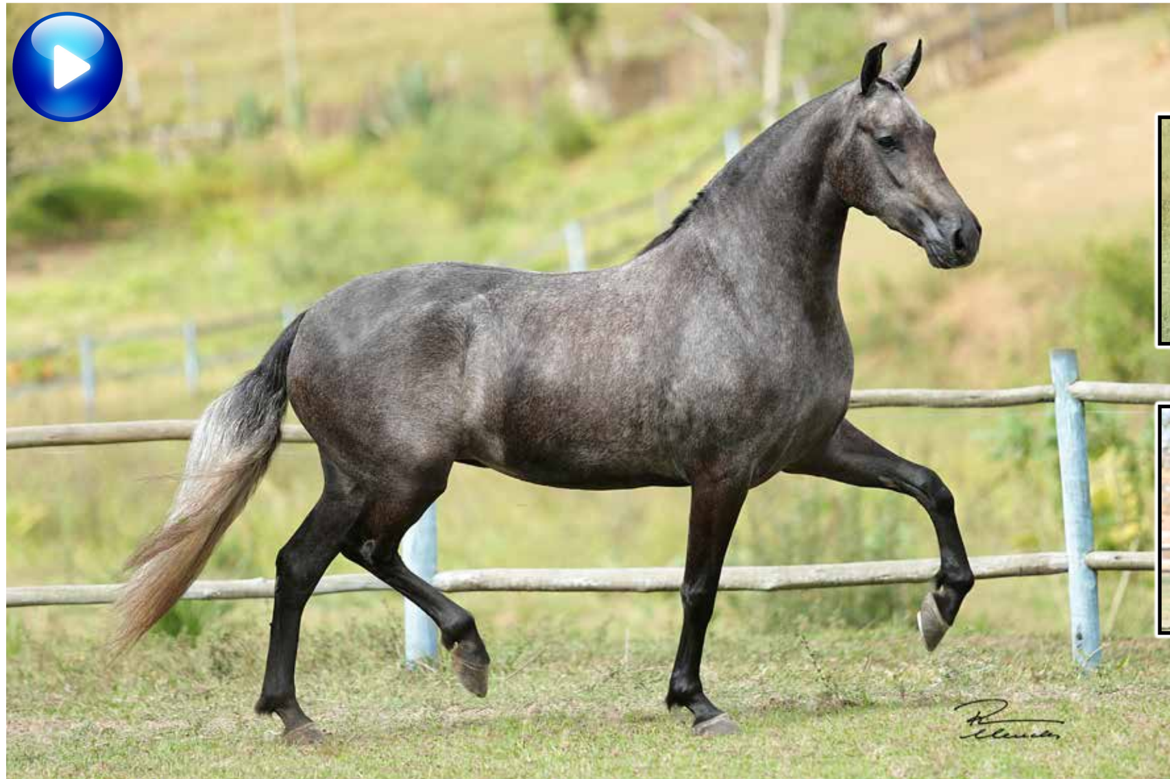
Embrião por Palhaço Bavária