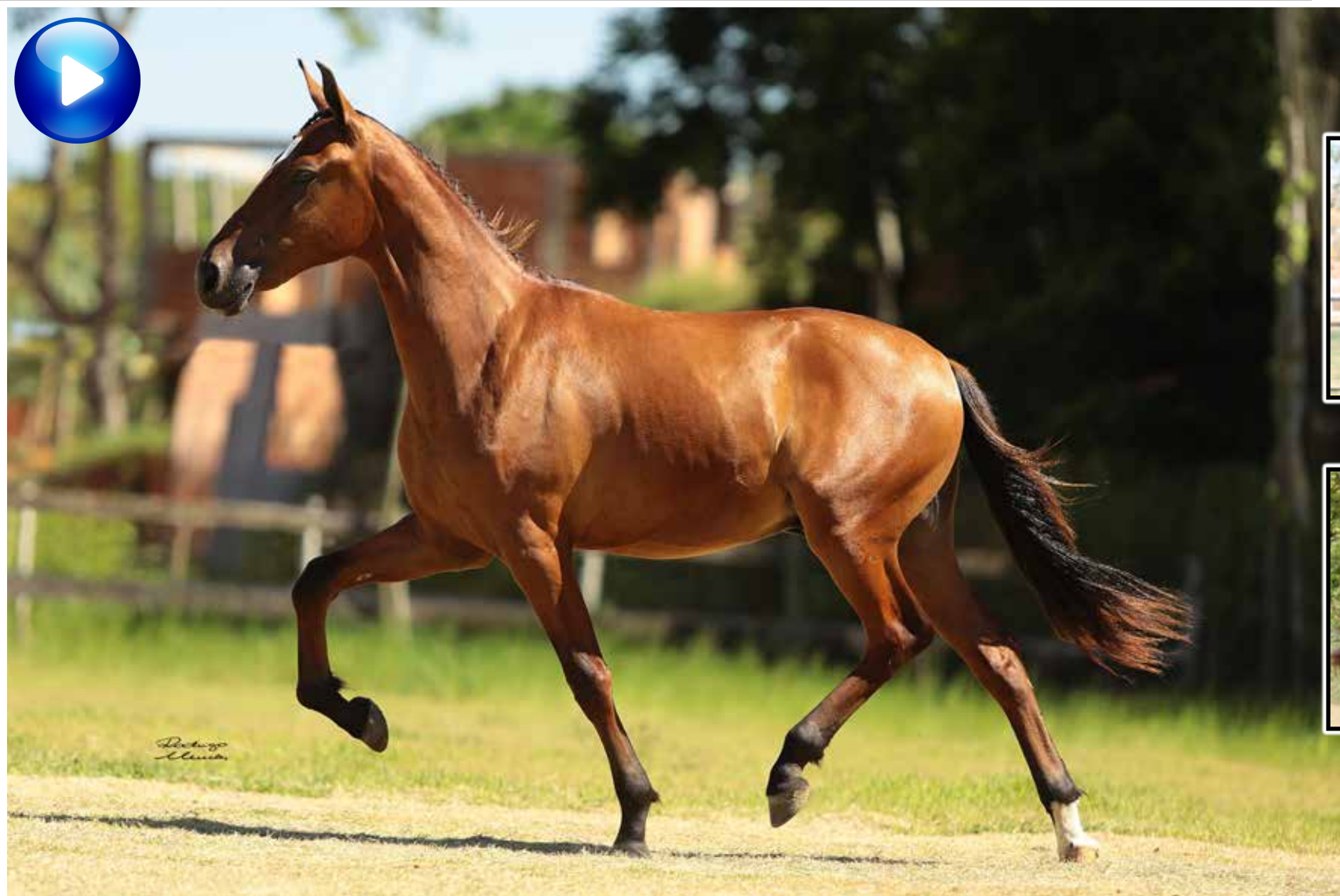
Pai, Laçador de Alcatéia