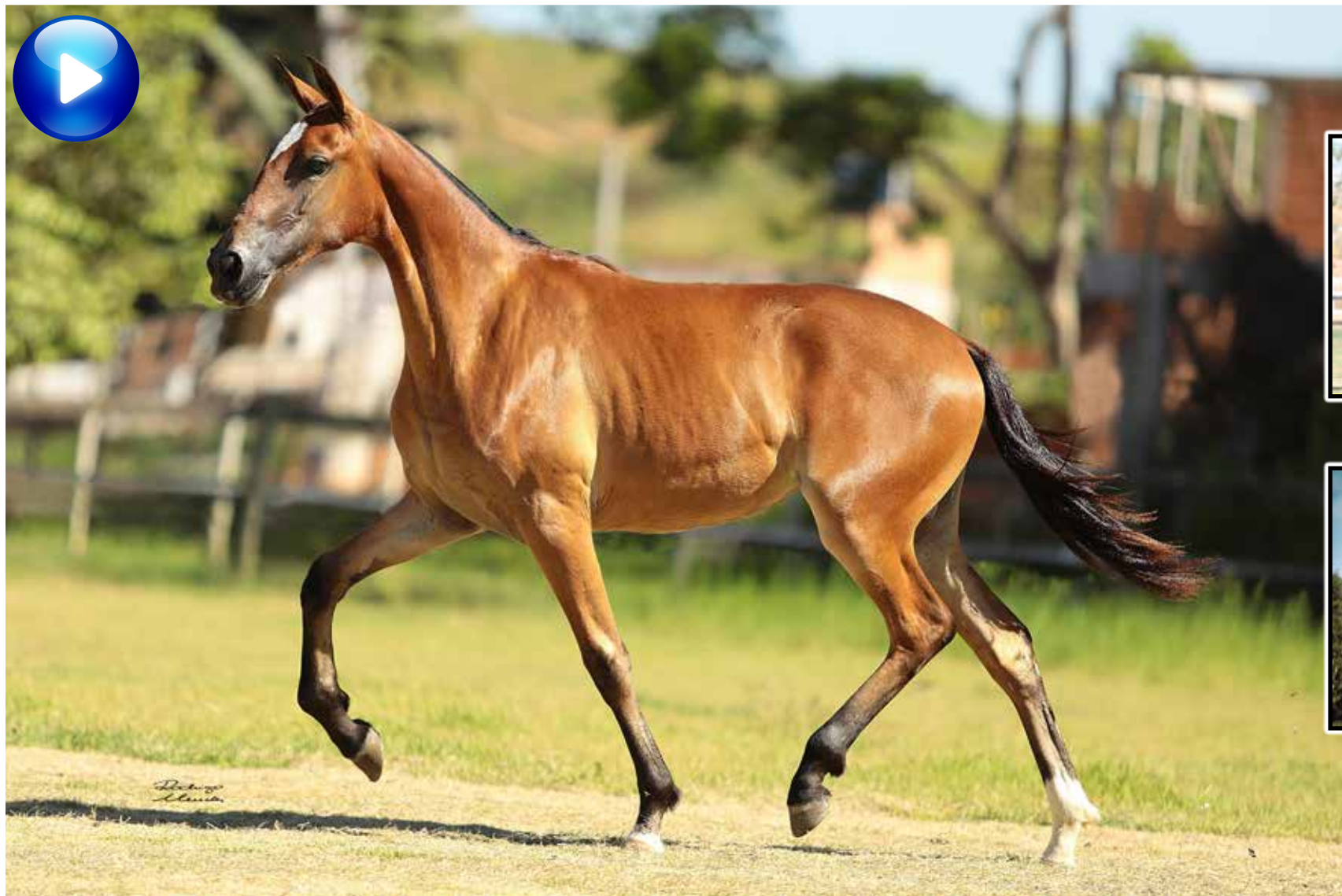
Pai, Laçador de Alcatéia