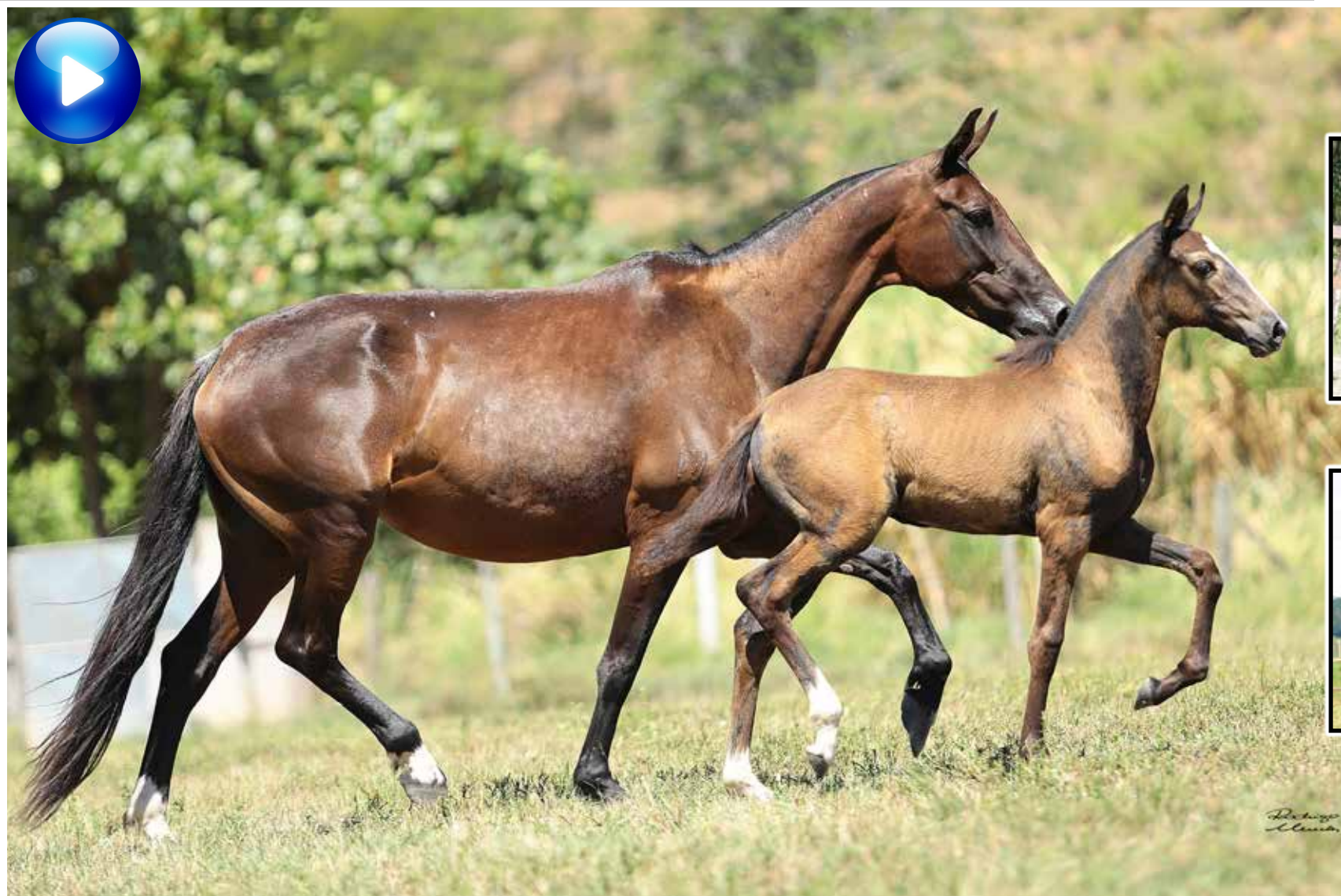
Pai, Jabuti da Mandassaia