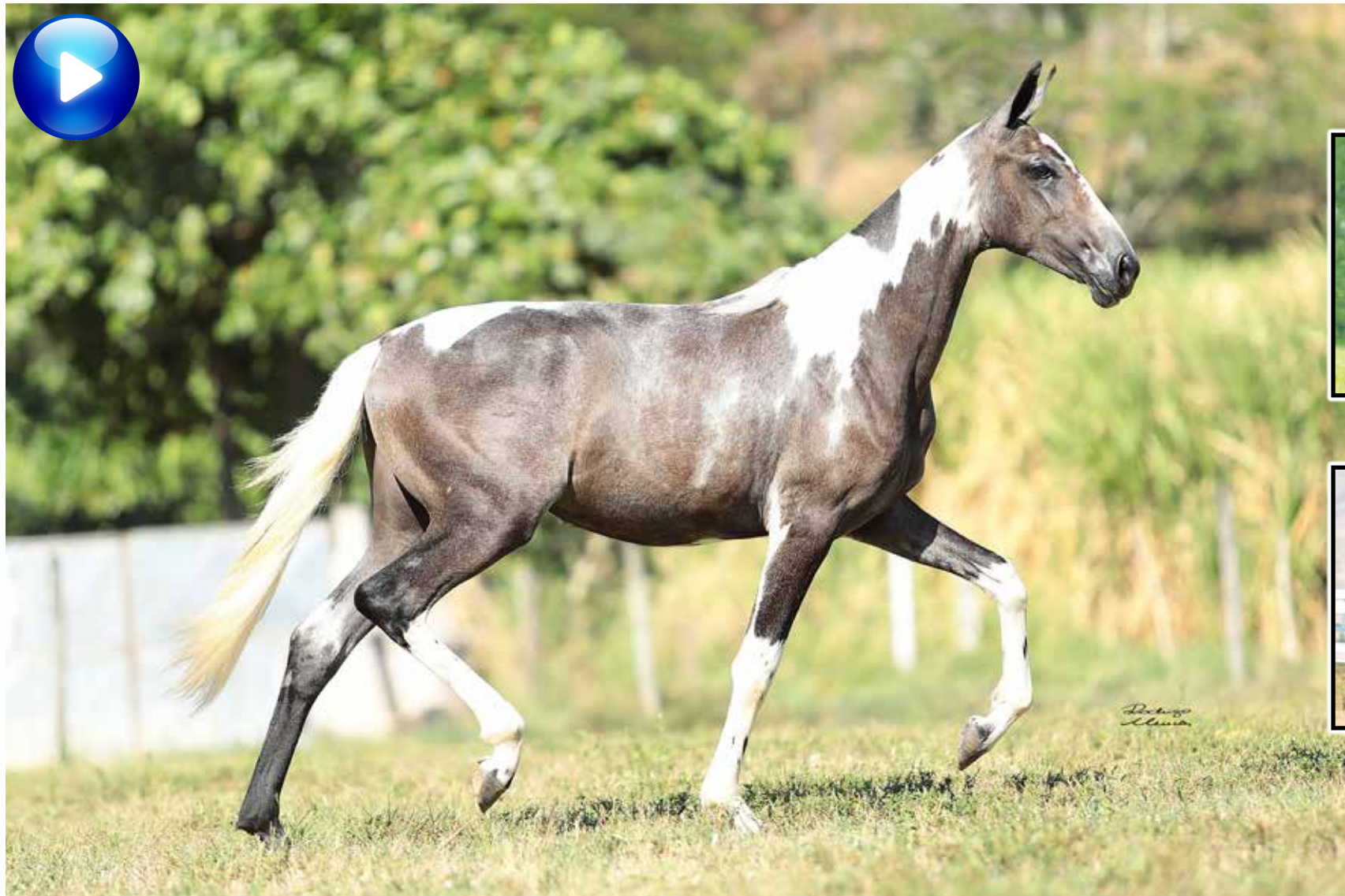
Pai, Sublime da Ogar