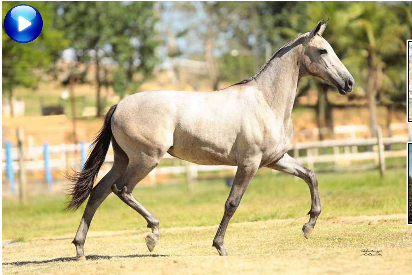
Pai, Laçador de Alcatéia