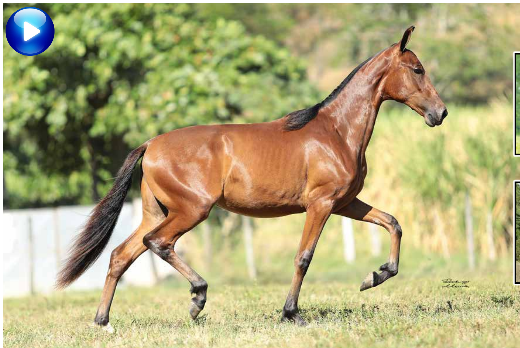
Pai, Sublime da Ogar