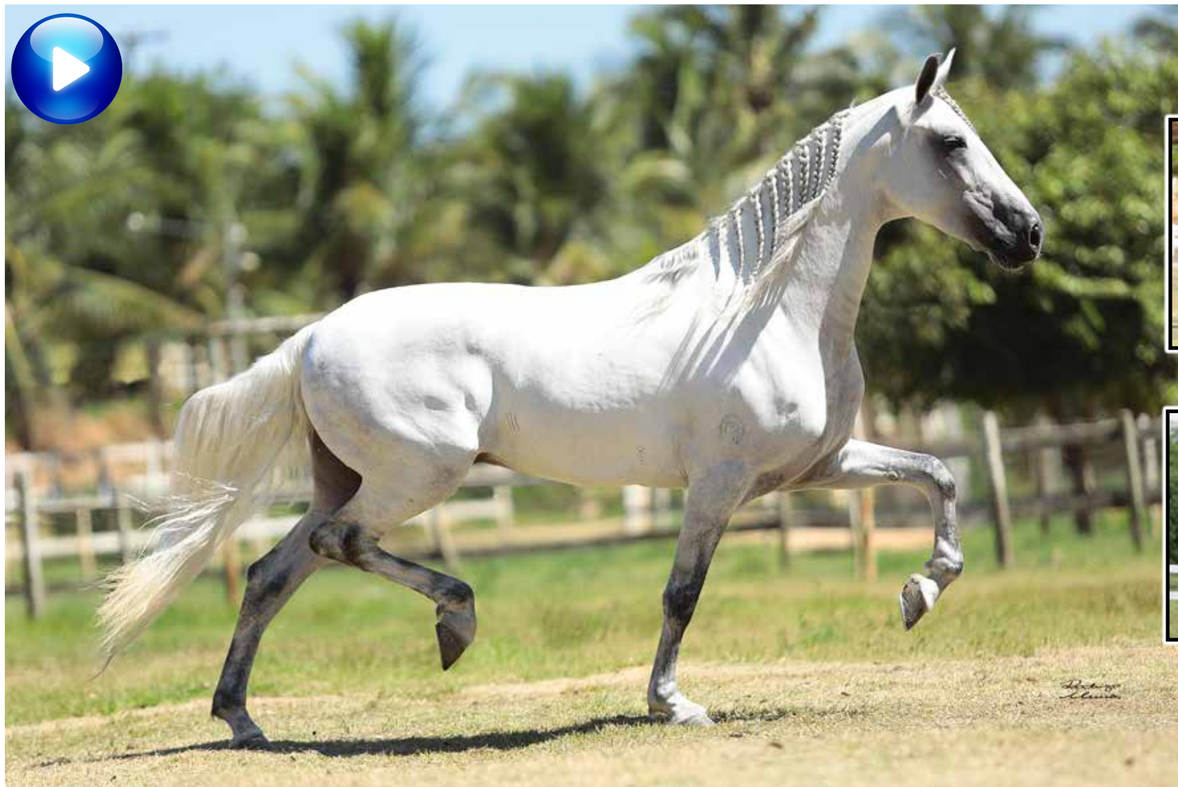
Pai, Vapor JEA