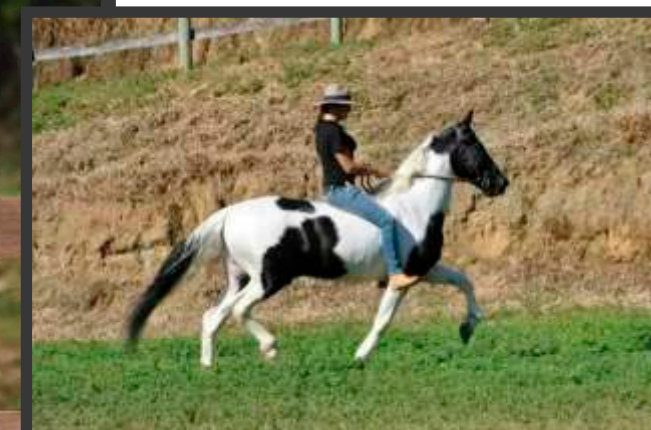
Seu Pai Arrogante do Rancho Pampa