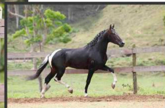
Seu Pai Imperador do Cabral

Nau do cabral é filha de Imperador do Cabral, garanhão que em sua primeira estação de produção surpreendeu a todos pela extrema qualidade da sua prole, imprimindo marcha e refinamento na tropa. Mas isso não basta, porque essa linda potra ainda tem em sua linha baixa, nada mais nada menos que, Quitandinha LJ e Ferrugem do Minatto como avós maternos. Ela marcha com força, com nobreza e com fineza. Falar das sua qualidades é chover no molhado!!!