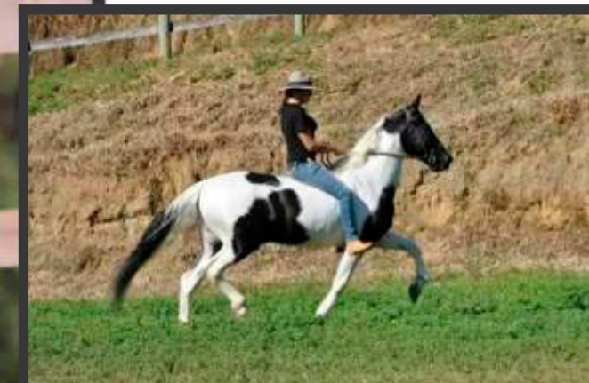
Seu Pai Arrogante do Rancho Pampa

Normalista do cabral é filha de Arrogante do Rancho Pampa em União do Passo Fino. União é um eguaço, filha de Kondor do Passo Fino em Conquista Morro Grande da Zizica, uma filha do Trilho da Zizica na Teteia da Zizica, que vai a Truc do Morro Grande. Potra pampa de preta linda, linda, linda... que vai ser um eguaço como sua mãe.