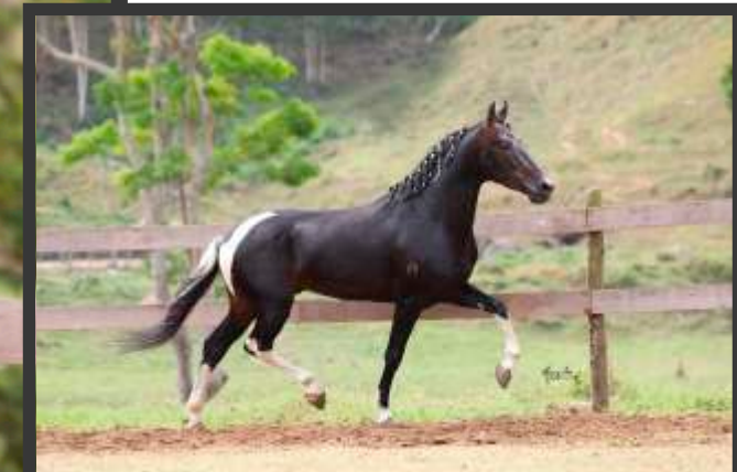
Embrião por Imperador do Cabral