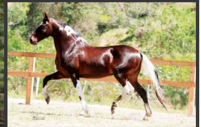
Seu pai Sublime da Ogar

Filha do Sublime da Ogar – Campeão do CBM, um filho de Galeão da Ogar que vai Apoio JB – sangue do Sincero JB. Sua mãe filha do Campeão dos Campeões nacional de Marcha Agadez do Quociente na Campeã das Campeões Nacional de Marcha Xica de Esperança.