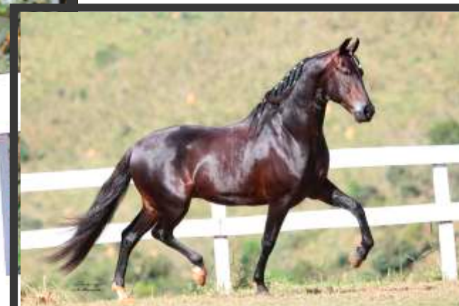
Embrião por Vermute JEA

Cruzamento consagrado no Haras – Vermute Jea em filhas do Elo Kafé da Nova – a doadora é filha de um dos maiores reprodutores da história do mangalarga marchador, o consagrado Elo Kafé da Nova, na extraordinária doadora Bonança D2, portanto o produto resultante com certeza será um animal de extraordinária qualidade, pois o pai é nada menos que o Vermute Jea, ganhão várias vezes Campeão Nacional e de grande destaque na reprodução.