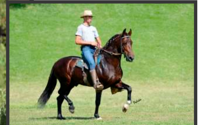
Embrião por Galeão RRC