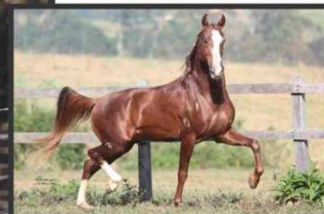
Seu Pai Quebranto Recanto Alegre

Cavalo de excelente temperamento de sela, equilibrado, articulações fortes e impulsão de ótima qualidade. Carrega em seu pedigree as origens mais nobres da raça, descende de camafeu geneve, radar de anchieta e atlântida kafé da panorama.