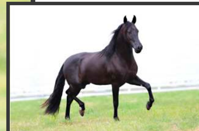
Embrião por Feitiço Caxambuense