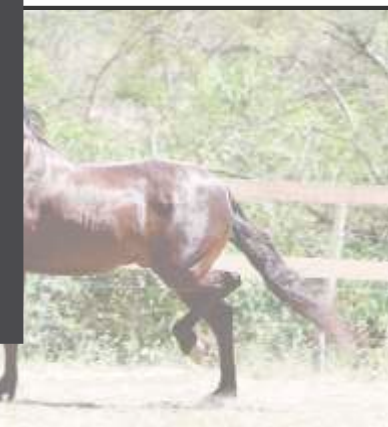
Embrião por Jabuti da Mandassaia