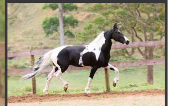
Seu Pai Equador do Cabral

Linda égua, iniciando na reprodução, filha do pampa de preto homozigoto Equador do Cabral em matriz filha do Ministro Lobos. Marchadeira, cômoda e discreta, como sua mãe, se movimentada só nas pernas, eliminando os atritos para o cavaleiro. Está coberta por imperador do cabral. Prenhez que nos traz boas expectativas.