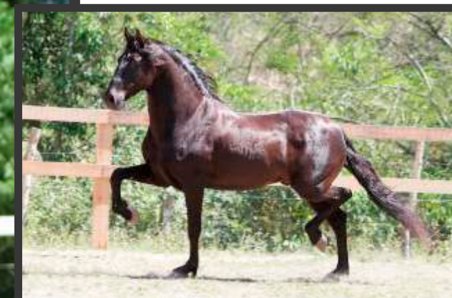
Embrião por Jabuti da Mandassaia