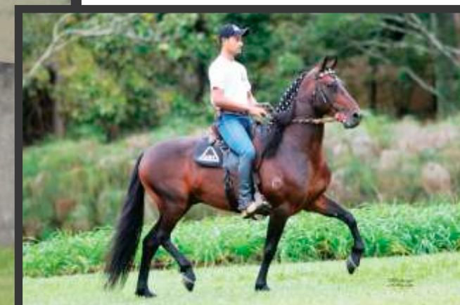
Embrião por Épico Capim Fino