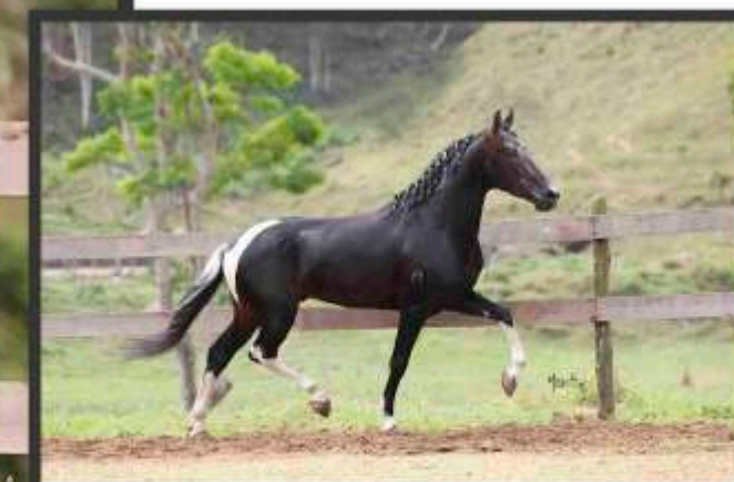
Seu Pai Imperador do Cabral