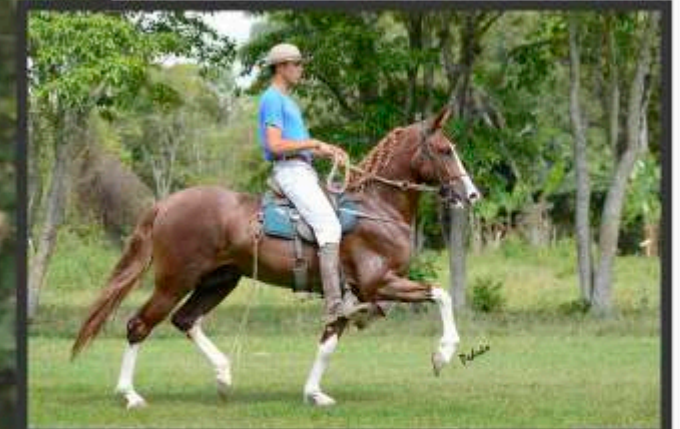
Seu Pai Savage Parâmetro

Seu pai obteve vários títulos de Campeão dos Campeões de Marcha em Passa a Quatro-MG e Itajuba-MG. Sua mãe filha do Campeão Nacional Jabuti na doadora Caxambu Xama.