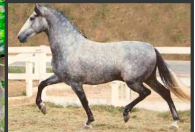
Embrião por Futuro Formoso 2S