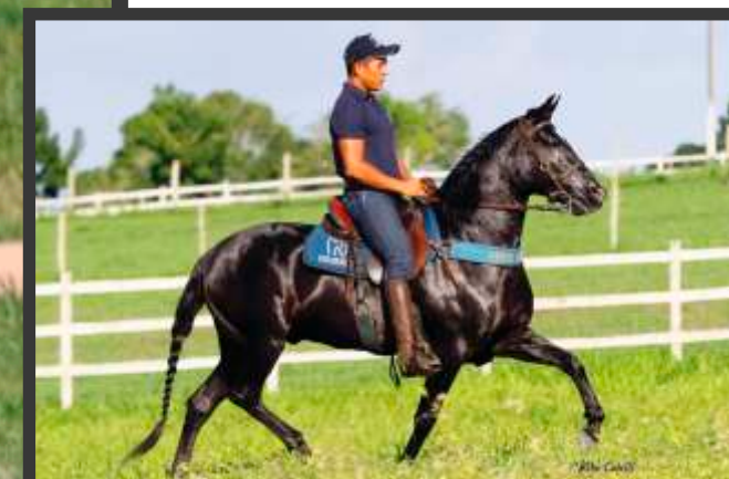
Seu Pai Gigante Convibrás

Égua preta muito boa, marchadeira, neta do Campeão Nacional Almirante da Selva Morena, Cavalos Com 69 Premiações. Sua Mãe neta do Semental Nobre De Santa Lucia.