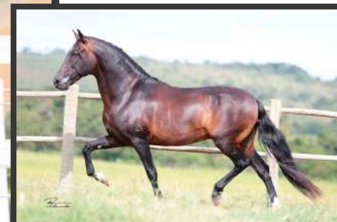
Seu Pai Argos das Minas Gerais