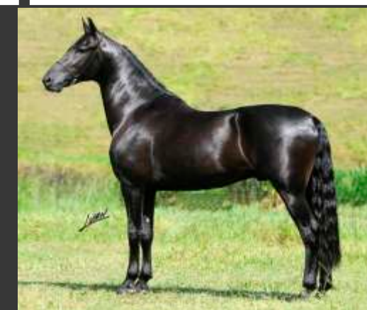
Seu Pai Vapor JEA