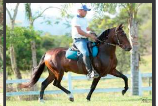
Embrião por Kamikaze MZC