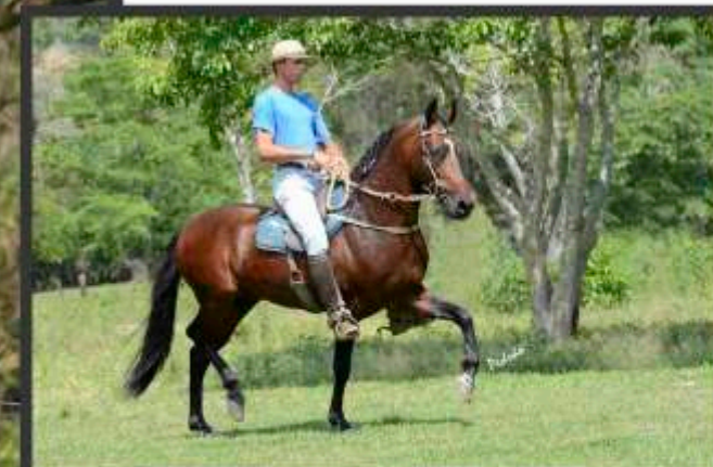
Seu Pai Globo RRC

Seu pai foi o Res. Grande Campeão Nacional da Raça. Sua mãe leva a genética de Jabuti da Mandassaia na Campeoníssima de Marcha Banda de Esperança.