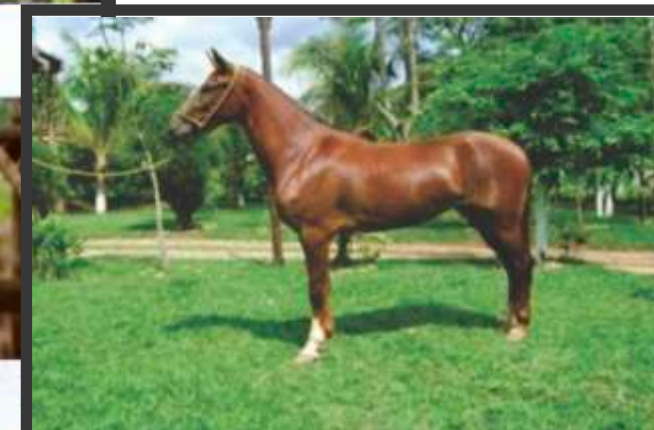
Sua Mãe Xuxa de Três Corações