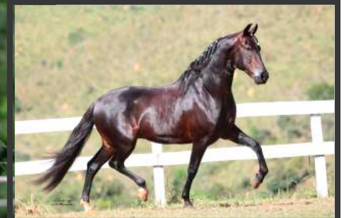
Embrião por Vermute JEA