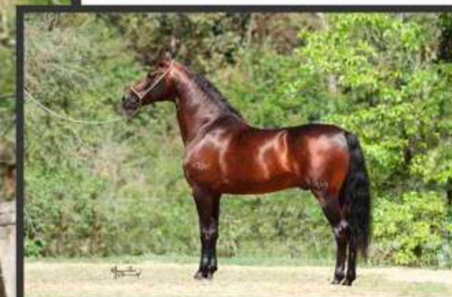
Seu Pai Íon Bavária RRC

Seu pai cavalo com 28 premiações – Foi Campeão da Raça Caçapava 2011 e Cavalo Sênior Caxambu 2016.