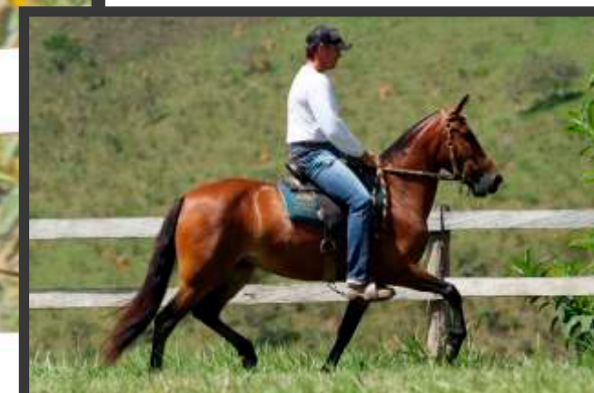
Sua Mãe Odisséia da Aldeia

Fruto de um cruzamento consagrado no Haras - Vermute em filhas do Tigrão Kafé Odisséia da Aldeia. Acreditamos que tem um grande futuro pela frente.