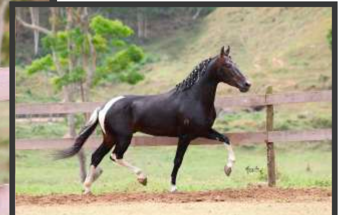
Embrião por Imperador do Cabral