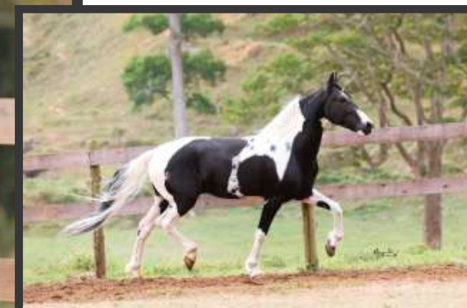
Seu Pai Equador do Cabral

Fruto do cruzamento de sobrinho na tia, Equador do Cabral em Espadilha São Lourenço, esse potro é consanguineo nas linhagens Favacho e JB. De pelagem preta pampa, prepotente em todos os filhos desse cruzamento, Maestro é neto e bisneto de Fantoche do Rancho Pampa e Bisneto de Xingú JB, Favacho da Agua Limpa e Beijo JB. Portanto, é um potro de sangue fechado que facilita muito os acasalamentos.