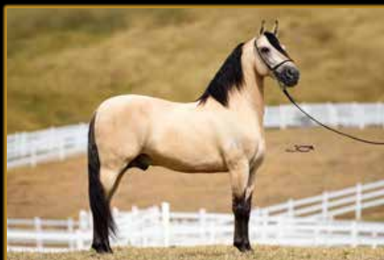
JOGO DE ALCATÉIA