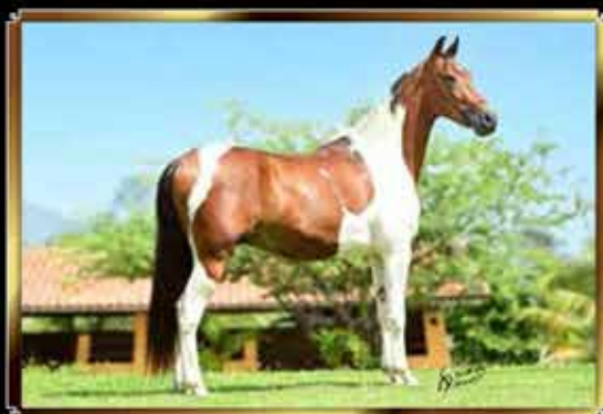
28 TANGO DO QUELÉ 33%