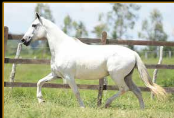
VITÓRIA DE TRÊS CORAÇÕES

SUA IRMÃ PRÓPRIA, CAMPEÃ DAS CAMPEÃ NACIONAL