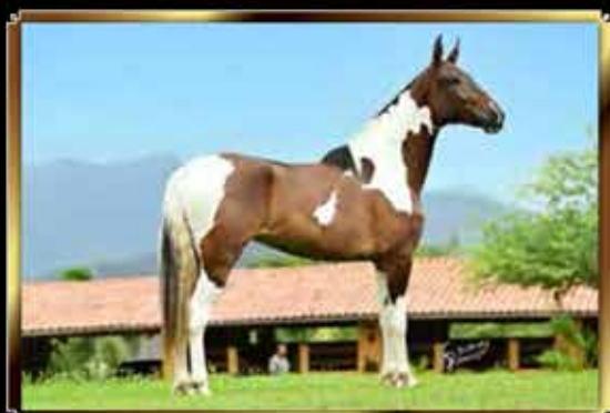
38 RAÇA DO MONTEIRO 50%