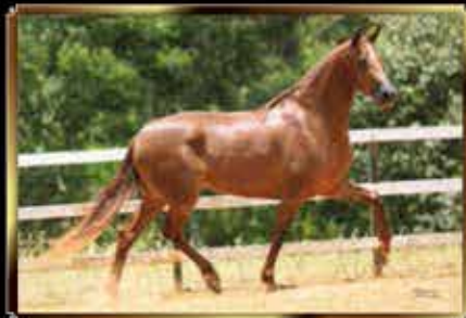
11 QUIFIGURA E.A.O. - EMBRIÃO