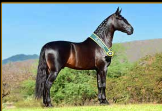
GAIATO BEIRA RIO