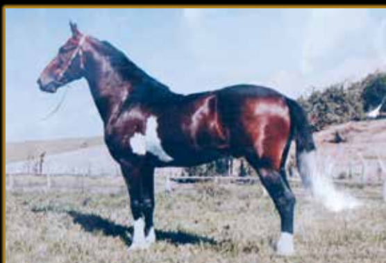
PALHAÇO DE ITUVERAVA

CAMPEÃ DAS CAMPEÃS ADULTA DE MARCHA - FENAGRO 2017 CAMPEÃ DAS CAMPEÃS ADULTA DE MARCHA - FORTALEZA/CE 2017 CAMPEÃ DAS CAMPEÃS ADULTA DE MARCHA - EXPOBAHIA 2017