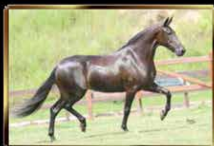
59 REITORA DO MALBORO