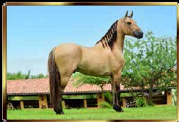
45 PATRIMÔNIO DO QUELÉ 33%