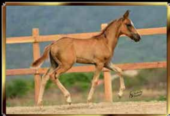
25 ALCATRAZ DO GG 50%