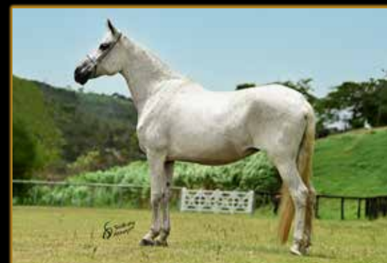
CANÇÃO DE CAPRI