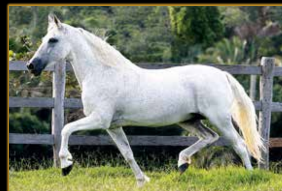
NOBRE DE SANTA LÚCIA

COM 21 CAMPEONATOS, DESTACAMOS: RES. CAMPEÃ JOVEM DA CATEGORIA TERESINA/PI 2022 CAMPEÃ JOVEM DA CATEGORIA IPATINGA/MG 2019