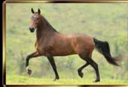
08 POTIRA DE MAIRI - EMBRIÃO 50%