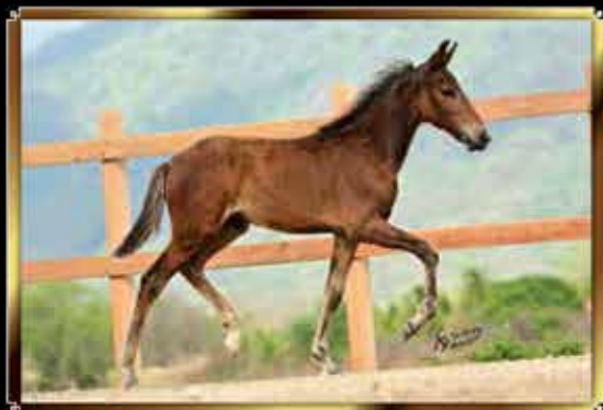
22 ADVOGADO DO GG 50%