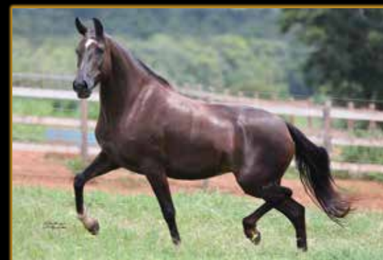
URTIGA DO PORTO PALMEIRA

RES. CAMPEÃO JOVEM RAÇA MACEIÓ/AL 10/2021