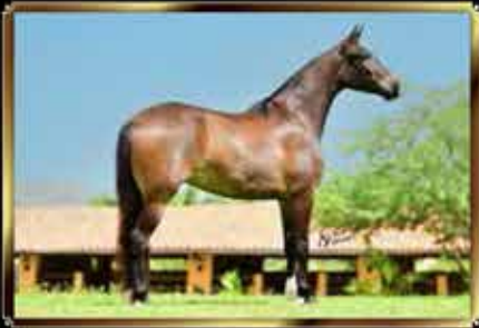
04 QUALIDADE SÃO JOÃO DO MONTEIRO - EMBRIÃO 50%