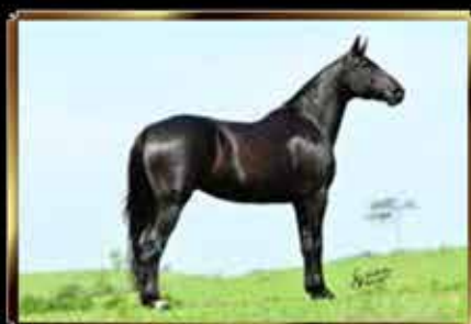
58 QUARTELA FÓRUM 50%