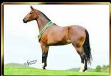
46 BETINA VB 50%