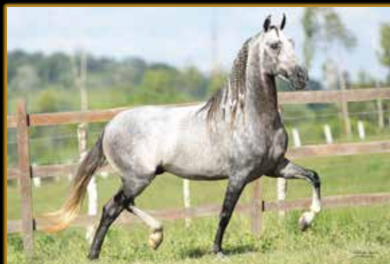
JUIZ DE ALCATÉIA