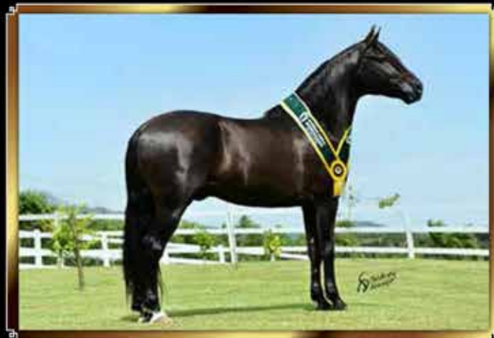
03 KAMIKAZE DO PASSO PICADO - COBERTURA UNITÁRIA