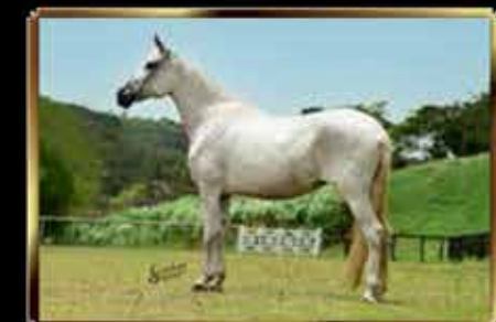
17 CANÇÃO DE CAPRI - EMBRIÃO 50%