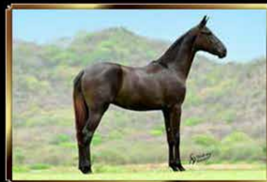
34 HERDEIRA DO MARANGUAPE 50%