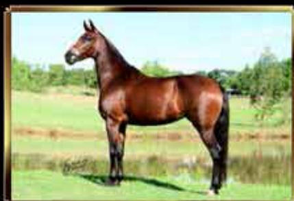
19 BELÍSSIMA FELICE - EMBRIÃO