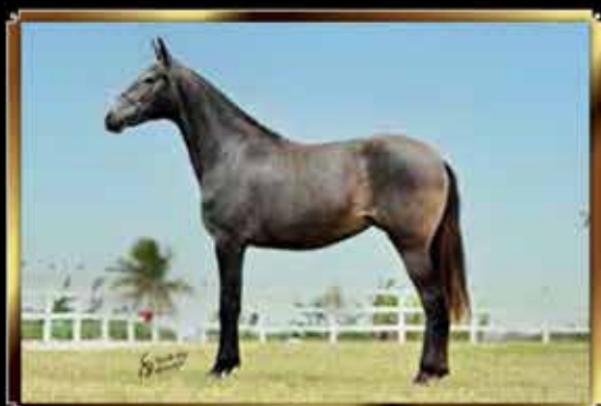
35 JÓIA DA ARENA 50%