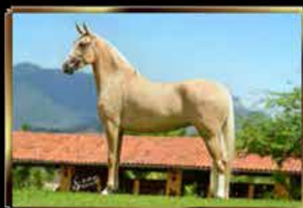
52 HISTÓRIA DA MORADA NOVA 33%