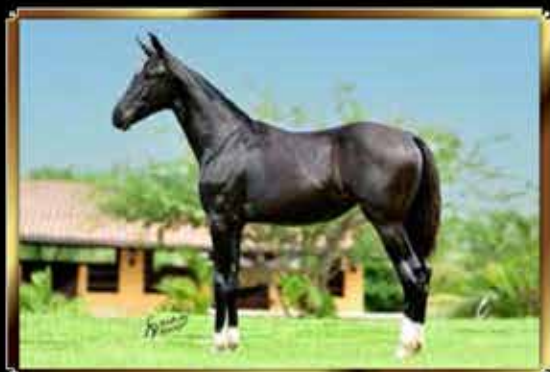
29 AÇUCENA DO GG 50%