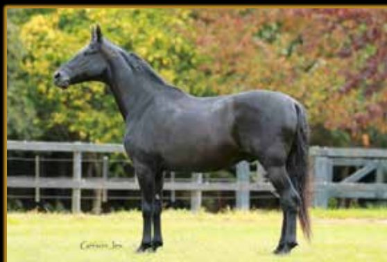
DANTE DOS ÓLEOS

COM 29 CAMPEONATOS, DESTACAMOS: CAMPEÃ DAS CAMPEÃS ADULTA DE MARCHA - MARANGUAPE/CE 2017