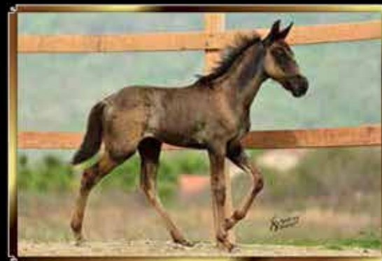
24 AL CAPONE MONTEIRO DO GG 5% (COTAS)