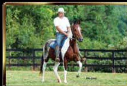
16 AZALEIA DO ZEL - EMBRIÃO