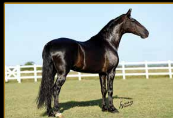
ELFO DO PORTO AZUL