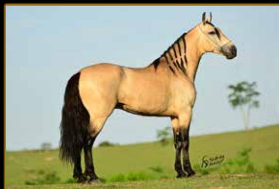
JATO DO PASSO PICADO