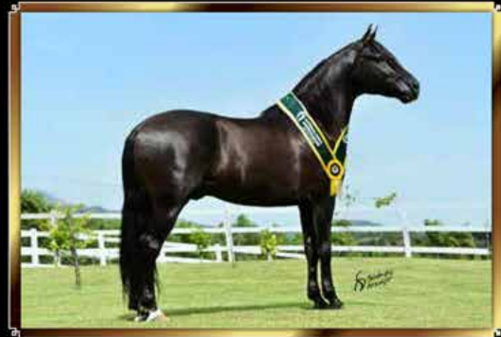
02 KAMIKAZE DO PASSO PICADO - 5 COBERTURAS