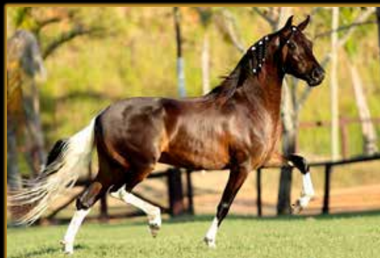
PAPARAZZO DE ALCATÉIA