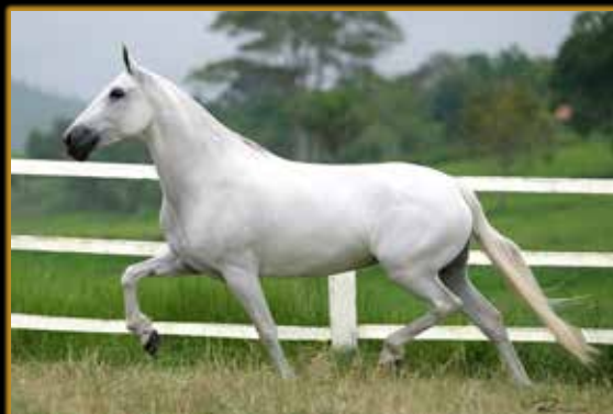
NATA DA VISÃO