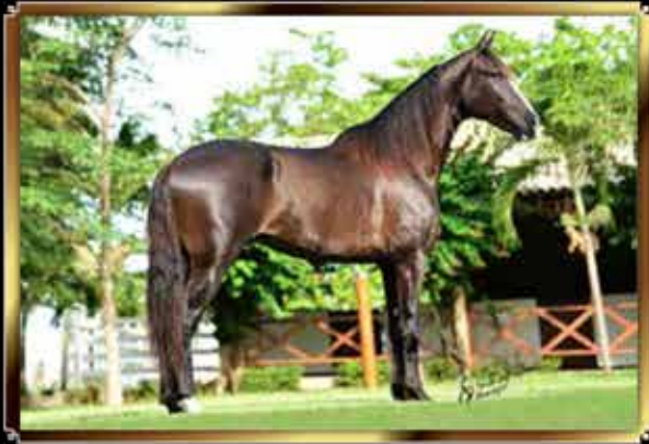
41 ALADO DA BS CHICA DOCE