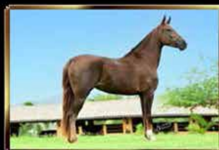
60 ZORRA E.A.O. 50%