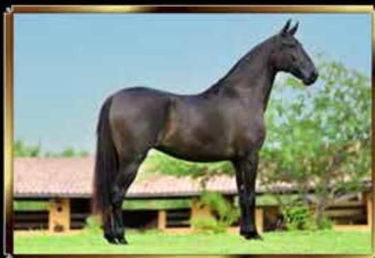
30 ANDRÔMEDA DO GG 50%