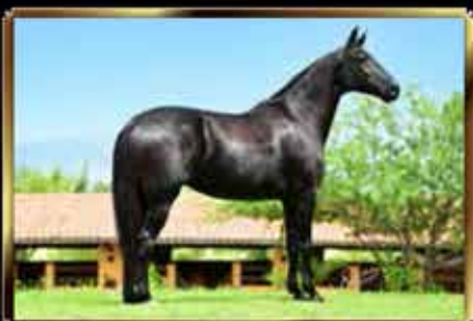
14 QUARTELA FÓRUM - EMBRIÃO