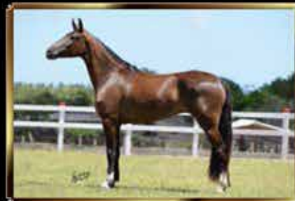
12 GAROTA JFS - EMBRIÃO