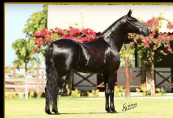
ORQUÍDEA SERRA BRAVA