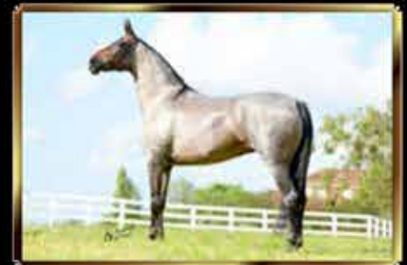
13 ÚNICA DO PORTO AZUL - EMBRIÃO