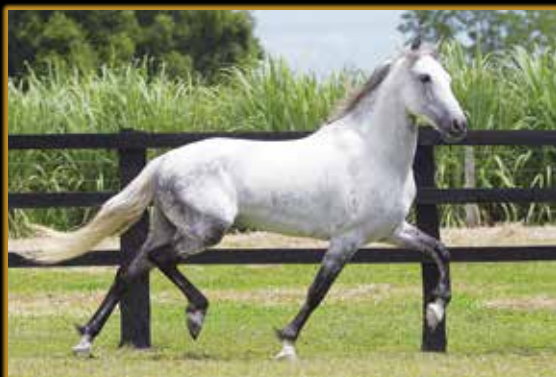
XAXADO SANTA FAUSTA