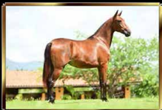
32 EXTRATERRESTRE QUELÉ DO GG 25%