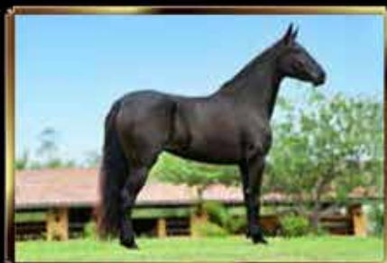
15 PHARMA JFS - EMBRIÃO