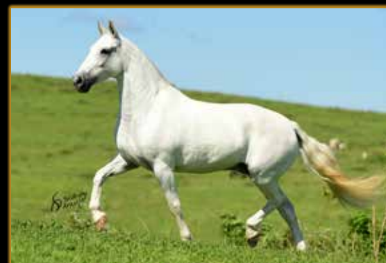
ABSOLUTA DO CALULI