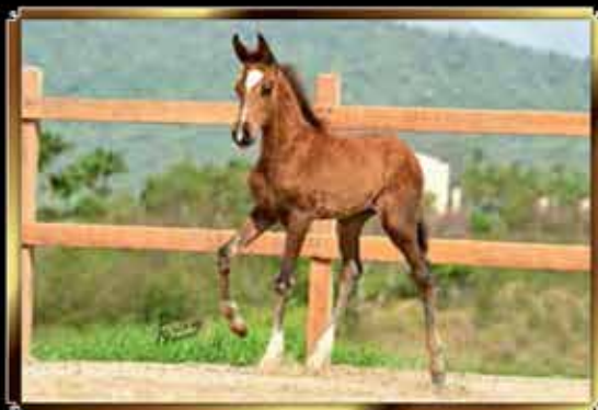
23 AK-47 DO GG 50%