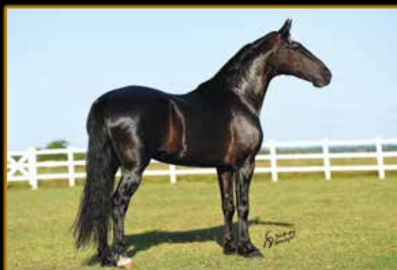
ELFO DO PORTO AZUL