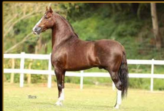
TRILHO DO PORTO AZUL