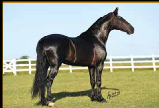
ELFO DO PORTO AZUL