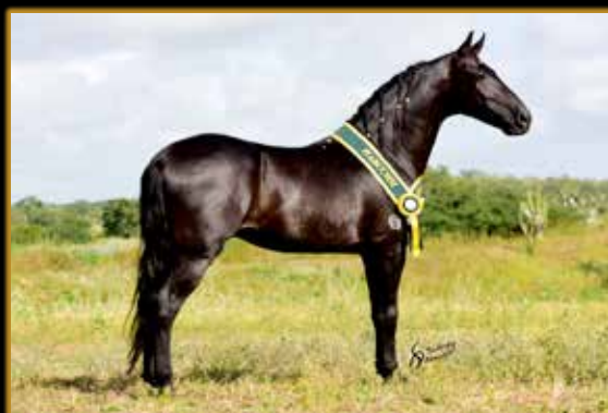
QUARTEL DO DANTE