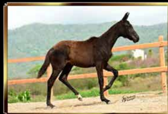
31 ANGÉLICA ZAPATA DO GG 50%