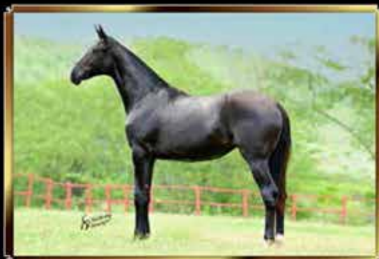
39 SAFIRA DO MONTEIRO 50%