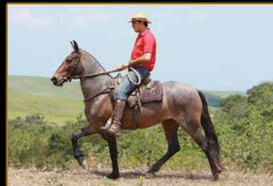
INVEJA DA PEDRA VERDE

CAMPEÃ DAS CAMPEÃS DE MACHA CBM 2021 - OPÇÃO ÓVULO 50%