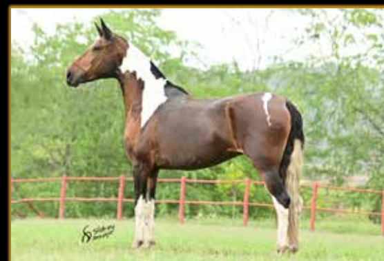
MATEMÁTICA 333 DO ARTESÃO