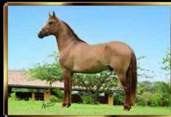
27 SADAM DO QUELÉ 33%