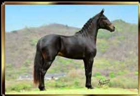
26 GLADIADOR BAIXA FUNDA DO MARANGUAPE 50%