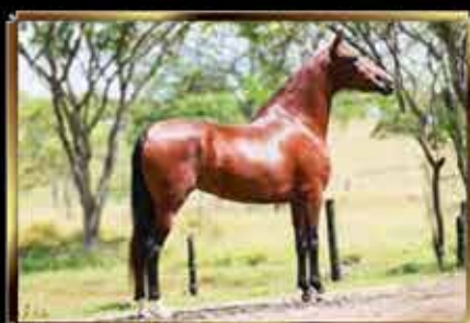
55 PINTURA DO QUELÉ 50%