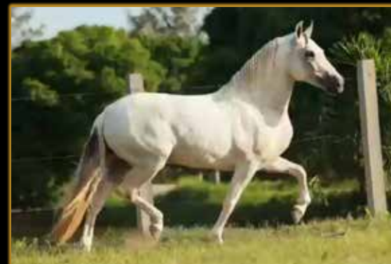
RIVELINO DE ALCATÉIA