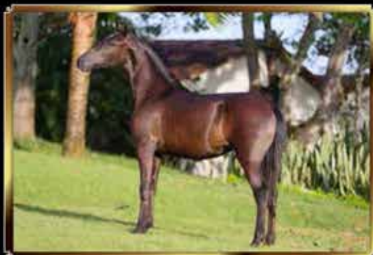
36 MAGNÂNIMA LFL 50%