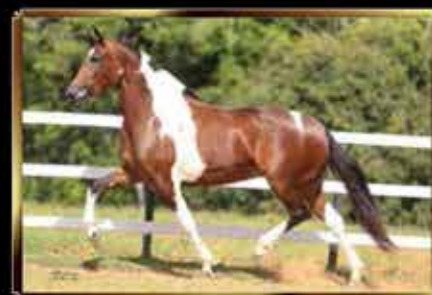
49 FILOSOFIA DO SÃO JORGE 50%