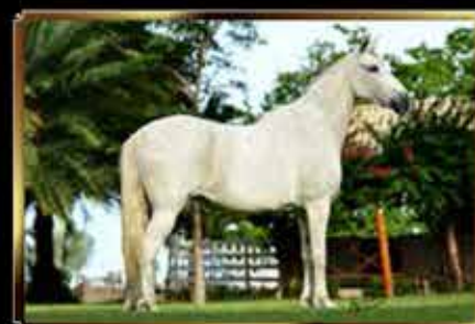
53 INGLATERRA DO MONTEIRO