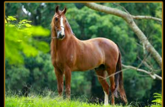
VETTEL DO YURI

COM 71 CAMPEONATOS DE MARCHA E RAÇA - OPÇÃO ÓVULO