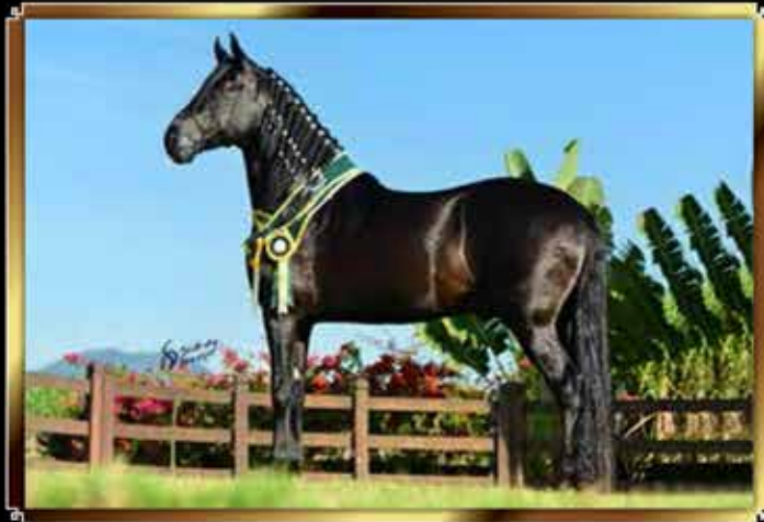
01 IRAQUE PONTAL - 5 COBERTURAS