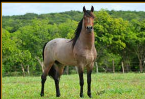
HACKER 333 DO ARTESÃO

CAMPEÃ ÉGUA JOVEM DA CATEGORIA E RAÇA - FORTALEZA /CE 2022 CAMPEÃ ÉGUA JÚNIOR DA CATEGORIA RES. CAMPEÃ ÉGUA JÚNIOR DE MARCHA CRATO/CE 2022