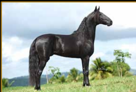
INGLÊS DO MONTEIRO