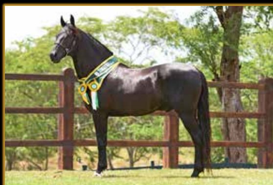
SELVAGEM DE MAIRI