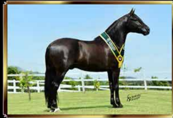
44 KAMIKAZE DO PASSO PICADO 5%