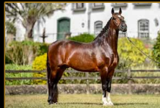
LÓTUS DA CATIMBA