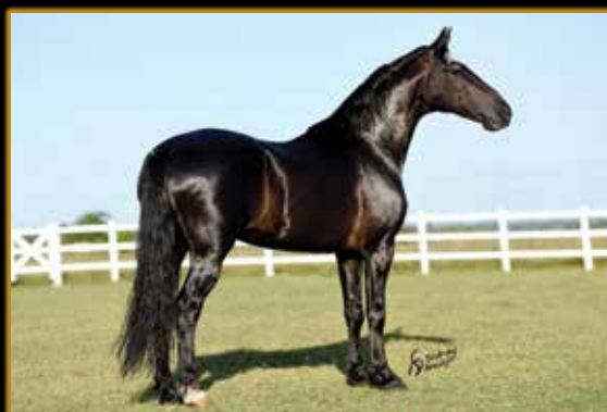
ELFO DO PORTO AZUL