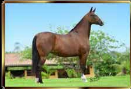
07 ROMA AGÉO - EMBRIÃO