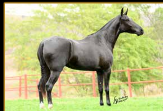
PALBA DA CAVALGADA