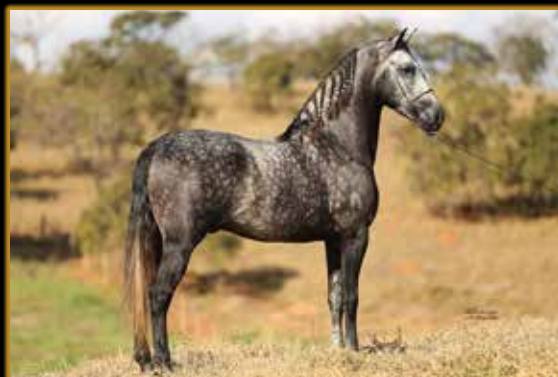
NEON CRISTAL PVB