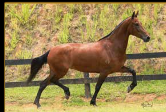
PIABANHA DO BAMBUZAL

RES. CAMPEÃO CAVALO JÚNIOR DE MARCHA - RECIFE/PE 2021