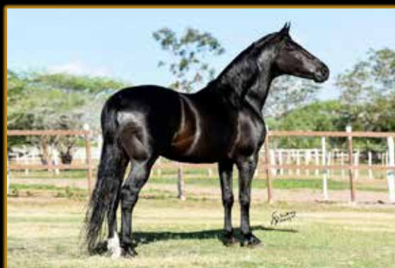
HERDEIRO DO MINATTO

CAMPEÃ DAS CAMPEÃS JOVEM DE MARCHA - CAMPINA GRANDE/PB 2021