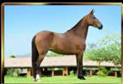
50 FORTUNA DO VALE DAS PAINEIRAS 50%