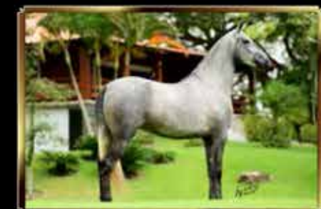
21 BONECA SANTOS DA SERRA - EMBRIÃO