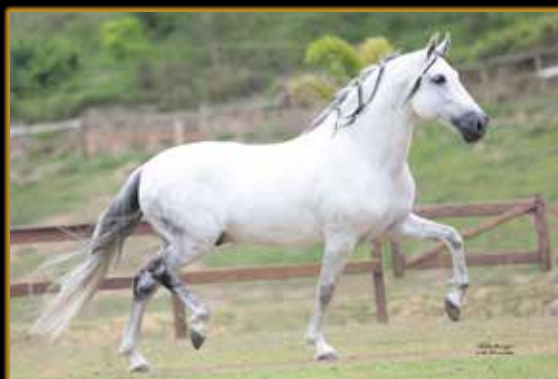
EMPÓRIO DAS MINAS GERAIS