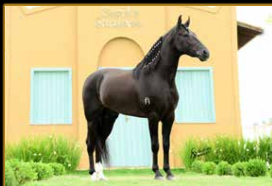
BMW DE MAIRI