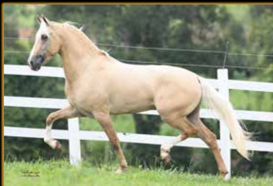
ZINABRE CALAMBAU I