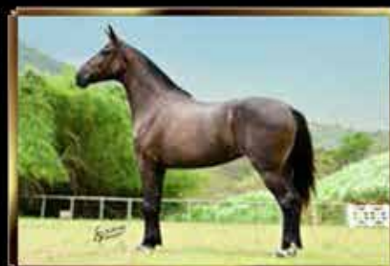
20 BAIANA DE JACOBINA - EMBRIÃO