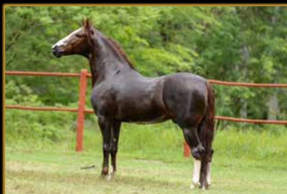
MUSSOLINI DA PEDRA VERDE