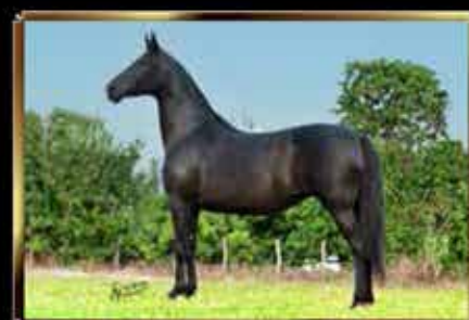
57 PREDILETA DA MARINA SANSÃO