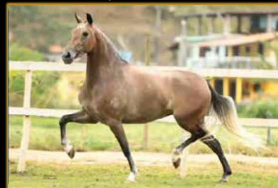
PLENITUDE DO QUELÊ

SUA IRMÃ PRÓPRIA, CAMPEÃ DAS CAMPEÃ NACIONAL