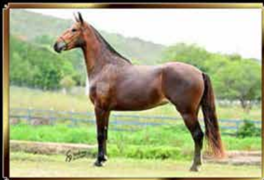
33 FANTÁSTICA VILA REAL 50%