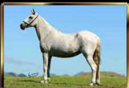
18 DANÇA DA PEDRA VERDE - EMBRIÃO