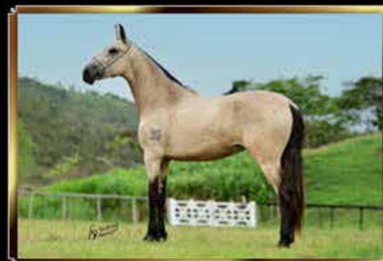
37 PÉROLA DO PASSO PICADO 50%