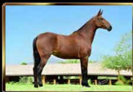
48 ESPOLETA DE PARANAMBUCO