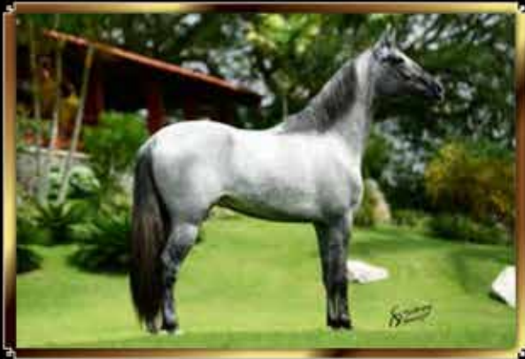
43 JOHNNIE WALKER DO APIUCOS 25%