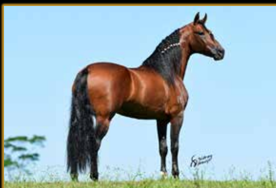
POETA DO PORTO AZUL