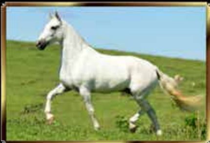
10 ABSOLUTA DO CALULI - EMBRIÃO