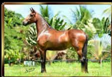
47 DOUTORA BOA MARCHA 50%