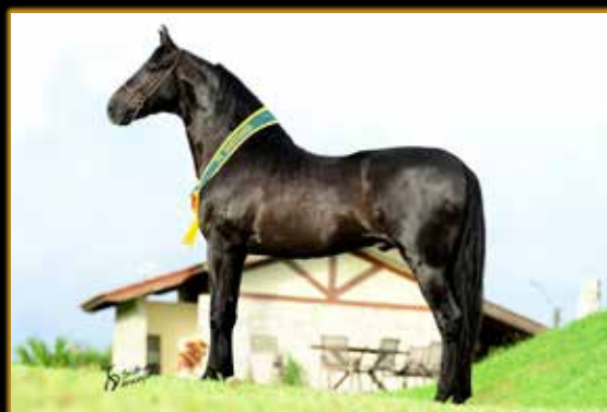
TIMONEIRO DA RIOCON