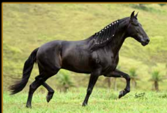
SEU CHICO TANDY