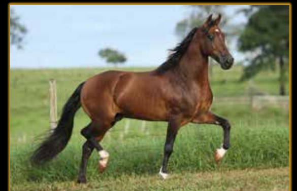
ROMANCE DA CADUCEU

1º PRÊMIO CAMPEÃ DAS CAMPEÃS ADULTA DE MARCHA CAMPINA GRANDE/PB 2018