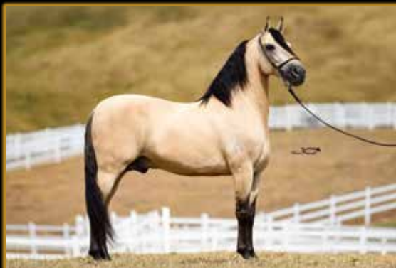
JOGO DE ALCATÉIA