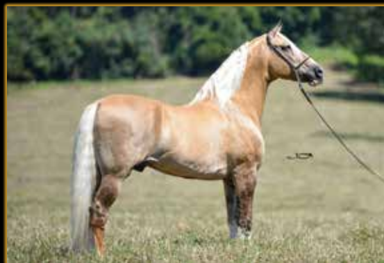
FATOR DA CAVARÚ-RETÃ