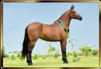
06 CARISMA DO ALTAREGO - EMBRIÃO 50%