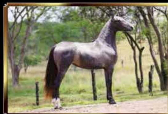
40 SILHUETA DO QUELÉ 50%