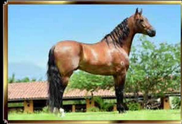
42 CHRONOS HARAS J.A.G 50%