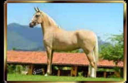
09 HISTÓRIA DA MORADA NOVA - EMBRIÃO