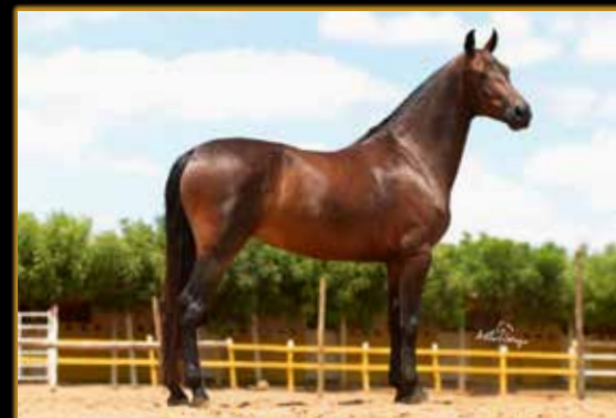
DAMA DA BARRA DO RUBIM