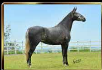
51 HERANÇA DA ARENA 50%