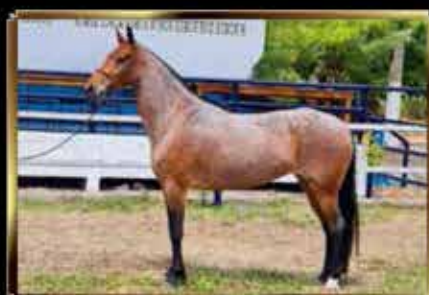
56 PIPA DA ÁGUA BOA 50%