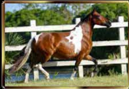
05 LUNA DE ALCATÉIA - EMBRIÃO 50%