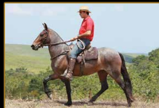
INVEJA DA PEDRA VERDE