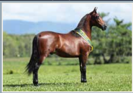
Campeão Potro Jovem da Categoria Nacional 2019 VETOR DO MINATTO