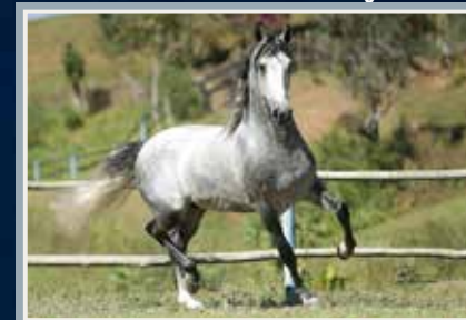
Campeão de Marcha - Nacional 2019