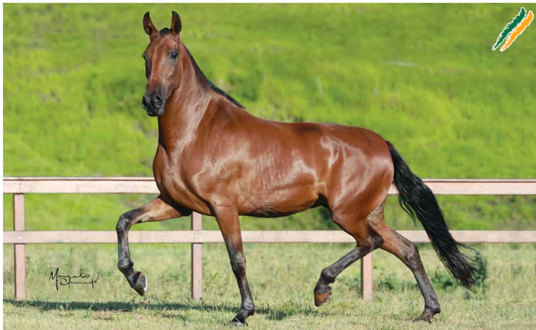
Embrião a coletar por