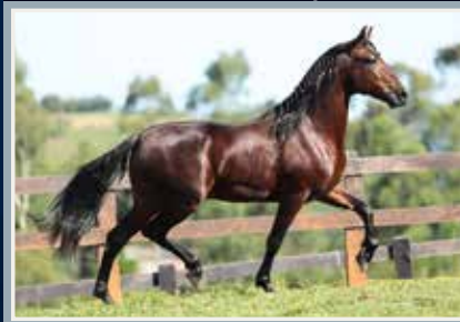
Onassis da Figueira