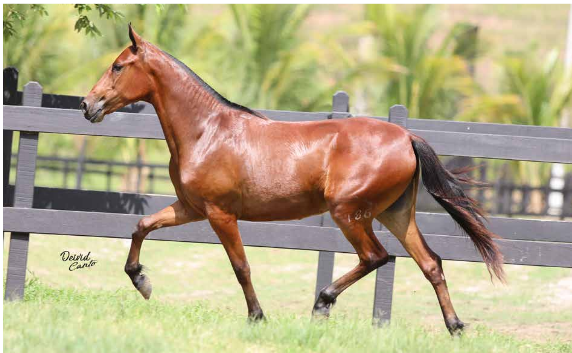
Seu pai, Abiara da Figueira

Equipado do Rancho Pampa x Xangrilá Caxambuense