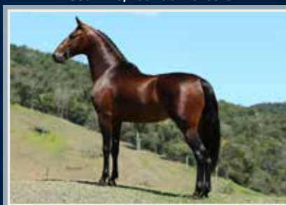
Seu filho, Luar do Malboro

Grande Campeão da Raça Campeão da Categoria e de Marcha Nacional 2019