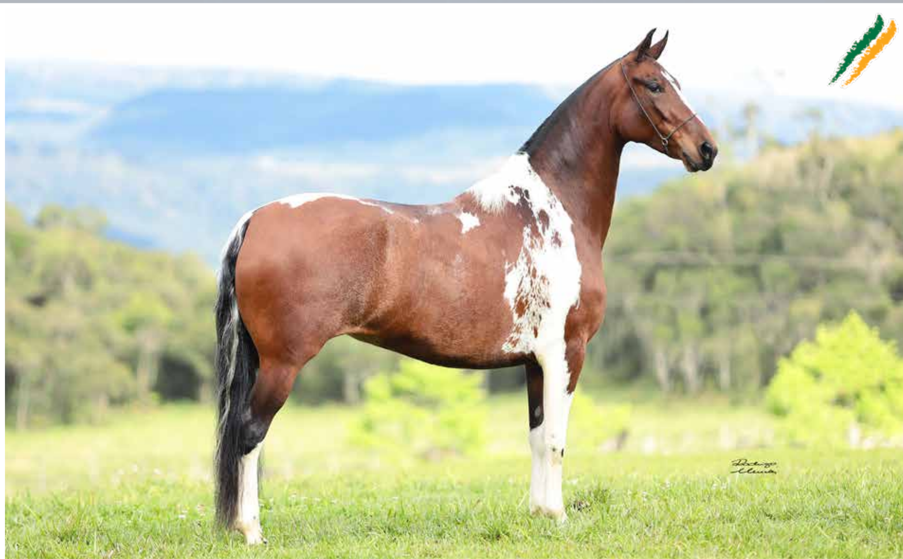
Seu pai, Iguaçu do Expoente

Duetta da Figueira Espanhol Kafé da Nova x Letícia do Fá