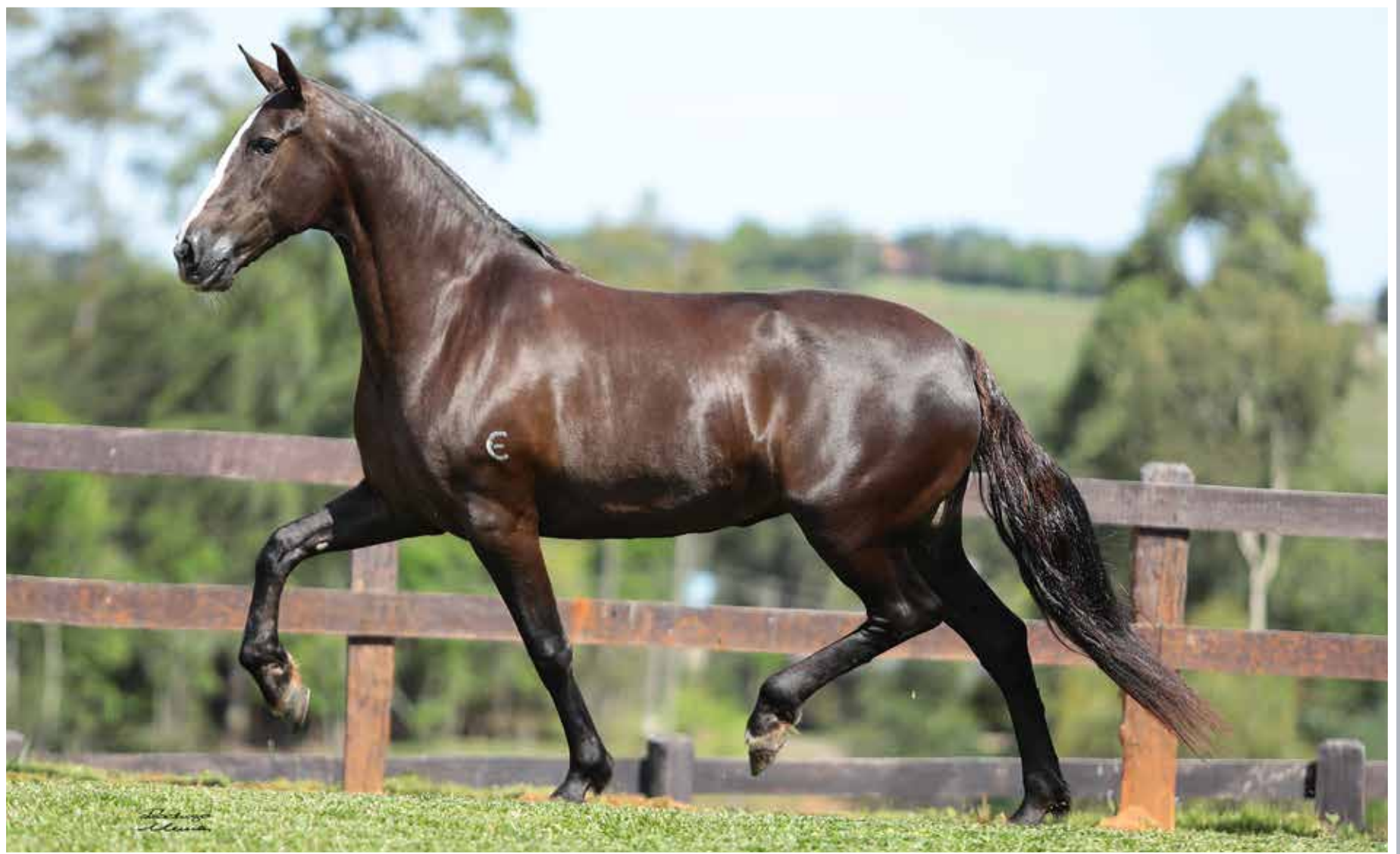
Seu filho, Lobo da Figueira