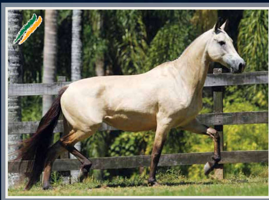
Cabuçu da Selva Morena (Original de S. Lúcia x Juventude da Selva Morena) x Volúpia 7 Quadros (Sonar do Porto Azul x Diana J.U.P.)