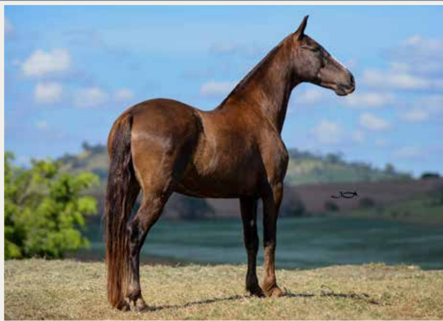
Diamante do Porto Novo (Catuni comanche x Roseira do Porto Novo) x Cristina da Cabeça Branca (Farrapo M.O. x Amizade da Cabeça Branca)