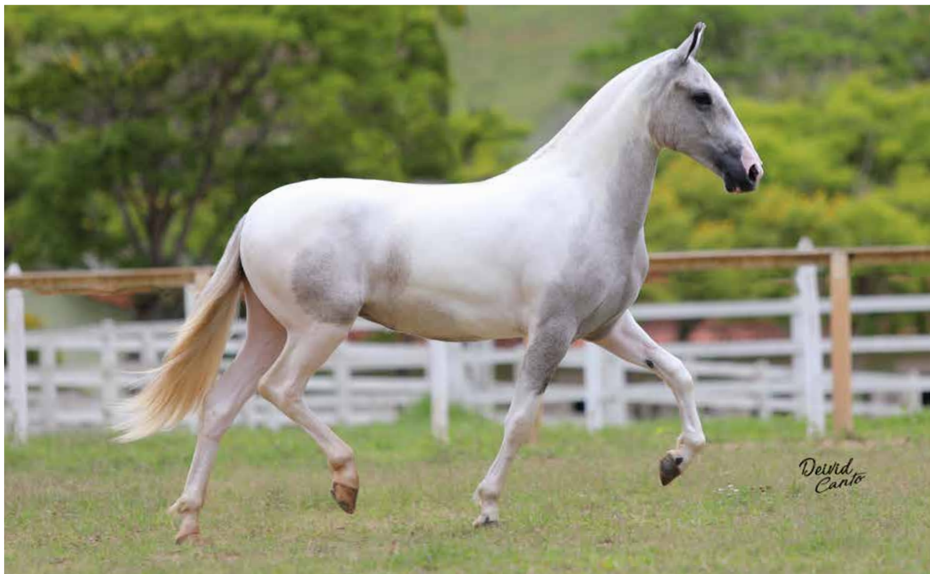
Seu pai, Futuro Formoso 2S

Caxambu Príncipe x Alfazema da Serra do Tinguá