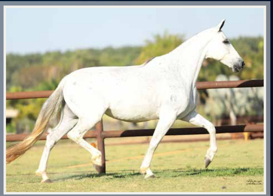
Tigrão Kafé (Palhaço de Ituverava x Tigreza da S. Jacinta) x Argônia Itambi da Stellamaris (Nobre de S. Lúcia x Aruana Itambi da Stellamaris)