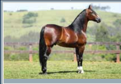
Lúcido da Figueira