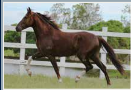
Monarca de Alcatéia