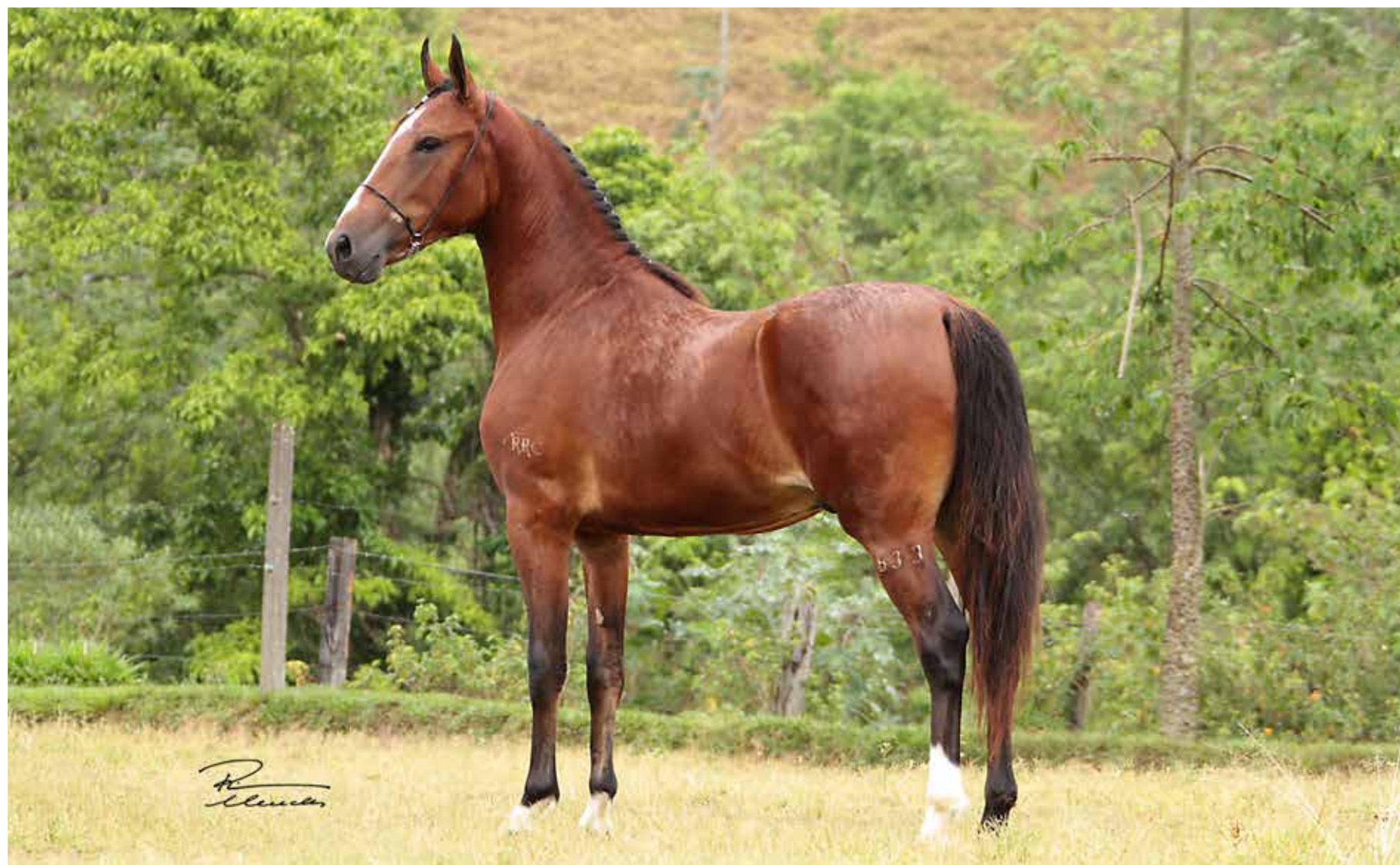
Seu pai, Galeão RRC

Máquina Quente do Rancho Pampa Equipado do Rancho Pampa x Baronesa de Mariana