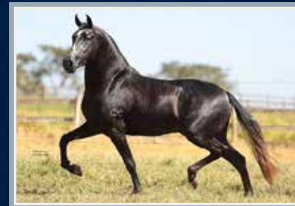
Seu filho, Neon Cristal PVB