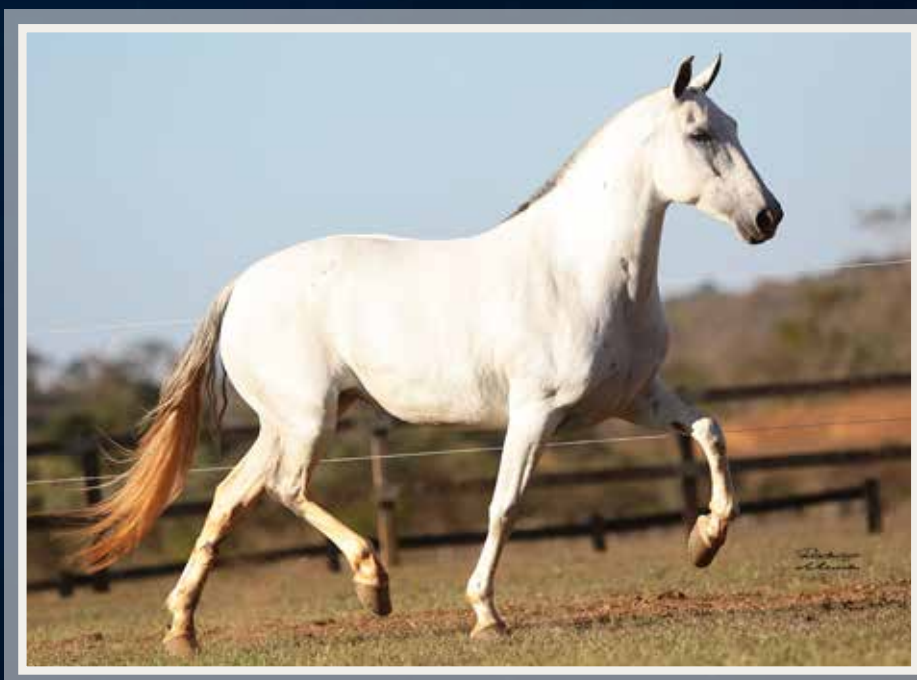
Favacho Diamante (Tabatinga Senegal x Favacho Xuxa) x Siara Xara (Favacho Único x Elza da Lapa Grande)