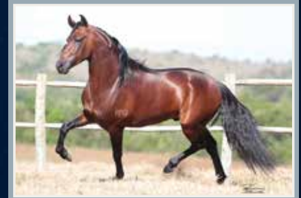
Forró do Aro