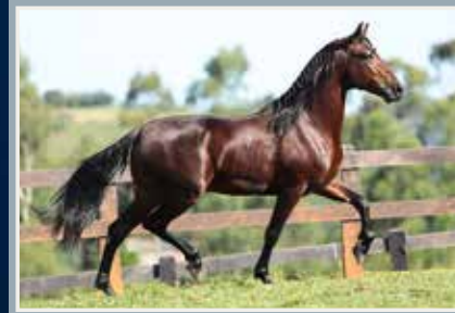
Onassis da Figueira