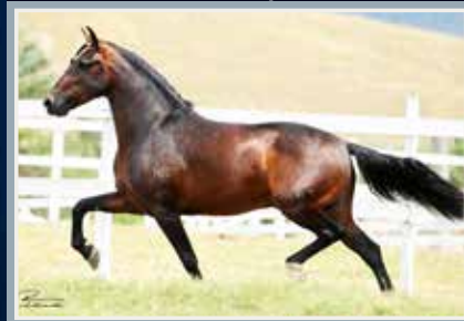
Kamikaze do MZC