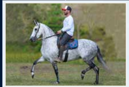
Sua filha, Relíquia do Minatto