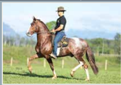
Obelisco do Minatto