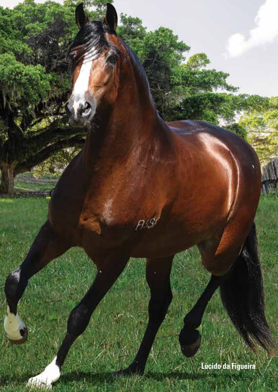
Lúcido da Figueira