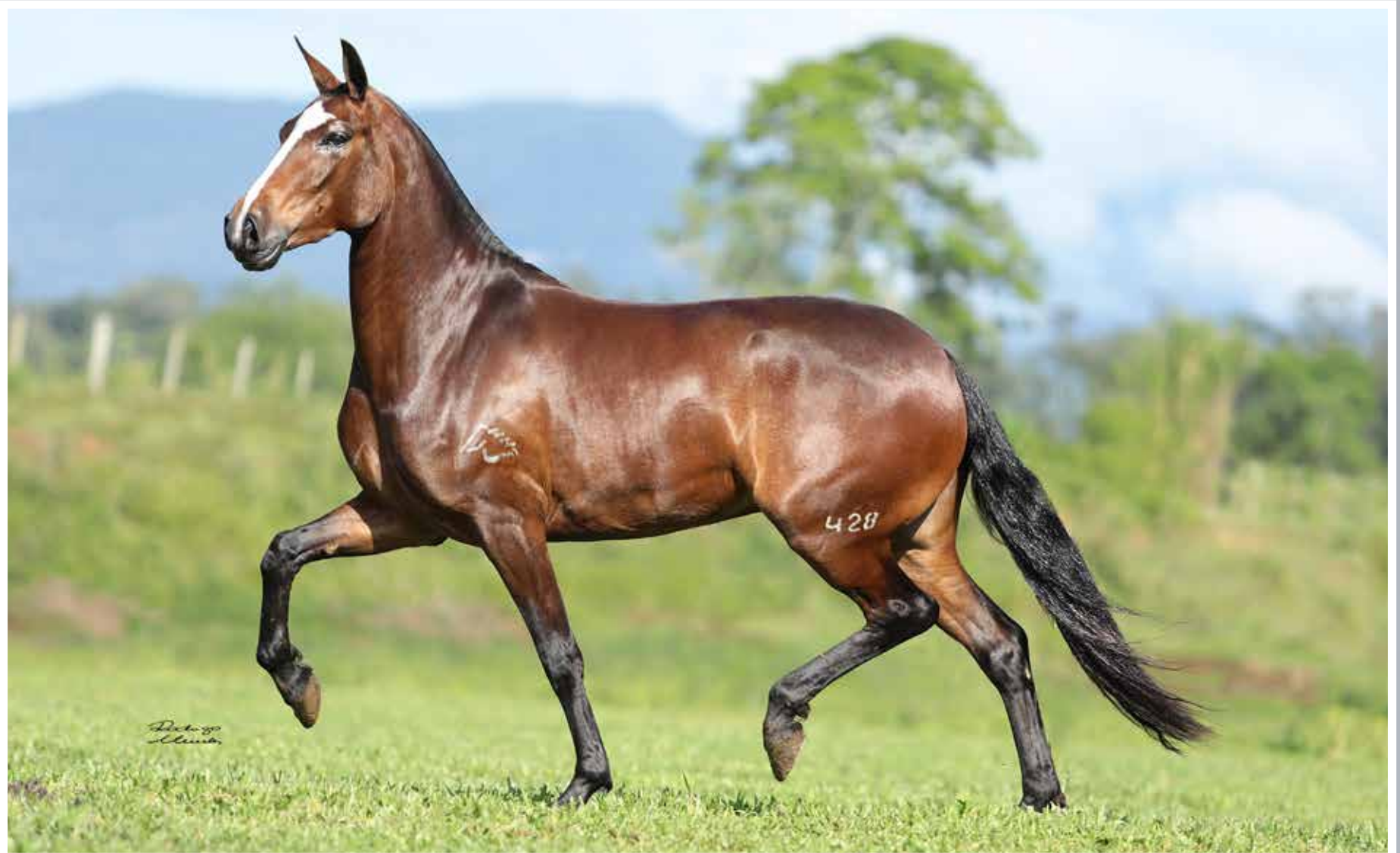
Seu pai, Impossível do Minatto