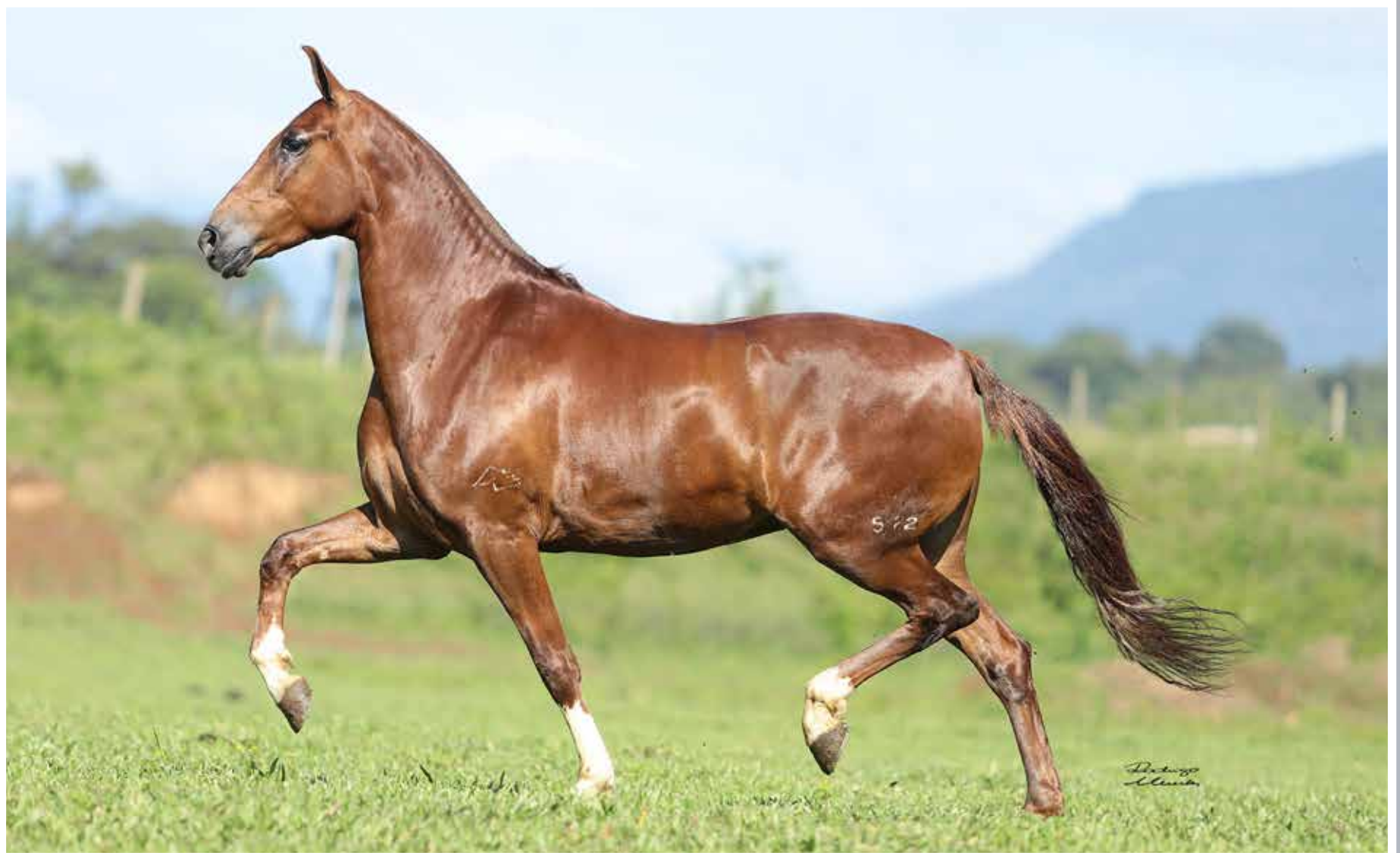
Seu irmão materno, Lúcido da Figueira