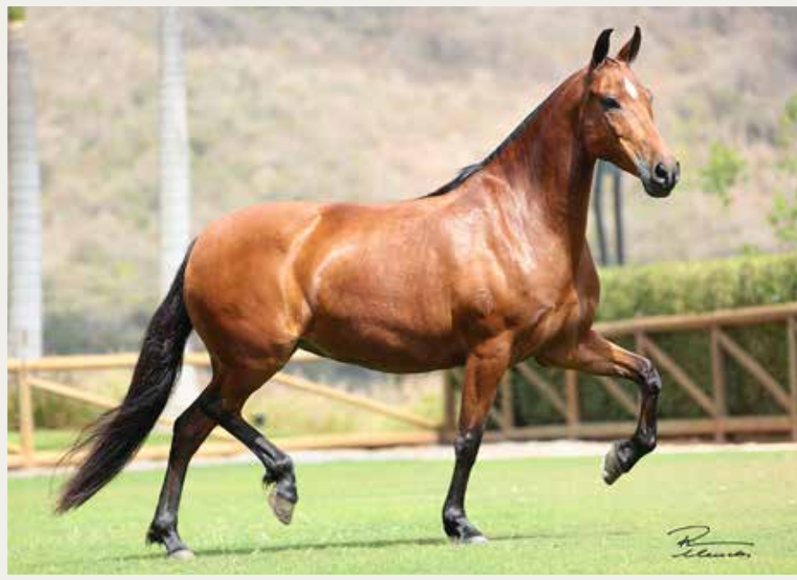
Tigrão Kafé (Palhaço de Ituverava x Tigreza da Santa Jacinta) x Saraúba do Berma (Nobre de Santa Lúcia x Carina do Engenho)