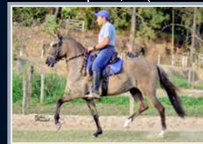
Sua irmã paterna, Noviça RRC