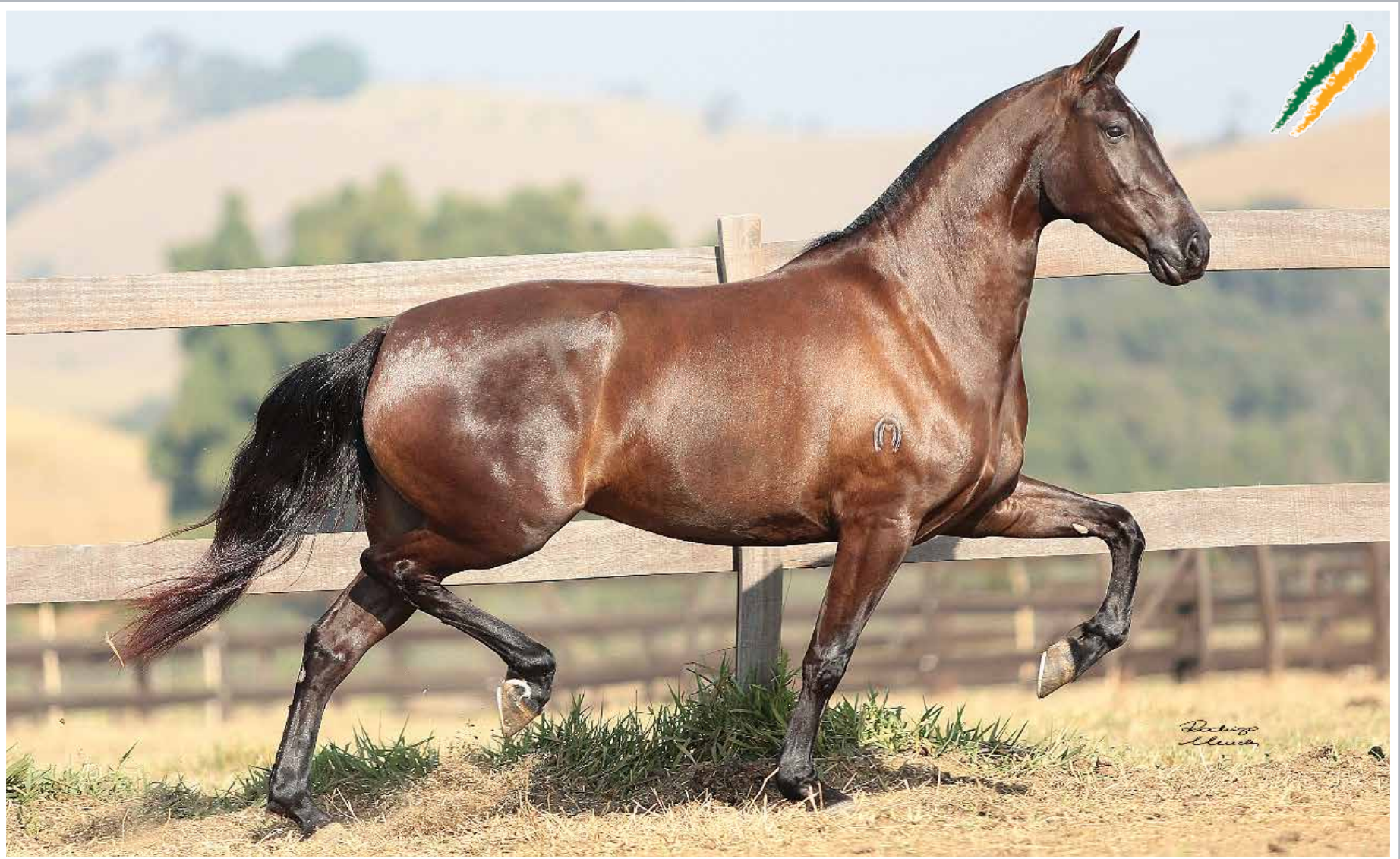
Seu pai, Jogo do Malboro

Abrigo D2 x Um Mil Duzentos Doze Prateado da Tosana