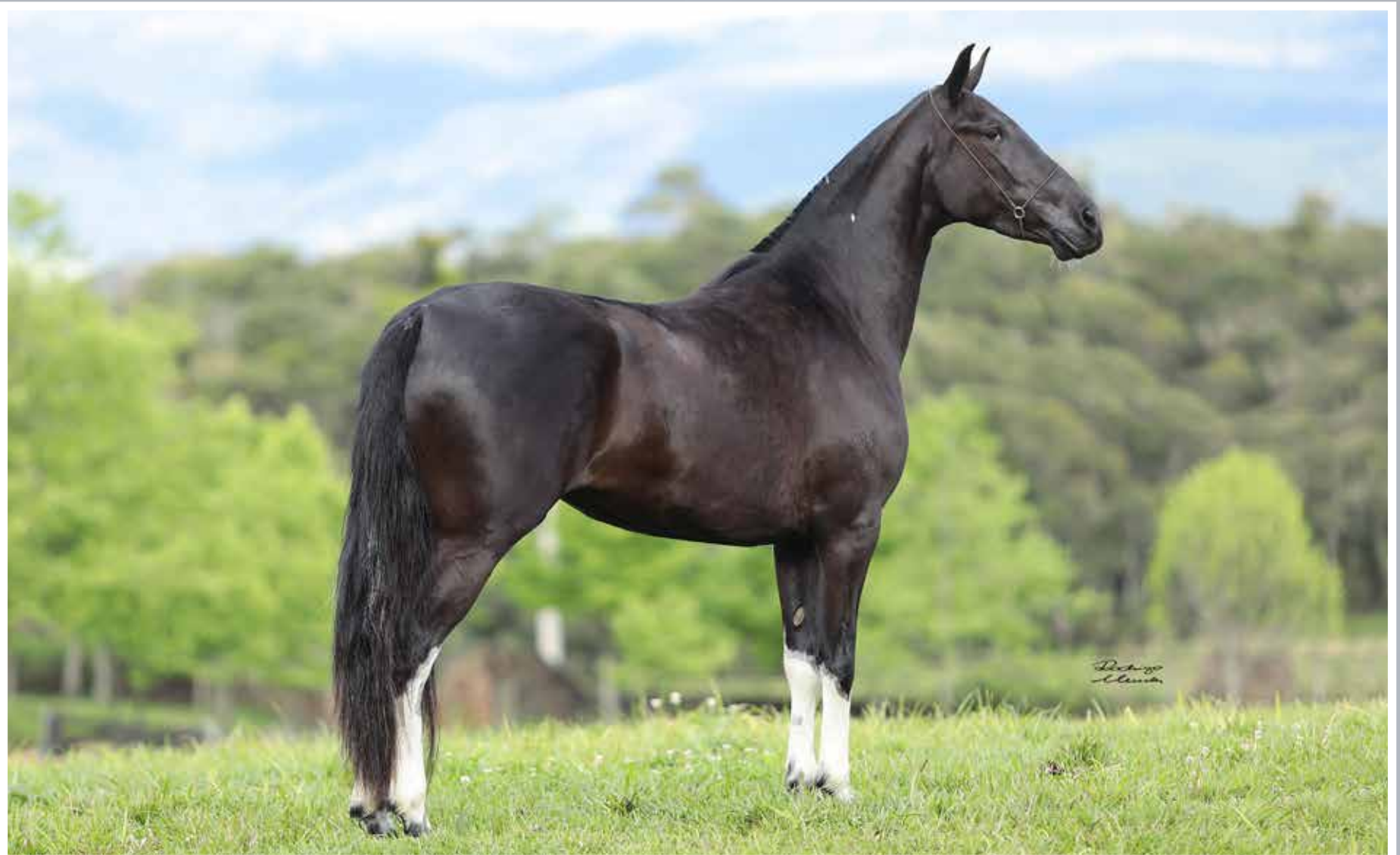
Seu avô paterno, Extrato do Minatto