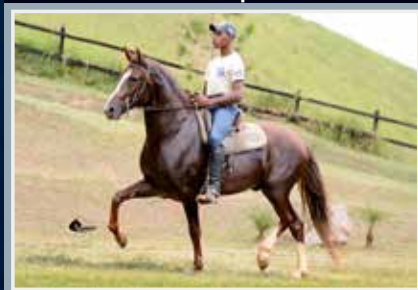
Quartel Santa Rosa