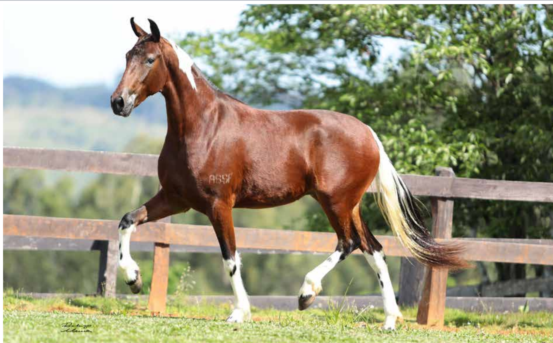
Seu pai, Forró do Aro

Galante do Expoente x Fagulha do Expoente