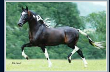
Seu avô paterno, Sublime da Ogar