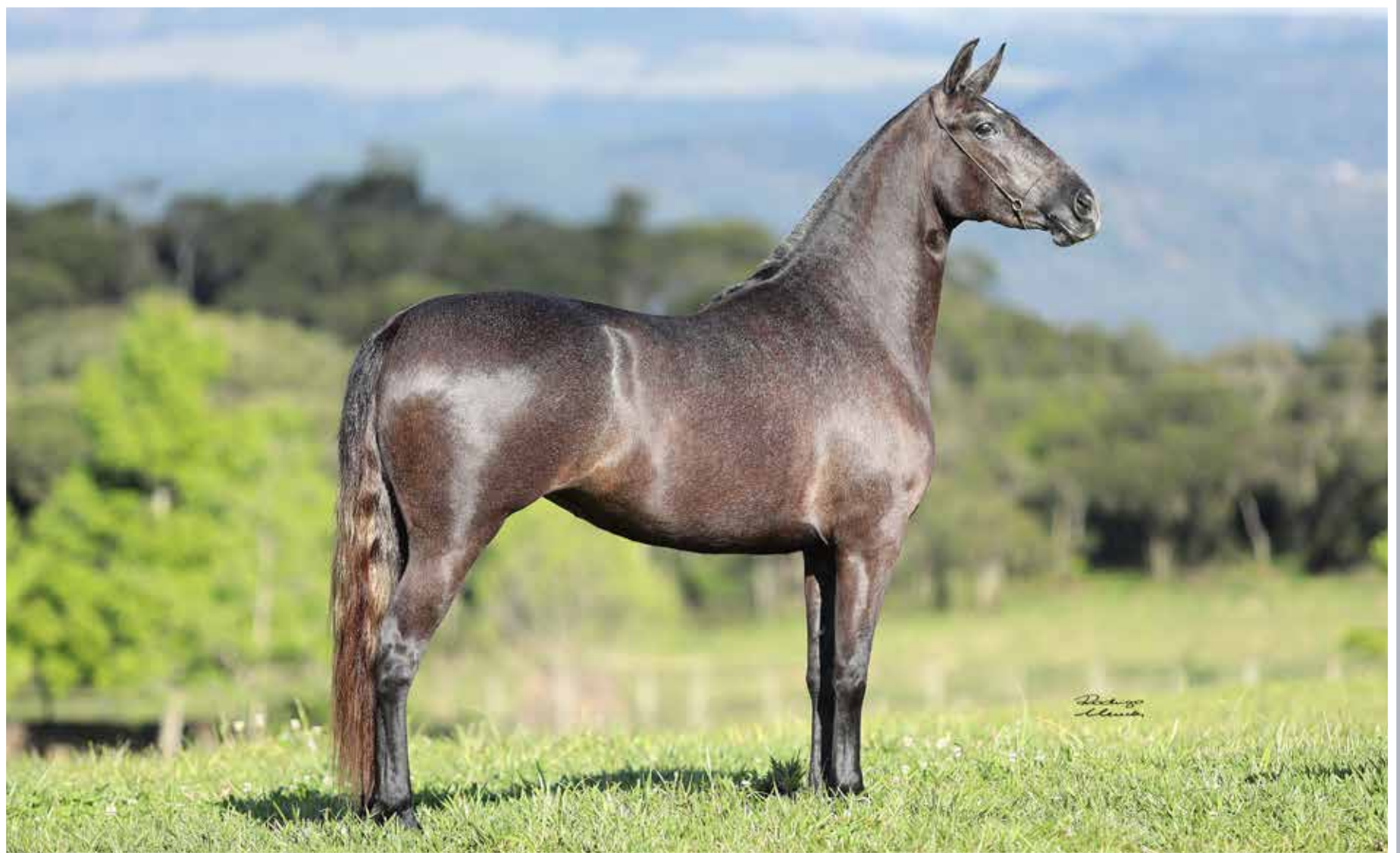
Seu pai, Forró do Aro

Nobre de Santa Lúcia x Espoleta do Cardeal