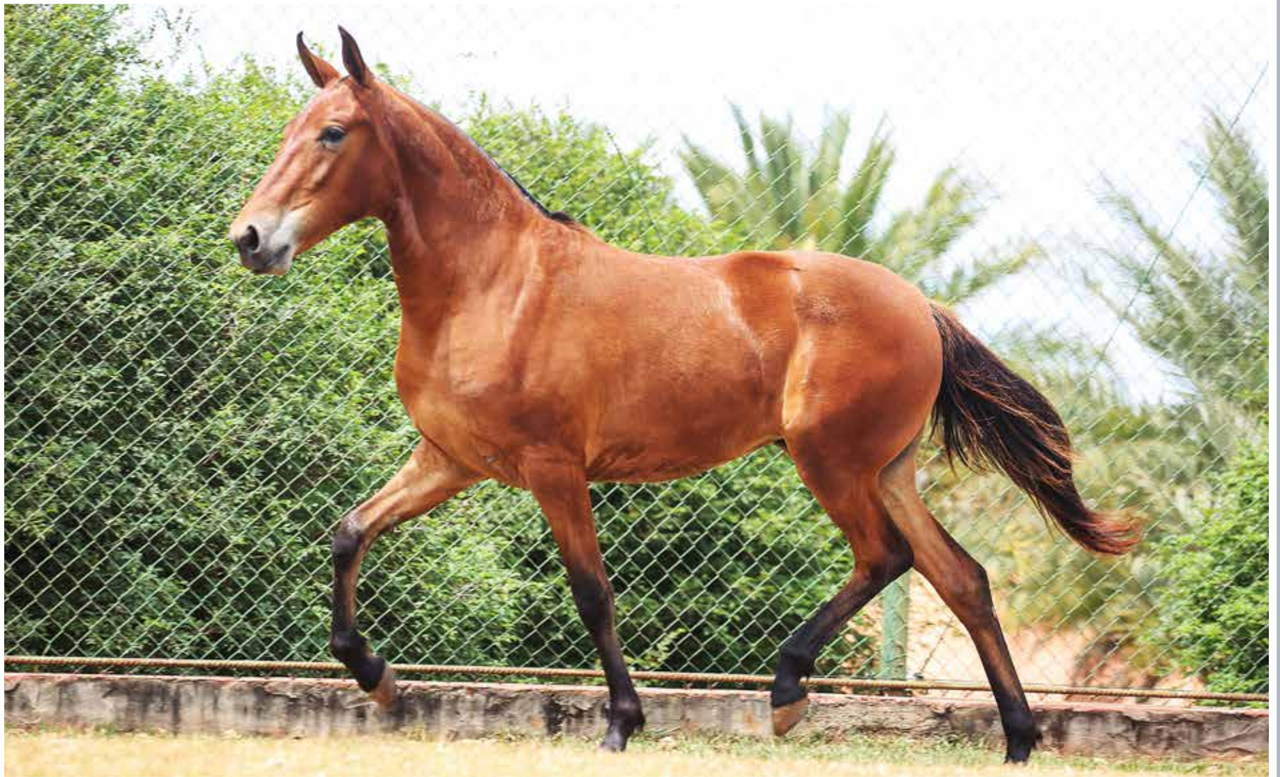
Seu pai, Esteio de Três Corações