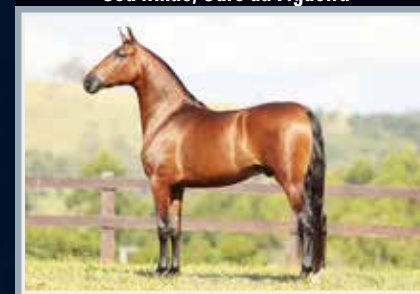
Seu irmão, Ouro da Figueira