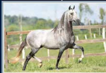
Juíz de Alcatéia