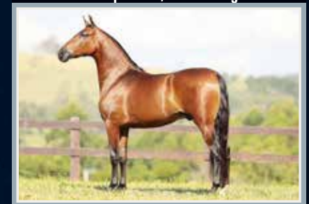
Seu irmão paterno, Ouro da Figueira