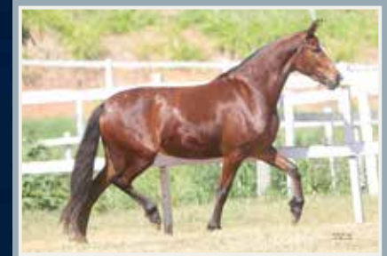
Sua filha, Tezoura DBG