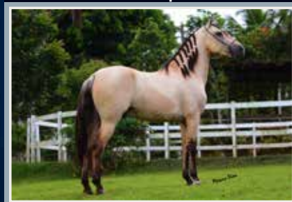
Jogo de Alcatéia