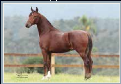
Campeão Nacional Potro 2019