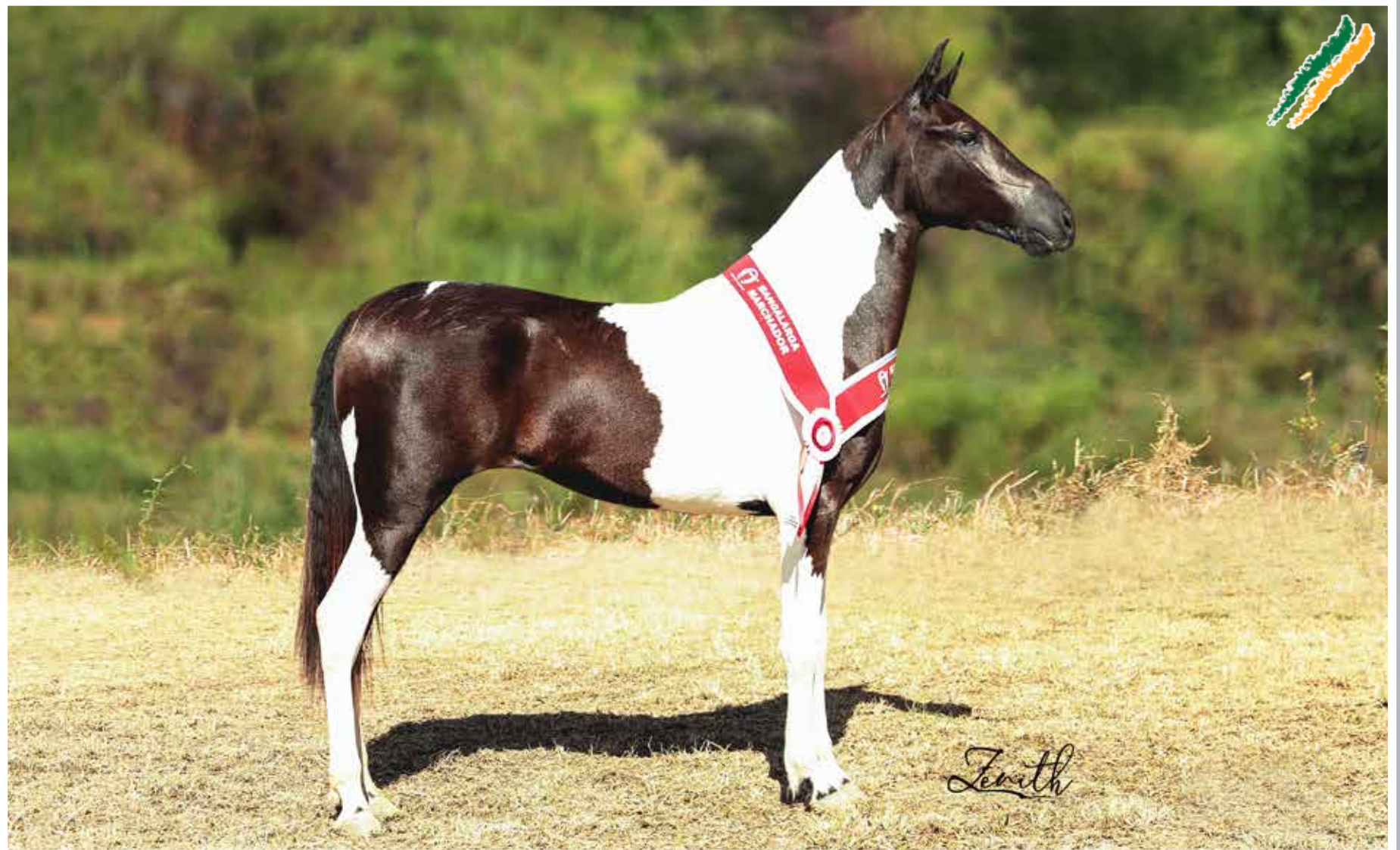
Seu avô paterno, Extrato do Minatto

El Negro da Cachoeira x Atrevida Caxambuense