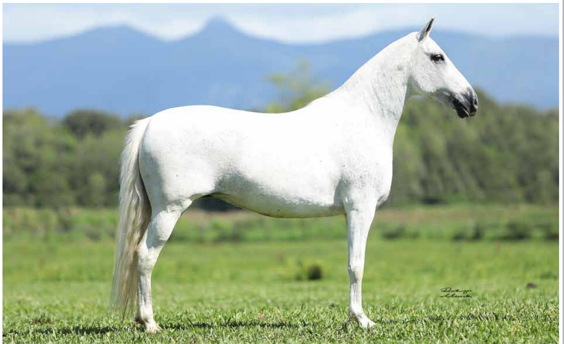
Seu filho, por Imperador da Ilha

Luma do Morro Queimado S.B. Orpheu x Caxambu Érika