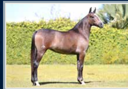
Campeã Potra Jovem - Nacional 2018