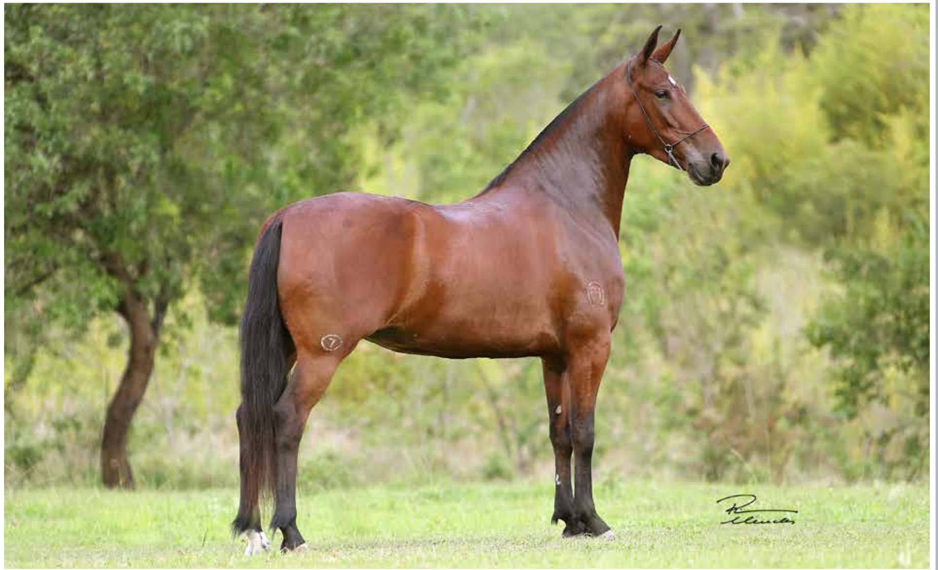
Seu pai, Delete Caxambuense

Mustang de Maru-Mari x Xangrilá Caxambuense