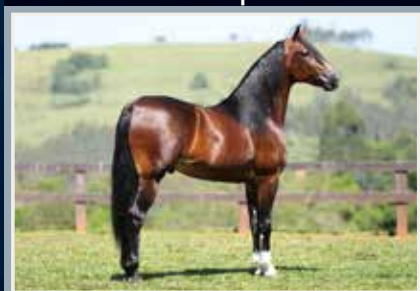
Lúcido da Figueira - Data: 13/10/2019