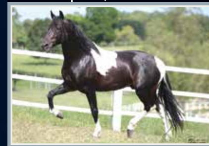
Seu avô paterno, Extrato do Minatto