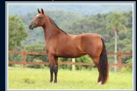
Campeã Nacional Potra Master 2019