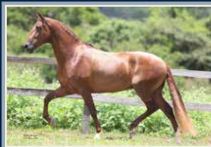
Campeão de Marcha - Nacional 2018