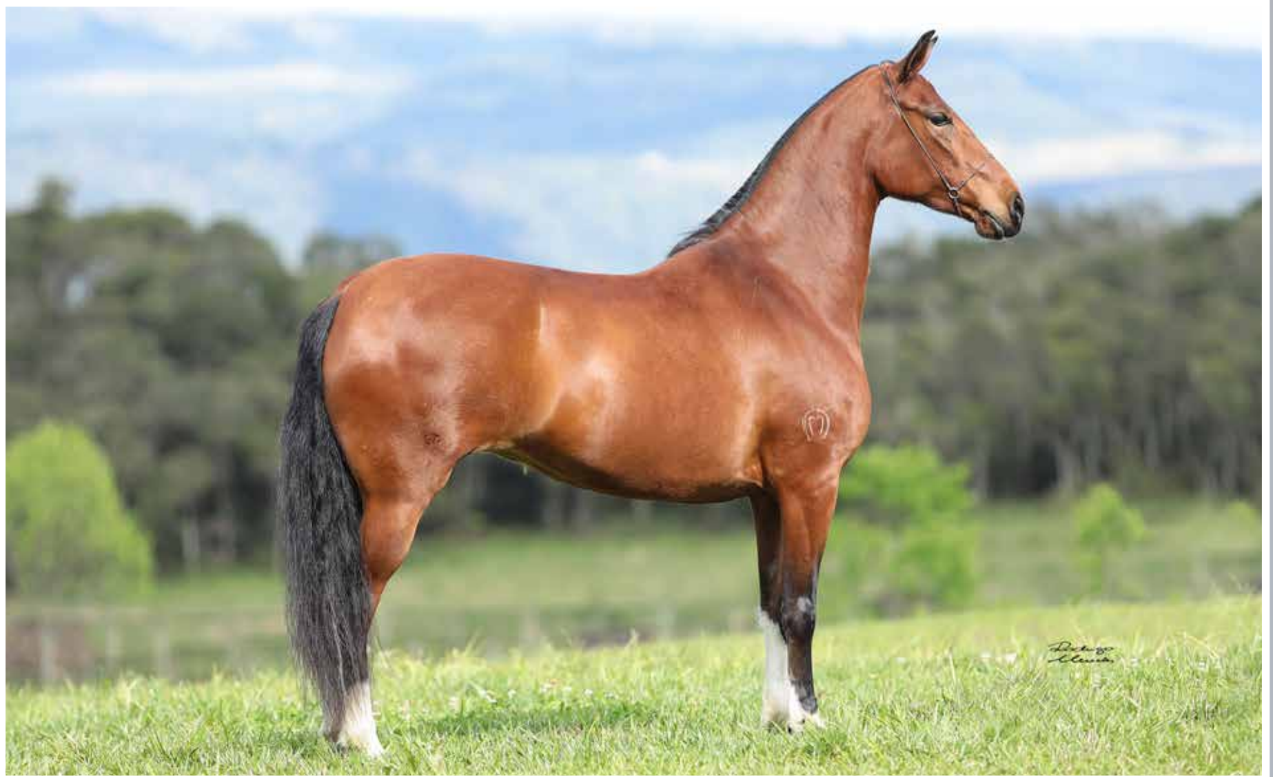
Seu pai, Iguaçu do Expoente

Odisséia de Sambaqui Faraó do Jurerê x Dádiva de Sambaqui