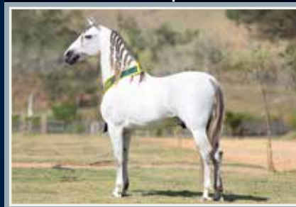
Eldorado da Boa Terra

Campeão dos Campeões de Marcha Nacional 2018