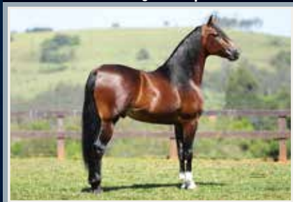
Lúcido da Figueira