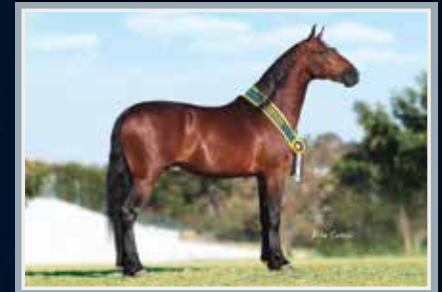
Campeão dos Campeões Cavalos Jovem de Marcha - Nacional 2018