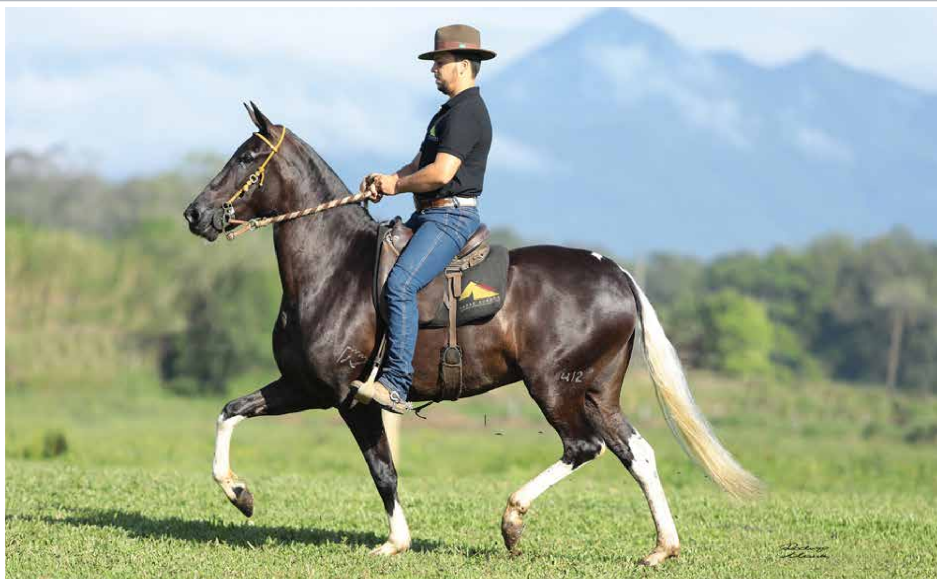
Sua irmã paterna, Onça do Minatto