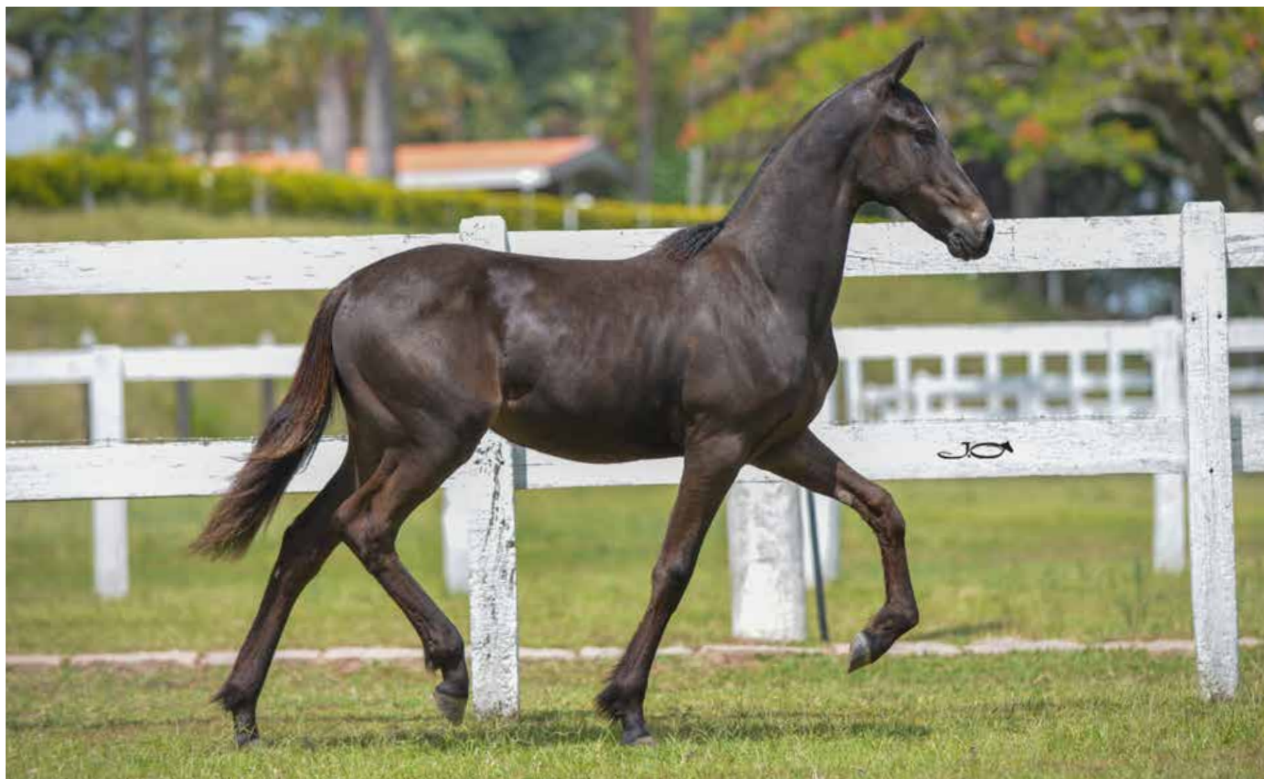
Seu pai, Caxambu Ídolo