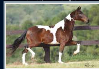
Sua mãe, Duetta da Figueira