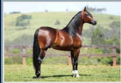
Lúcido da Figueira