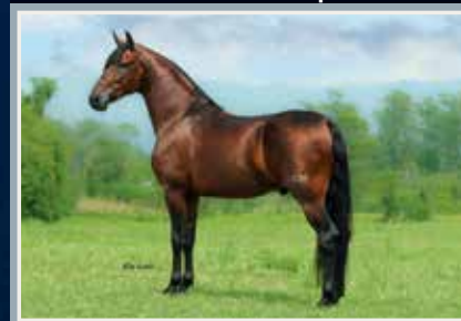
Novato do Minatto