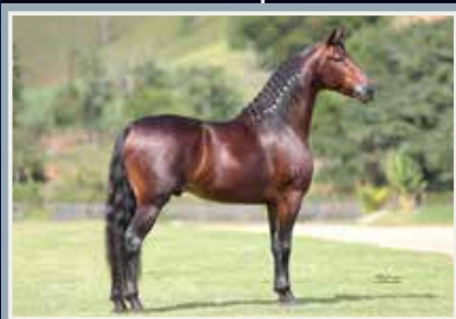
Abiara da Figueira