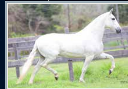
Sua mãe, Arara das Minas Gerais