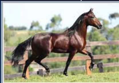
Onassis da Figueira