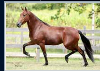
Sua mãe, Honda Caxambuense