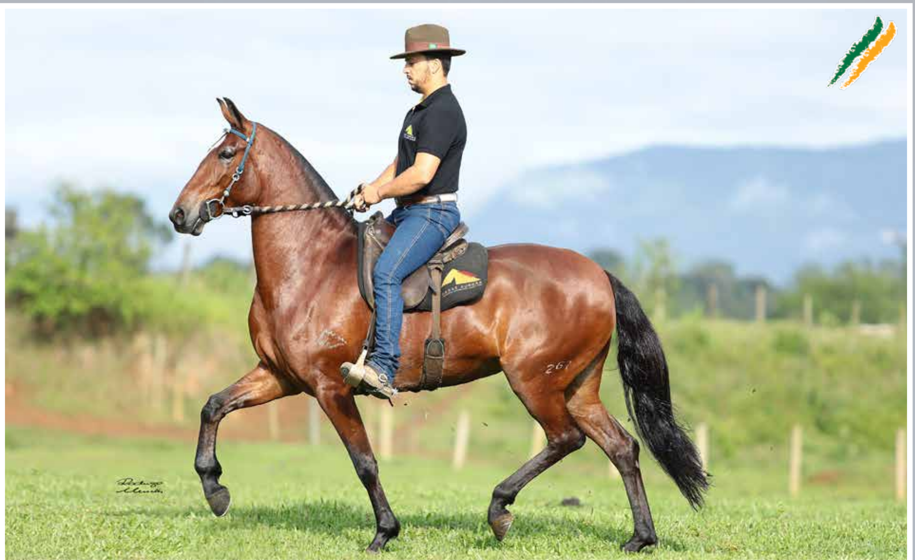
Seu pai, Impossível do Minatto

Latino de Dourado S.M. x Berlinda da Visão