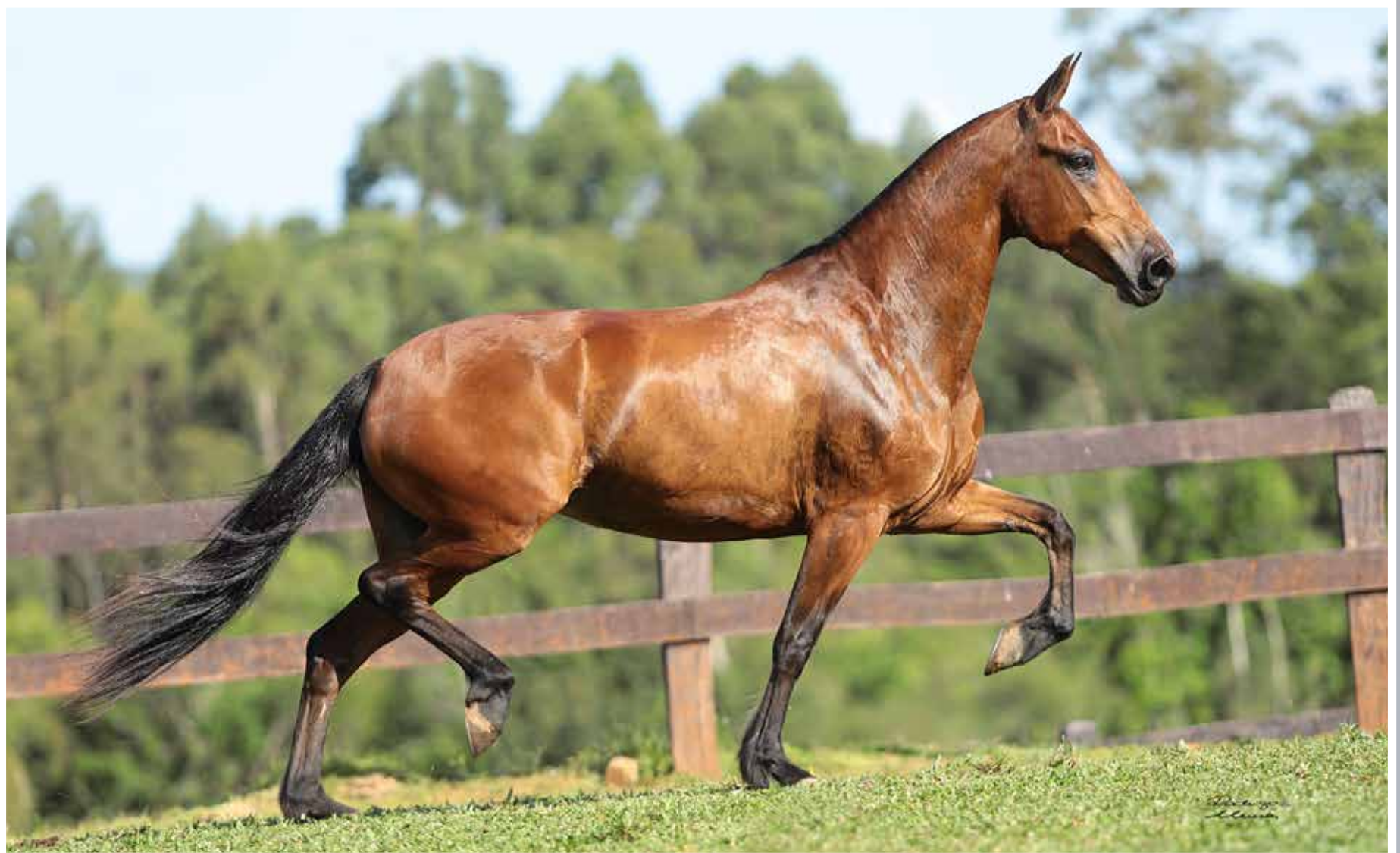
Sua filha, Isaura da Figueira