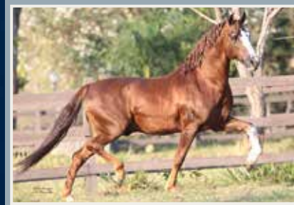
Embrião a coletar por