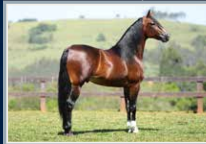
Lúcido da Figueira