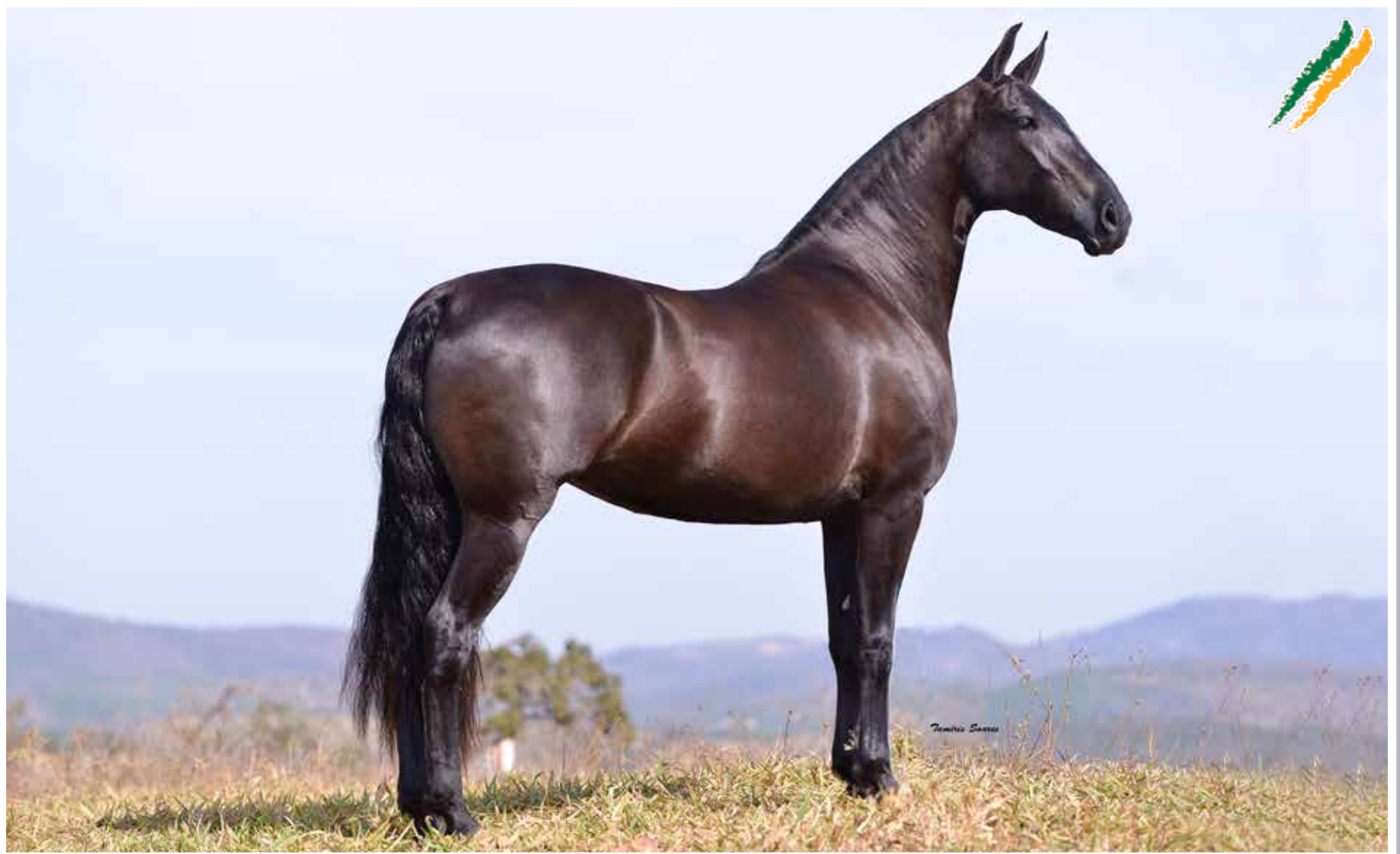
Seu pai, Senegal da Morada Nova

Irada do Jacurutu Beijo J.B. x Spuma do Berma