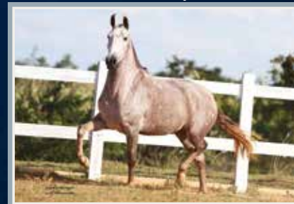
Grande Campeã de Marcha - Nacional 2014