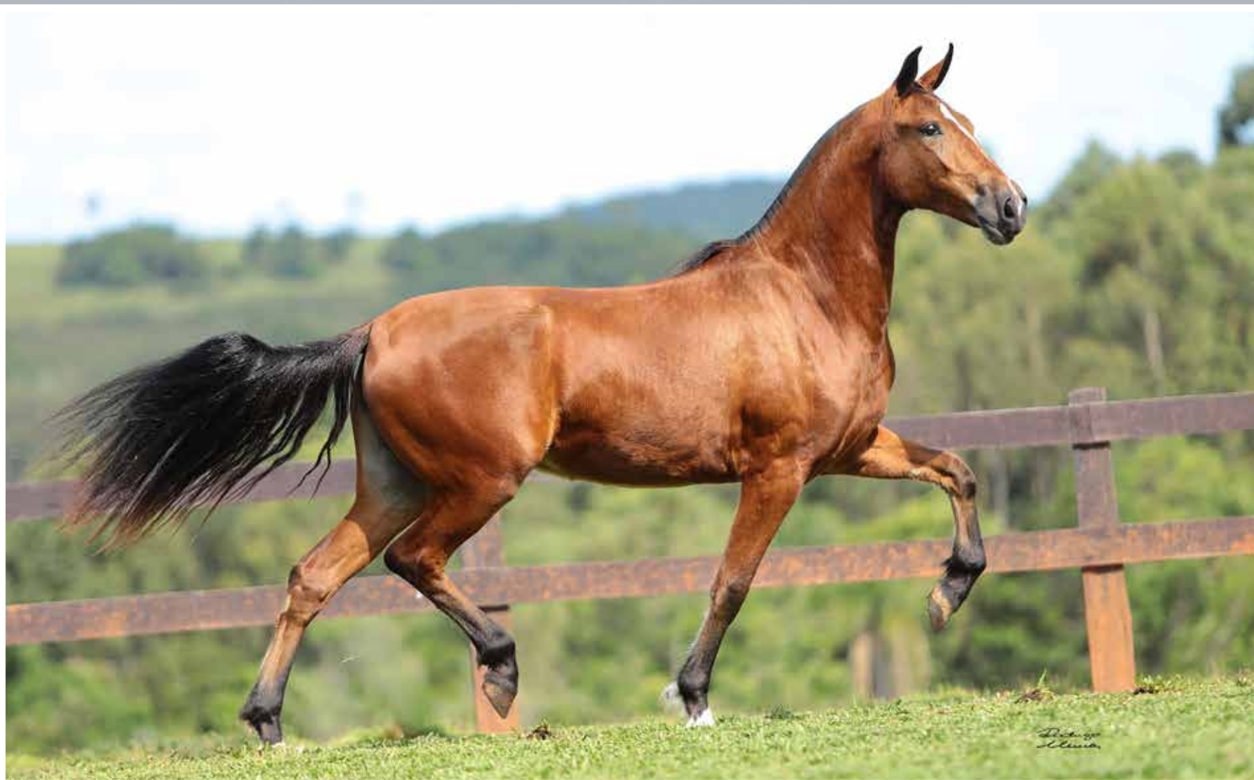
Seu pai, Galante do Expoente

Holandesa do Expoente Sublime da Ogar x Sevilha da Selva Morena