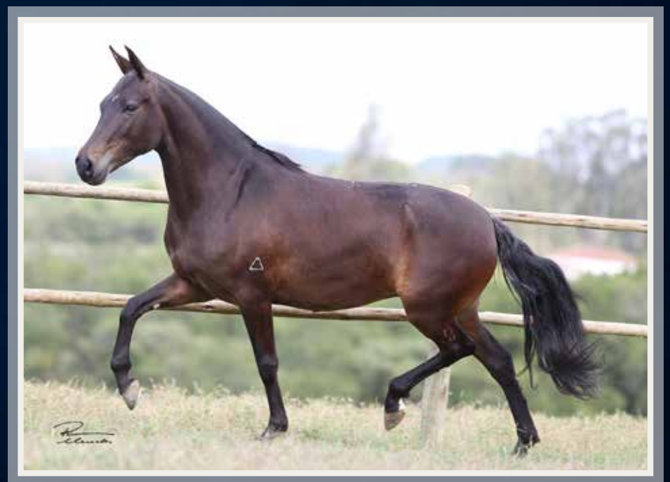
Argos das Minas Gerais (Damasco da Ogar x Dançarina da Gamboa) x Tapera Kafé (Dacar Kafé da Nova x Favela Kafé)