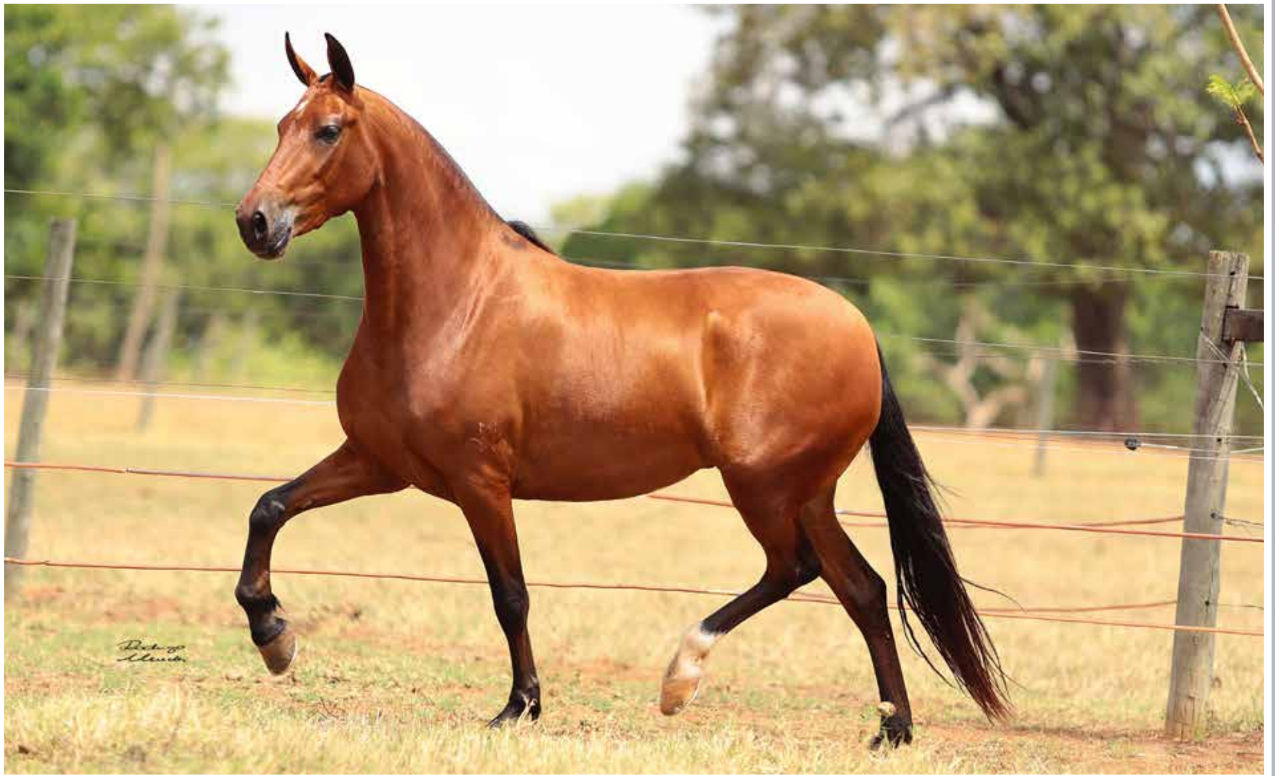
Seu pai, Atrevido da Morada Nova

Jabuti da Mandassaia x Jandáia da Catimba