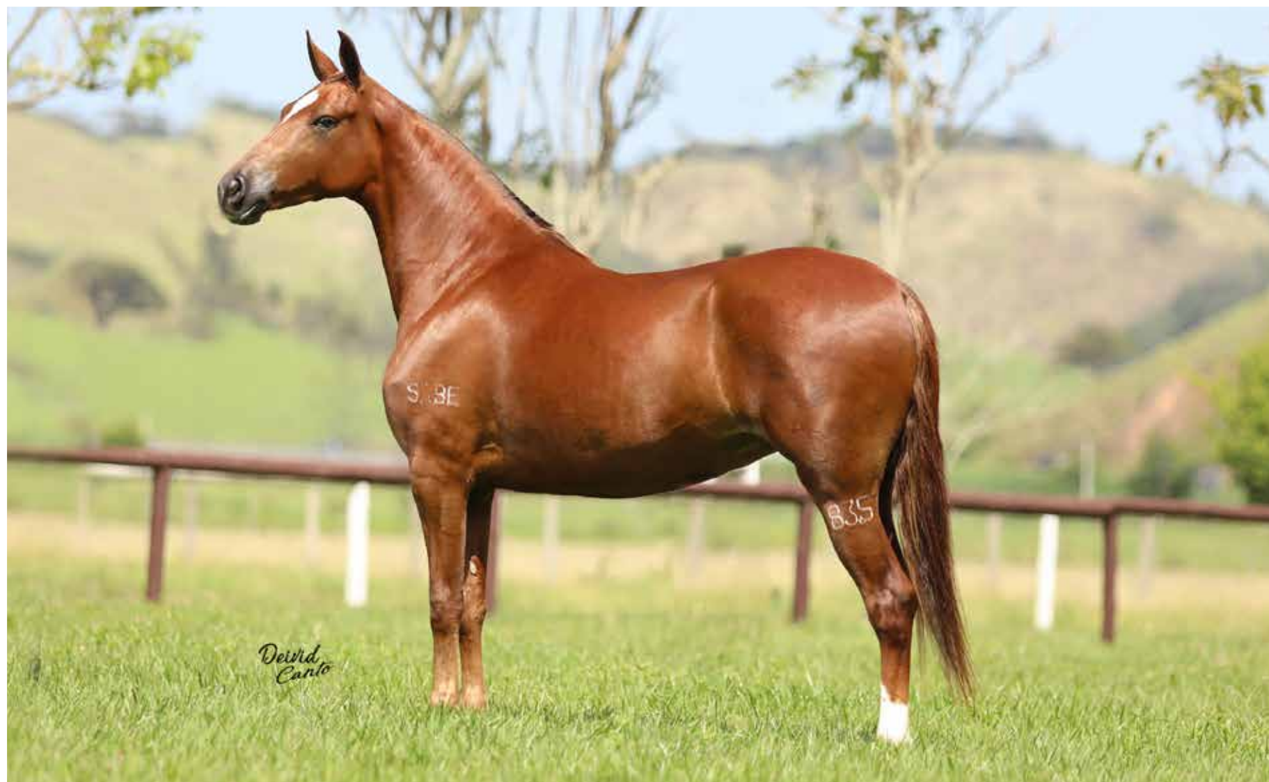
Seu pai, late de Alcatéia