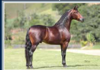
Abiara da Figueira