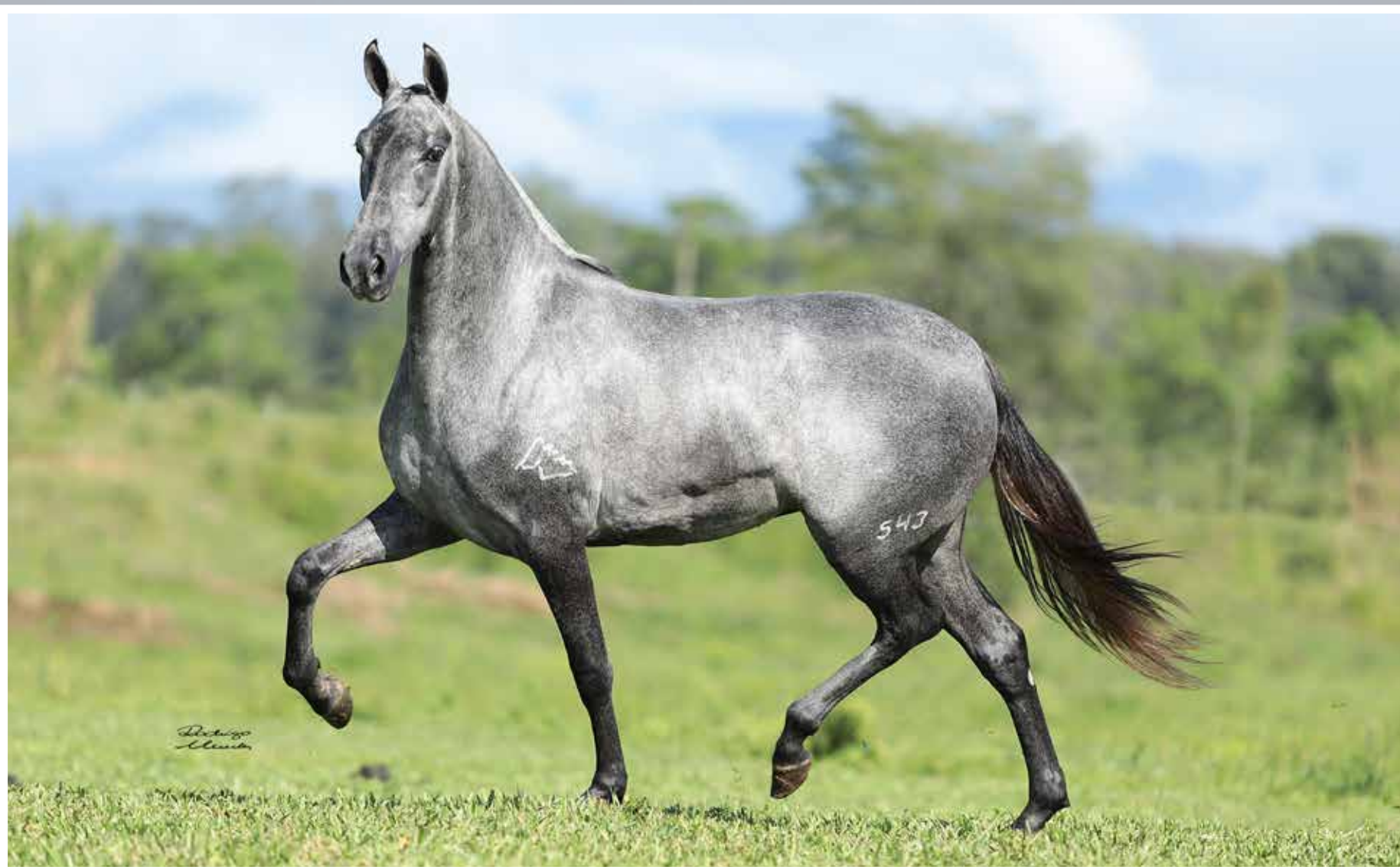
Seu avô paterno, Impossível do Minatto