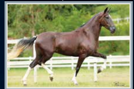
Sua mãe, Serena DBG