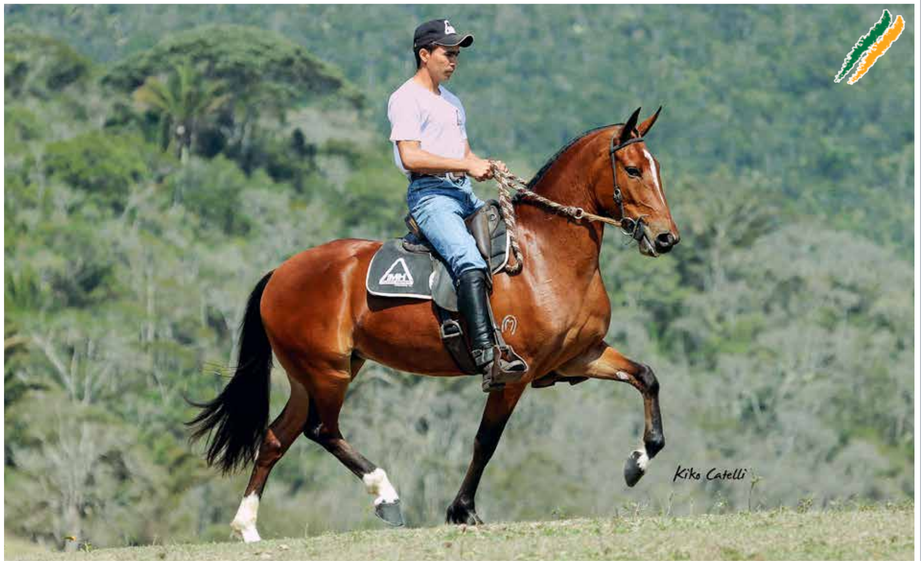
Seu pai, Guarítá Seara Dourada

Utopia Mocoquense Querento Mocoquense x Luanda Mocoquense)