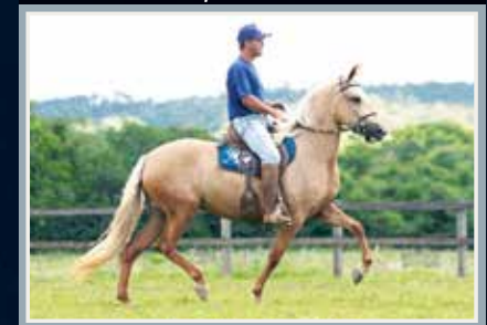
Sua mãe, Obsessão do Yuri