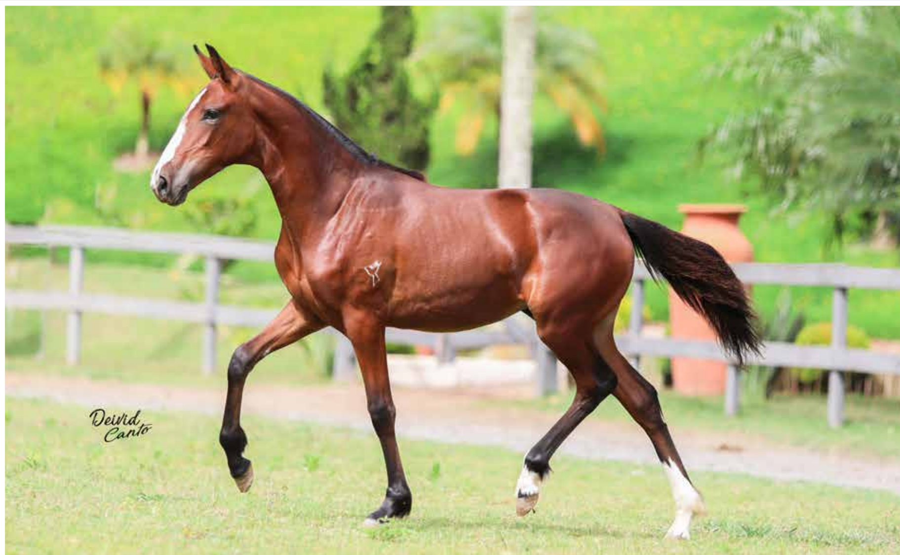
Seu pai, Juazeiro São Pedro