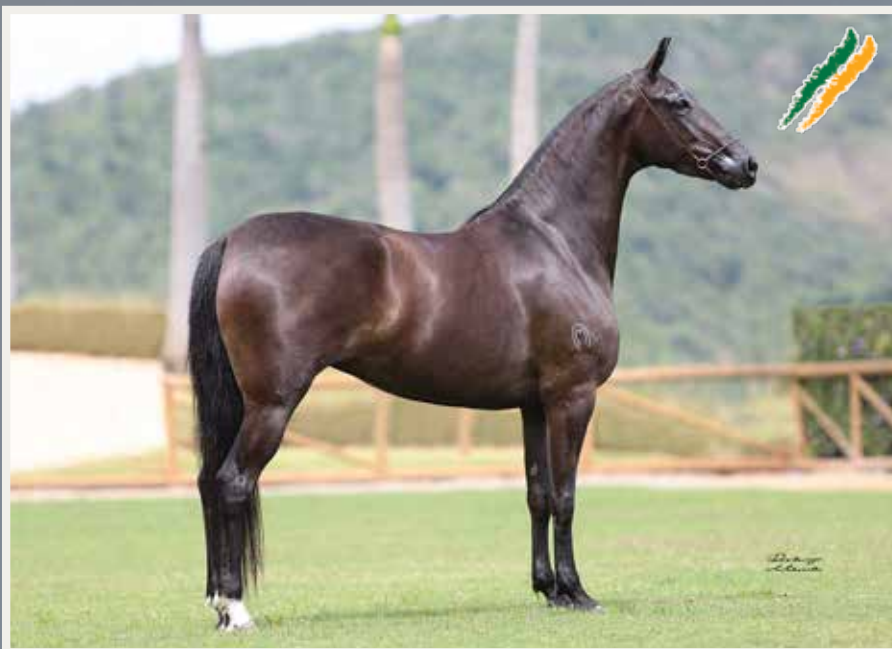
Hércules F.K. (Favacho Diamante x Sapoti do Aeroporto) x Sapeco da Pao Grande (Tigrão Kafé x Laís de Dourado S.M.)