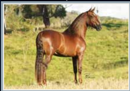
Campeão dos Campeões de Marcha Nacional 2019