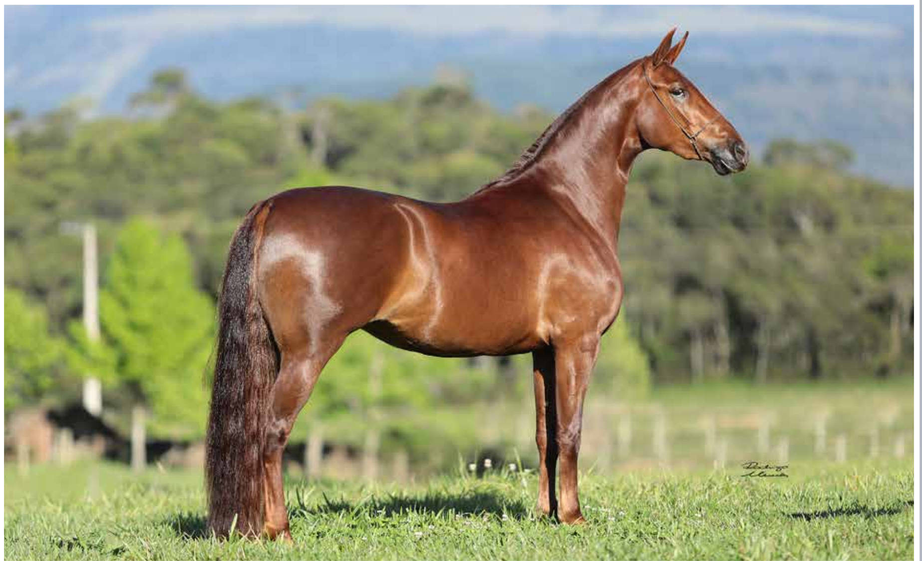
Seu pai, Forró do Aro

Raybam da Santa Esmeralda x Quitandinha da Santa Esmeralda