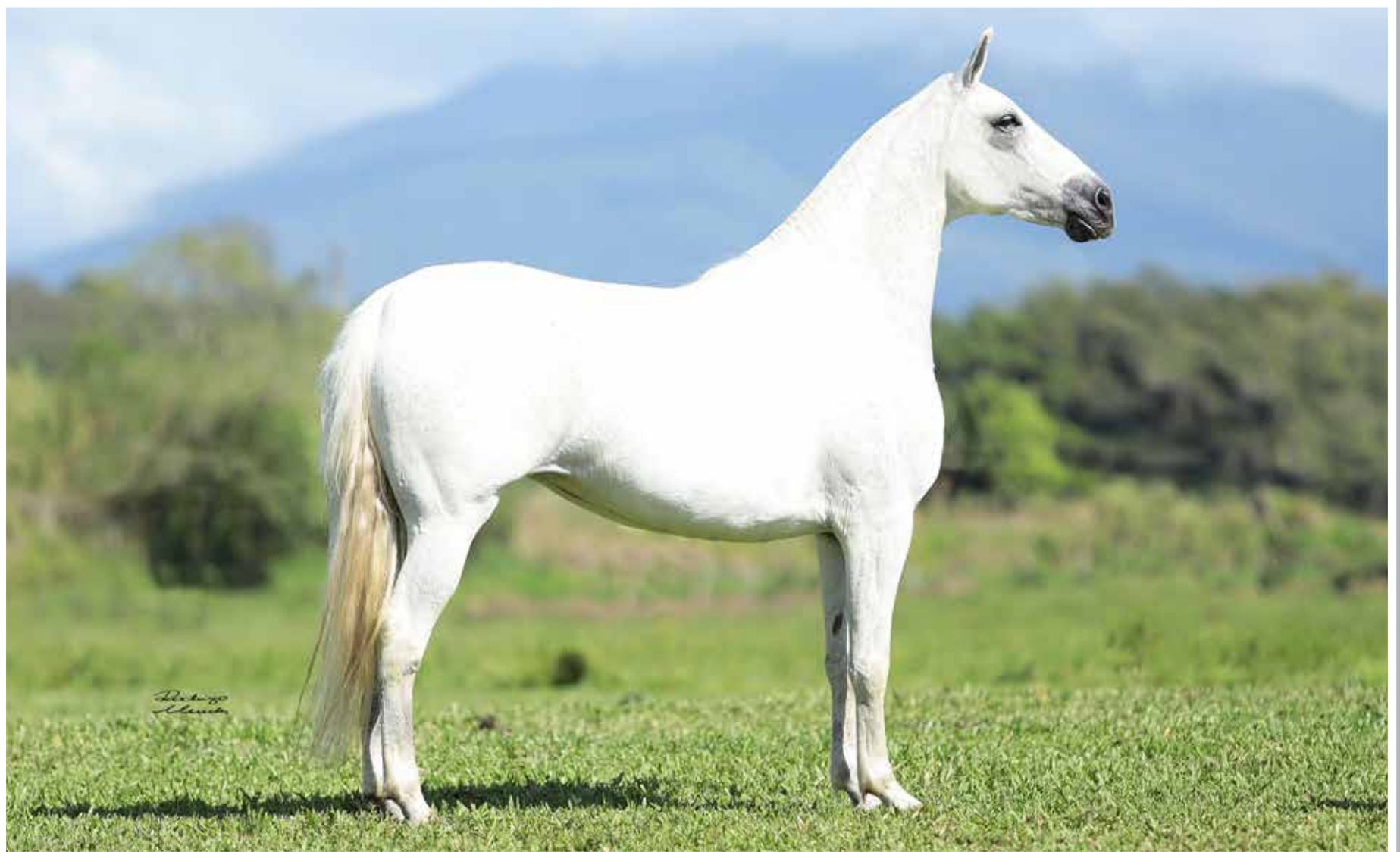
Embrião gestado por

Helena do Minatto Ringo D2 x Luma do Morro Queimado