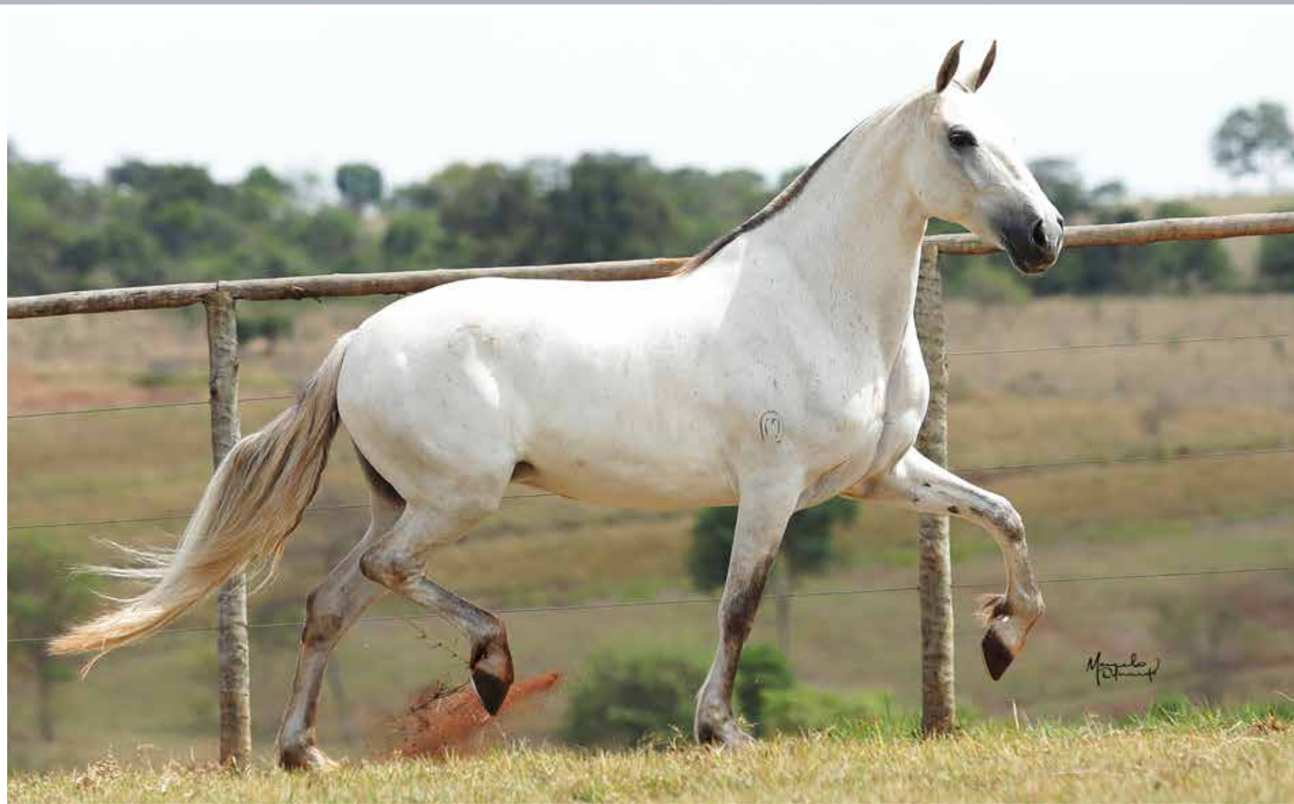
Seu pai, Fator da Cavarú-Retã

Safira de Três Corações Damasco da Ogar x Futurista de Três Corações