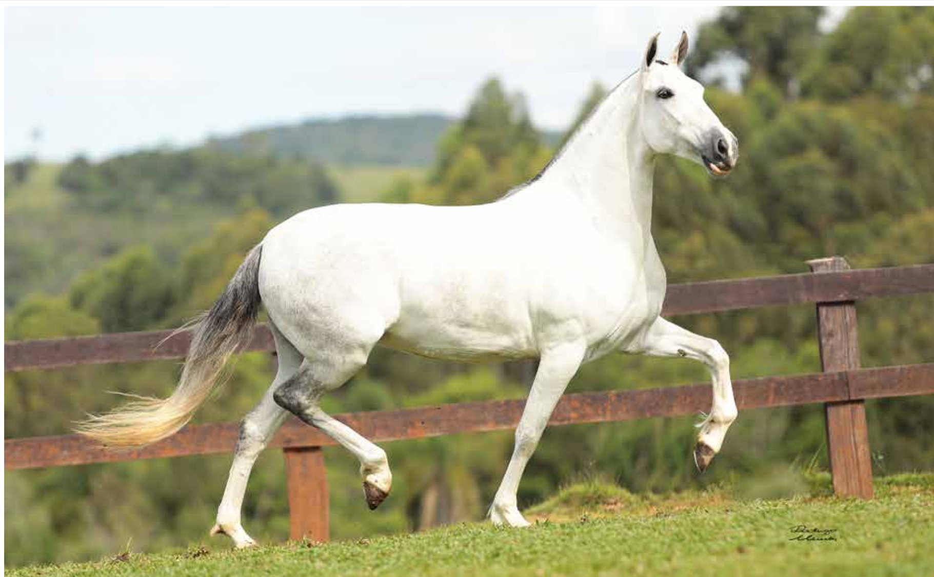
Seu pai, Galante do Expoente

Arara das Minas Gerais Damasco da Ogar x Jandaia H.2