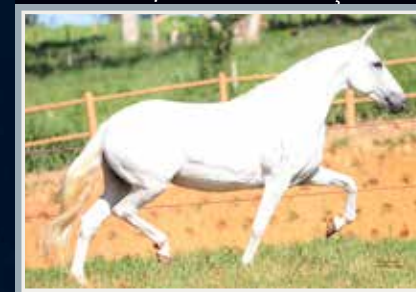
Sua mãe, Safira de Três Corações