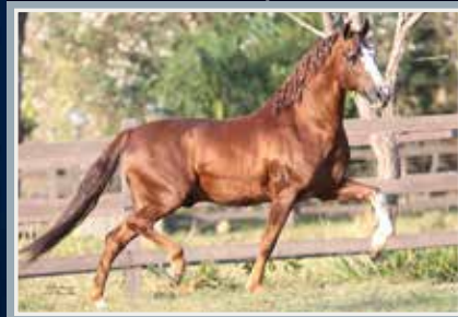
Galante do Expoente