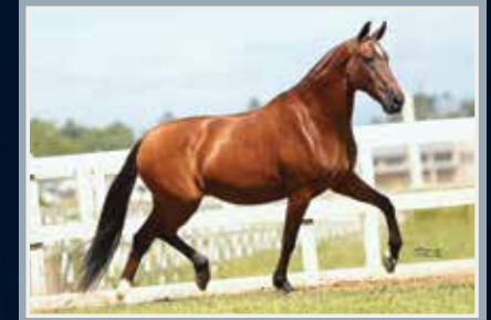
Sua mãe, Baliza do Minatto