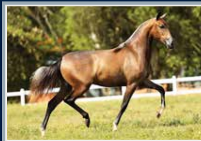
Campeã das Campeãs Nacional Jovem - 2019