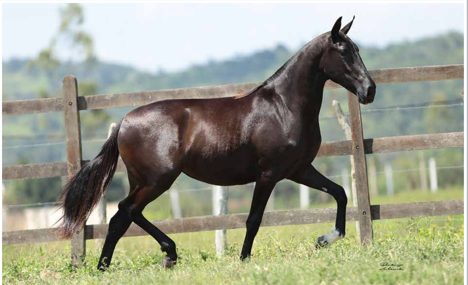
Seu pai, Juiz de Alcatéia

Gigante Convibrás x Tequila do Porto Palmeira