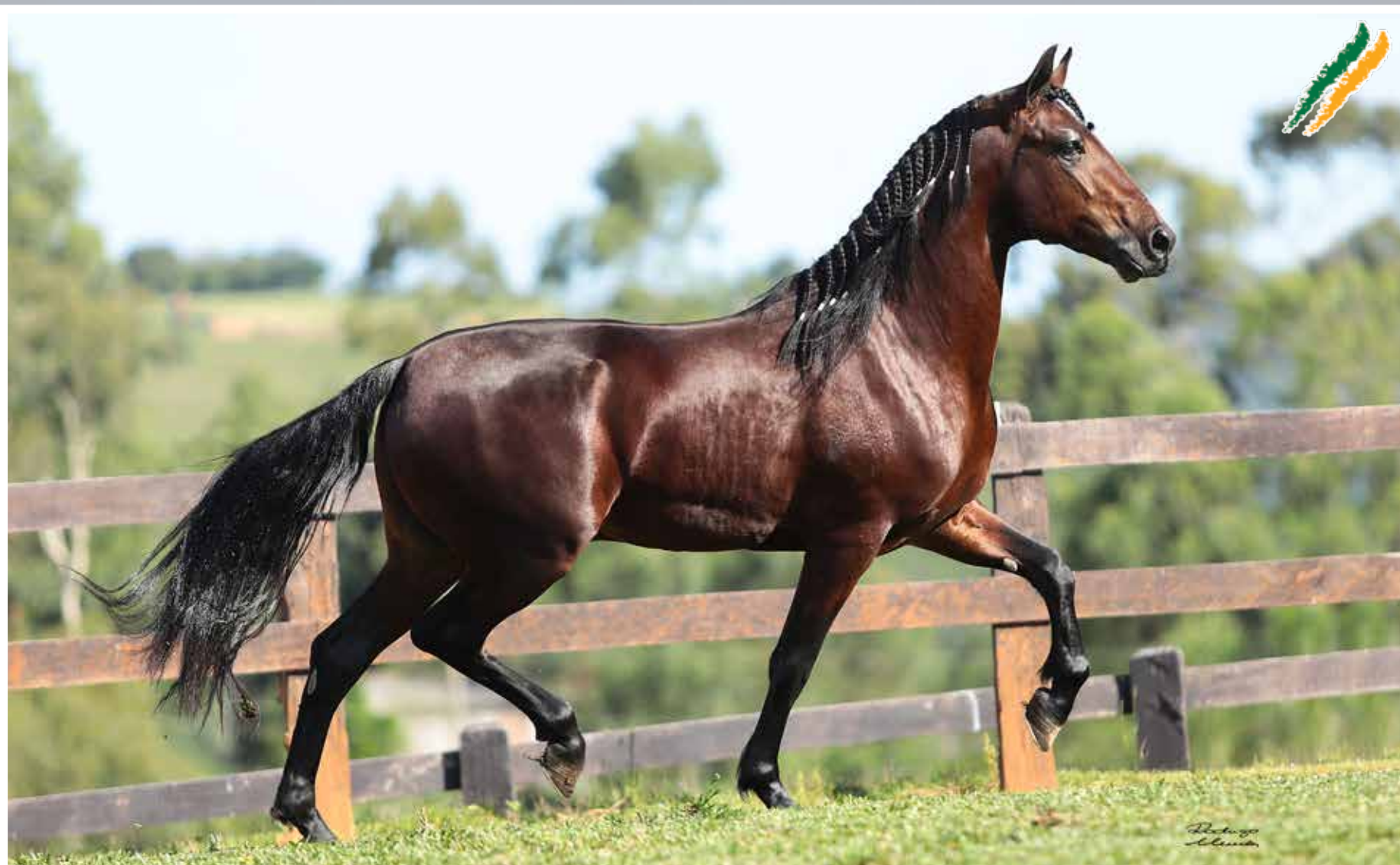
Seu pai, Galante do Expoente

Honra da Figueira Fharuk J.J.M.R. x Rodovia do Conforto