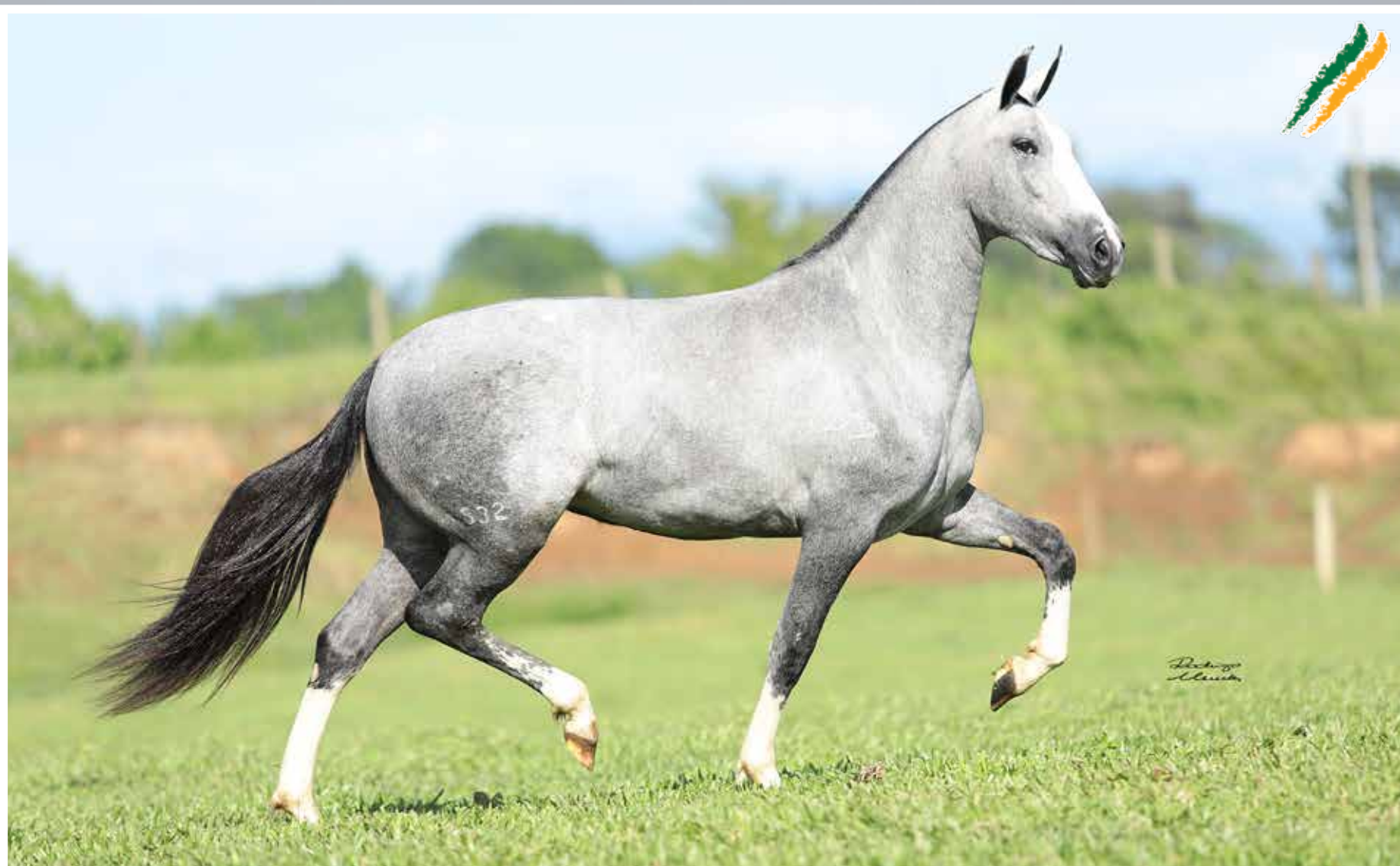
Seu pai, Obelisco do Minatto