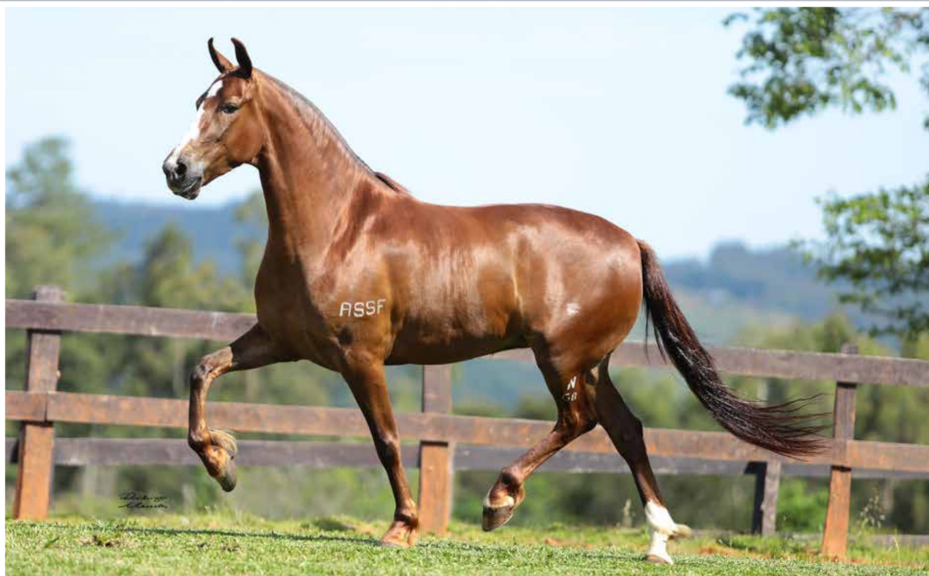
Seu pai, Galante do Expoente

Guerreira Meus Amores Sublime da Ogar x Paixão do Rancho Pablo