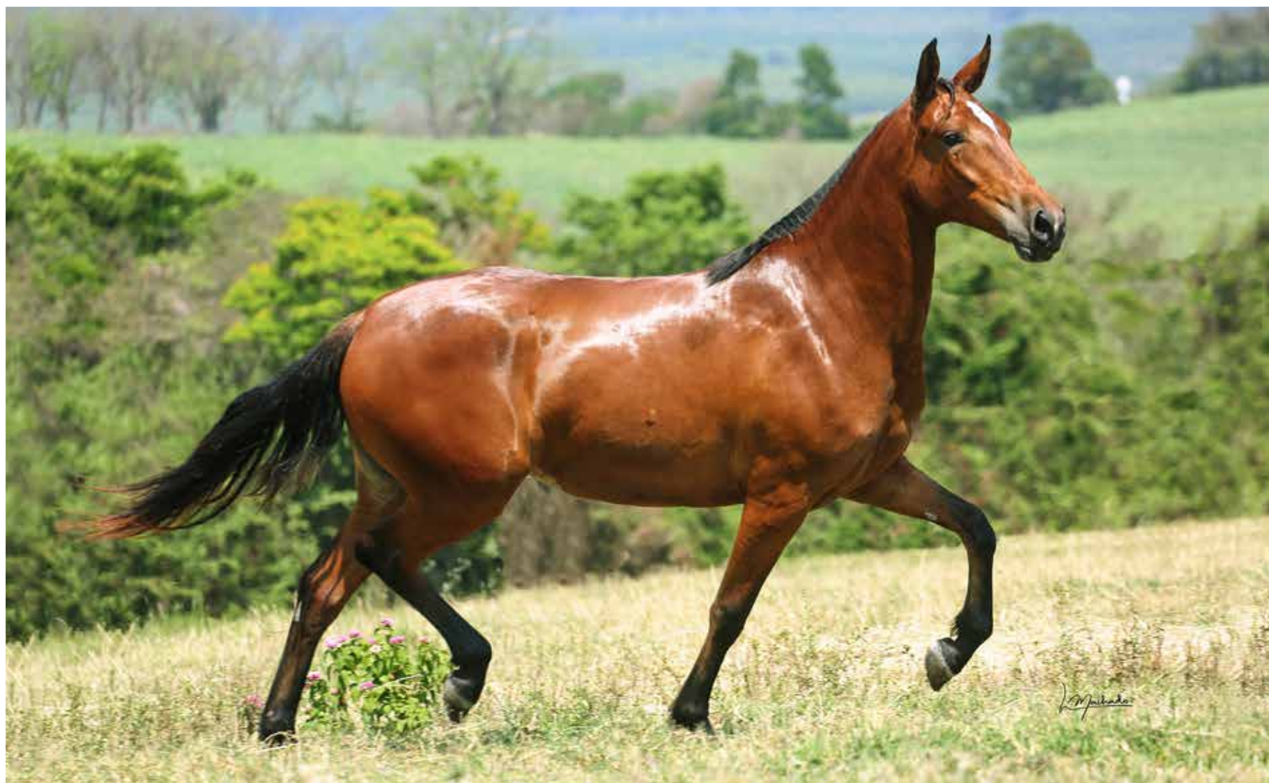
Seu pai, Dínamo do Conforto