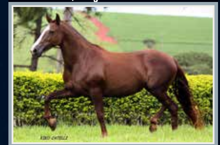
Sua mãe, Jangada da Selva Morena