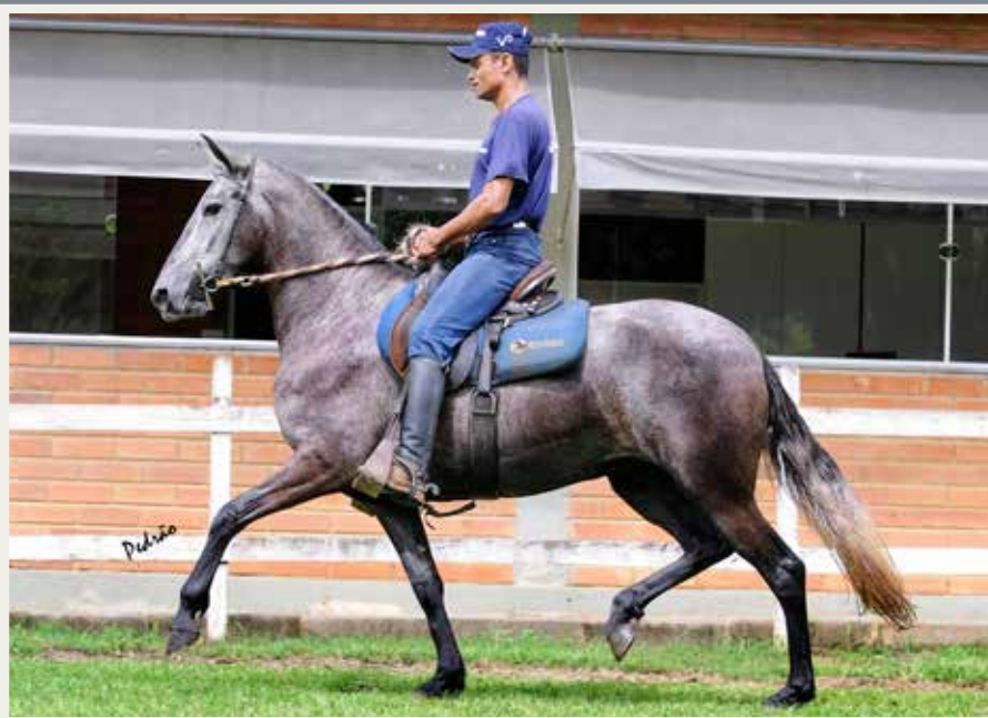
Favacho Diamante (Tabatinga Senegal x Favacho Xuxa) x Cantiga Seara Dourada (Festival da Ogar x Lanterna da Seara Dourada)