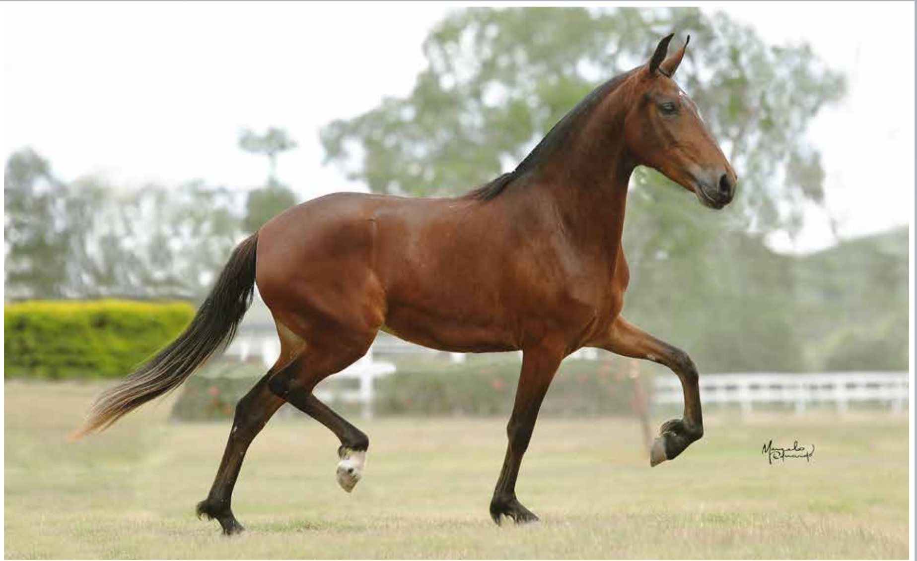
Seu pai, Lobo da Pedra Verde

Organza do Espinho Preto Seiko L.J. x Evolução do Espinho Preto