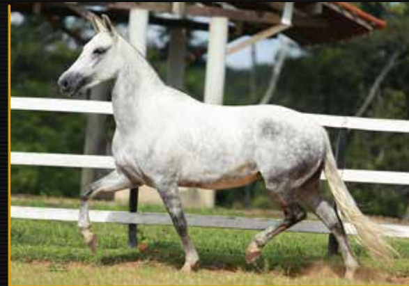
09 - XIMBICA MUG - EMBRIÃO