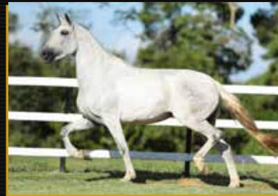
13 - 25% MALVADA TANDY