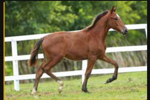
37 - UÍSQUE DO QUELÉ