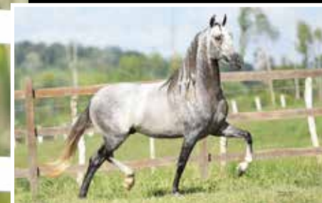
PAI JUIZ DE ALCATÉIA