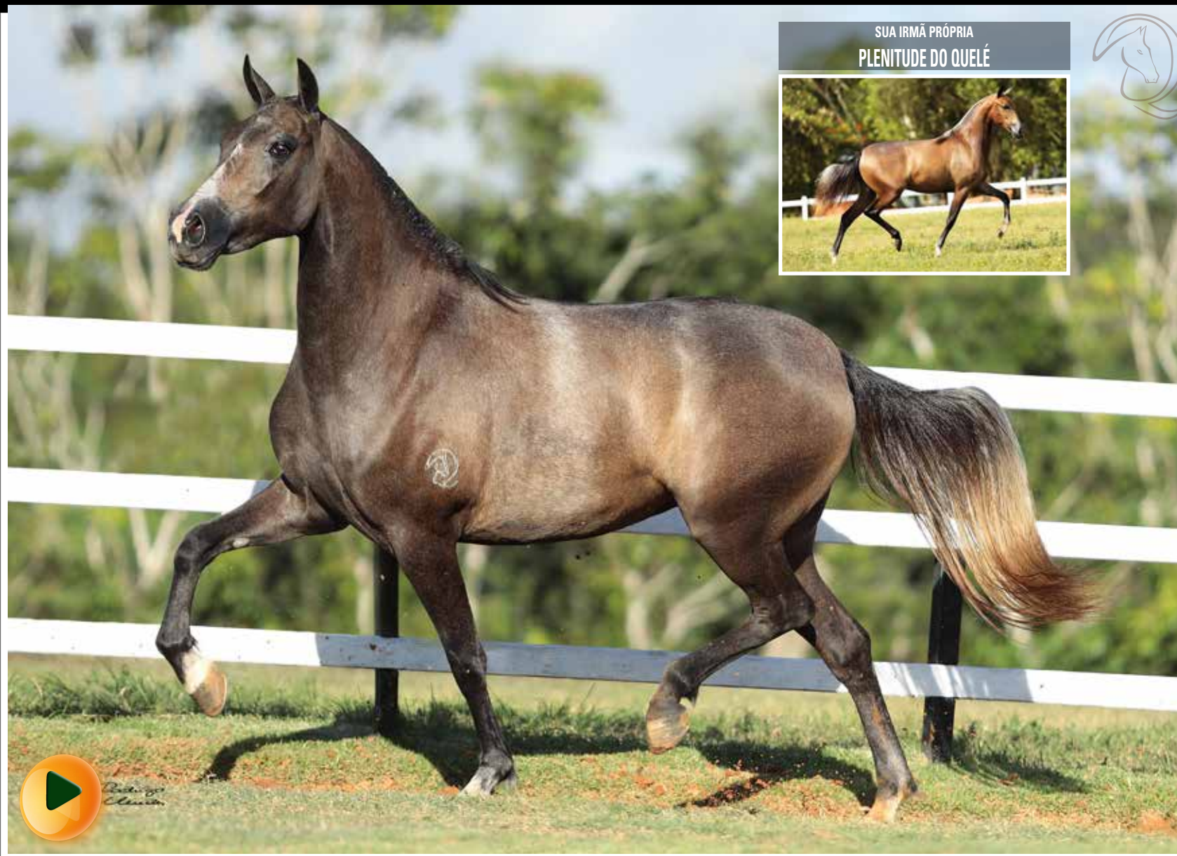
SUA IRMÃ PRÓPRIA PLENITUDE DO QUELÉ