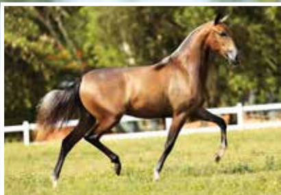
SUA IRMÃ PLENITUDE DO QUELÉ