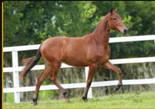
24 - 50% TENEBROSA DO QUELÉ