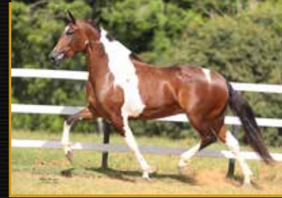
12 - 50% FILOSOFIA DO SÃO JORGE