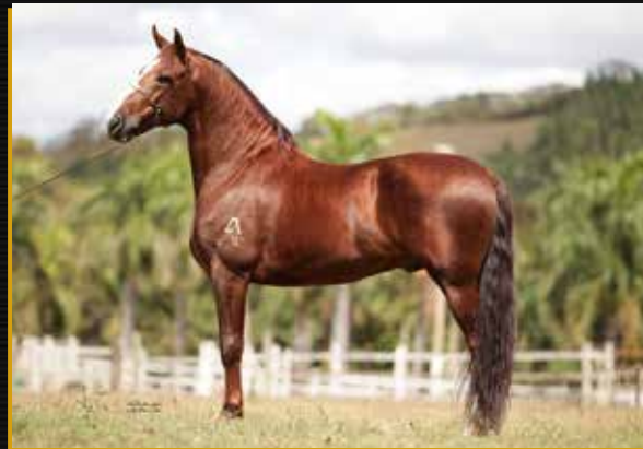
01 - APITO DO CORUMBÁ - COBERTURA UNITÁRIA