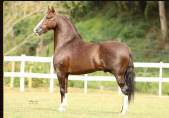
04 - TRILHO DO PORTO AZUL - COBERTURAS