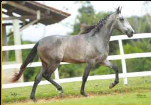
34 - TESOURO DO QUELÉ