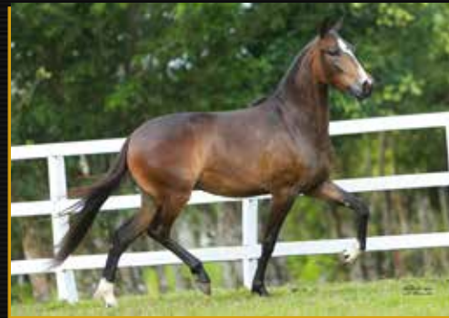
25 - TIARA DO QUELÉ