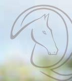
JUIZ DE ALCATÉIA