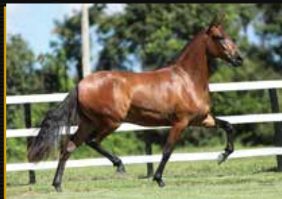
15 - 50% QUAROBA DO QUELE