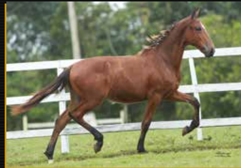
36 - TURBINADO FORMOSO 2S DO QUELÉ