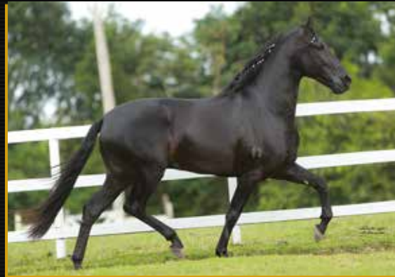
38 - OPERANTE FORMOSO 2S