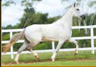
10 - 50% ELITE DE TRÊS CORAÇÕES