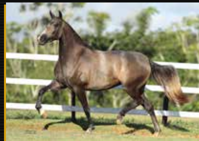
17 - 50% QUENGA DO QUELÉ