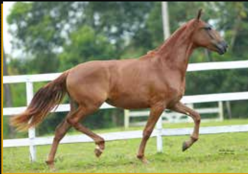
23 - 50% TÁLIA DO QUELÉ