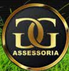
Fajardo do Timbó