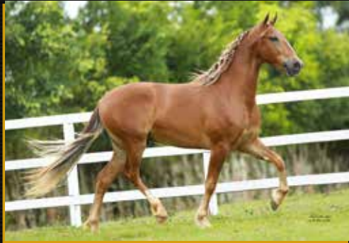
30 - SCOTCH DO QUELÉ