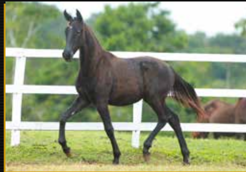
35 - 50% TSUNAMI DO QUELÉ