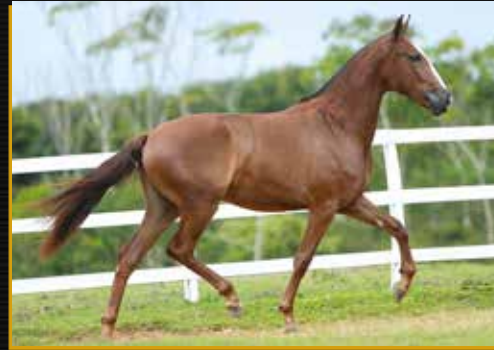
21 - 50% TAINÁ DO QUELÉ