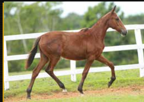
28 - UDINESSE DO QUELÉ