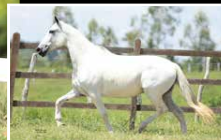
MÃE VITÓRIA DE TRÊS CORAÇÕES