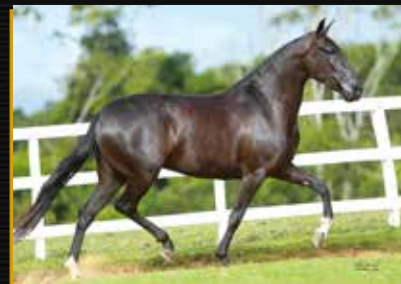
16 - 50% QUELUZ DO QUELÉ