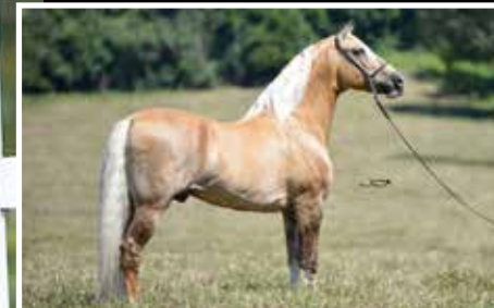
AVÔ PATERNO FATOR DA CAVARÚ-RETÃ