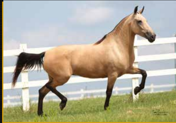
06 - BAILARINA DA TOCA DO LOBO - EMBRIÃO