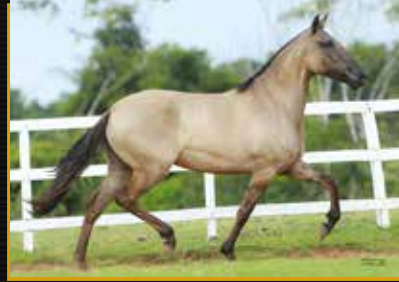
11 - 50% EVITA II ELFAR