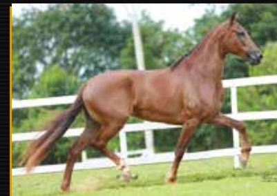
18 - 50% UMACLÓRIA E.A.O.