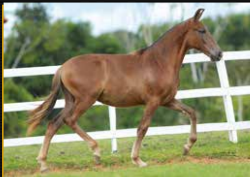
27 - 50% TRAJADA DO QUELÉ