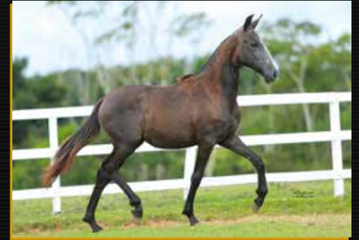
22 - TALENTOSA FORMOSO 2S DO QUELÉ