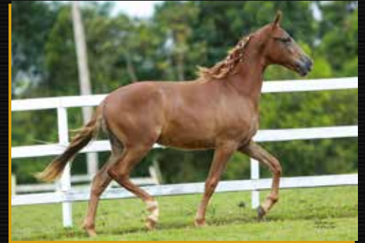
33 - TAILANDÊS FORMOSO 2S DO QUELÉ