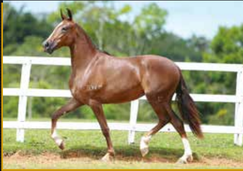
19 - 50% CAPADÓCIA SENHOR DO BONFIM