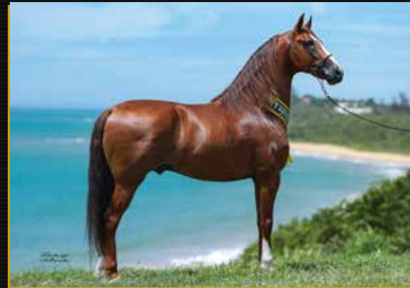
02 - FAJARDO DO TIMBÓ - COBERTURA UNITÁRIA