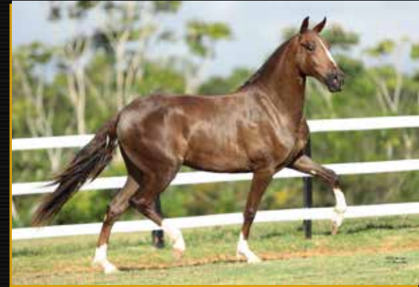
07 - GRANFINA PADRÃO - EMBRIÃO