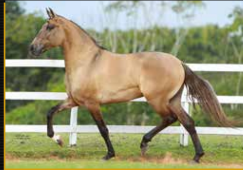
31 - SINISTRO DO QUELÉ