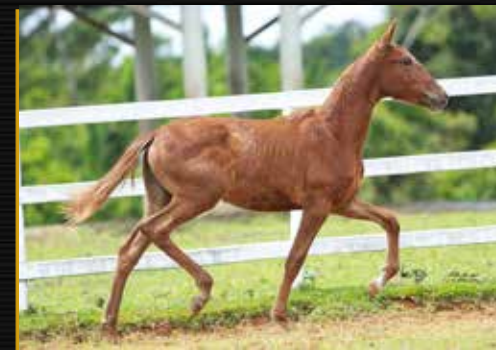
29 - UMBELLA DO QUELÉ