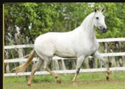
14 - 50% NEVE DO QUELÉ