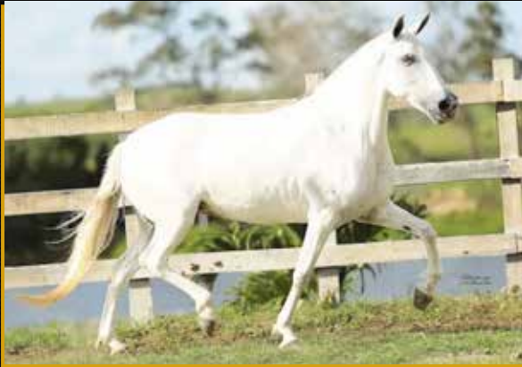
05 - COLÔMBIA DO QUOCIENTE - 50% EMBRIÃO