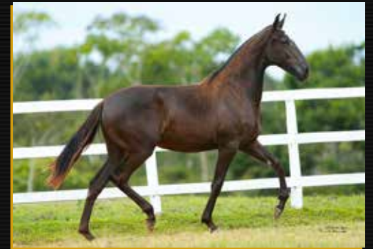
26 - 50% TIETA FORMOSO 2S DO QUELÉ