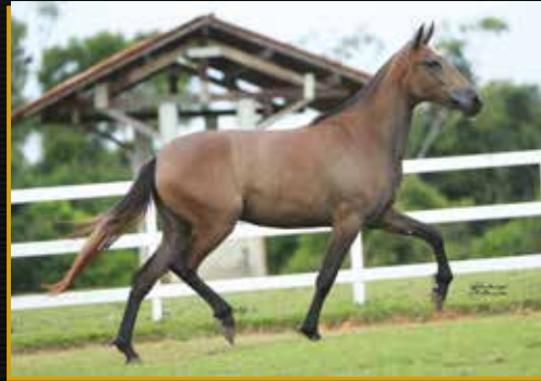
20 - 50% SINHÁ MOÇA DO QUELÉ