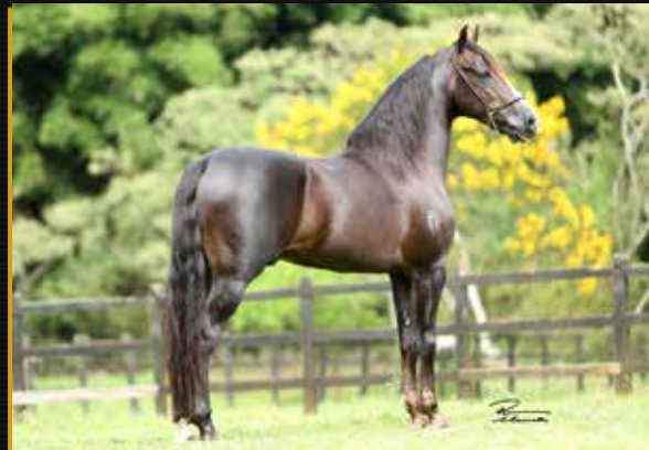
03 - NOBRE TRILHA REAL DE MASCAN - COBERTURA