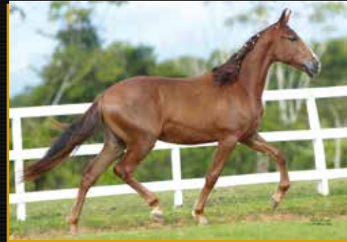
32 - TAFAREL DO QUELÉ