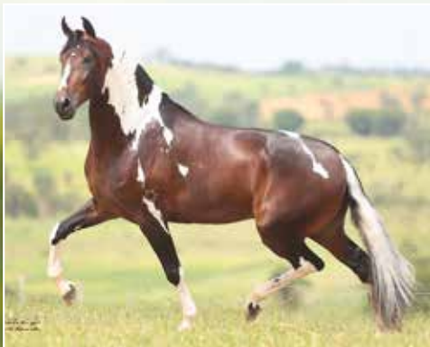
Seu filho, Campeão Nacional 2016