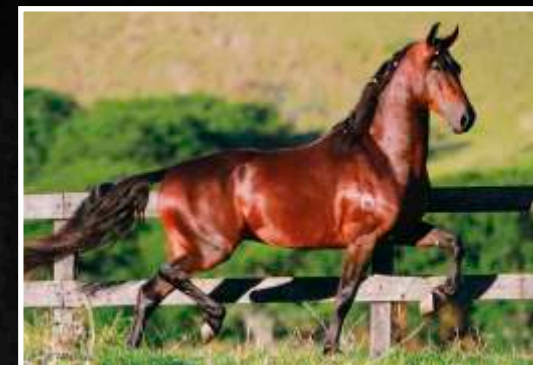
SEU PAI: ÉPICO CAPIM FINO