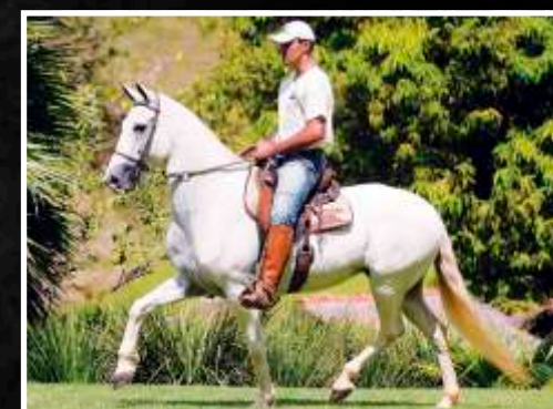
SUA MÃE: LANTERNA DA BOA FÉ

ESPAÑHOL KAFÉ DA NOVA PALHAÇO DE ITUVERAVA X BÓSNIA KAFÉ DA NOVA