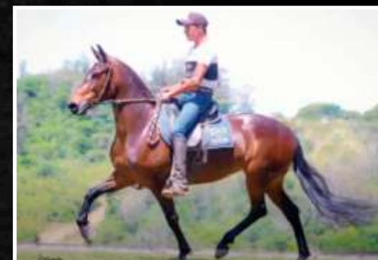
SUA MÃE: TATAIA DA BOA FÉ