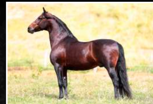
SEU PAI: REQUINTE DO TUCUNARÉ