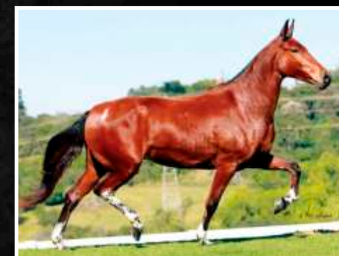
SUA MÃE: RENDADA DA BOA FÉ