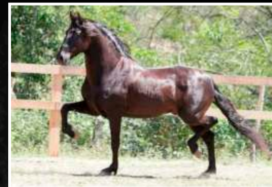
SEU PAI: JABUTI DA MANDASSAIA