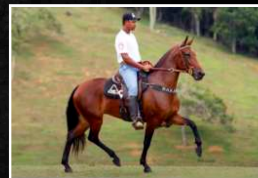
SUA MÃE: MUSA DO RANCHO DO ACASO