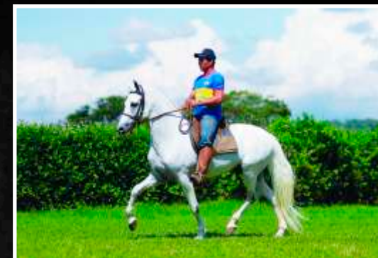
SEU PAI: OLODUM DA BOA FÉ