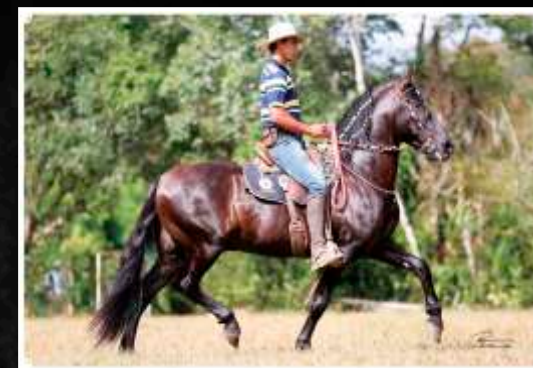
SEU PAI: CAXAMBU BEIRUTE