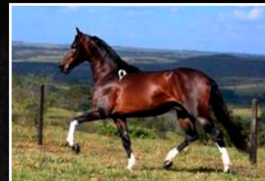
SEU PAI: ESPAÑHOL KAFÉ DA NOVA