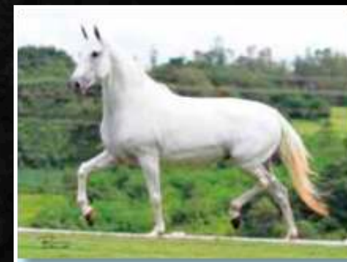
SUA MÃE: MEIGA DO TIJUCANO