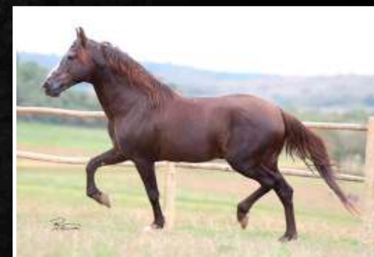
SEU AVÔ: TRILHO DA ZIZICA

VERMÊO DA BOA FÉ RUBICÃO DA BOA FÉ X RENDADA DA BOA FÉ