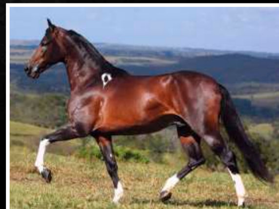
ESPANHOL KAFÉ DA NOVA