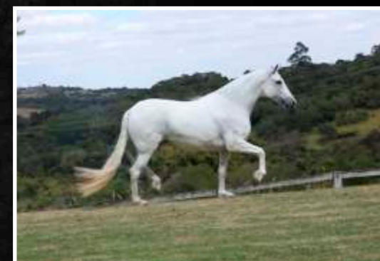
SUA MÃE: INVICTA RRC

ESPAÑHOL KAFÉ DA NOVA PALHAÇO DE ITUVERAVA X BÓSNIA KAFÉ DA NOVA