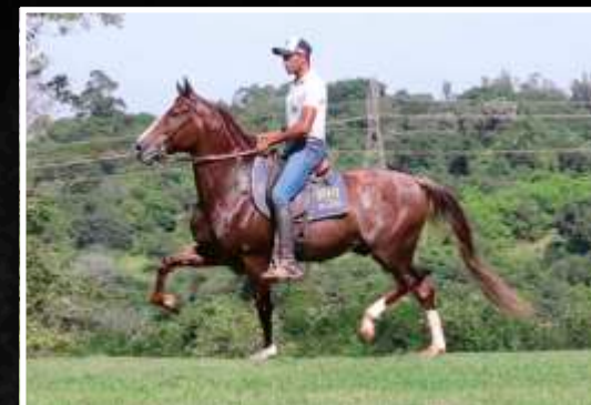
SEU PAI: RUBICÃO DA BOA FÉ