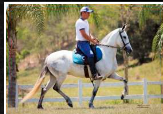
UVAIA DA BOA FÉ