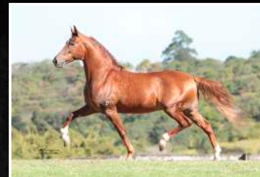
SEU PAI: VERMÊO DA BOA FÉ