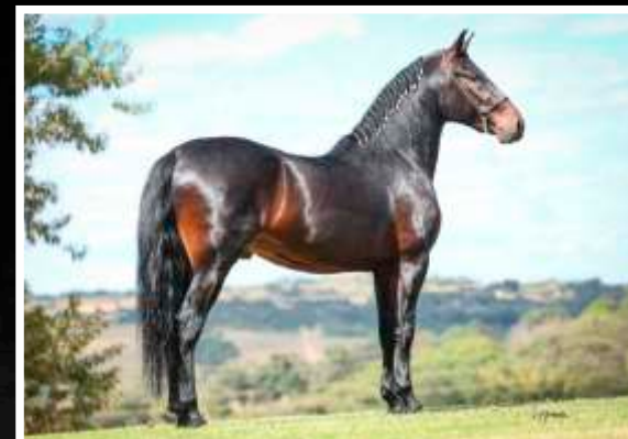
ZÉ DA BOA FÉ