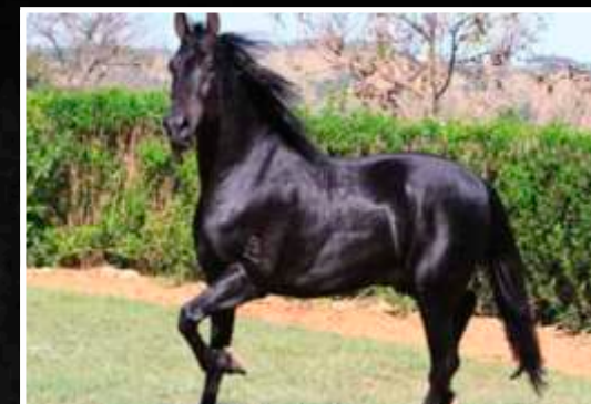
SEU PAI: SEIKO DO BERMA