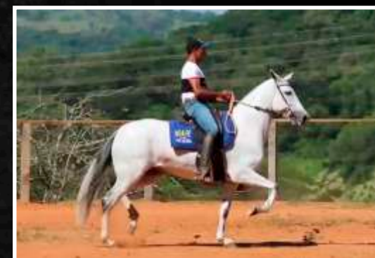
SUA MÃE: VIDA DA BOA FÉ