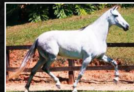
SUA MÃE: UVÁIA PAREDÃO