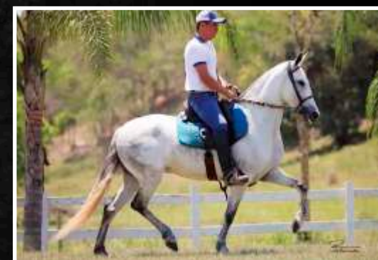
SUA MÃE: UVÁIA DA BOA FÉ