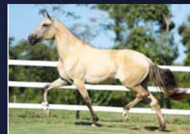
38 - 50% NORUEGA DO QUELÉ