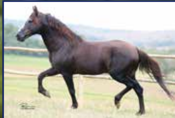
Trilho da Zizica