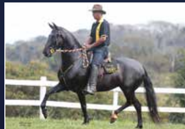
10B - HISTÓRIA GCL