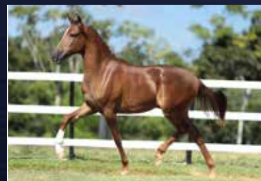
17 - R10 DO QUELÉ