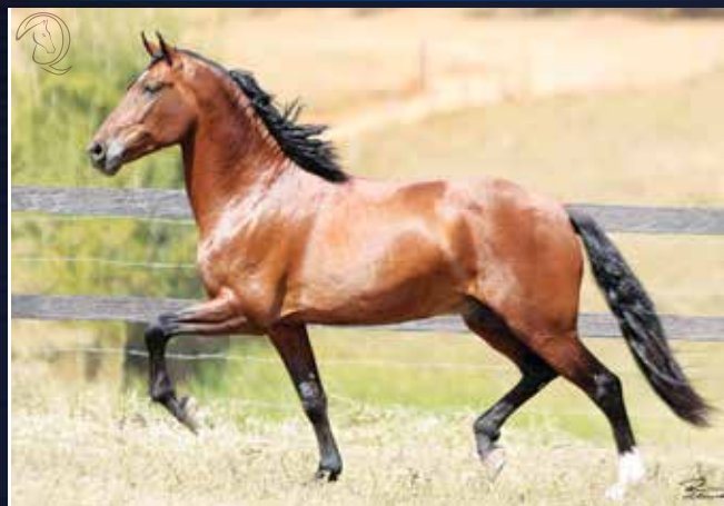
Favacho Estanho x Xarada "53"