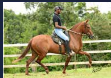
37 - 50% MARAVILHA RRC