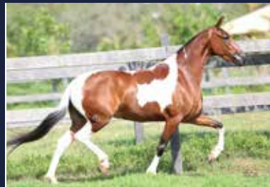
07 - JAWA CAXAMBUENSE