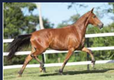
24 - PAPAIA DO QUELÉ