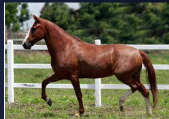
LIBERTAS DO COLORADO