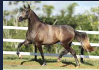
02C - QUENGA DO QUELÉ