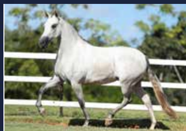
02B - GUERREIRA DA MYLLA