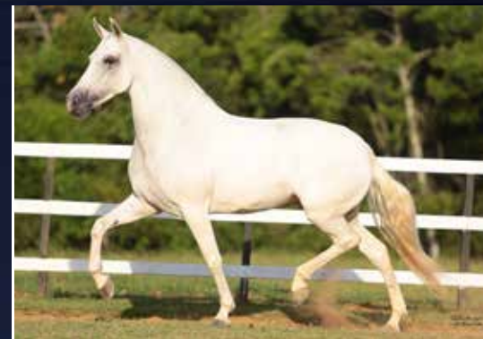
FÚRIA DO HARAS ALICE