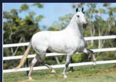
34 - 50% DESTEMIDA DO FUSCA