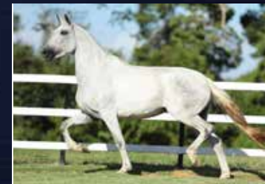
11B - MALVADA TANDY