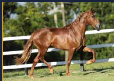
33 - 50% PROMISSOR DO QUELÉ