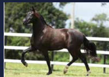
16 - 50% QUIFENÔMENO PARAÍSO DO QUELÉ