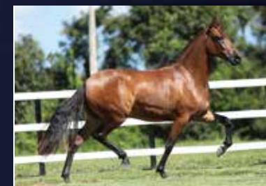
26 - 50% QUAROBA DO QUELÉ