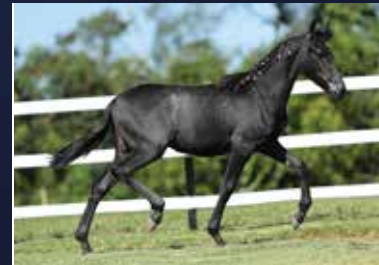
18B - RAYLANDER DO QUELÉ