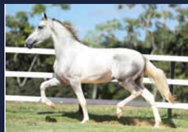
15 - QUEBRA-MAR DO QUELÉ