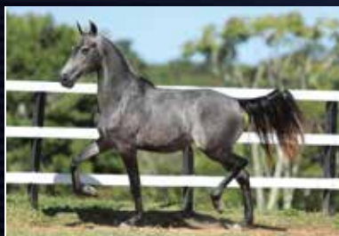
27 - RAÍÇA DO QUELÉ