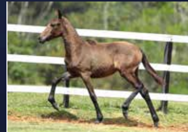
30 - SEVILHA DO QUELÉ