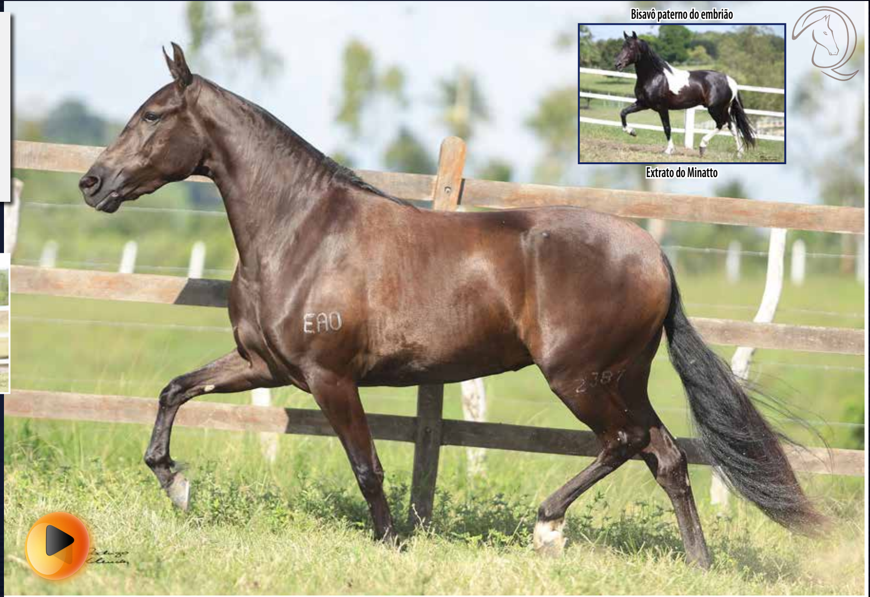
Bisavô paterno do embrião