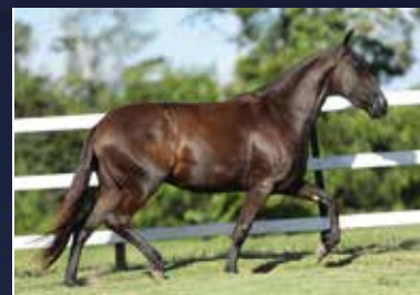
21 - 50% NOVIÇA FORMOSO 2S