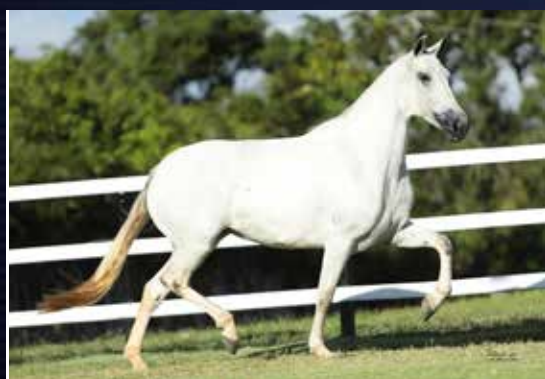
NATA DO QUELÉ