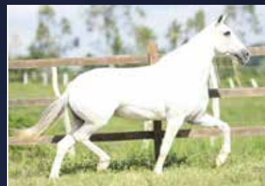
05 - ITAQUI ATENAS