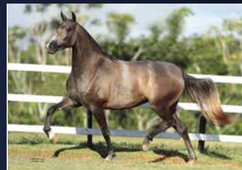
02C - QUENGA DO QUELÉ

(ARIANO DA SELVA MORENA X MEDALHA DO TREVO)