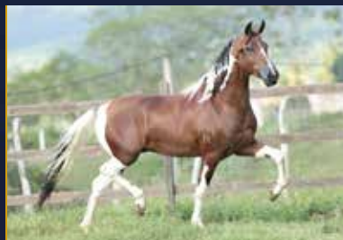
32 - OASIS DO QUELÉ