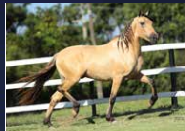
13 - PATRIMÔNIO DO QUELÉ