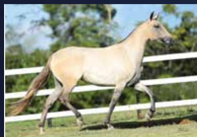
23 - 50% PAOLA DO QUELÉ