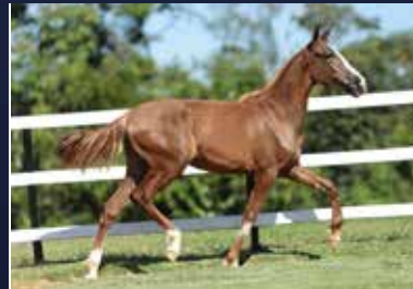
29 - 50% RONALDINHA QUELÉ DO DIAMANTE NEGRO