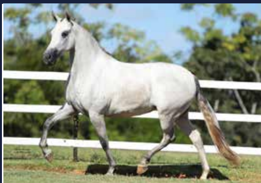
GUERREIRA DA MYLLA