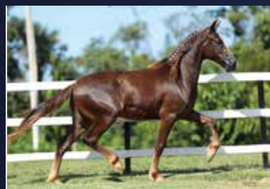
14 - QHABILIDOSO DO QUELÉ