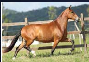
39 - 50% NUVEM FAL