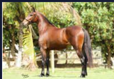
19 - 50% FÁBRICA DA MYLLA