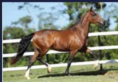
20 - 50% NOVATA DA MATRIX