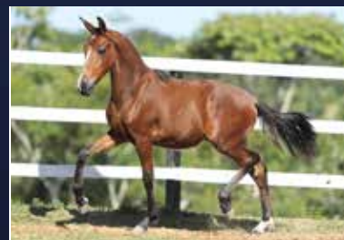
18A - RAJY DO QUELÉ