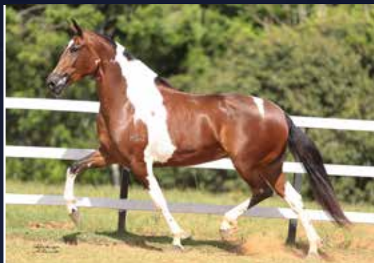
FILOSOFIA DO SÃO JORGE