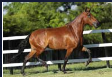
10A - LIBERDADE DO MENON