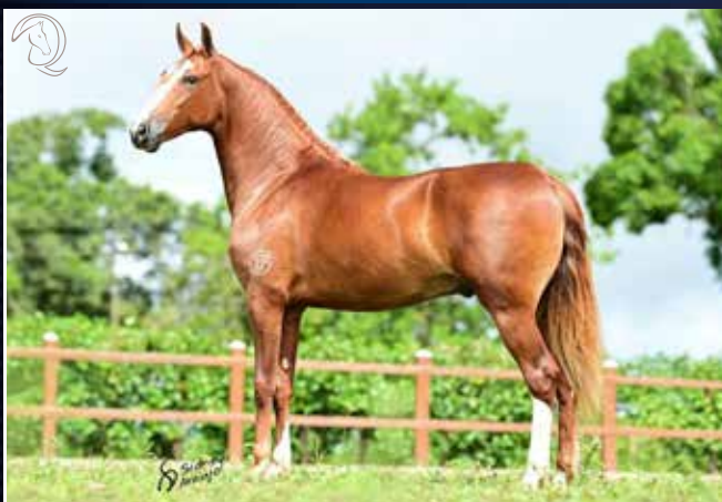
Estanho de Alcatéia x Devassa Lua de Prata