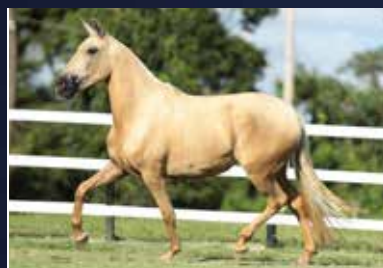
02A - ECLÍPSE ELFAR