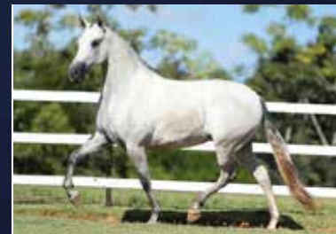
11A - GUERREIRA DA MYLLA