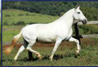
Nata da Visão