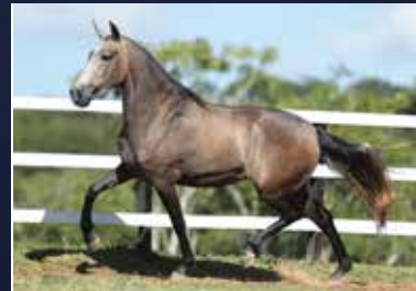
41 - 50% PIETRA DO QUELÉ