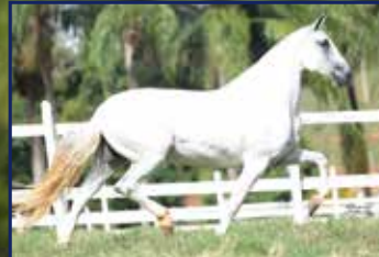
Tequila do Porto Palmeira