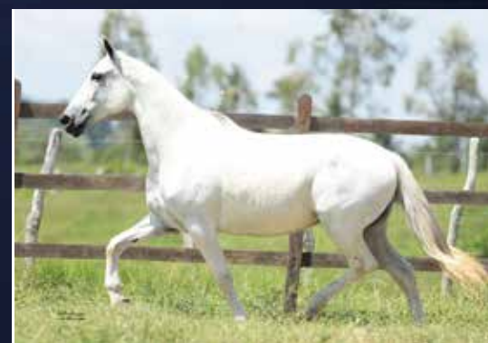
VITÓRIA DE TRÊS CORAÇÕES