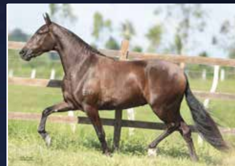
03C - UDINESE E.A.O.

(HÚNGARO DA VISÃO X FASCINAÇÃO DA VISÃO)