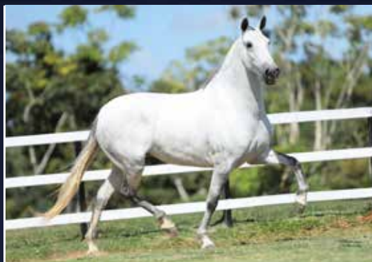
DESTEMIDA DO FUSCA