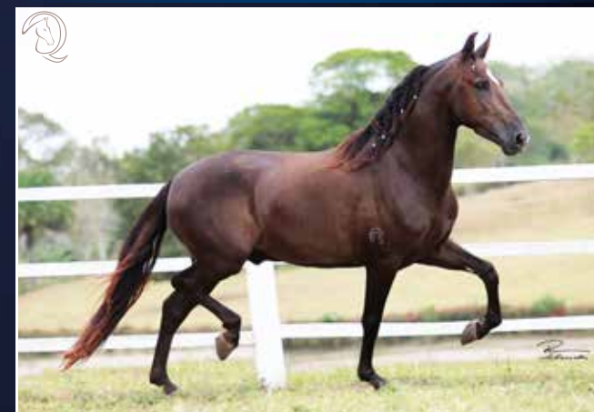
Tigrão Kafé x Sapoti do Aeroporto