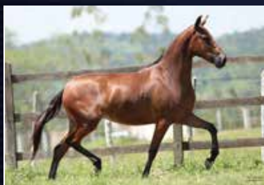
22 - 50% PAIXÃO DO QUELÉ