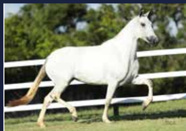
03B - NATA DO QUELÉ