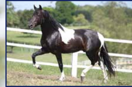
Extrato do Minatto