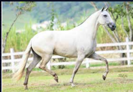
CANÇÃO DE TRÊS CORAÇÕES