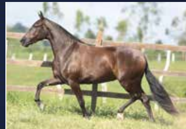
08 - UDINESE E.A.O.