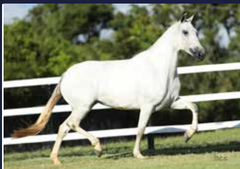
03B - NATA DO QUELÉ

(RADAR DE ANCHIETA X GÔNDOLA DO CONTORNO)