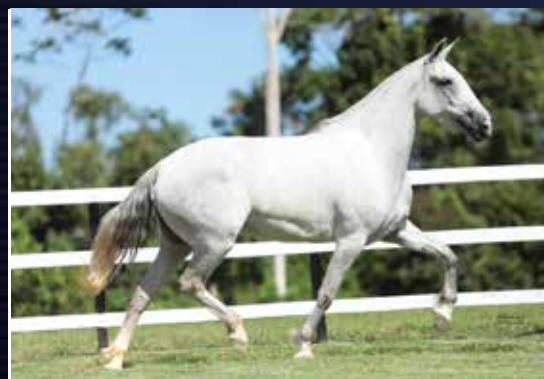
ONDINA DO QUELÉ