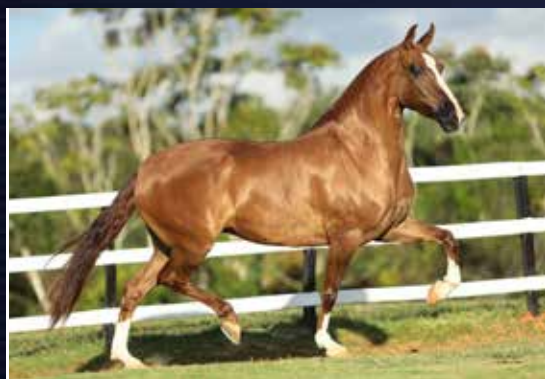
GIGI CALAMBAU DO CARDEAL EMP