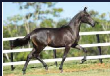
28 - 50% RESERVA DO QUELÉ