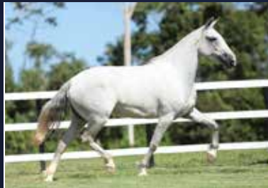
40 - 50% ONDINA DO QUELÉ