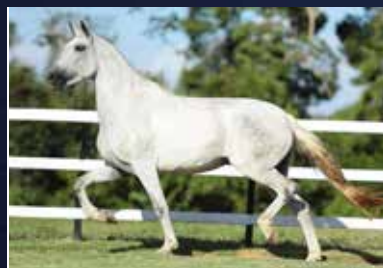
03A - MALVADA TANDY