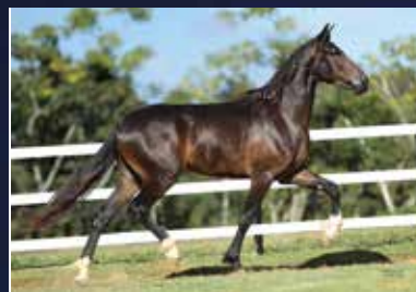
12 - PAÍS DO QUELÉ