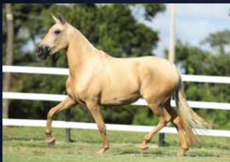
02A - ECLÍPSE ELFAR