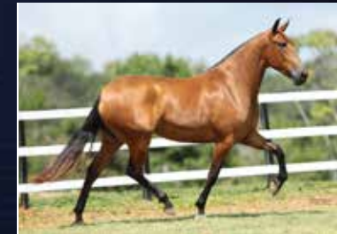
31 - 50% VERONA QUELÉ DO PARAÍSO