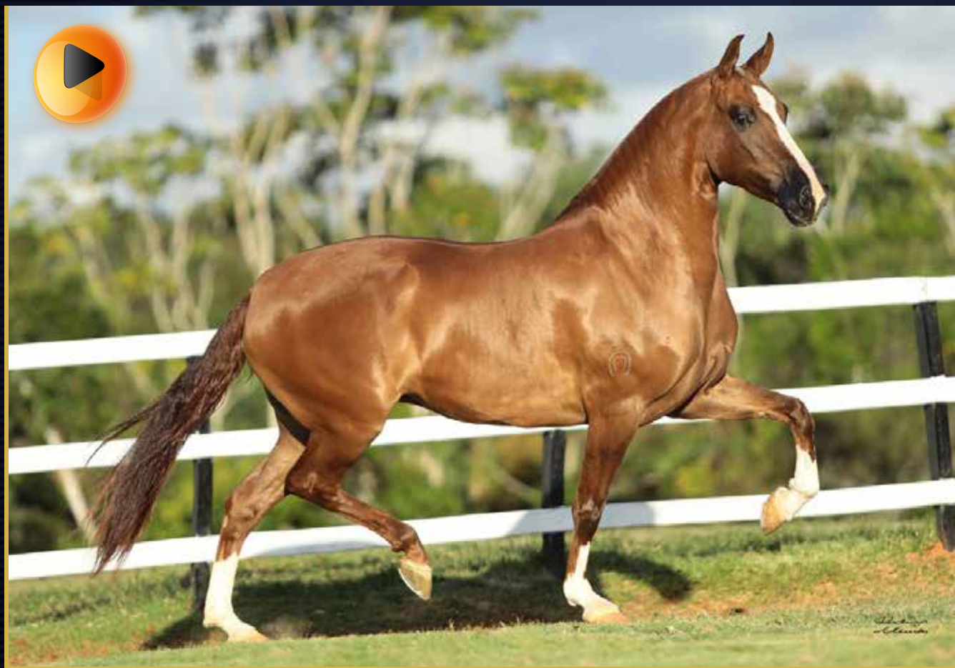
Farrapo DN (Elo Kafé da Nova x Flauta do Rebanho) x Birmânia Calambau do Cardeal (Fator da Cavarú-Retã x Juta do Cardeal)