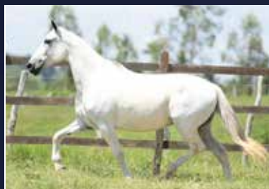
04 - VITÓRIA DE TRÊS CORAÇÕES - 50%