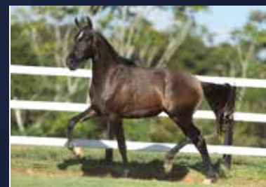
25 - 50% QESTRELA SIRIEMA DO QUELÉ