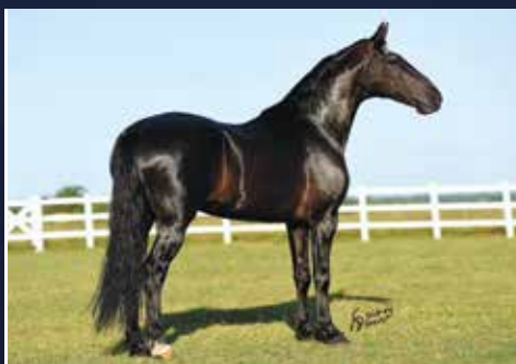
POR ELFO DO PORTO AZUL

HAITY CAXAMBUENSE (TAC) X SAMIRA DO PORTO AZUL (ORIGINAL DE SANTA LÚCIA X DIOR DO PORTO AZUL)