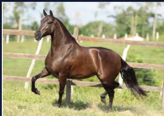
CEREJA DA MYLLA