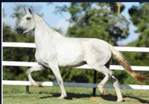
03A - MALVADA TANDY