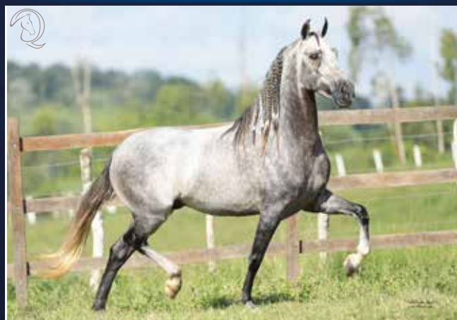
Rajy Elfar x Escócia de Alcatéia