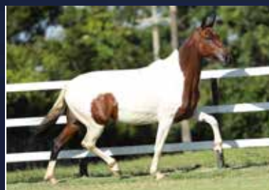
36 - LIBERTAS DO QUELÉ