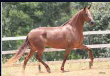
09 - QUIFIGURA E.A.O.