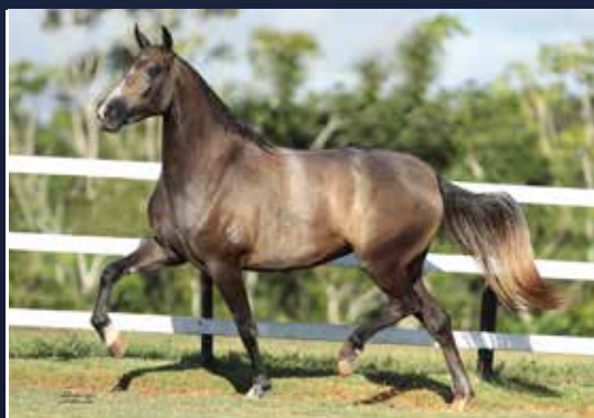
QUENGA DO QUELÉ