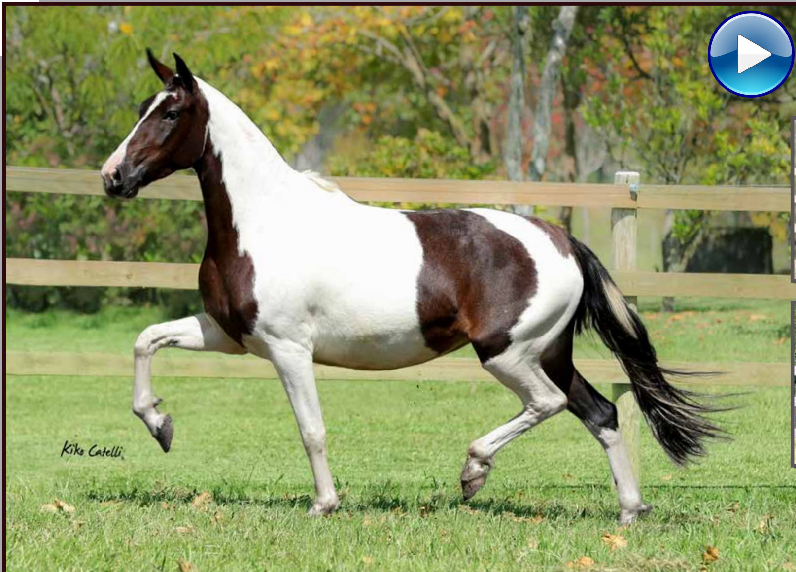
Seu pai, Iguaçu do Exponente