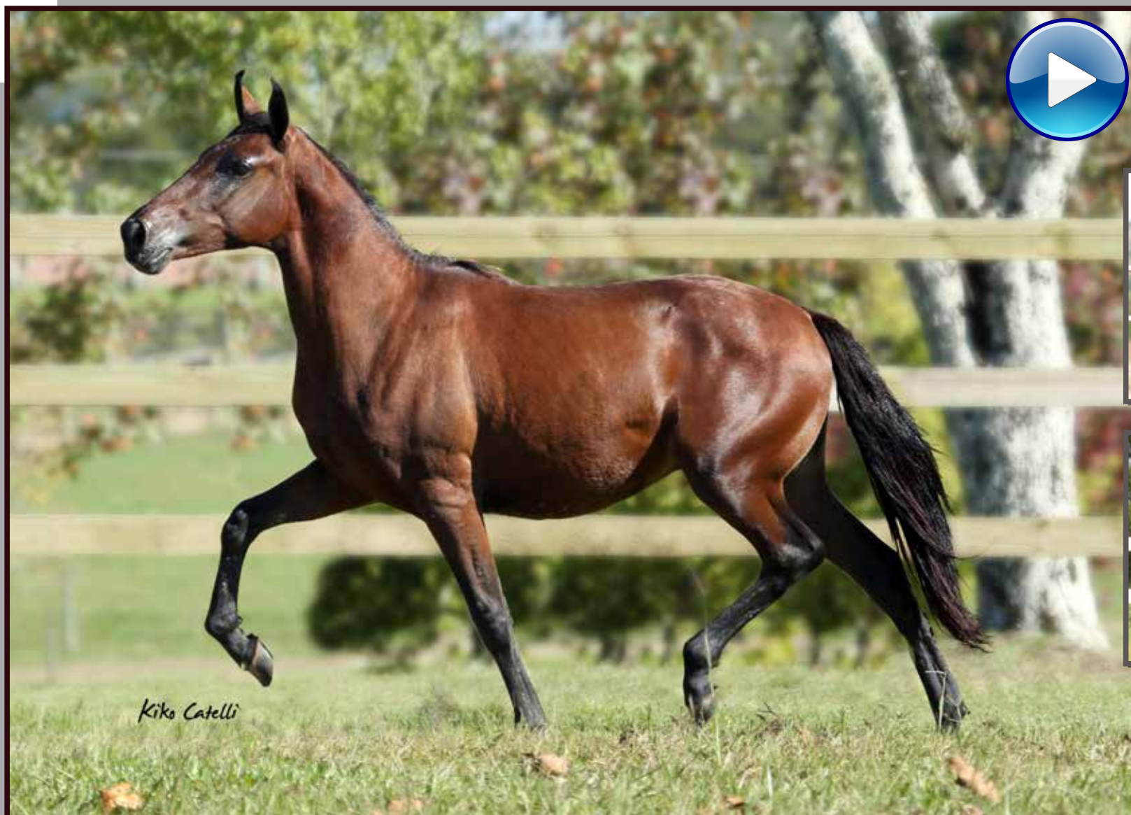
Seu pai, Forró do Aro