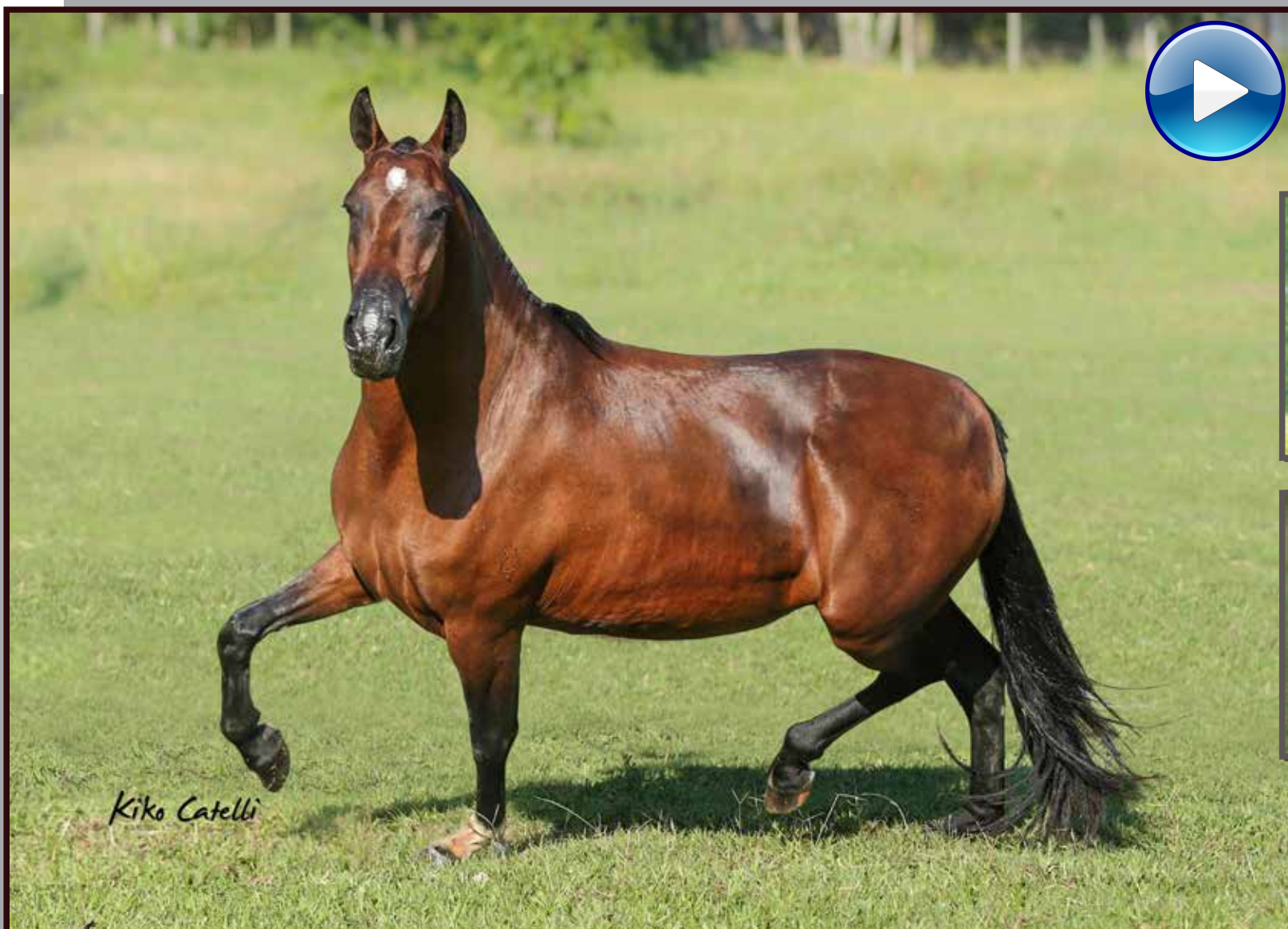
Seu avô paterno, Sublime da Ogar