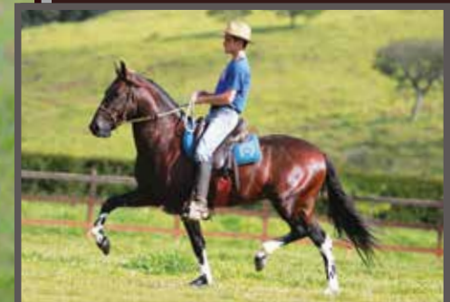
Seu avô materno, Holofote de São Lourenço