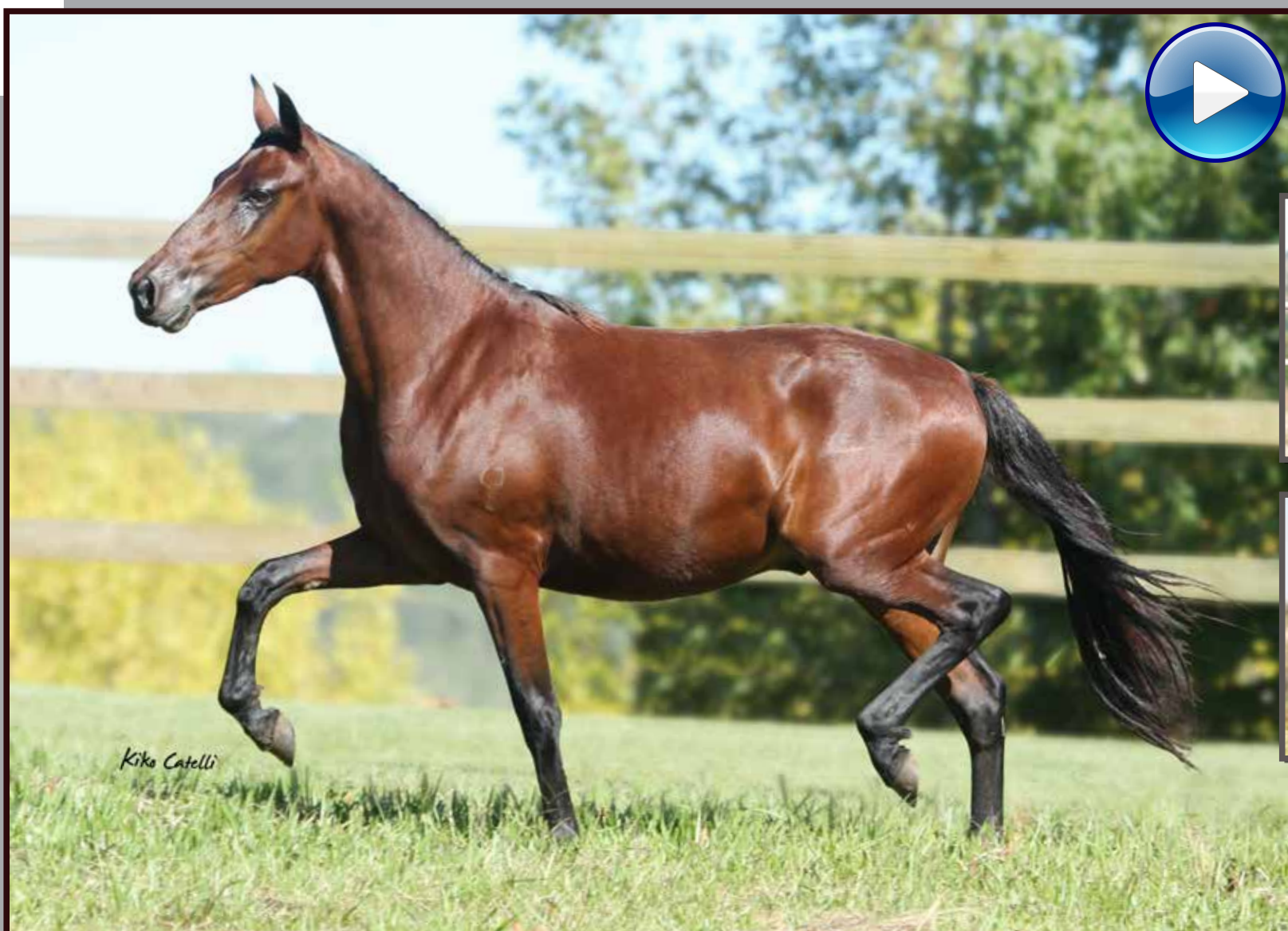
Seu pai, Forró do Aro