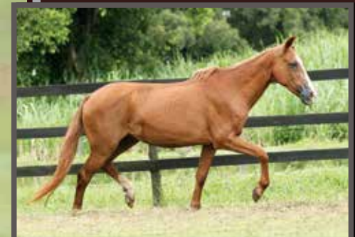
Sua mãe, Brasília Boa Marcha