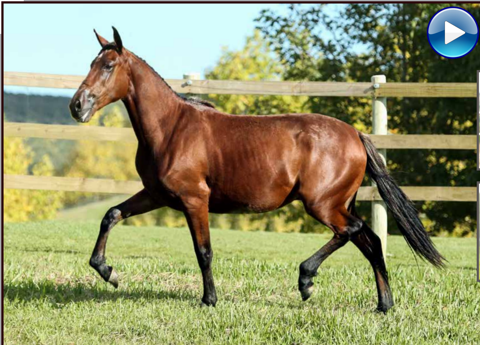
Seu pai, Forró do Aro