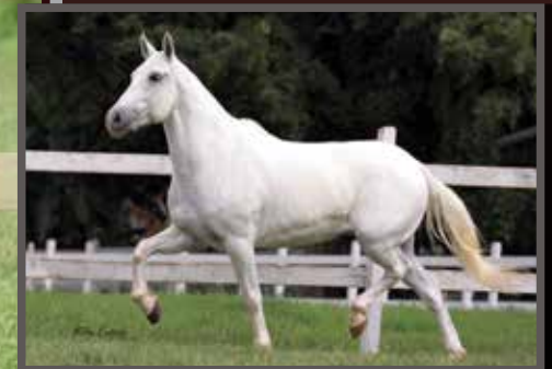
Sua avó paterna, Sevilha da Selva Morena