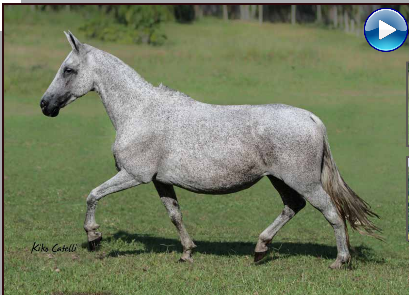
Seu filho, Brigadeiro da Ilha