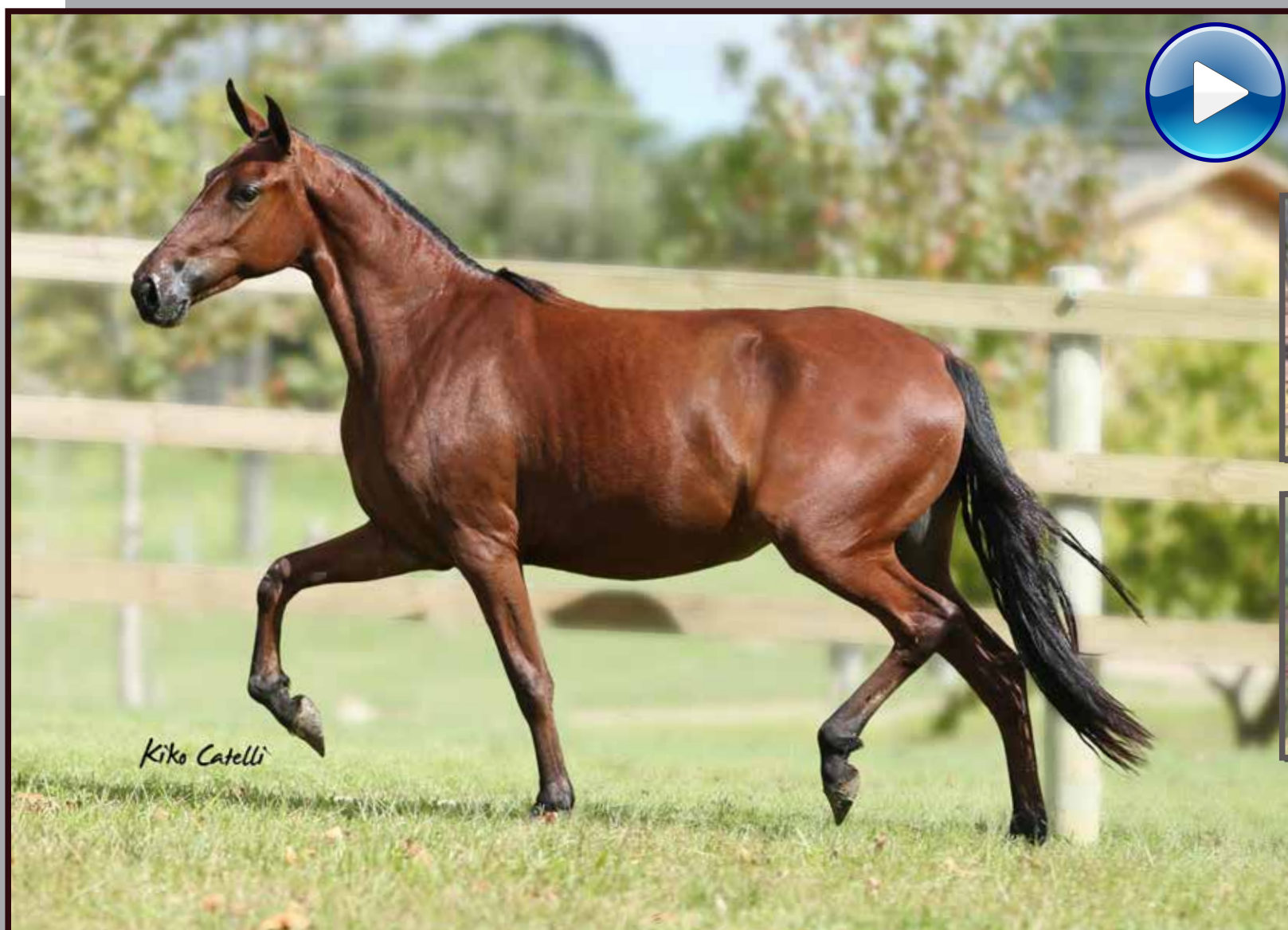
Seu pai, Galante do Expoente