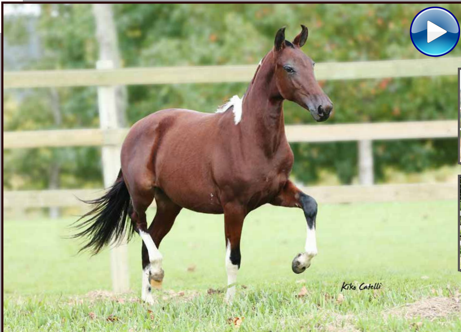
Seu pai, Forró do Aro