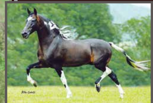
Seu avô materno, Sublime da Ogar