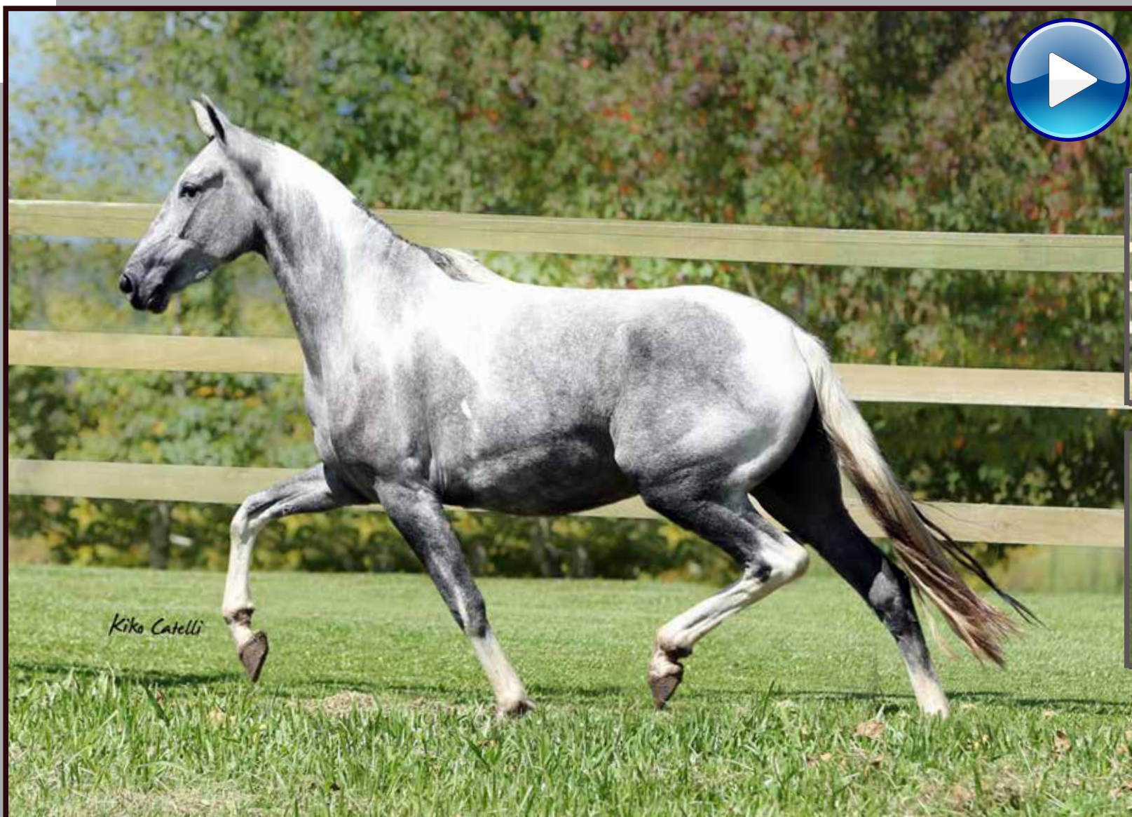
Seu pai, Iguaçu do Expoente