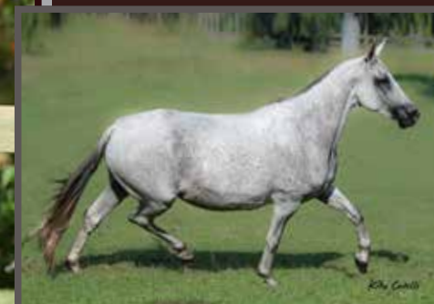
Sua mãe, Harpa da Ilha