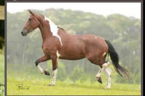
Sua mãe, Lendária da Figueira