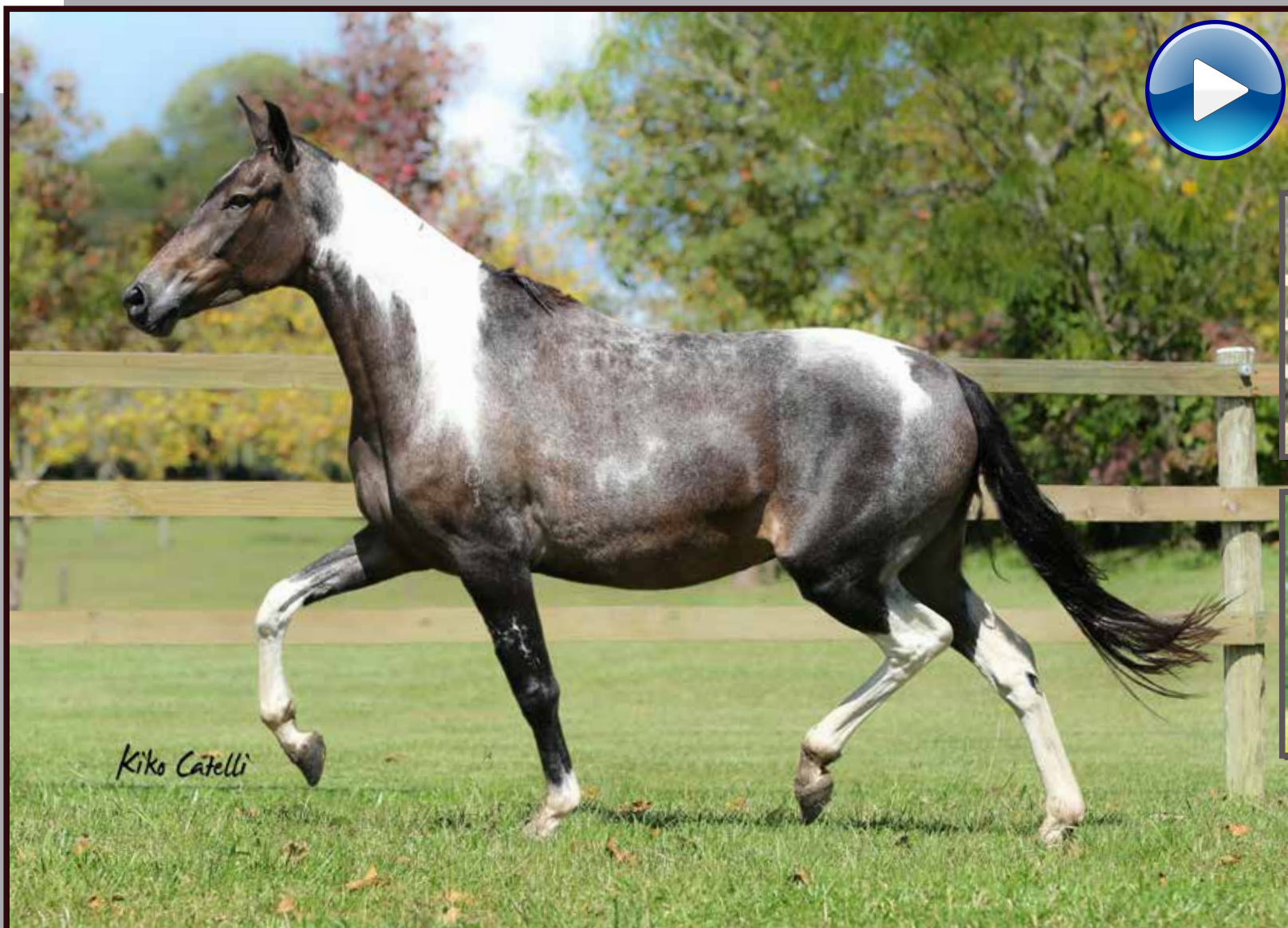
Seu pai, Iguaçu do Exponente