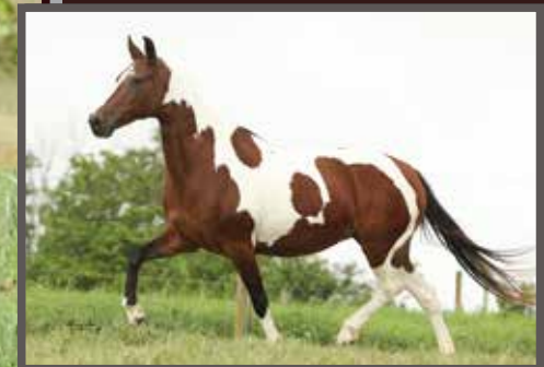
Sua mãe materna, Única Kafé