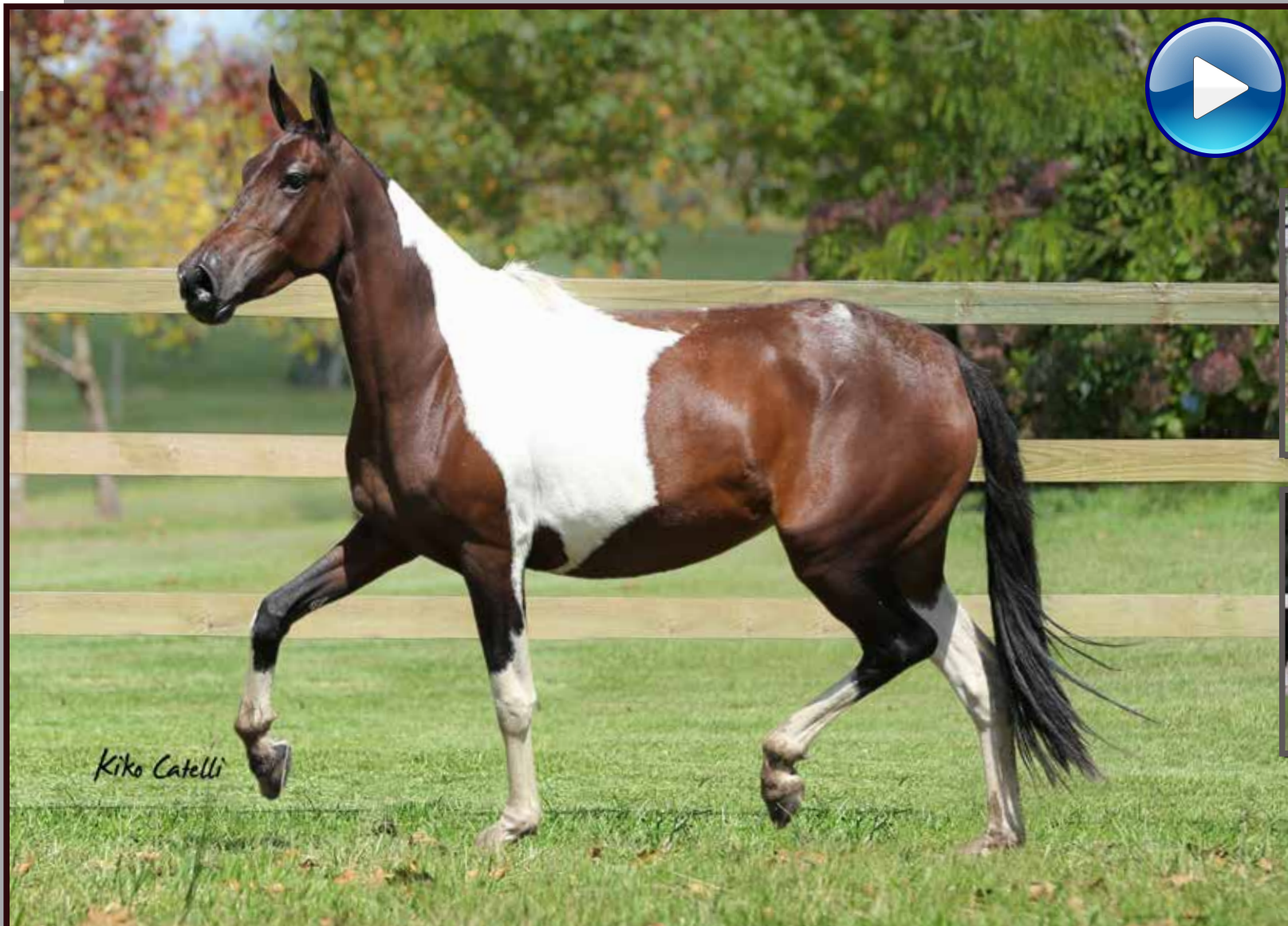
Seu pai, Ilustre do Expoente