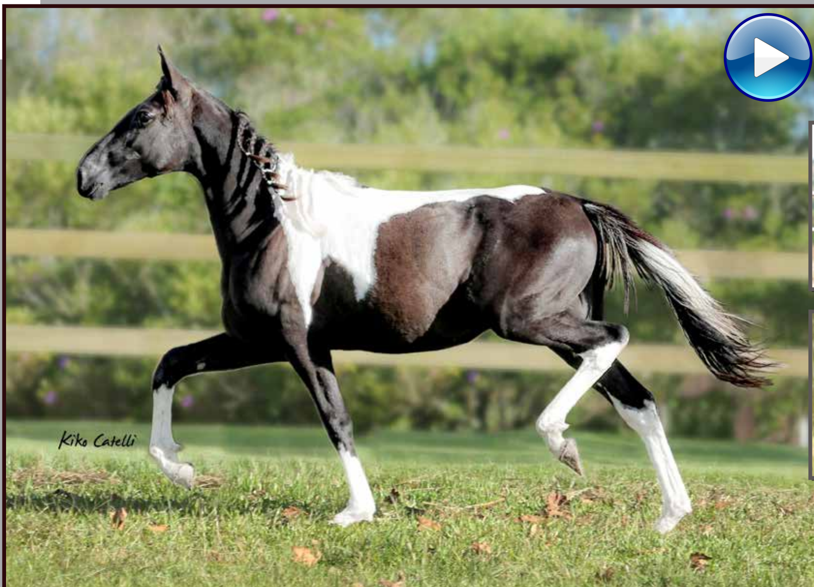
Seu pai, Forró do Aro