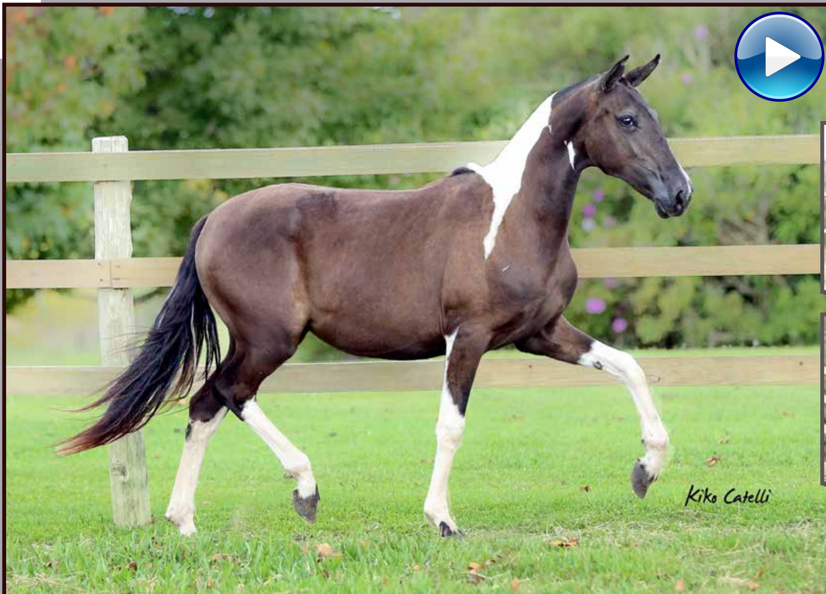
Seu pai, Forró do Aro