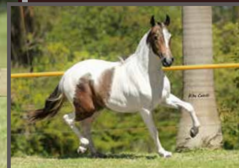
Sua mãe, Lenda da Figueira