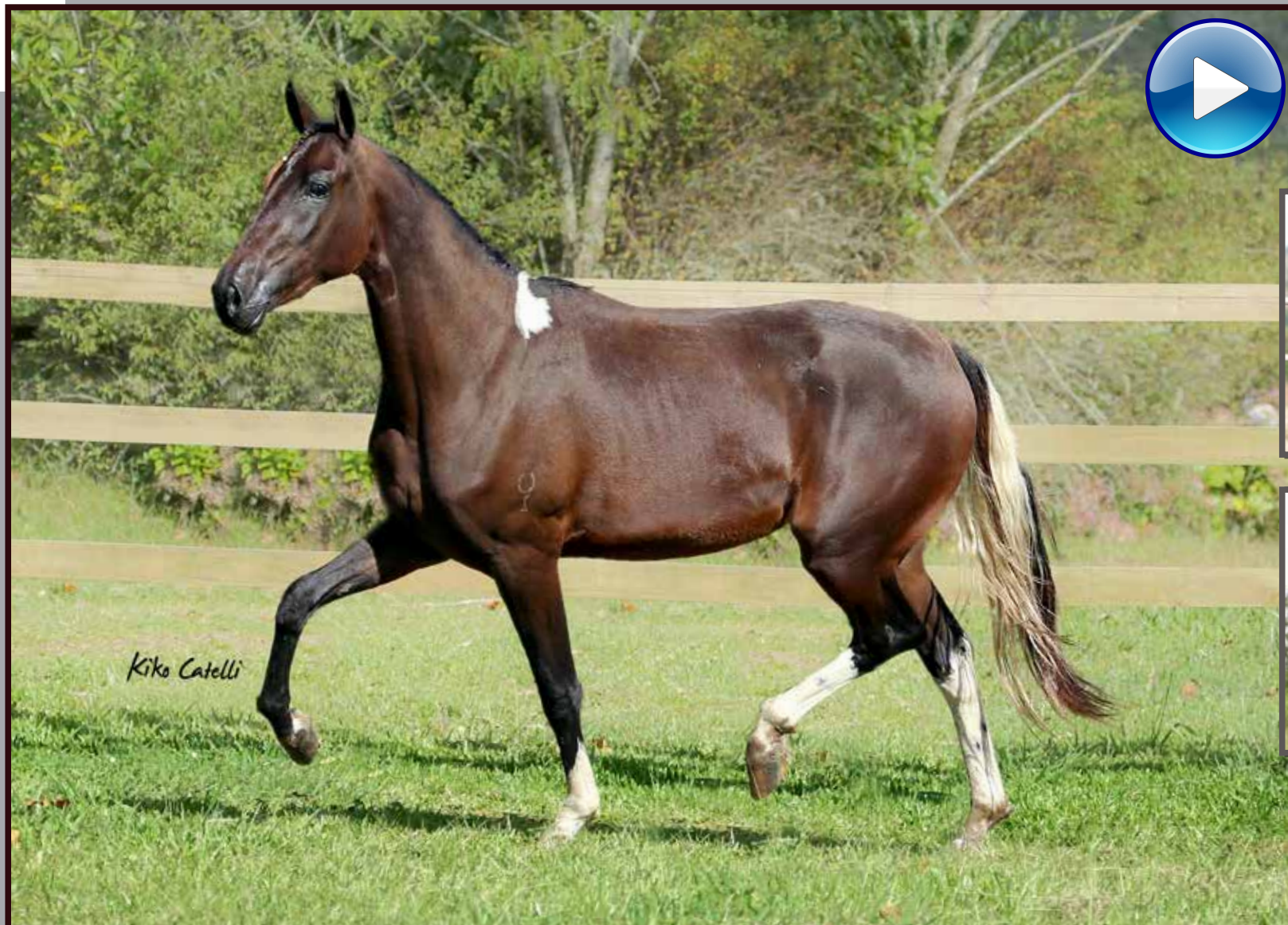
Seu pai, Forró do Aro