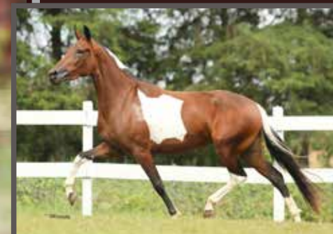
Sua mãe, Desenhada dos Bugres