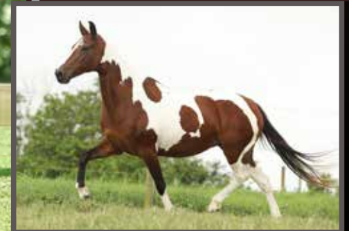
Sua avó materna, Única Kafé