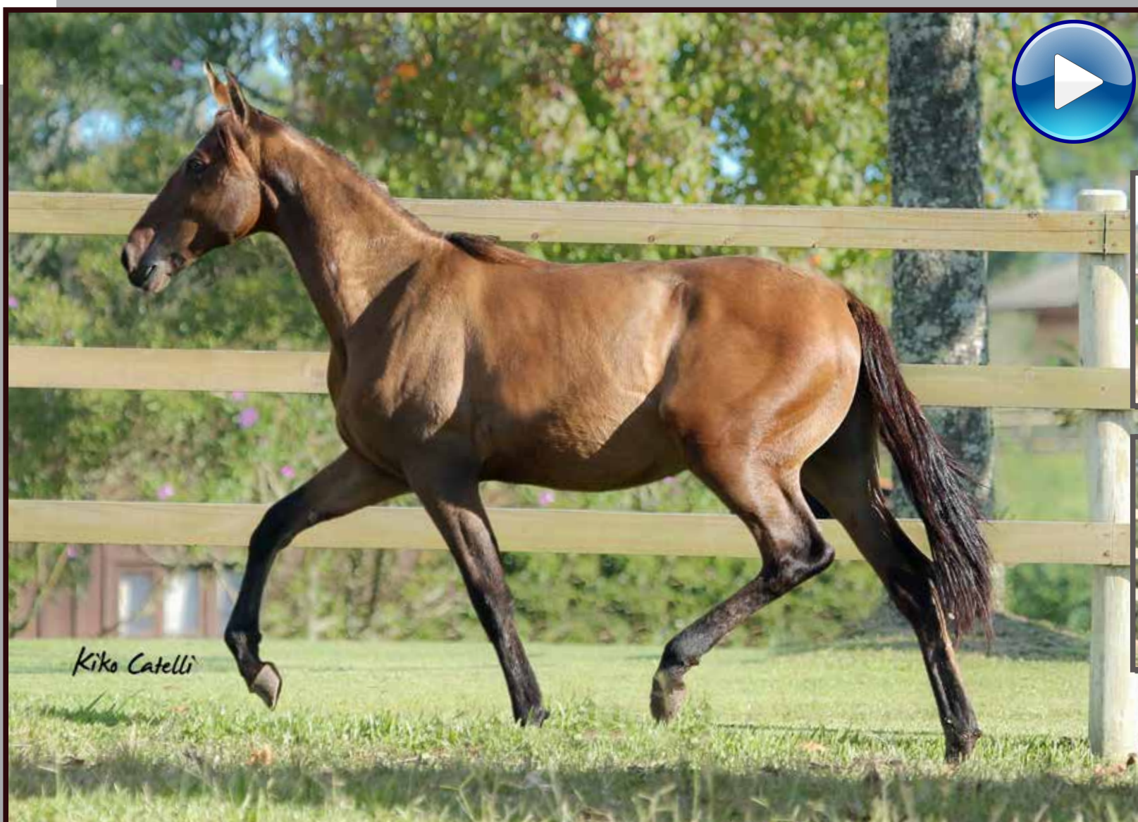
Seu pai, Forró do Aro