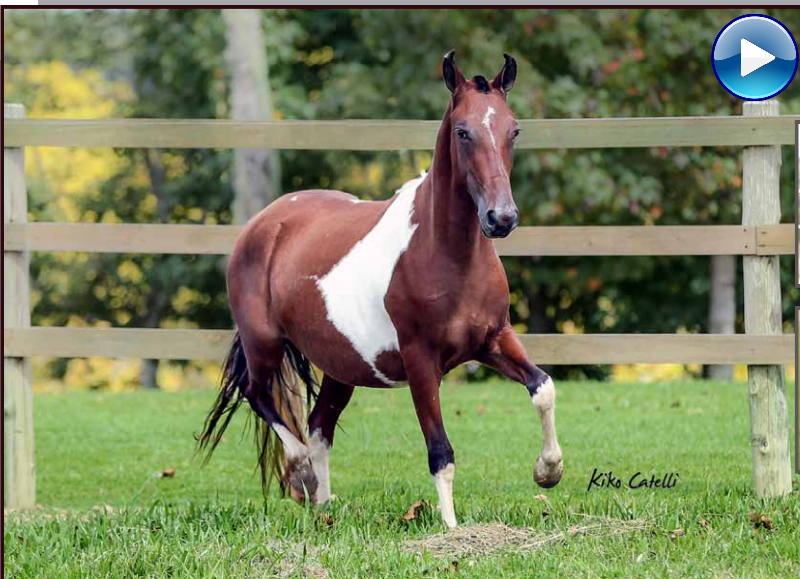
Seu pai, Forró do Aro