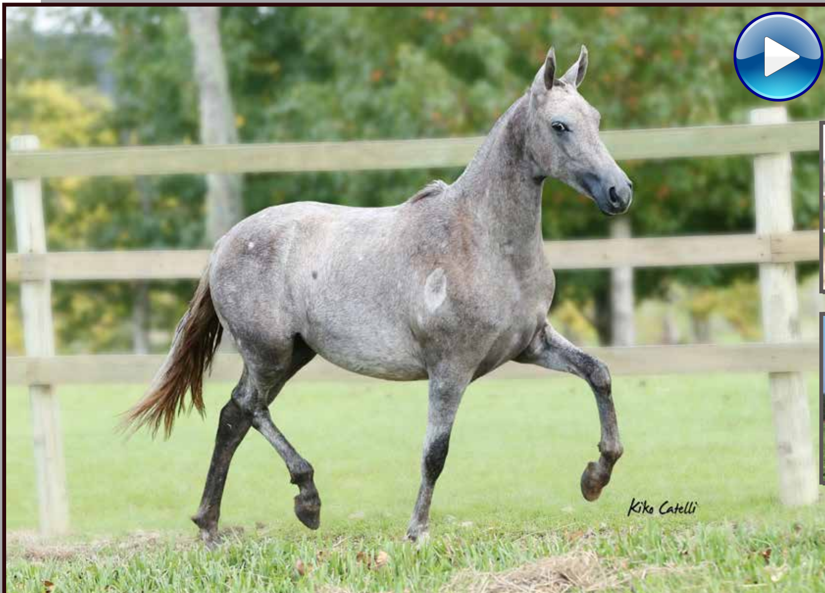
Seu pai, Forró do Aro