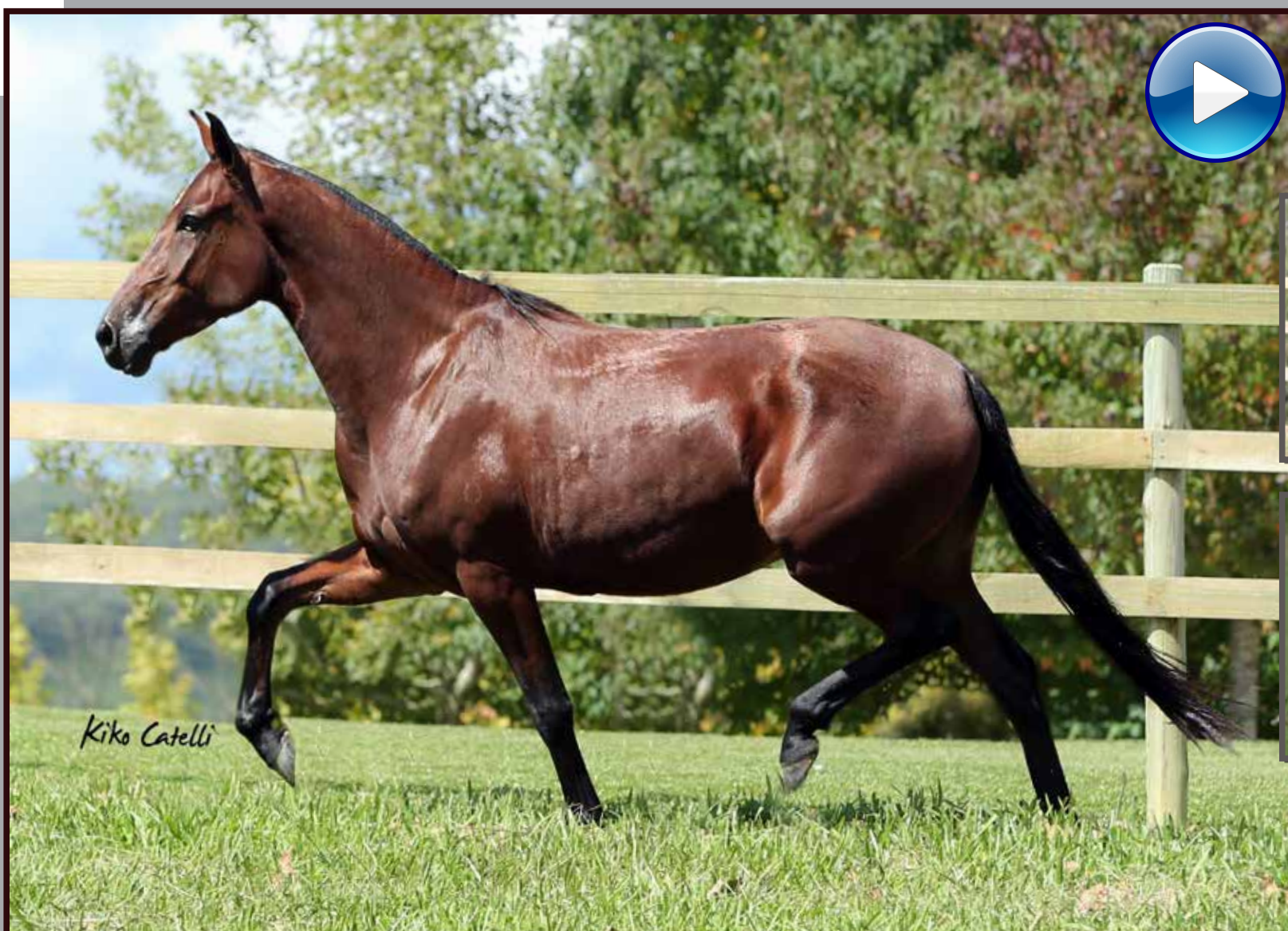
Seu pai, Iguaçu do Expoente