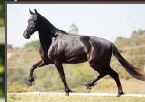
Sua mãe, Imaginada do Cardeal