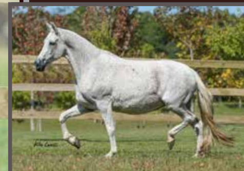
Sua avô materna, Esperança da Ilha