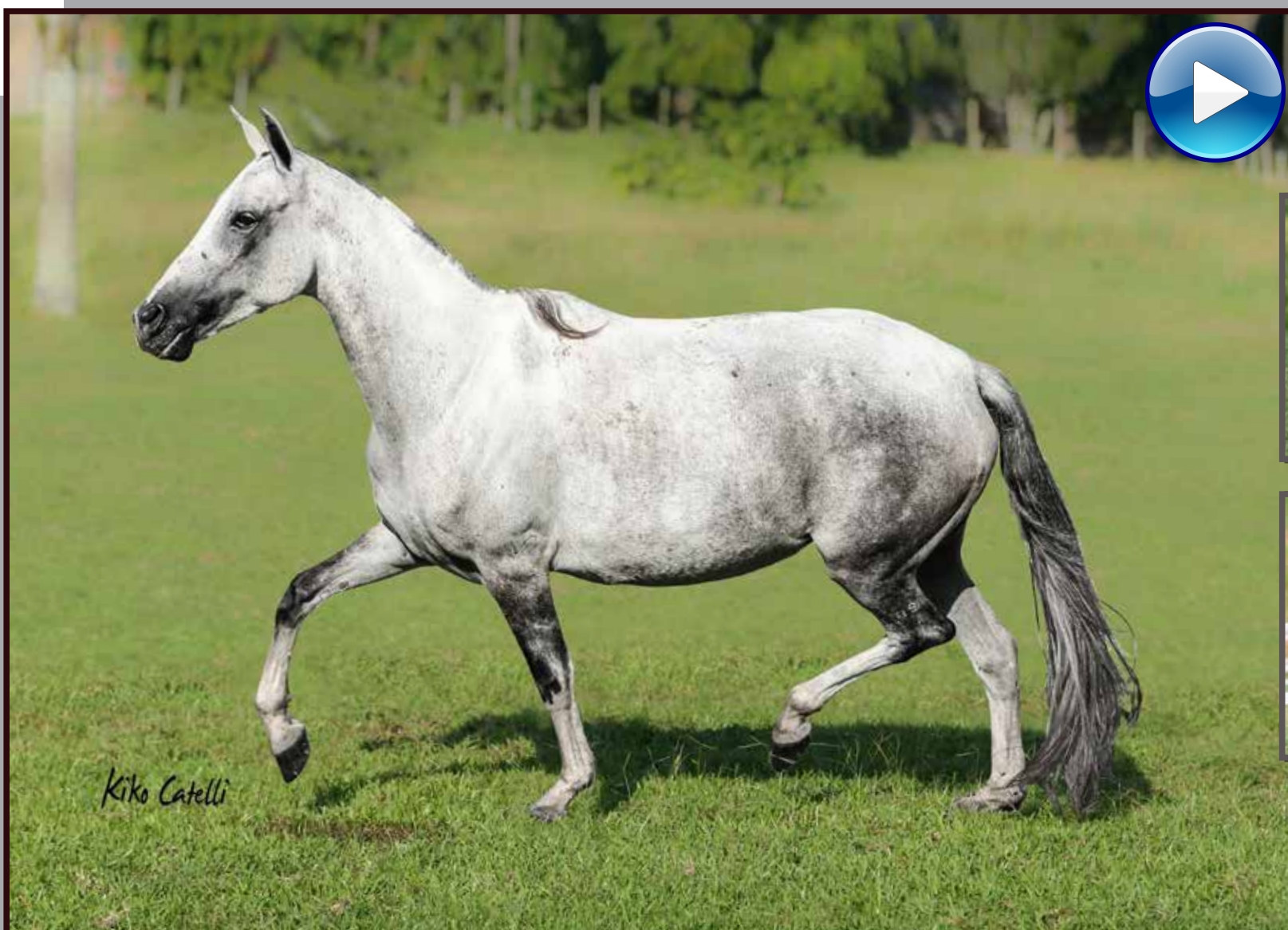
Seu filho, Bronzeado da Ilha