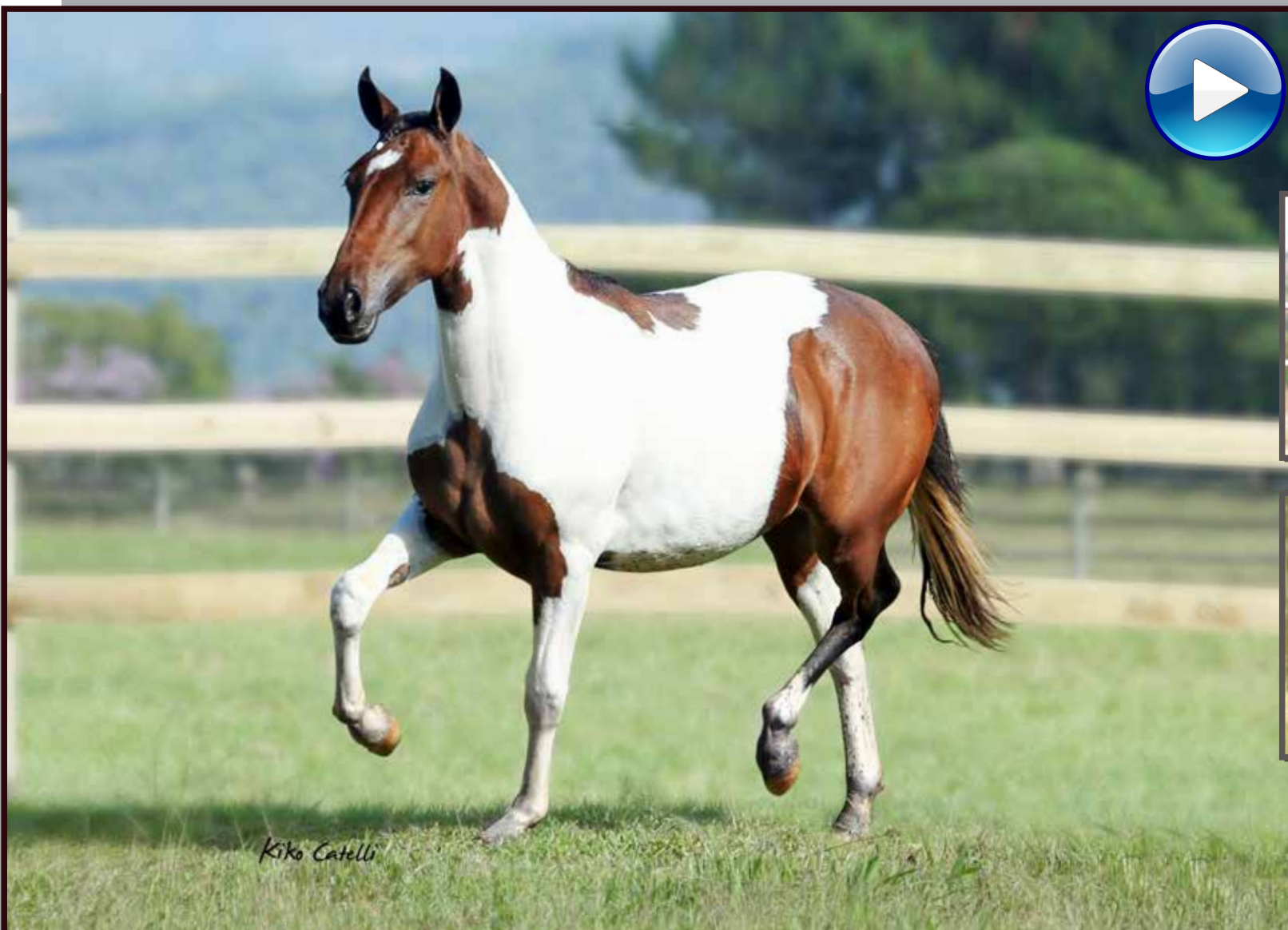
Seu pai, Forró do Aro