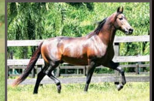
Seu avô materno, Cabuçu da Selva Morena