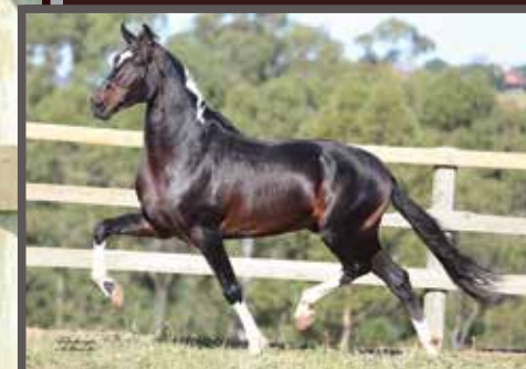
Seua avô materno, Iguacu do Expoente