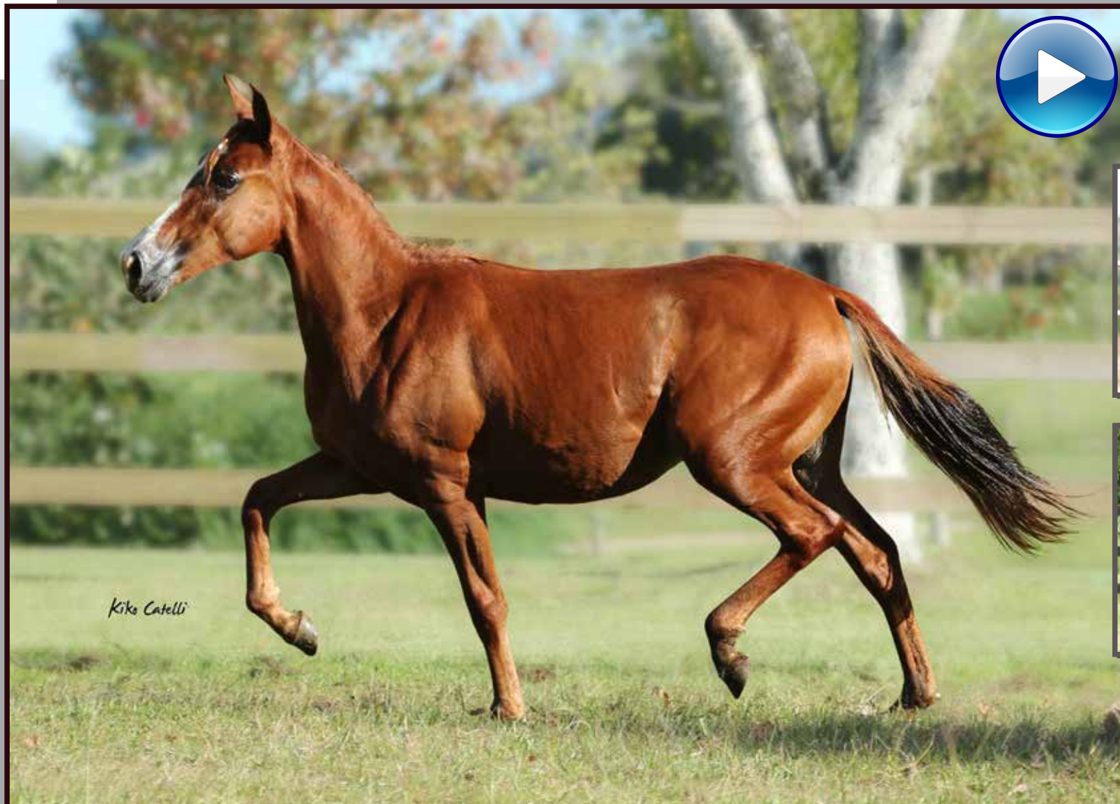
Seu pai, Forró do Aro