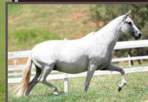
Sua mãe, Onda de Três Corações