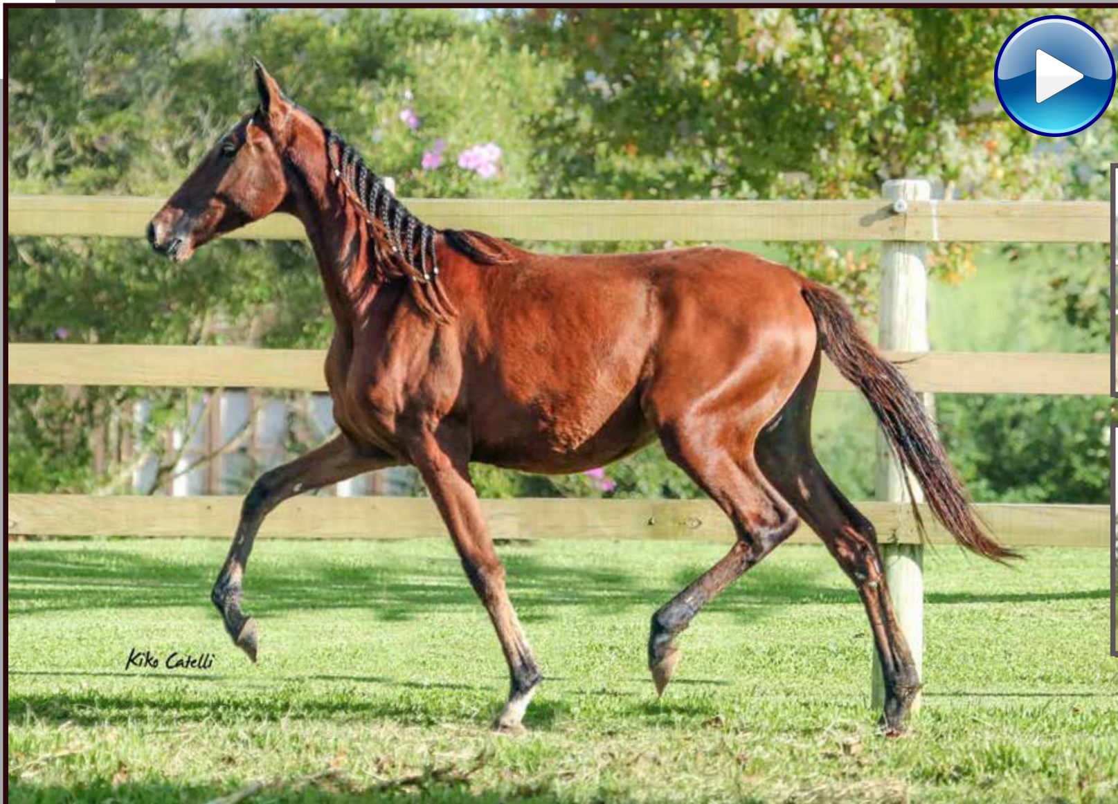
Seu pai, Forró do Aro