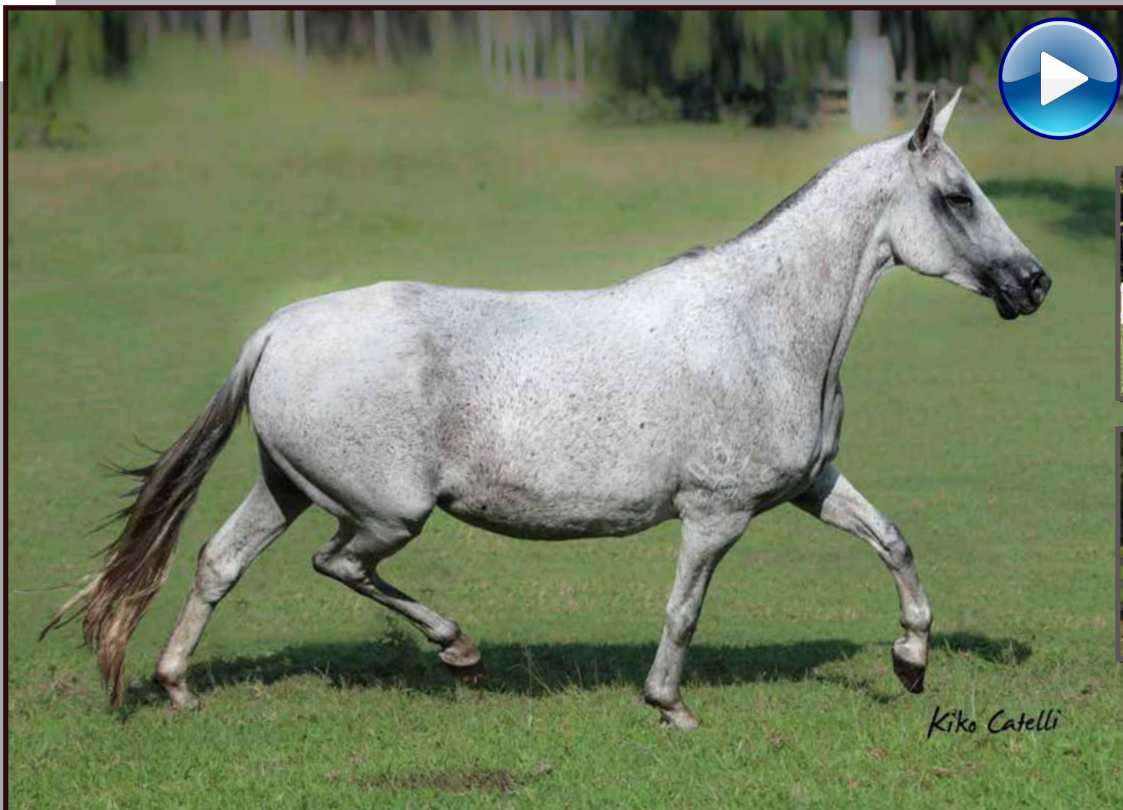
Seu pai, Extrato do Itapé