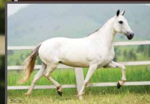
Sua avó materna, Tubaina Edú