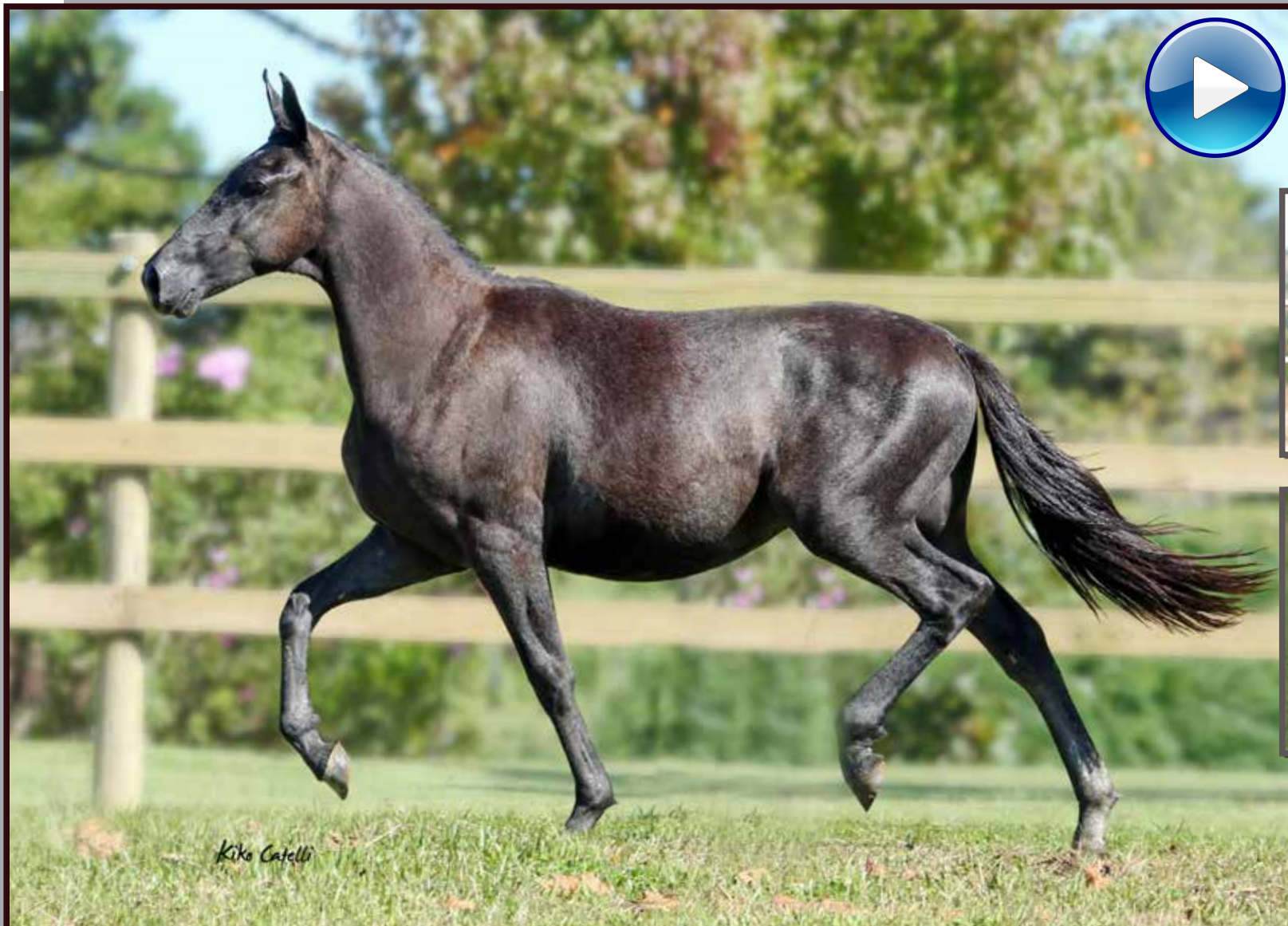
Seu pai, Forró do Aro