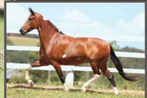
Sua mãe, Jangada do Expoente