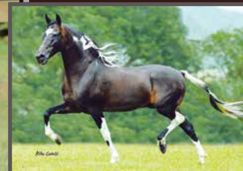
Seu avô paterno, Sublime da Ogar