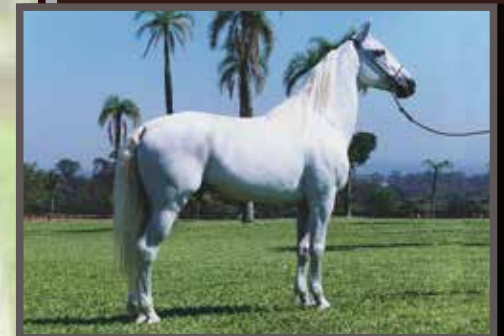
Seu avô materno, Noroeste da Ogar