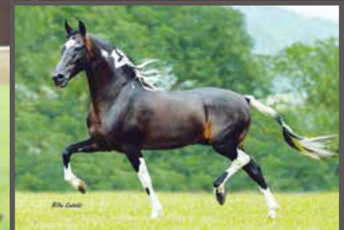
Seu avô materno, Sublime da Ogar