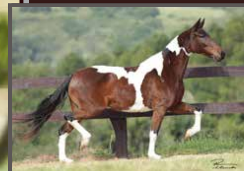
Sua mãe, Duetta da Figueira