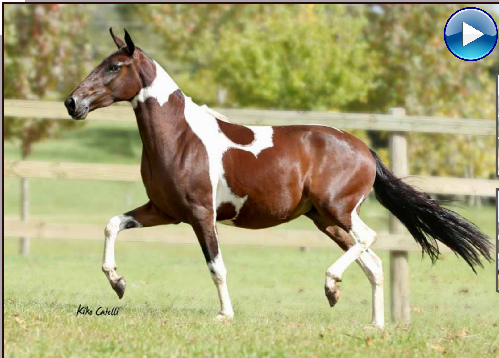
Seu pai, Forró do Aro