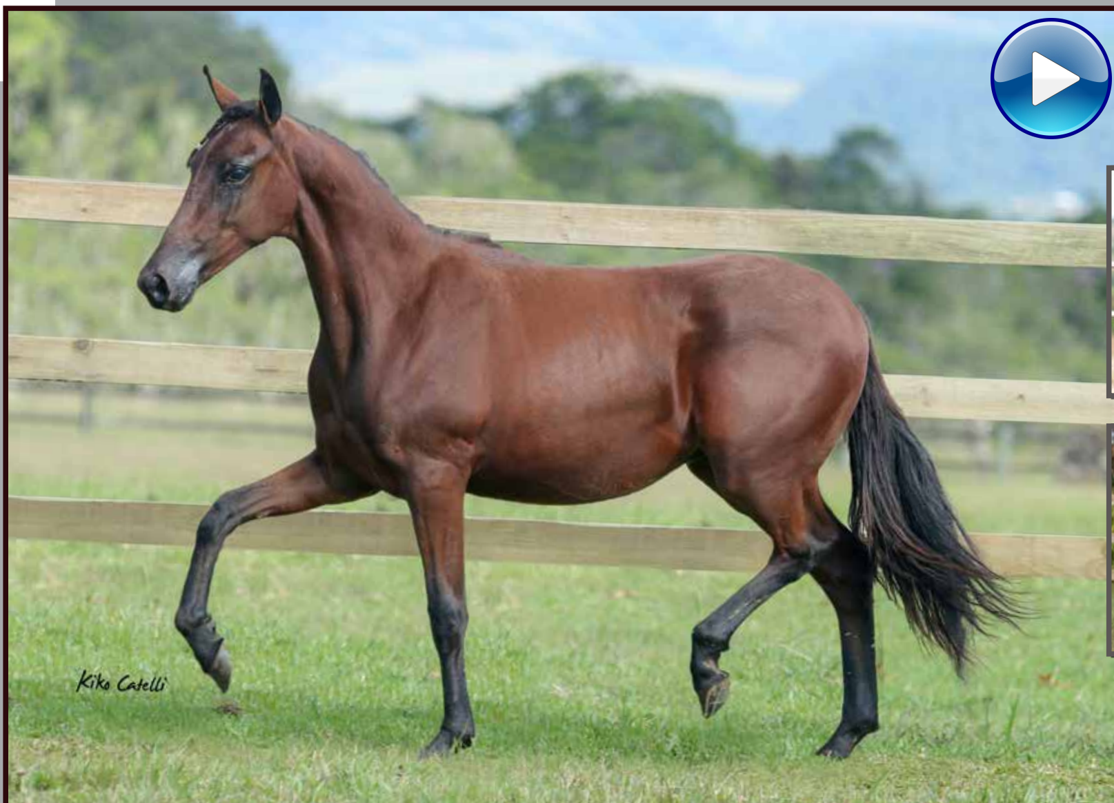
Seu pai, Forró do Aro