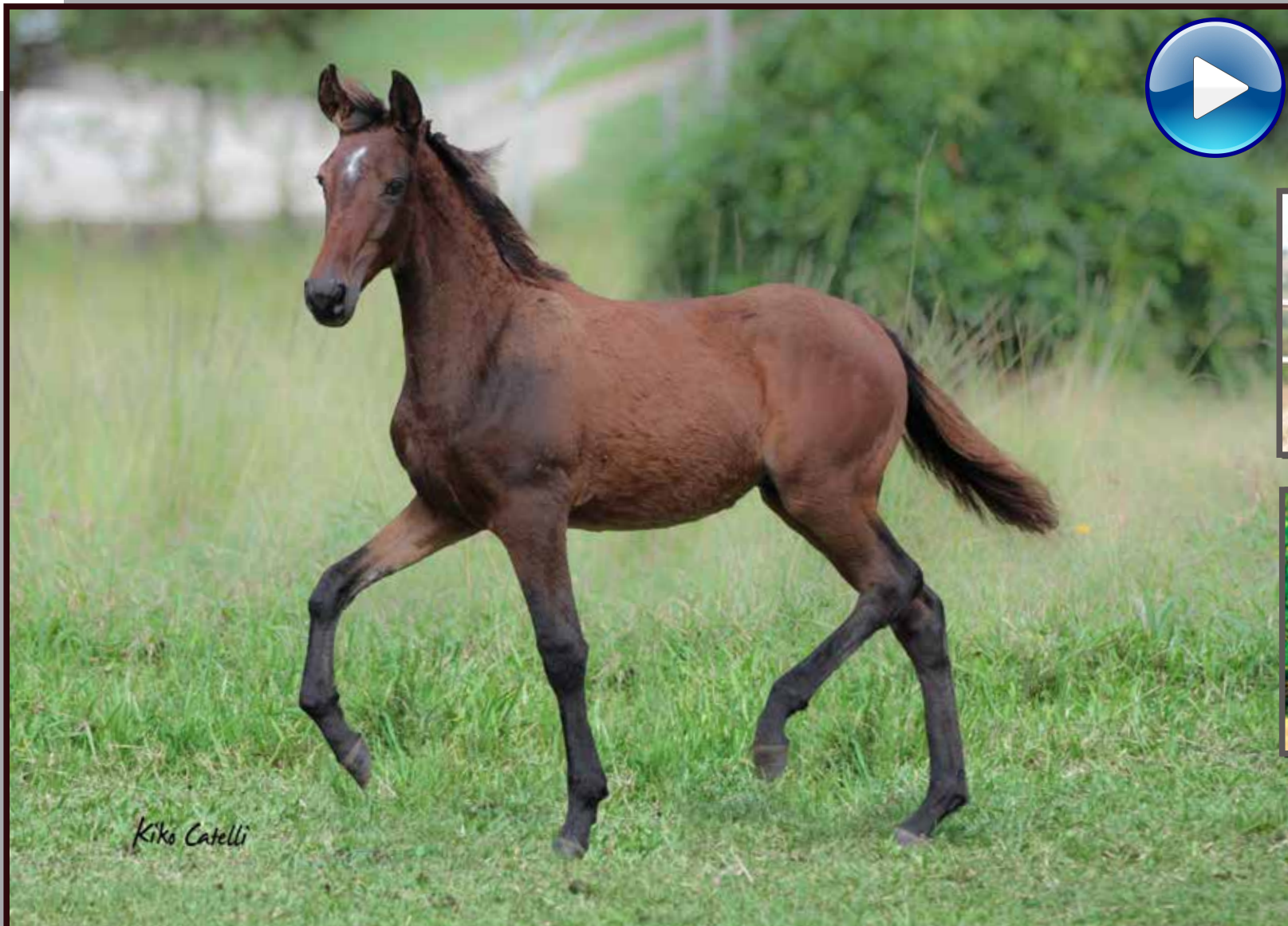
Seu pai, Forró do Aro