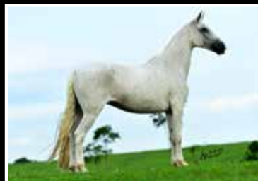
42. ORGANZA DA PEDRA VERDE