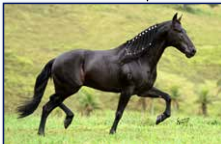
Pai Seu Chico Tandy

Fêmea • 27/10/2014 • Vendedor: Haras Rodeio