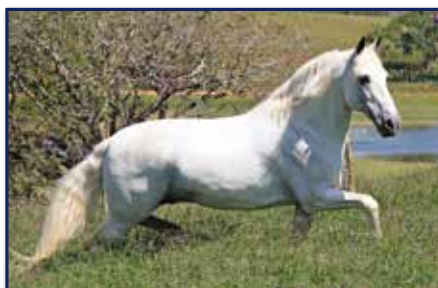
Avô paterno Ringo D2