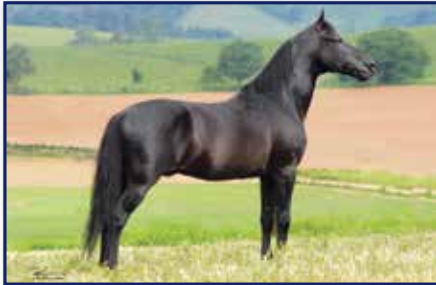
Pai Haity Caxambuense

Macho • 03/11/1998 • Vendedor: Haras Rodeio