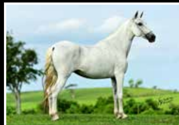
43. PINTURA DA SERRA DO MAROTO