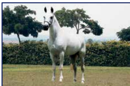
Bisavô Carvão LJ