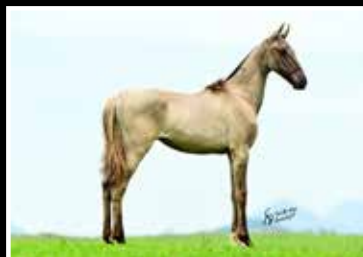
54. LEONA DA RODEIO