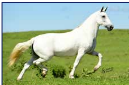
Mãe Absoluta do Caluli