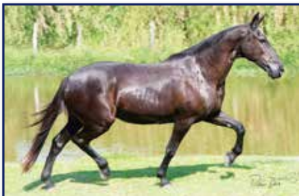
Avô paterna Jogatina L.J.