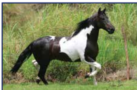
Avô materno XPTO L.J.