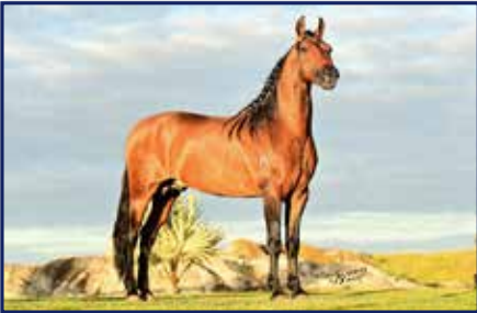
Pai Aladim do Kelner

Macho • 09/02/2020 • Vendedor: Haras Rodeio