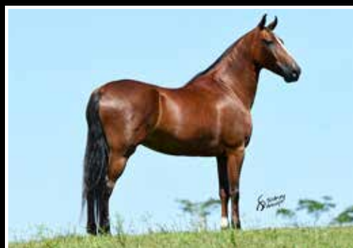
12. NAJA DO PINTADO - EMBRIÃO