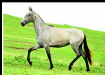
50. JUMA DA RODEIO