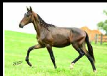
60. KLAUS DA RODEIO