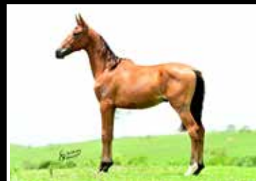
63. LUTADOR DA RODEIO