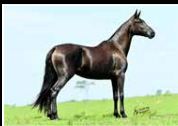
38. KARINA ALTO DA SERRA