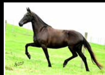
40. KENYA CAPIM FINO