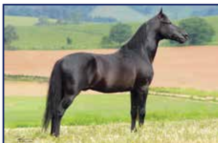
Bisavô paterno Haity Caxambuense