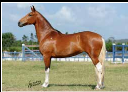
10. IMPERATRIZ DE CAPRI - EMBRIÃO