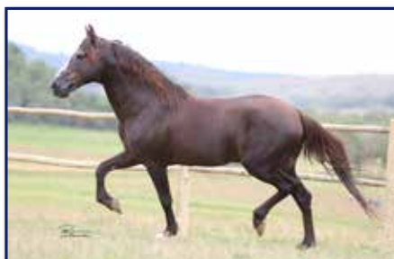
Bisavô materno Trilho da Zizica