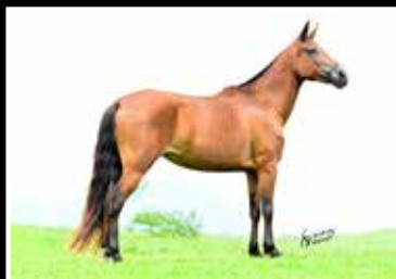
35. CATEDRAL DAS VINHAS