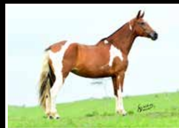
27. RAINHA DA PEDRA VERDE