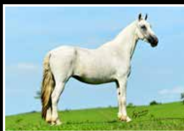
37. ESPANHOLA DO CALULI