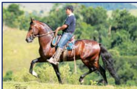
Pai Galeão RRC