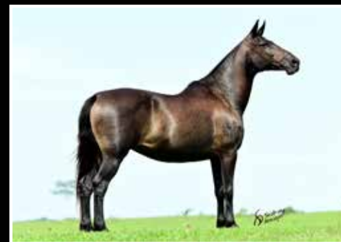
30. OFERENDA DO PORTO PALMEIRA