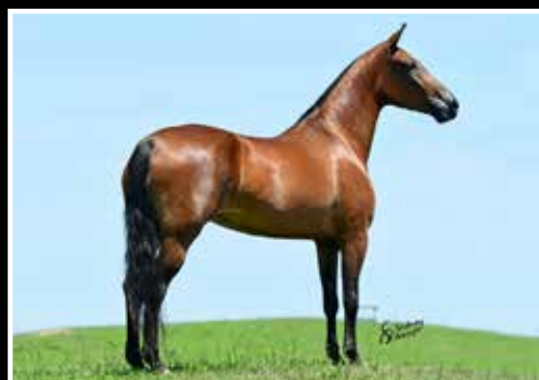
18. KIARA FJD 50%