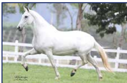
Mãe Siara Xara