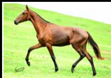
53. KATUCHA DA RODEIO