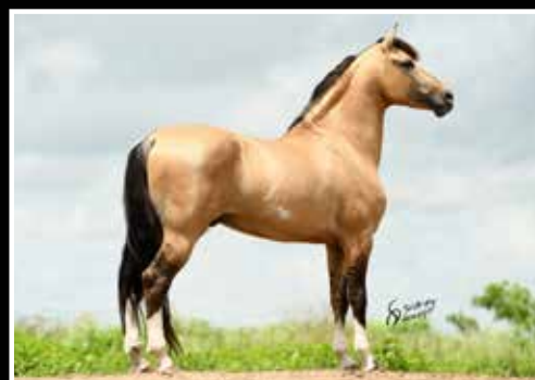
34. MAFIOSO DA CORTE 50%