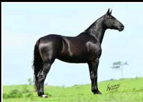
29. QUARTELA FÓRUM