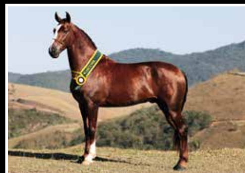
07. SIARA CAIAQUE - COBERTURA