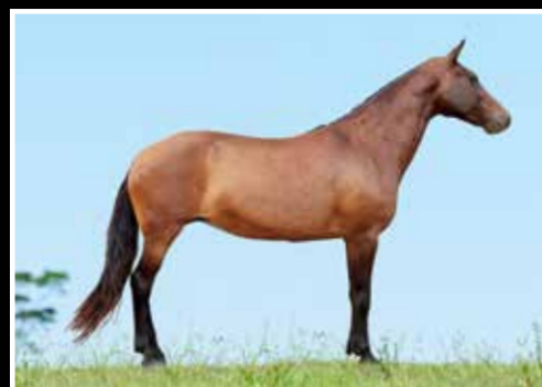
14. VIOLA DA SERRA DO MAROTO - EMBRIÃO