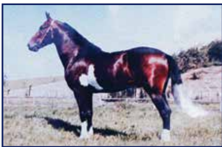
Bisavô paterno Palhaço de Ituverava