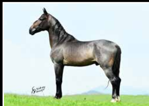
32. PIONEIRO DA PEDRA VERDE