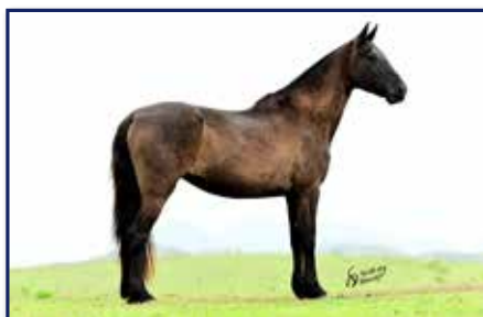
Mãe Itália D2