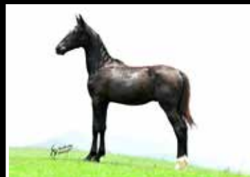
62. LEVI DA RODEIO