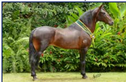
Pai Hércules da Evolução

Macho • 07/11/2019 • Vendedor: Haras Rodeio