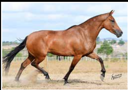
09. GAIATA DA LOUISE - EMBRIÃO