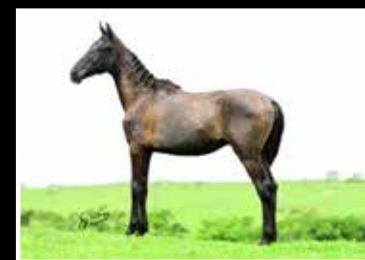
61. LACÔSTE DA RODEIO