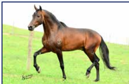
Pai Euro da Rodeio

Macho • 23/10/2019 • Vendedor: Haras Rodeio