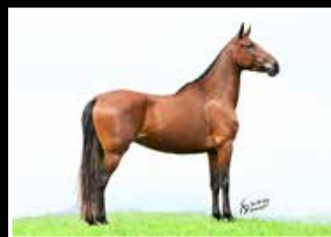
39. KATUCHA CAPIM FINO