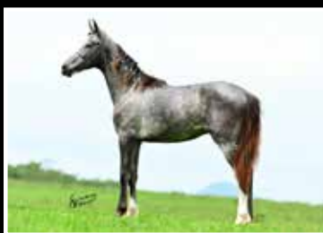
59. KAPRICHU DA RODEIO