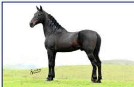
Pai Buick VN

Fêmea • 20/09/2017 • Vendedor: Haras Rodeio