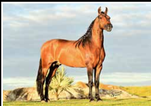
01. ALADIM DO KELNER - COBERTURA VITALÍCIA