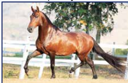
Avô paterno Tigrão Kafé

Fêmea • 11/01/2014 • Vendedor: Haras Rodeio