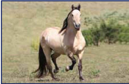
Pai Favacho Estanho

Macho • 19/02/2011 • Vendedor: Haras Rodeio