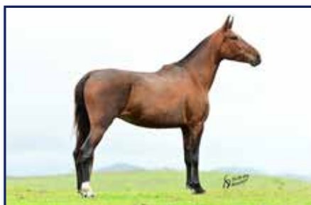
Mãe Magia da Enseada