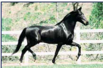
Avô paterno Meirelles Jagunço