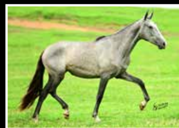
51. JUSTA DA RODEIO