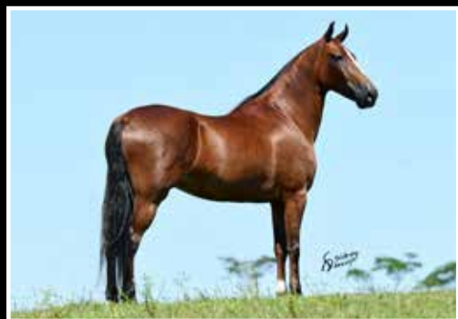
28. NAJA DO PINTADO