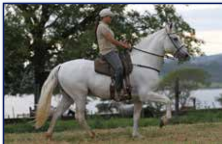
Pai Baile D2

Fêmea • 15/02/2019 • Vendedor: Haras Rodeio