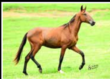
56. JEEP DA RODEIO