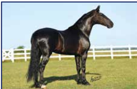
Avô materno Elfo do Porto Azul