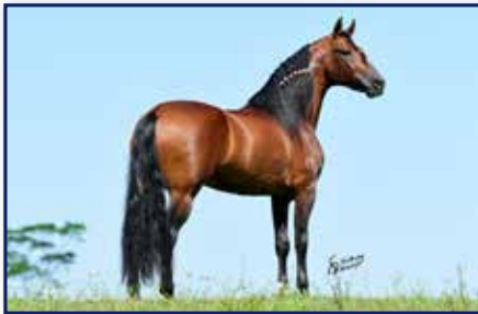
Pai Poeta do Porto Azul

Macho • 04/11/2019 • Vendedor: Haras Rodeio