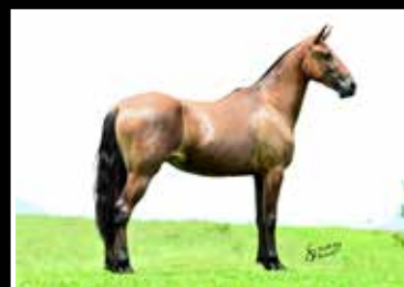
47. HONESTA DA RODEIO