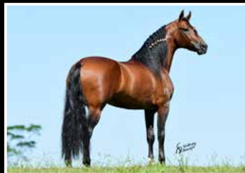
03. POETA DO PORTO AZUL - COBERTURA