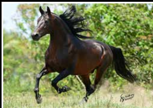
02. RADIANTE FÓRUM - COBERTURA