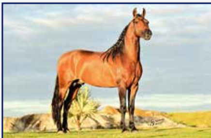
Pai Aladim do Kelner

Fêmea • 07/02/2020 • Vendedor: Haras Rodeio