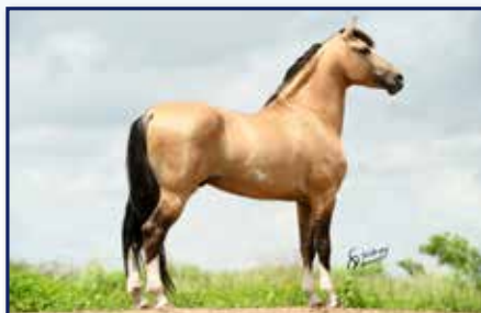
Pai Mafioso da Corte

Fêmea • 06/04/2020 • Vendedor: Haras Rodeio