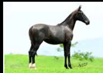
55. LUZ DA RODEIO