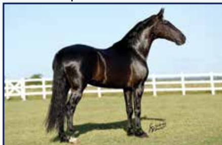
Avô paterno Efo do Porto Azul

Fêmea • 07/12/2016 • Vendedor: Haras Rodeio