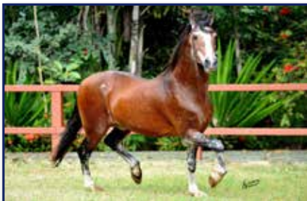
Avô materno Favacho Único