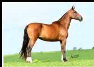
21. MARA DA PEDRA VERDE