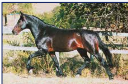
Pai Mulato D2

Fêmea • 30/11/2001 • Vendedor: Haras Rodeio