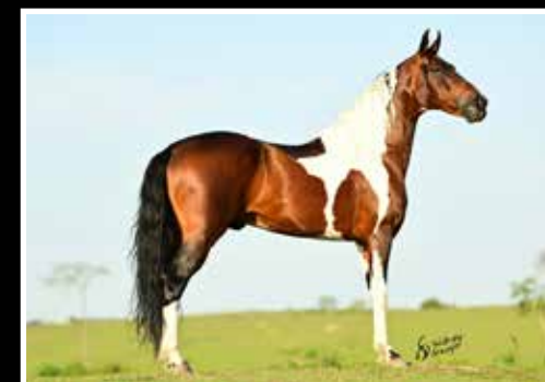
08. HORIZONTE RRC - COBERTURA