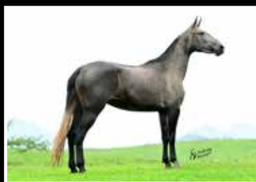
48. INDIRA DA RODEIO