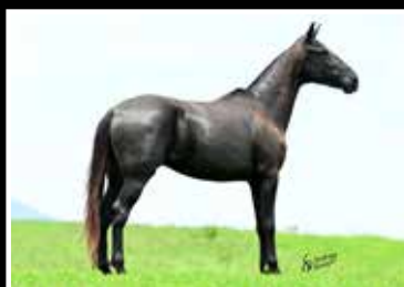
46. HILLUX DA RODEIO