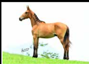
57. KABULOSO DA RODEIO