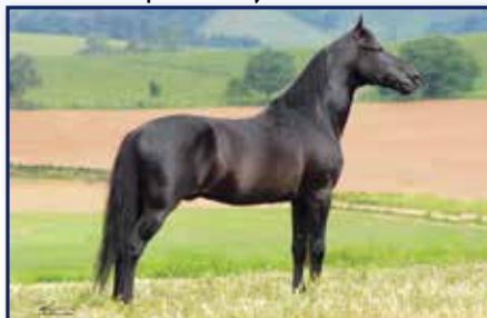
Avô paterno Haity Caxambuense