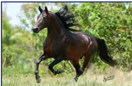
Avô paterno Radiante Fórum