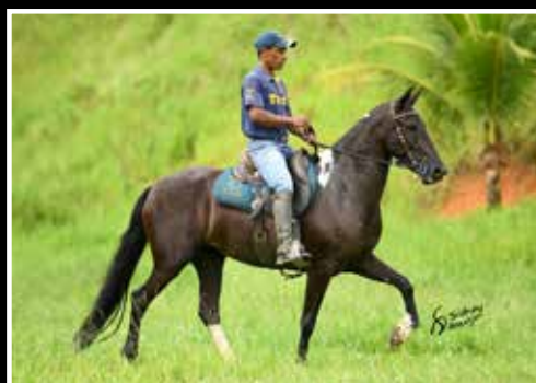
19. NAMORADA TANDY 50%