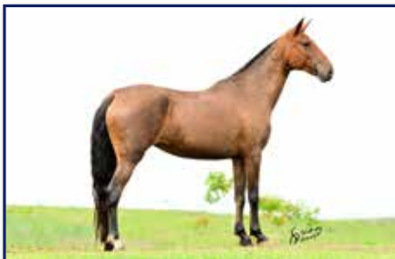
Mãe Loura da Pedra Verde