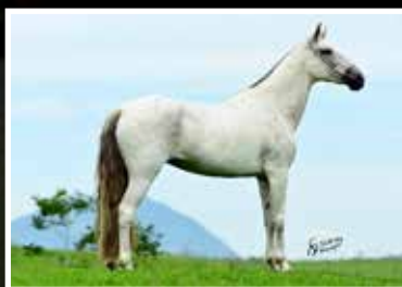
25. PAZ DA PEDRA VERDE