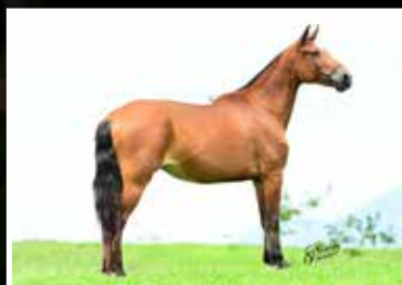
22. NAMORADA DA PEDRA VERDE