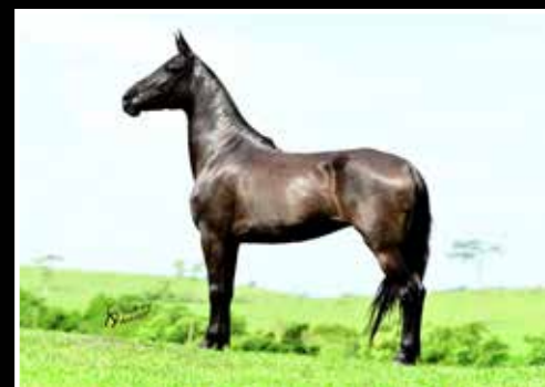
20. XAKIRA DA MANDASSAIA