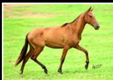
49. JABUTICABA DA RODEIO