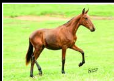
58. KAMAL DA RODEIO