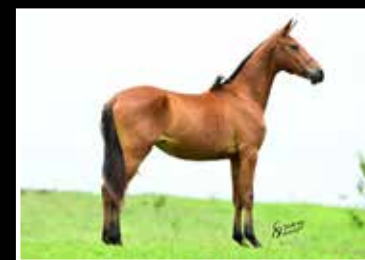
52. KARÍCIA DA RODEIO