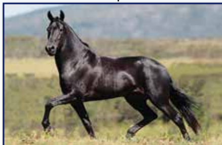
Pai Etíope D2