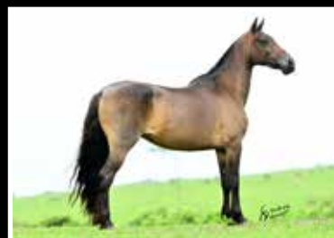
23. NAVE DA PEDRA VERDE