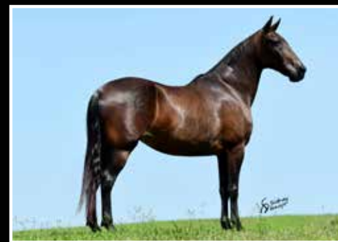
11. LENDA DO MARCHAL - EMBRIÃO