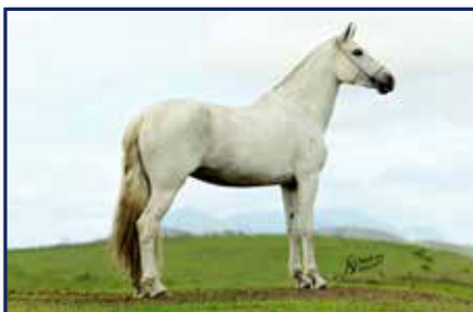
Mãe Quina da Pedra Verde