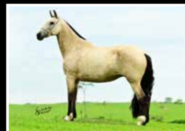
24. OLGA DA PEDRA VERDE