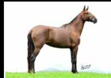
45. URCA DO DK