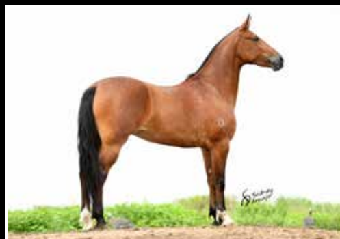
16. ALTEZA G.A.L. 50%