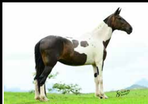
13. TROPEIRA KAFÉ DA NOVA - EMBRIÃO