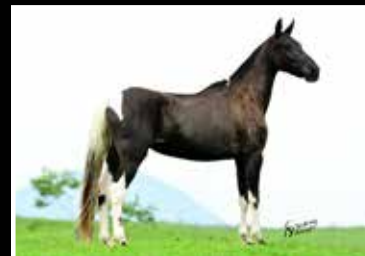
44. QUALITÁ DA RIOCON