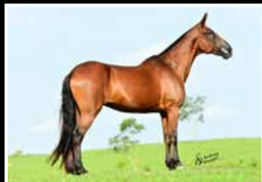
41. LUXÚRIA DO MORRO AZUL