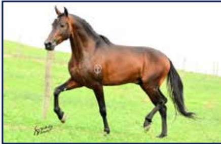
Pai Euro da Rodeio

Fêmea • 18/10/2019 • Vendedor: Haras Rodeio