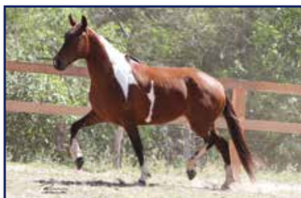
Mãe Querência da Lenda