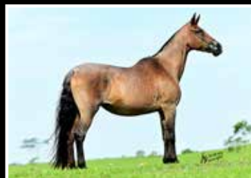
36. CIGARRA DA PEDRA VERDE