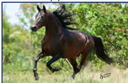
Seu irmão próprio Radiante Fórum

Fêmea • 09/02/2008 • Vendedor: Haras Rodeio