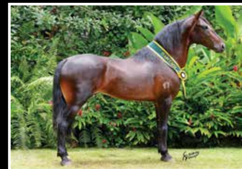
04. HÉRCULES DA EVOLUÇÃO - COBERTURA