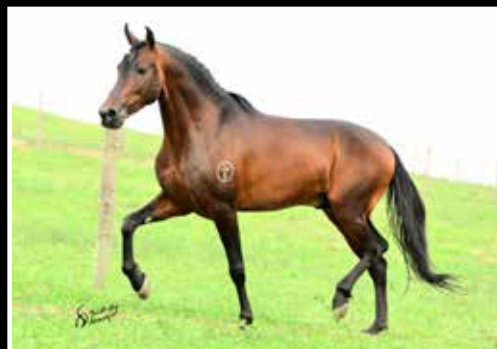
31. EURO DA RODEIO