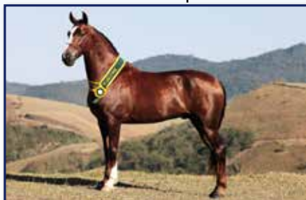
Pai Siara Caiaque

Macho • 26/09/2019 • Vendedor: Haras Rodeio