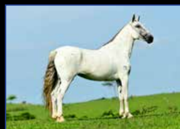
26. PLATINA DA PEDRA VERDE