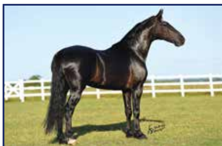
Avô materno Elfo do Porto Azul