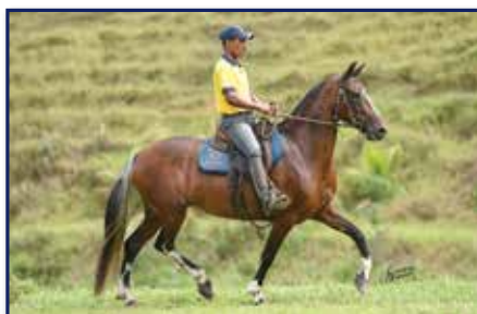
Mãe Babilônia Unit