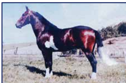
Bisavô paterno Palhaço de Ituverava