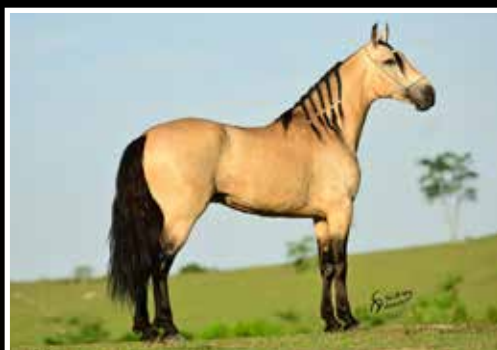
05. JATO DO PASSO PICADO - COBERTURA