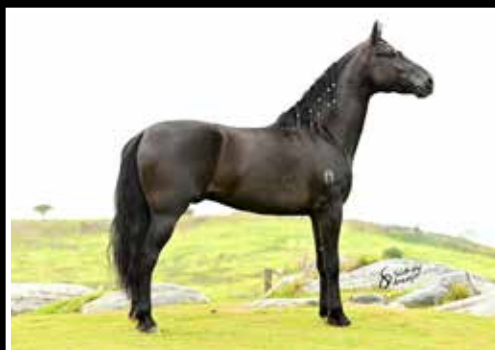
06. ELFO DO CALULI - COBERTURA