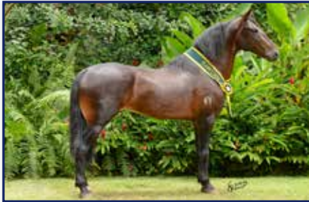
Pai Hércules da Evolução

Macho • 26/03/2020 • Vendedor: Haras Rodeio