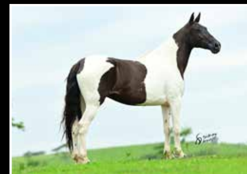
15. ZARZA SUNSET - EMBRIÃO