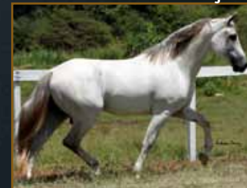
Imagem Golden Horse

Seua avô paterno, Nobre de Três Corações