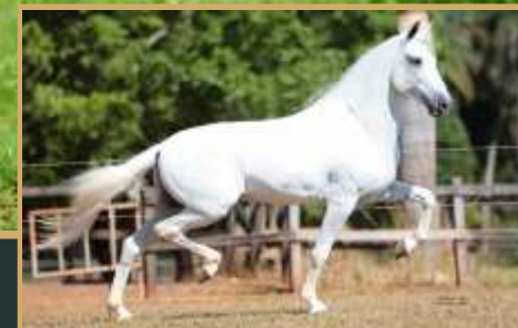
preñez do Sino do Yuri