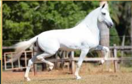
preñez do Sino do Yuri.