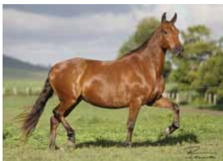
Sua mãe, Atlantida Kafe da Panorama

Somente o compromisso de tornar este remate um dos grandes leilões da raça, fez com que o Haras Malboro disponibilizasse aos senhores um óvulo da Penta Campeã Nacional e uma de suas melhores doadoras de embriões Panorama do Yuri, esta uma filha de Greco do Yuri com a grande Atlantida Kafé da Panorama. Panorama já produziu entre outros, Jordânia do Malboro, Jaça do Malboro, Lua Negra do Malboro e ostra do Malboro. Uma das grandes oportunidades deste leilão para quem deseja adquirir a genética do que há de melhor dentro do criatório do Haras Malboro.