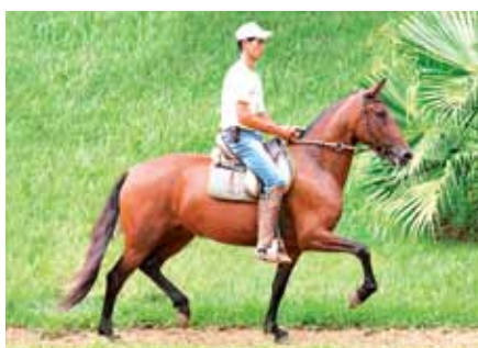
Sua mãe, Olaria do Passo Fino

Cobertura do melhor cavalo da raça Mangalarga Marchador do ano de 2014, o Grande Campeão Nacional e excepcional reprodutor Jogo do Malboro, filho do também Grande Campeão Nacional da Raça e Campeão Nacional Progenie de Pai Original do Passo Fino. Sem dúvidas um dos principais reprodutores da atualidade, cavalo jovem que vem conquistado a cada dia seu espaço como um dos grandes reprodutores da raça, sendo utilizado nos trabalhos de seleção reprodutiva dos mais renomados criatórios deste país.