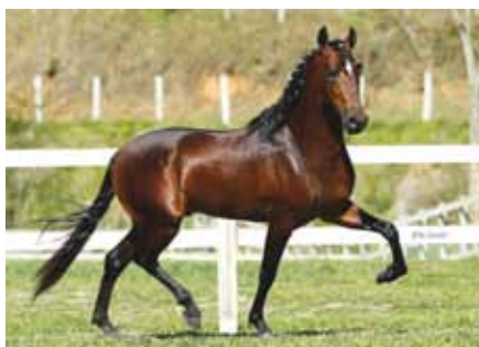
Embrião por Luar do Malboro

Lote especialmente selecionado para este leilão, opção de escolha entre óvulo aberto para livre escolha de acasalamento ou embrião pelos consagrados reprodutores Empório das Minas Gerais ou Luar do Malboro com a fenomenal Ostra do Malboro. Ostra apesar de jovem, já esta entre uma das principais doadoras do seletor plantel Malboro, filha do Grande Campeão Nacional da Raça Jogo do Malboro com a extraordinária Panorama do Yuri.