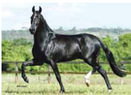
Seu pai, Favorito D2