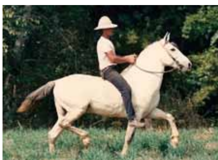
Seu avô materno, Truc do Morro Grande

Fruto do acasalamento perfeito de dois ícones representantes da nossa raça, os Campeões Nacionais Empório das Minas Gerais em Bohemia PR. Cavalos com excelente andamento e diagrama de marcha, muito raçudo, expressivo e caracterizado. Em suas veias leva sangue de dois dos mais importantes reprodutores da raça Mangalarga Marchador, na linha alta descende de Nobre de Santa Lúcia e na linha baixa de Truc do Morro Grande.