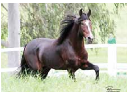
Seu pai, Guarítá Seara Dourada

Orquídea da Mandassaia Radar de Anchieta x Hortelã da Mandassaia