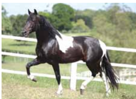
Seu pai, Extrato do Minatto

Cabuçu da Selva Morena x Java do Triângulo Jota