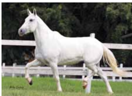
Sua avó paterna, Sevilha da Selva Morena

A genética e a qualidade de um indivíduo muitas vezes somam-se!! Nesta encontramos a junção de indivíduos que a fazem ser um diferencial na seleção de qualquer criador. Essência de raça e marcha!