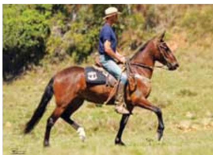
Sua avó materna, Zita Caxambuense

O objetivo é sempre criar qualidade! Essa é a primeira, filha de Delete Caxambuense, cavalo que veio para dar sequencia ao vitorioso trabalho de Extrato e Cabuçu, e a amostra já impressiona! Oportunidade!