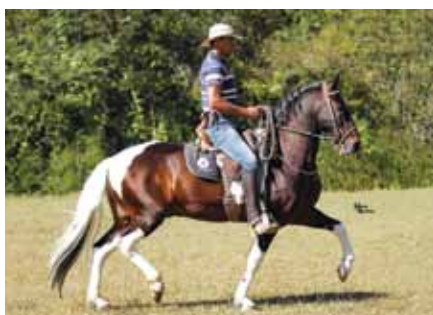
Seu pai, Delete Caxambuense

Cabuçu da Selva Morena x Rótula do Porto Palmeira