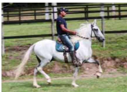
Seu pai, Ilustre do Expoente

Cabuçu da Selva Morena x Rótula do Porto Palmeira