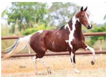
Sua mãe, Traviata da Santa Esmeralda

Apesar de jovem esta é uma das potras mais apreciadas deste leilão, simplesmente perfeita, morfologia nobre, expressiva e muito caracterizada, clássica de marcha e com genética de grandes campeões. Filha do Grande Campeão Nacional da Raça Jogo do Malboro na doadora de embriões Traviata da Santa Esmeralda, esta uma filha do também Grande Campeão Nacional da Raça Elo Kafé da Nova.