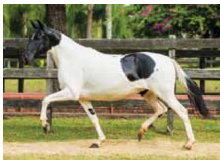
Sua mãe, Raquete do Porto Palmeira

Potra linda e marchadeira, sangue de Raquete, portanto vai ao sangue do grande Nobre de Santa Lúcia, cavalo que encontra-se na genética da maioria dos grandes indivíduos da raça.