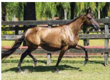
Sua mãe, Tribuna do Porto Palmeira

Dos novos garanhões Porto Palmeira, esse é um dos que comprovam a eficiência reprodutiva de Extrato! Potra diferenciada, que traz em sua base materna Cós mica e Nata, dois alicerces que definem e muito o trabalho do Haras Porto Palmeira! Das grandes apostas das cocheiras do Porto Palmeira!