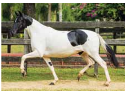
Sua mãe, Raquete do Porto Palmeira

Dos acasalamentos de maior sucesso no Haras Porto Palmeira, para aqueles que acreditam em genética, essa é a oportunidade!! Irmã própria de Vanuza do Porto Palmeira e Apache do Porto Palmeira, ganhão titular do Haras Zel!