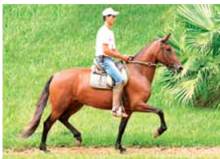
Sua mãe, Olaria do Passo Fino

Cavalo jovem de pelagem alazã, simplesmente irmão próprio do Grande Campeão Nacional Adulto da Raça do ano de 2014 Jogo do Malboro. Cavalo de grande beleza morfológica e expressão racial, muito marchador e sem duvidas com qualidades para seguir os passos do seu irmão.