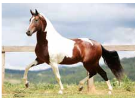
Seu pai, Equipado do Rancho Pampa

Virtude do Porto Palmeira Extrato do Minatto x Cós mica do Rebanho