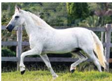
Seu pai, Nobre de Santa Lúcia