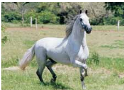
Seu avô materno, Quixote Empório

Cobertura do Penta Campeão Nacional de Marcha e Raça e pai de campeões Nacionais Empório das Minas Gerais, um filho do extraordinário e emérito reprodutor Nobre de Santa Lúcia. Empório é um cavalo completo, marchador, raçudo, de excelente biótipo de sela e qualidades morfológicas. Campeão Nacional, produtor de grandes campeões e dos Campeões Nacionais Ícone das Minas Gerais, Iludida das Minas Gerais e Madona do Malboro E Morgana do Malboro. Sem dúvidas este deixará sua marca na história do Mangalarga Marchador e tem tudo para seguir os passos de seu pai, e torna-se um dos mais respeitados ganhões da nossa raça.