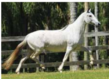
Sua mãe, Cósmica do Rebanho

O acasalamento mais certo do Haras Porto Palmeira, potro para ser garanhão e se destacar produzindo campeões com o sua irmã o vem fazendo, Virtude do Porto Palmeira, diversas vezes campeã Nacional de marcha e Raça.