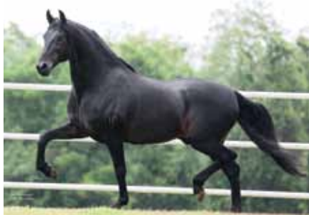
Seu pai, Original do Passo Fino

Kondor do Passo Fino x Cigana da Seara Dourada