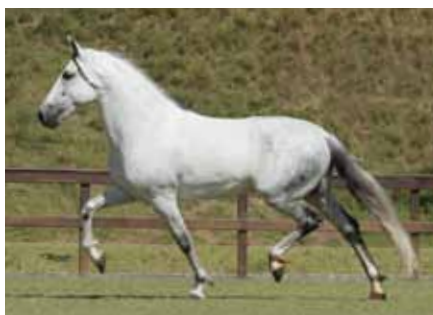
Seu avô materno, Empório das Minas Gerais

Potra fechada no melhor trabalho de seleção genética do Haras Malboro, filha do Grande Campeão Nacional Adulto da Raça 2014 Jogo do Malboro, com a também campeã Nacional e excepcional Madona do Malboro. Potra de grande potencial para pistas, extremamente marchadeira, bonita, raçuda e com genética para tornar-se uma futura doadora de embriões.