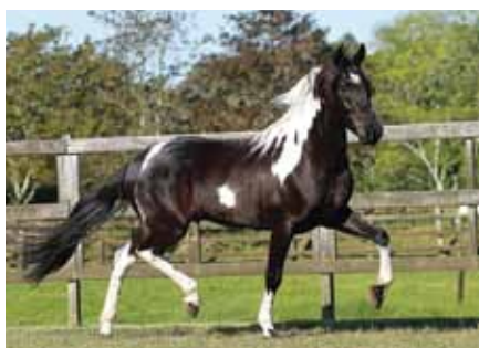
Seu pai, Jango V.N.

Nobre de Santa Lúcia x Borboleta de Azurita