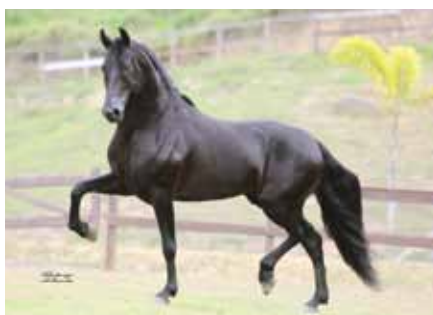
Seu pai, Jogo do Malboro

Empório das Minas Gerais x Neve da Mandassaia