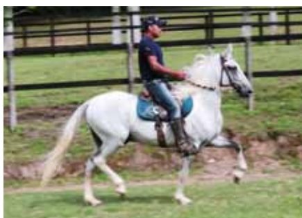
Seu pai, Ilustre do Expoente

Cabuçu da Selva Morena x Java do Triângulo Jota