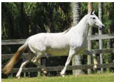
Sua avó materna, Cósmica do Rebanho

Dos acasalamentos mais consagrados do Haras Porto Palmeira! Tendo inclusive gerado um garanhão, Zinco, é um potro reserva absoluto! Na linha baixa, vai ao sangue da excepcional Cósmica do Rebanho, certeza de qualidade!