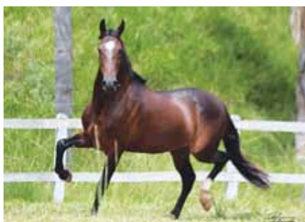
Seu pai, Completo D2

Xale D2 x Amada M.V.L. | Ringo D2 x Orquestra D2