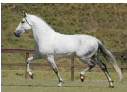
Seu pai, Empório das Minas Gerais