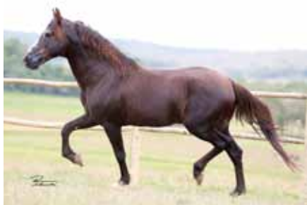
Seu avô paterno, Trilho da Zizica