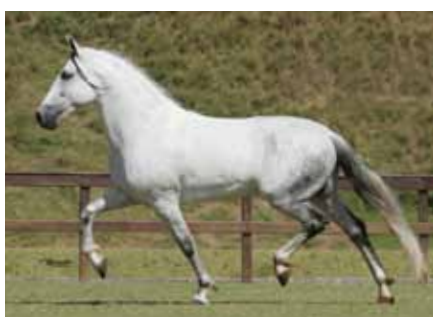
Seu pai, Empório das Minas Gerais

Truc do Morro Grande x Tulipa Pedra Ramada