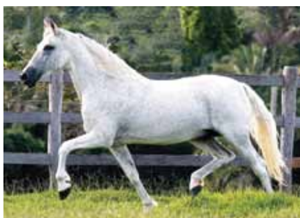
Seu pai, Nobre de Santa Lúcia

Paulista de Santa Lúcia x Famosa de Santa Lúcia | Pégaso B.R. x Ivinhema do Capitão