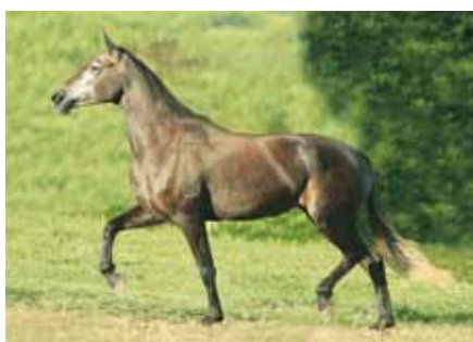
Sua mãe, Cancela L.J.

Égua jovem de pelagem tordilha, extra de andamento, morfologia e genética. Filha do grande reprodutor Tropical Morro Grande da Zizica na doadora de embriões de elite do Haras Malboro Cancela L.J. Fêmea de grande habilidade materna e sem duvidas com potencial para tornar-se uma futura doadora de embriões.