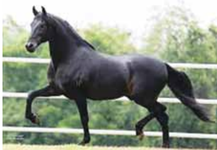
Seu pai, Original do Passo Fino

Kondor do Passo Fino x Cigana da Seara Dourada