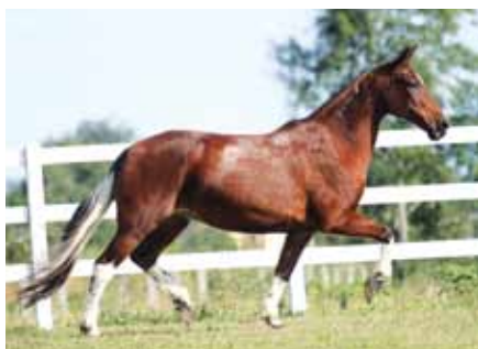
Sua avô mterna, Quatiara LJ

Para aqueles que buscam um futuro garanhão, irmão próprio do Xuvisco do Porto Palmeira, cavalo que vem se destacando por sua prole jovem e de qualidade. Extrato não vem se destacando apenas por sua produção é excelente avô, atributos que fazem deste potro uma exceção.