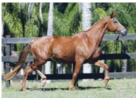
Sua mãe, Moeda JB

Potra linda e irmã própria da Campeã das Campeãs do CBM, Zafira do Porto Palmeira, se não bastasse seus títulos, vem se consagrando a cada dia como uma das principais doadoras do Haras Porto Palmeira. Oportunidade!