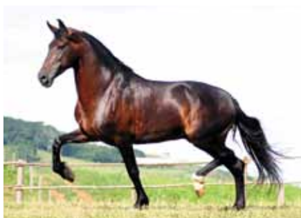
Seua vô materno, Radar de Anchieta

Potraça de pelagem castanha, filha do extraordinário reprodutor e produtor de grandes Campeões Nacionais Guarita da Seara Dourada com a doadora de embriões Orquídea da Mandassaia. Potra de andamento clássico marchado com posteriores fortes, engajados e dentro da massa, sem duvidas esta tem tudo para tornar-se uma futura doadora de embriões.