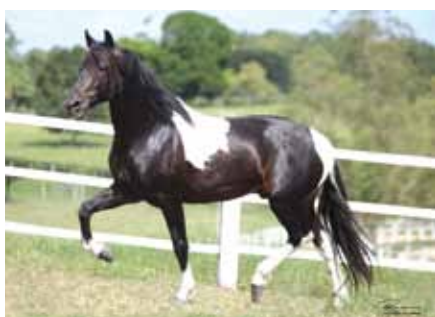
Seu avô materno, Extrato do Minatto

Petro lindo, genética de Extrato com o grande Equipado!! Oportunidade!