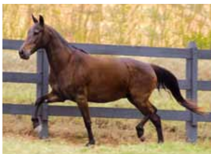
Sua mãe, Ilustrada de Cravinhos

Óvulo para livre escolha de acasalamento de uma das melhores doadoras de embriões da raça Mangalarga Marchador. Égua que dispensa maiores comentários, Grande Campeã Nacional Jovem da Raça e mãe dos campeões Nacionais História do Marlboro, Rolex do Gramont, Urso da Santa Esmeralda e Luar do Marlboro, este também Reservado Grande Campeão Nacional da Raça. Em sua genética leva o sangue de Nobre de Santa Lúcia e Alta do Panorama, dois ícones da nossa raça.