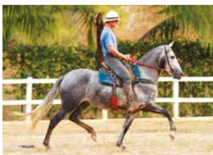
Sua mãe, Carioca JLNS

Égua jovem selecionada na cabeceira do time de pistas do Haras Malboro, filha do extraordinário reprodutor, Grande Campeão Nacional da Raça Jogo do Malboro na também campeã Nacional de Marcha e fenomenal doadora Carioca JLNS. Égua de grande potencial e promessa para as pistas, e sem duvidas com genética do que há de melhor no trabalho de seleção Malboro.