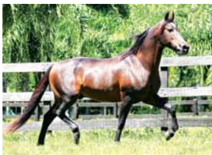
Seu avô materno, Cabuçu da Selva Morena

As oportunidades de se adquirir filhas do Extrato tornam-se cada vez mais escassas, uma vez que, quem as tem não vende devido a sua alta capacidade de gerar campeões!! Essa Catléia, traz mais, irmã própria do Campeão Nacional Xuvisco do Porto Palmeira, leva o sangue da extraordinária Ruiva do Porto Palmeira, uma das grandes filhas de Cabuçu, pilar base do Haras Porto Palmeira.