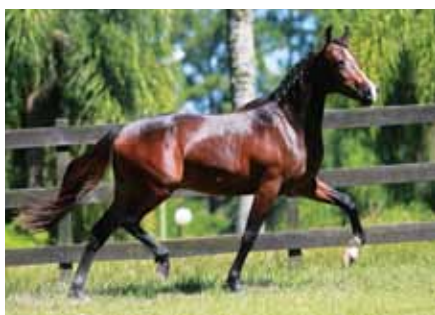
Seu filho, Vermelho do Porto Palmeira

Fumaça do Morro Azul | Bailarina M.V.L. Laglória Essen x Hereditária Sanches | Anghá Jemara x Flávia Tricordiana