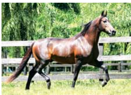
Seu pai, Cabuçu da Selva Morena

Cabuçu da Selva Morena | Java do Triângulo Jota Original de Santa Lúcia x Juventude da Selva Morena | TAC