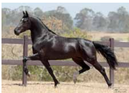
Embrião por Patriarca da Santa Esmeralda