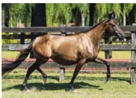
Sua mãe, Tribuna do Porto Palmeira

Égua jovem, fruto do acasalamento do Extrato em Tribuna, esta que vai ao sangue do grande Favacho Diamante na campeoníssima nacional Nata do Porto Palmeira, sendo portanto, Tribuna, irmã de Irapuru do Porto Palmeira, Campeão cos Campeões Nacional de Marcha Castrado!