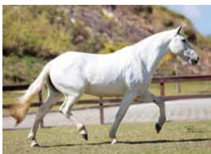
Sua mãe, Cantora D2

Só mesmo o desprendimento e o compromisso de oferecer o que há de melhor em seu plantel, fizeram com que o Haras Malboro disponibilizasse 25% das cotas de uma de seus principais reprodutores, o Campeão Nacional e pai de Campeões Nacionais Favorito D2. Cavalos que dispensa maiores apresentações, lindo, marchador, preto, campeão Nacional e produtor de Campeões.