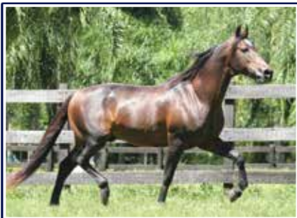
Cabuçu da Selva Morena