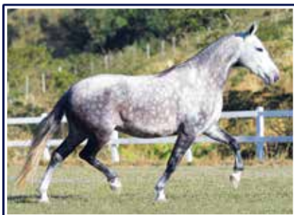
Kerozene da Catimba

Linda matriz de pelagem baia, filha do fenomenal reprodutor e um dos mais conceituados padreadores da raça Favacho Estanho em Kerozene da Catimba. Égua jovem de muito bom andamento e diagrama de marcha, grande aptidão reprodutiva e genética para tornar-se uma futura doadora de embriões.