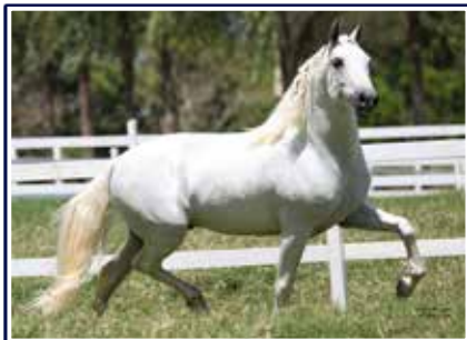
Trapiche do Porto Palmeira