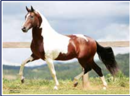
Equipado do Rancho Pampa