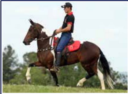
Zafira do Porto Palmeira

Excepcional potro de pelagem preta, filho do Reservado Campeão Nacional de Marcha e grande reprodutor Delete Caxambuense na doadora de embriões, Campeã das Campeãs CBM 2014, Zafira do Porto Palmeira. Potro de andamento clássico marchado, posteriores fortes, engajados e dentro da massa, belas passagens morfológicas e genética superior, qualidades que certamente o levarão ao posto de um futuro reprodutor e grande campeão de pistas.