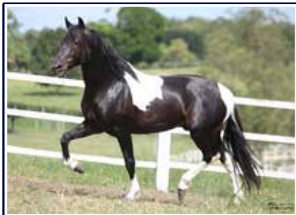
Extrato do Minatto