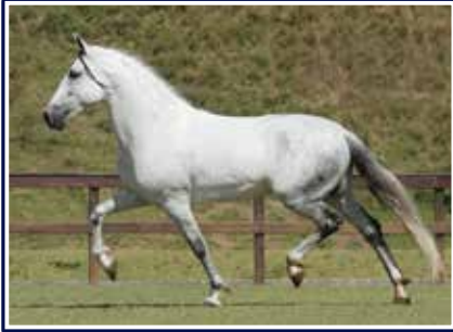
Empório das Minas Gerais