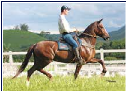
Quaresmeira de Ituverava

Excepcional égua de pelagem baia, fêmea de grande expressão e caracterização racial, muito marchadeira, diagramada e cômoda. Filha de um dos maiores expoentes reprodutores da nossa raça, o extraordinário Favacho Estanho com a grande doadora de embriões Quaresmeira de Ituverava. Égua para fazer tropa, muita genética em seu pedigree e pronta para servir qualquer plantel.