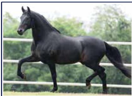
Original do Passo Fino