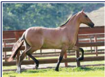
Jordânia do Malboro

Potra que representa muito bem o trabalho de seleção realizado dentro do Haras Malboro, fruto do acasalamento do Grande Campeão Nacional Adulto da Raça Jogo do Malboro na também Campeã Nacional e nobre doadora de embriões Jordânia do Malboro. Potra jovem e de grande aptidão para pistas, genética do que há de melhor no Haras Malboro e futura doadora de embriões.