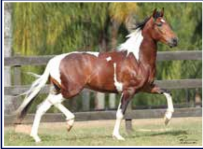
Xuvisco do Porto Palmeira