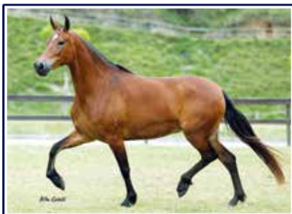
Panorama do Yuri

Futuro reprodutor de pelagem castanha, cavalo em fase inicial de sua vida adulta e doma, extremamente marchador, raçudo e caracterizado. Fruto do cruzamento consagrado de dois dos maiores expoentes animais do Haras Malboro, o Grande Campeão Nacional Adulto da Raça Jogo do Malboro com a extraordinária doadora de embriões Panorama do Yuri. Cavalo de futuro promissor nas pistas e sem duvidas com qualidades para torna-se um grande reprodutor. Quando potro sagrou-se 1º Premio Potro Master Nacional 2017 e tem tudo para trilhar o mesmo caminho agora montado.