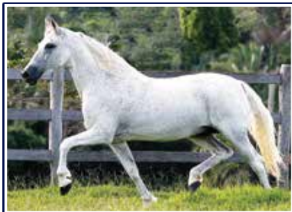
Nobre de Santa Lúcia

Cobertura unitária de um dos principais e mais consagrados reprodutores da atualidade, o Campeão Nacional e pai de Campeões Nacionais Empório das Minas Gerais. Cavalos que dispensa maiores apresentações, marchador nato, expressivo, caracterizado, comprovado nas pistas e na produção e com genética do que há de melhor na raça, filho de Nobre de Santa Lúcia em Galeria do Cardeal.