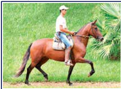
Olaria do Passo Fino

Potra jovem de pelagem rosilha, filha do Grande Campeão Nacional Adulto da Raça e um dos reprodutores chefes da seleção Malboro, o fenomenal Jogo do Malboro em Justiça Morro Grande da Zizica, esta que leva em suas veias sangue dos extraordinários Favacho Estanho e Truc do Morro Grande. Potra de muito bom andamento e diagrama de marcha, jovem e com potencial para torna-se uma futura reprodutriz.