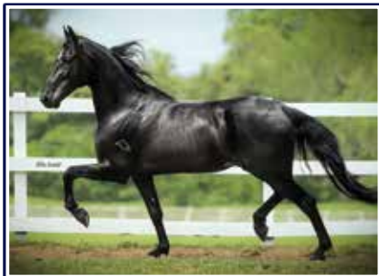
Impossível do Minatto