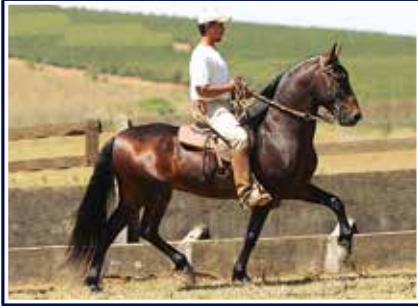
Volante do Círculo D