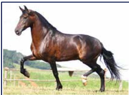
Radar de Anchieta

Linda jovem, filha do excepcional reprodutor Campeão Nacional e pai de Grande Campeões Nacionais Favorito D2 em Orquídea da Mandassaia, esta um filha de Radar de Anchieta. Fêmea jovem de excelente andamento e morfologia, genética comprovada e muita aptidão materna, sem duvidas ela tem tudo para tornar-se uma futura doadora de embriões.