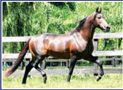
Cabuçu da Selva Morena

Todos nós sabemos que para ser um reprodutor, além de ter qualidades zootécnicas de marcha e morfologia diferenciadas é preciso ter genética comprovada, e este potro apresenta todas estas premissas de um futuro reprodutor e grande campeão de pistas. Marchador nato, raçudo, expressivo e filho do grande Extrato do Minatto em Zayda do Porto Palmeira, portanto, em seu pedigree leva as origens de Rubi L.J, Quatiara L.J, Cabuçu da Selva Morena, Roleta do Porto Palmeira, Nobre de Santa Lúcia e Borboleta do Cardeal.