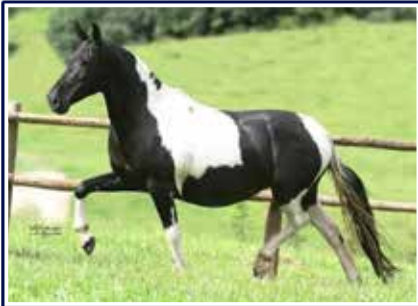
Esparta Golden Horse

Éguaço de pelagem preta pampa, fêmea jovem e sem duvidas umas das estrelas deste remate. Filha de Zinco do Porto Palmeira com Esparta Golden Horse, portanto, em suas veias leva o sangue de Extrato do Minatto, Sereia do Porto Palmeira, Tarot Kafé, Nata LJ, Rubi LJ, Quatiara LJ, Cabuçu da Selva Morena, Cós mica do Rebanho, Palhaço de Ituverava e General LJ.