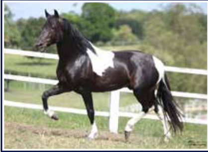
Extrato do Minatto