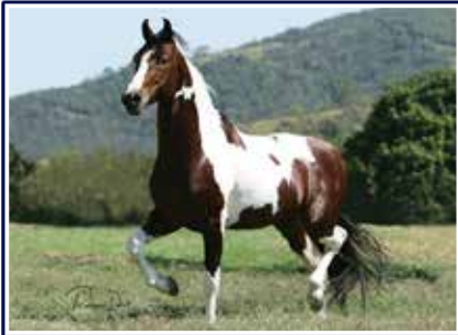
Elo Kafé da Nova

Potro de extrema beleza e caracterização racial, marchador, diagramado e de linda pelagem pampa de castanho. Potro que representa o brilhante trabalho de seleção realizado dentro do criatório Porto Palmeira, filho de Zinco do Porto Palmeira em Urussanga do Porto Palmeira, portanto, em sua genética leva as origens de Extrato do Minatto, Sereia do Porto Palmeira, Elo Kafé da Nova e Quatiara L.J. Futuro reprodutor e sem duvidas com grande aptidão para torna-se um grande campeão nas pistas.