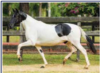
Raquete do Porto Palmeira

Linda potra de pelagem castanha pampa, fruto de um dos cruzamentos mais acertados dentro da criatório Porto Palmeira, do excepcional reprodutor Extrato do Minatto com a grande doadora de embriões Raquete do Porto Palmeira. Potra de futuro promissor, extremamente marchadeira, raçuda e expressiva, futura doadora de embriões e com grandes chances para seguir os passos vitoriosos dos seus pais e irmãos.