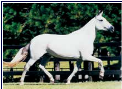
Fá da Selva Morena

Linda potra de pelagem castanha, feminina, expressiva, refinada e extremamente marchadeira. Filha do Grande Campeão Nacional, Campeão Nacional progênie de pai e um dos reprodutores mais consagrados da atualidade o excepcional Extrato do Minatto em uma das principais doadoras de embriões do seletor plantel Porto Palmeira, a matriarca Fá da Selva Morena.