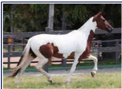
Ressaca da Santa Esmeralda

Linda potra de pelagem pampa de preto, filha do excepcional reprodutor Jogo do Malboro na doadora de embriões Ressaca da Santa Esmeralda, esta um filha de Elo Kafé da Nova. Potra de excelente andamento e diagramada de marcha, muito bela, expressiva, caracterizada e raçuda.