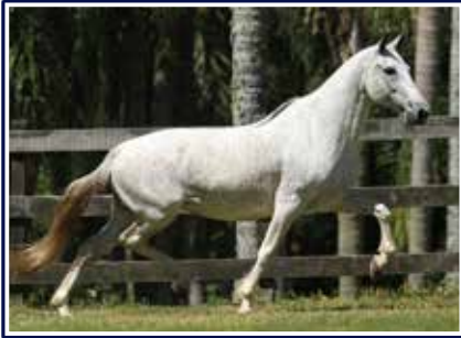
Cósmica do Rebanho

Égua de andamento clássico marchado, muito cômoda, diagramada, bonita e expressiva. Filha do Campeão Nacional e comprovado reprodutor Xuvisco do Porto Palmeira em uma das principais doadoras de embriões do criatório e da raça a Res. Grande Campeã Nacional Adulta da Raça Cósmica do Rebanho. Égua jovem e de futuro promissor nas pistas e na reprodução.