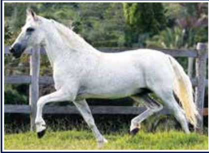
Nobre de Santa Lúcia

Sem duvidas um dos pontos mais altos deste remate, oportunidade rara para quem procura um reprodutor de genética superior e grande campeão de pistas para integrar seu plantel. Cavallo jovem, filho de um dos mais respeitados e conceituados reprodutores da nossa raça, o fenomenal Nobre de Santa Lúcia com a doadora de embriões Promessa da Morada Nova, égua filha de Junqueira Titanic com a emérita Vaidosa da Selva Morena. Nobre possui qualidades zootécnicas e genética que o leva ao posto de um futuro reprodutor de destaque da nossa raça.