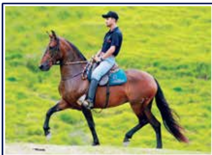
Sapucaí do Porto Palmeira

O Haras Malboro para abrilhantar ainda mais este grande remate, selecionou na cabeceira de seu plantel um óvulo da excepcional égua de pelagem preta, uma de suas grandes apostas para as pistas e reprodução Revista do Malboro. Ela que é filha de dois grandes campeões nacionais, o Grande Campeão Nacional Adulto da Raça Jogo do Malboro na Campeã das Campeãs Nacional de Marcha Sapucaí do Porto Palmeira.