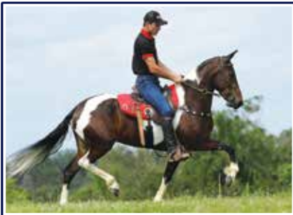
Virtude do Porto Palmeira

Potro que já nasceu com pinta de reprodutor e sem duvidas será. Raçudo, marchador, bonito, expressivo e com genética top; filho do excepcional reprodutor Equipado do Rancho Pampa na Campeã Nacional e grande doadora Virtude do Porto Palmeira, ela que é filha de Extrato do Minatto em Cós mica do Rebanho. Potro para quem procura um futuro reprodutor e grande campeã de pistas.