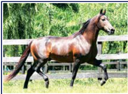
Cabuçu da Selva Morena

Potra que representa com maestria um dos mais consagrados criatórios da atualidade, seleiro de grandes campeões Nacionais o Haras Porto Palmeira. Simplesmente um fenômeno; linda, expressiva, caracterizada e muito marchadeira e de pelagem preta pampa. Filha do grande padreador e um dos mais consagrados reprodutores do Mangalarga Marchador Extrato do Minatto em Valesca do Porto Palmeira, ela uma filha de Cabuçu da Selva Morena. Potra para entrar na cabeceira de qualquer plantel, futura doadora de embriões e sem duvidas grande campeã de pistas.