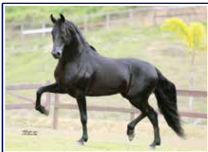
Jogo do Malboro