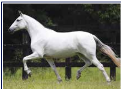
Viciada de Alcatéia

Óvulo para livre escolha de acasalamento da extraordinária e jovem doadora de embriões do time de estrelas do Haras Malboro Renda do Malboro. Égua de extrema beleza morfológica, expressão racial e caracterização, marchadeira nata, diagramada e comprovada nas pistas. Filha do Grande Campeão Nacional Adulto da Raça Jogo do Malboro com Viciada de Alcatéia, esta por sua vez uma filha do Campeão dos Campeões Nacional de Marcha Favacho Diamante.