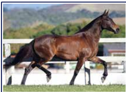
Regata do Porto Palmeira

Linda égua de pelagem preta, fêmea jovem e que leva em seu pedigree a essência do que há de melhor do criatório Malboro, filha do Grande Campeão Nacional Adulto da Raça Jogo do Malboro em uma das mais consagradas doadoras do seu time de estrelas, a extraordinária Regata do Porto Palmeira.