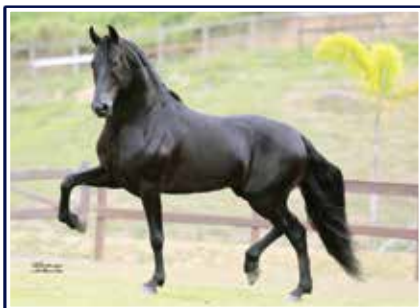
Jogo do Malboro