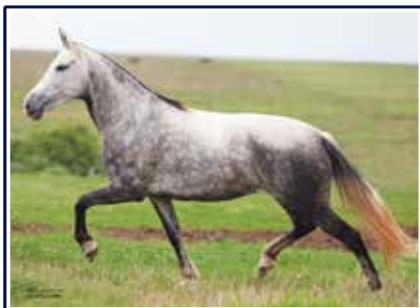
Panorama do Yuri

Potra de andamento diferenciado, extremamente marchadeira, diagramada, com posteriores fortes e engajados dentro da massa. Fêmea jovem e que já demonstra toda sua soberania, possuidora de grandes qualidades zootécnicas e sem duvidas com potencial para torna-se uma futura campeã de pistas.